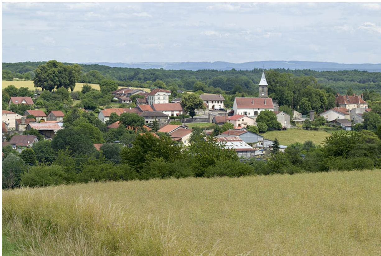
Le village dans son paysage vu depuis l'ouest.