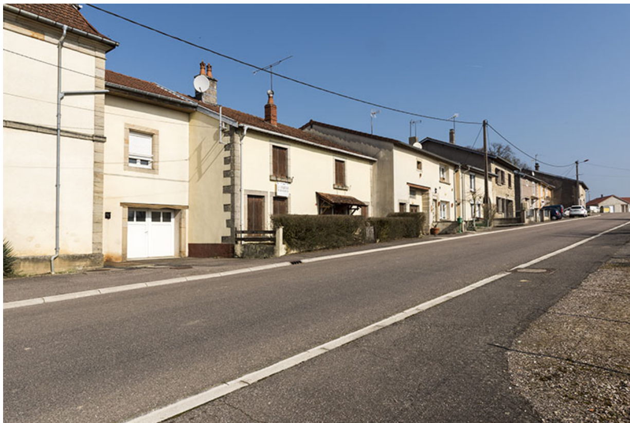
Alignement de la rue de la Corvée.