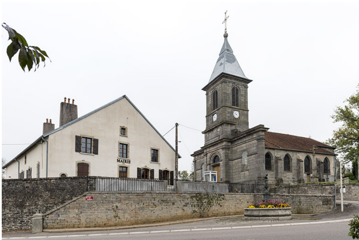
Mairie, fontaine, Marianne et église paroissiale. 70, Vougécourt