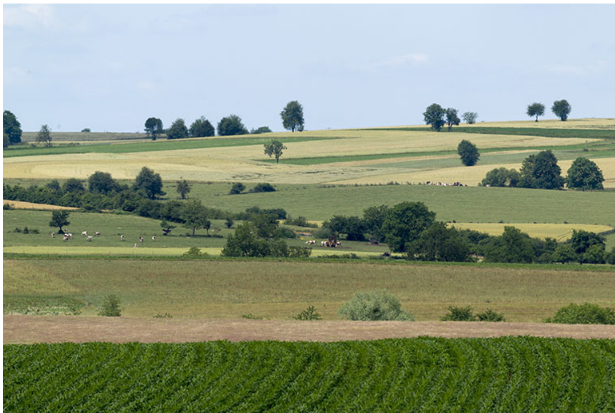
Paysage : regard vers le nord, vu de la route de Montcourt. 70, Vougécourt