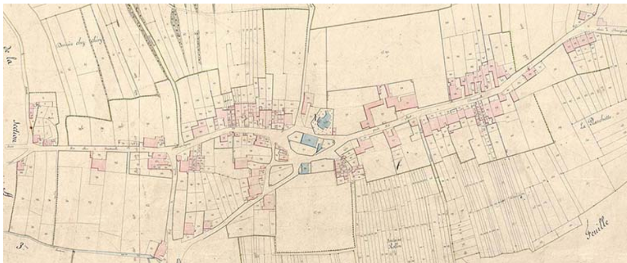
Extrait du cadastre napoléonien levé en 1822 : section C dite du village.