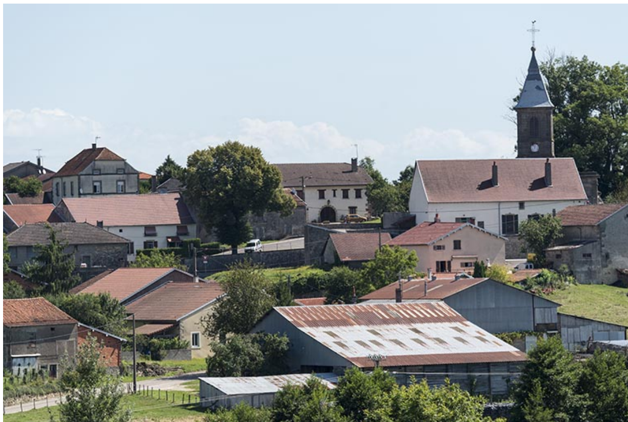
Vue d'ensemble du centre du village depuis l'ouest.