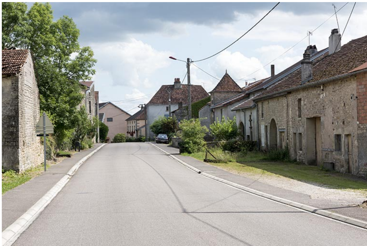
Alignement de la rue des marronniers. 70, Vougécourt