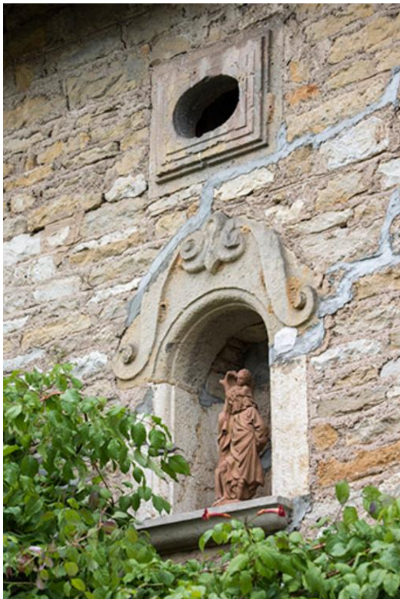
Détail de la niche en façade et de son décor