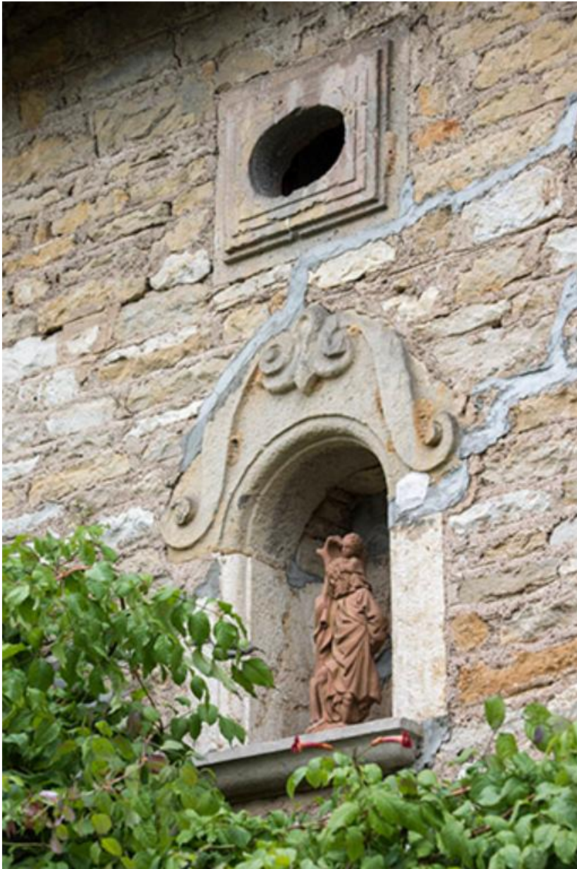
Détail de la niche en façade et de son décor