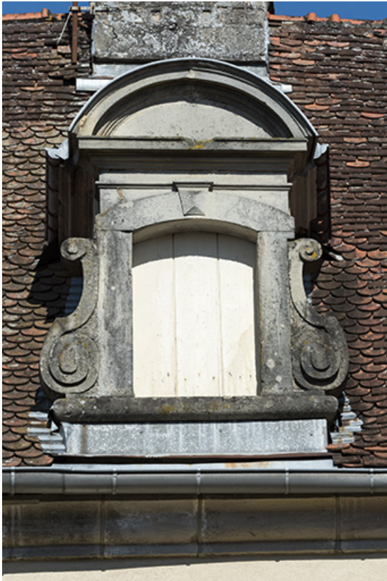
Détail d'une lucarne.