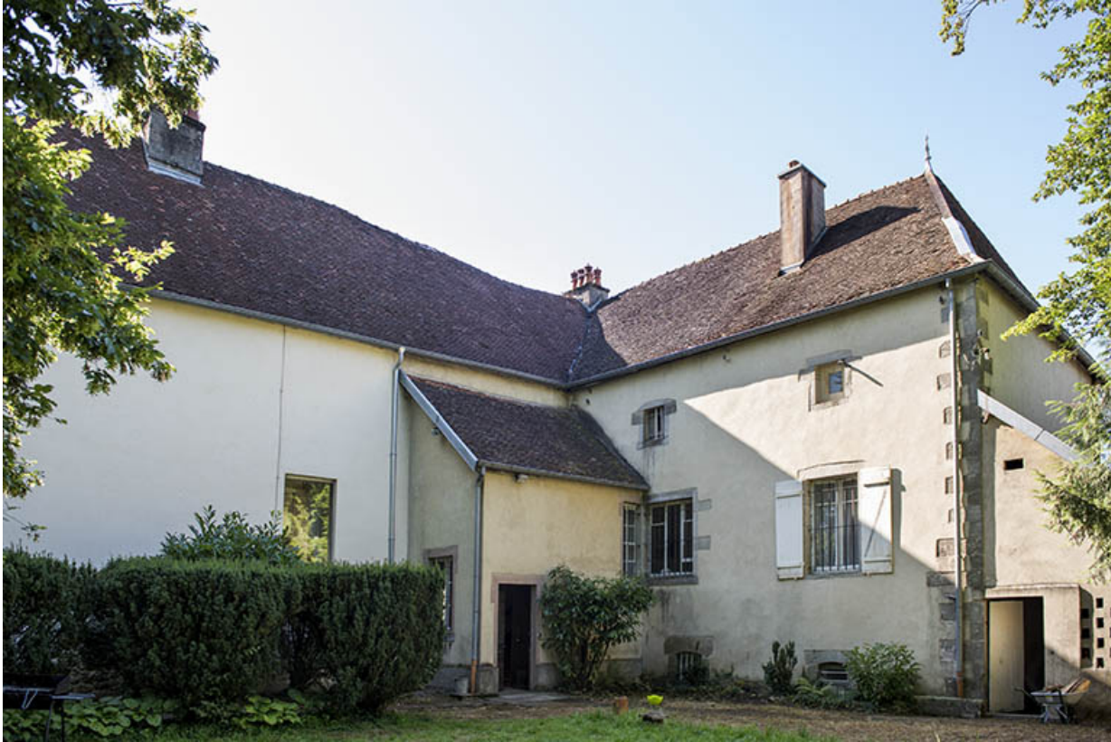
Les façades postérieures vues du nord.