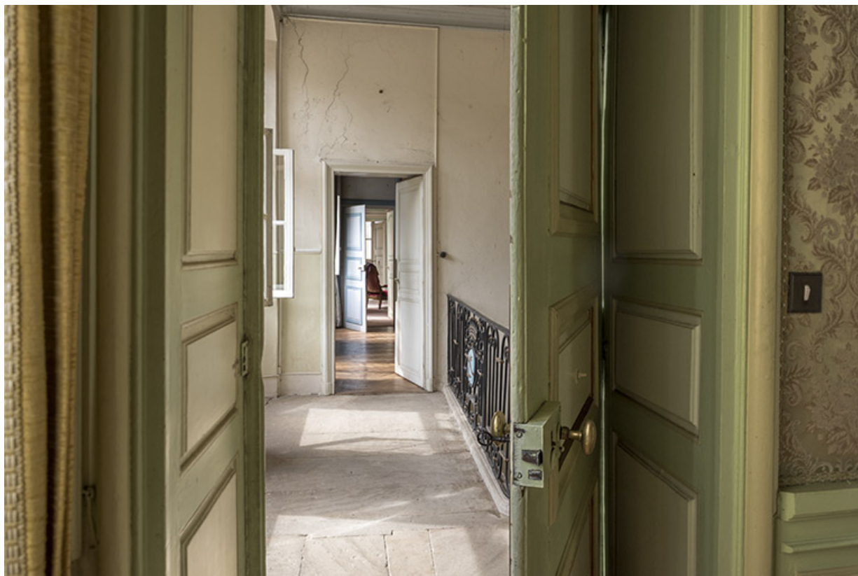
Vue sur les pièces en enfilade à l'étage.