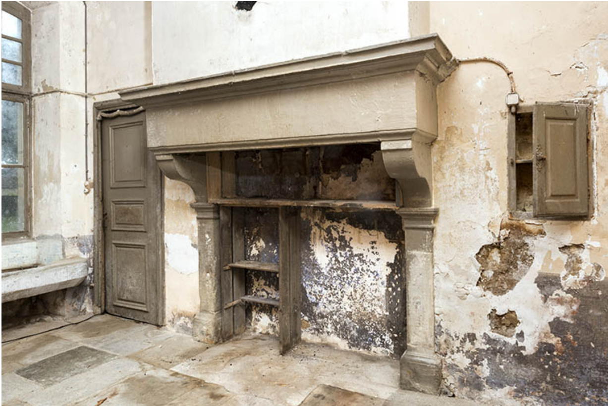
Cheminée au rez-de-chaussée. (Cuisine.)