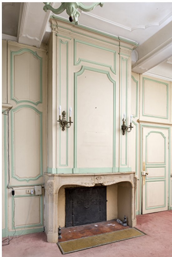
A l'étage : seconde pièce à gauche depuis l'escalier. (angle sud) 70, Vouécourt, 1 rue des Marronniers