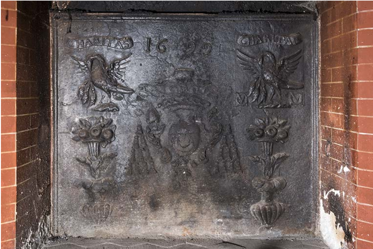
Rez-de-chaussée : première pièce à gauche de l'entrée. Plaque de cheminée. "Charitas 1699". 70, Vouécourt, 1 rue des Marronniers