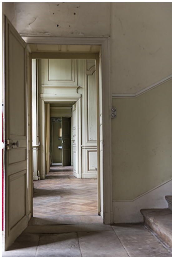
Rez-de-chaussée : vue sur les pièces en enfilade.