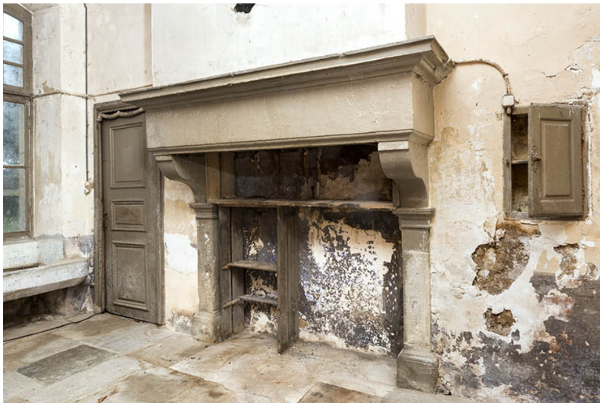
Cheminée au rez-de-chaussée. (Cuisine.)