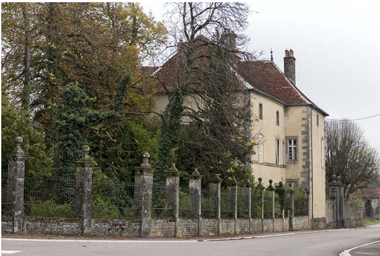
La façade sur rue et le parc vus du nord-ouest.