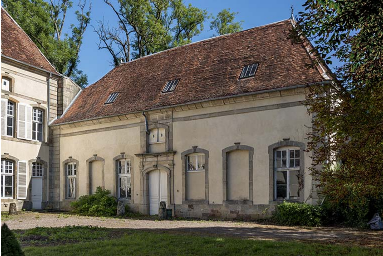
Dépendance : vue du sud de la façade antérieure.