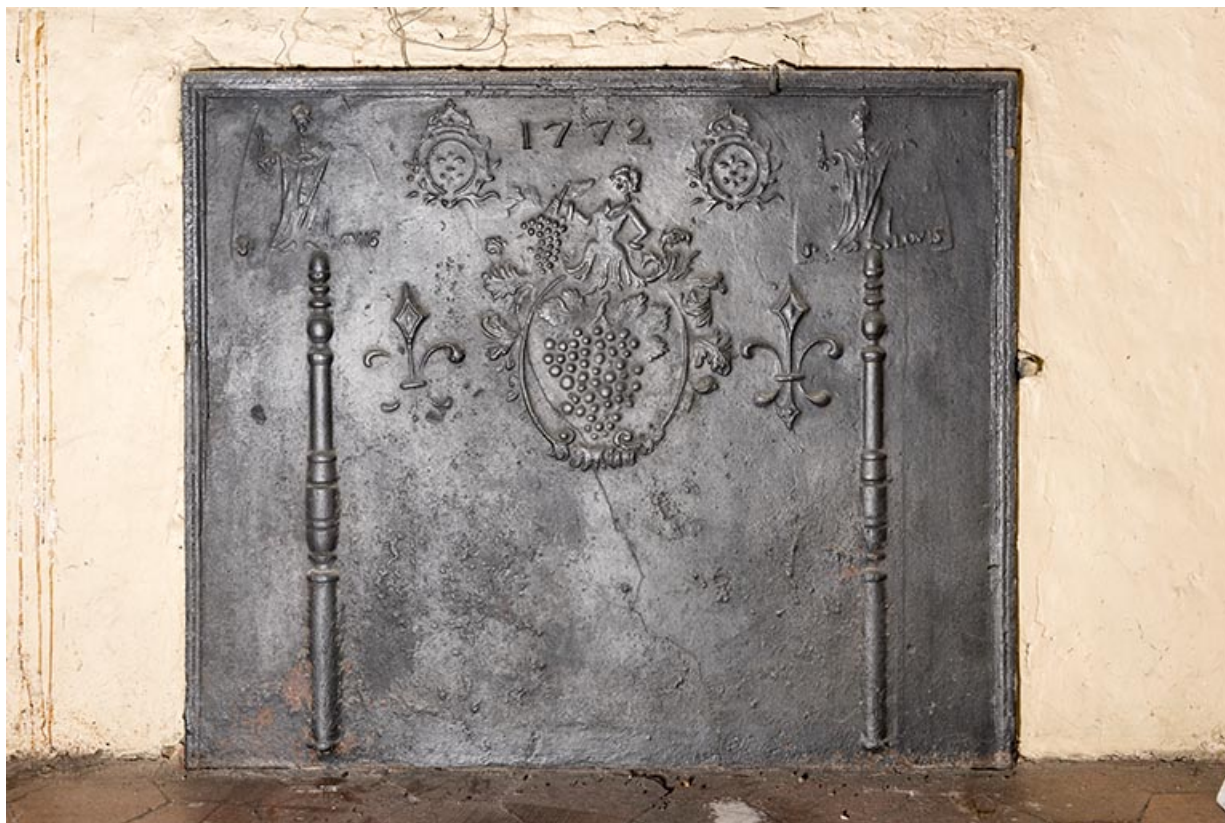
A l'étage : seconde pièce à gauche depuis l'escalier. (angle sud) Plaque de cheminée. (1772) 70, Vougécourt, 1 rue des Marronniers