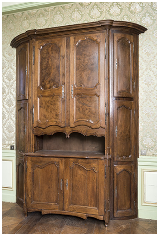
A l'étage : première pièce à droite depuis l'escalier. Armoire. 70, Vouécourt, 1 rue des Marronniers