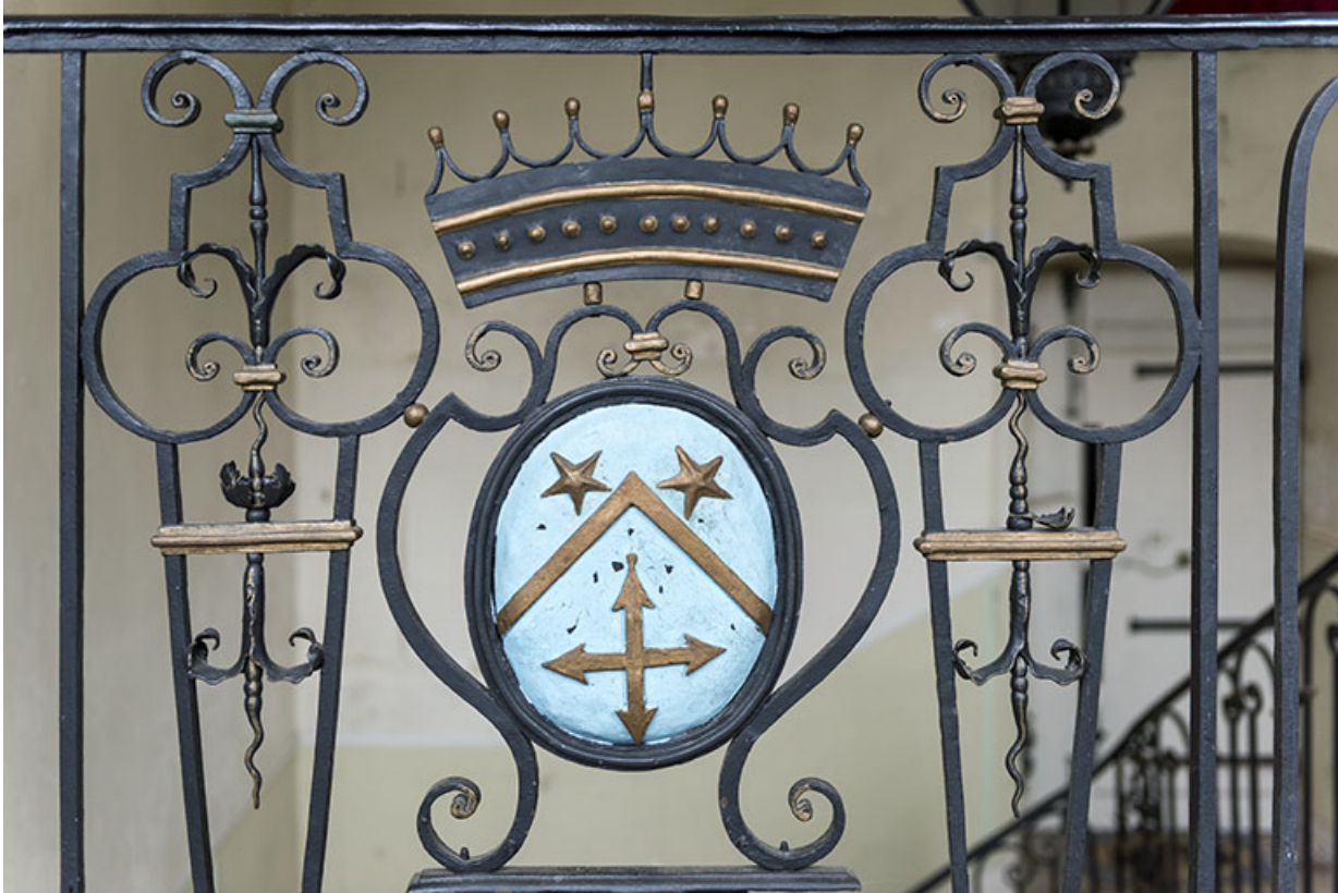
Blason des Simonet sur la rampe d'appui en ferronnerie de l'escalier, à l'étage. 70, Vouécourt, 1 rue des Marronniers