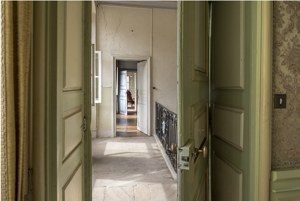
Vue sur les pièces en enfilade à l'étage.