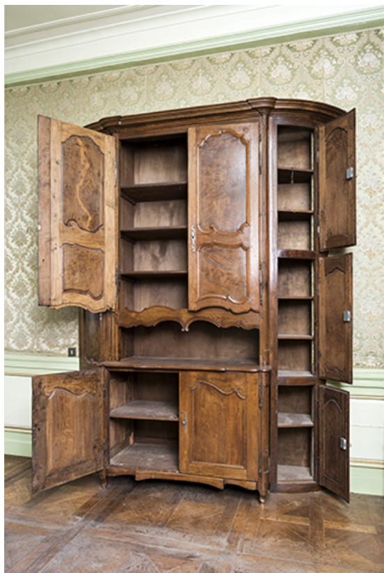
A l'étage : première pièce à droite depuis l'escalier. Armoire vue ouverte. 70, Vougécourt, 1 rue des Marronniers