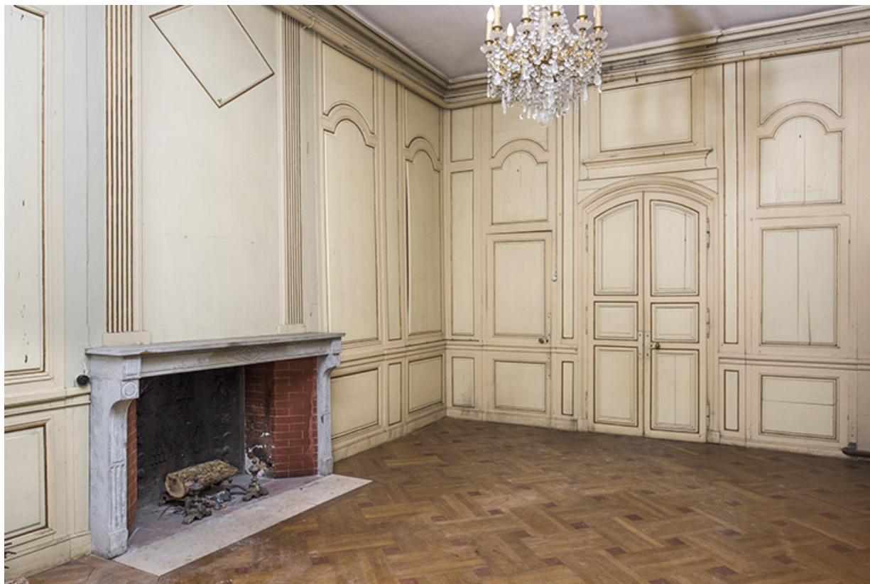
Rez-de-chaussée : première pièce à gauche de l'entrée.