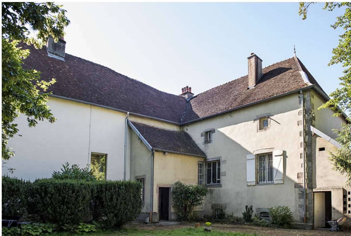
Les façades postérieures vues du nord.