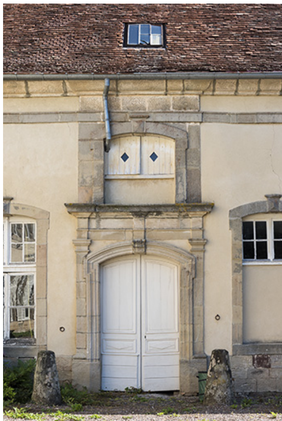
Dépendance : vue de détail de la porte sur cour. 70, Vouécourt, 1 rue des Marronniers