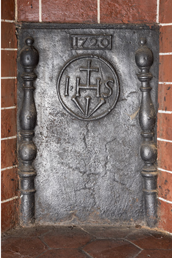
A l'étage, pièce le long de la rue, au sud. Plaque de cheminée. (1720) 70, Vouécourt, 1 rue des Marronniers