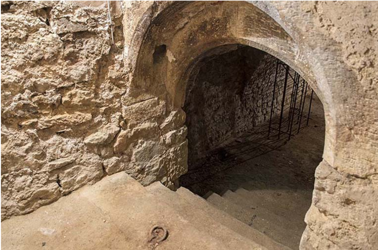
Détail de la descente de cave.