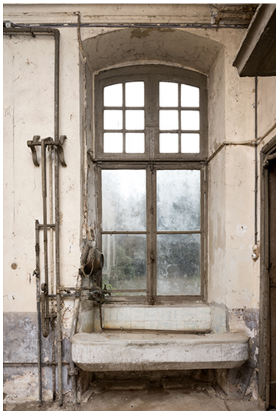
Rez de chaussée, cuisine, pierre d'évier.