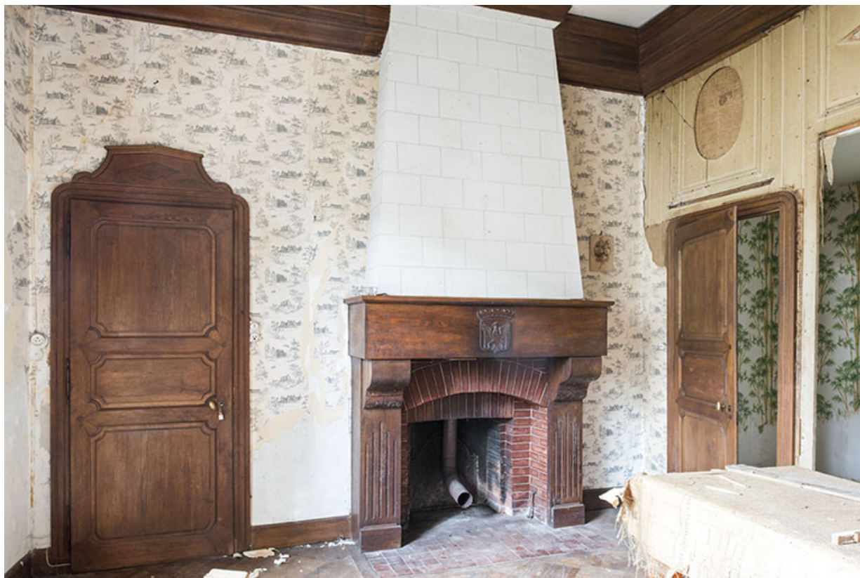
Rez-de-chaussée : pièce le long de la rue, au sud. 70, Vougécourt, 1 rue des Marronniers