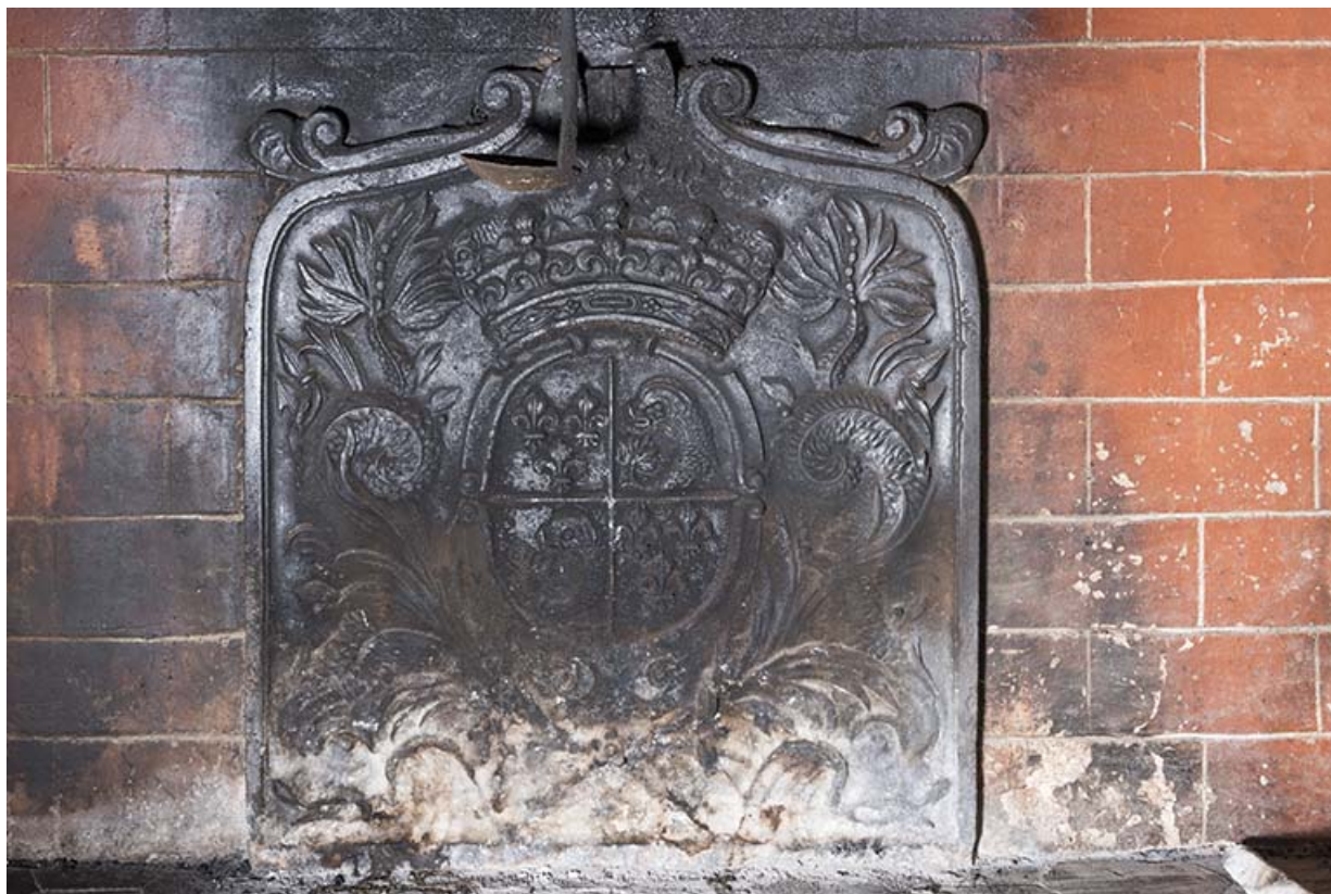
A l'étage : seconde pièce à gauche depuis l'escalier. Plaque de cheminée. 70, Vouécourt, 1 rue des Marronniers