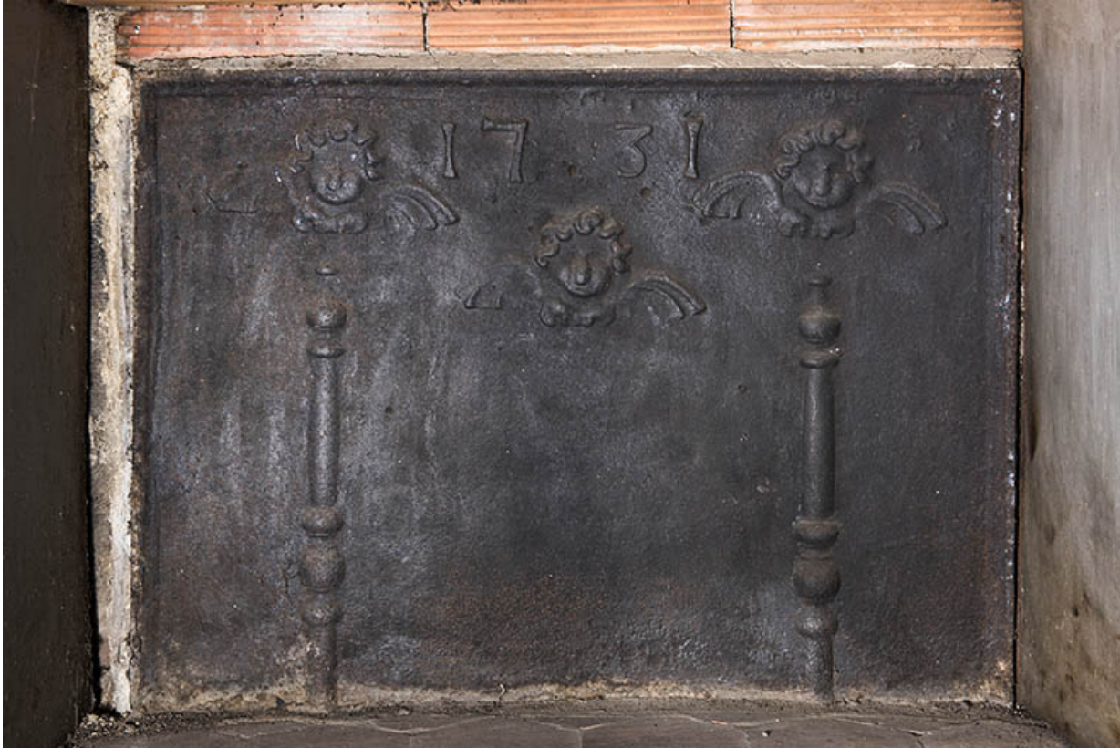
Rez-de-chaussée : deuxième pièce à gauche de l'entrée, dans l'angle sud. Plaque de cheminée. (1731) 70, Vougécourt, 1 rue des Marronniers