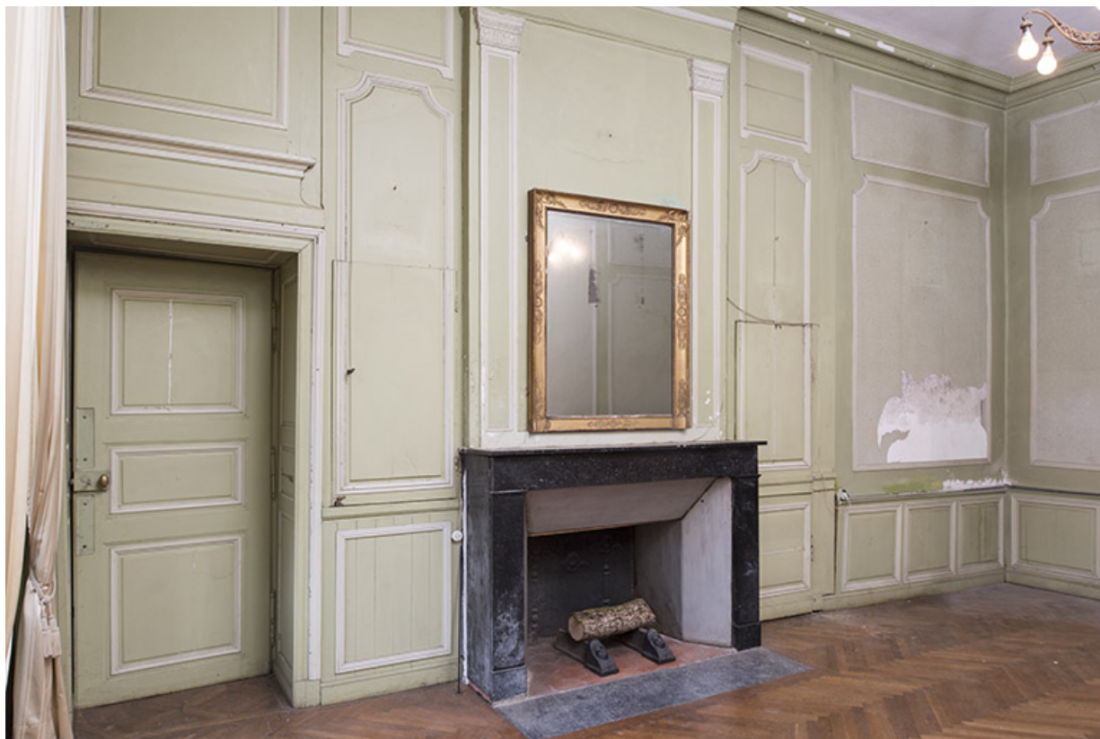
Rez-de-chaussée : deuxième pièce à gauche de l'entrée, dans l'angle sud. 70, Vougécourt, 1 rue des Marronniers