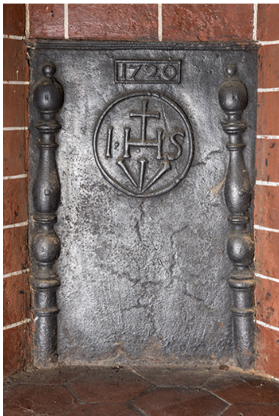
A l'étage, pièce le long de la rue, au sud. Plaque de cheminée. (1720) 70, Vougécourt, 1 rue des Marronniers