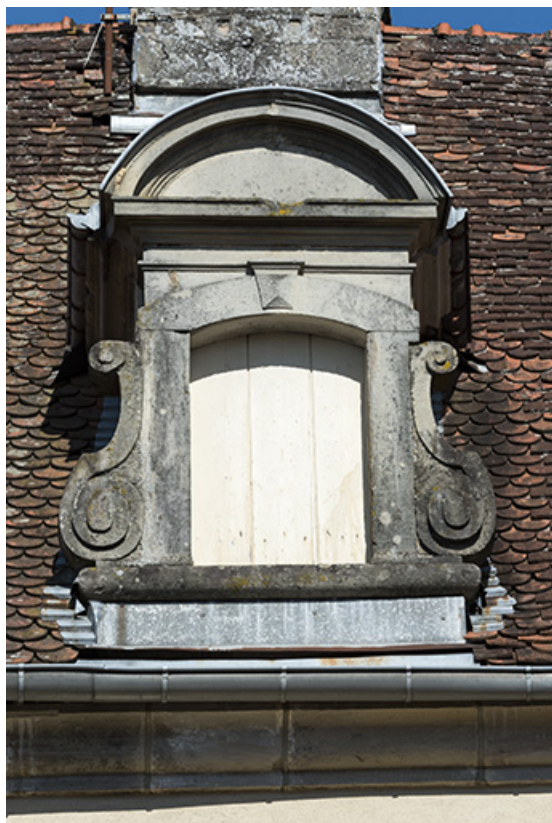
Détail d'une lucarne.