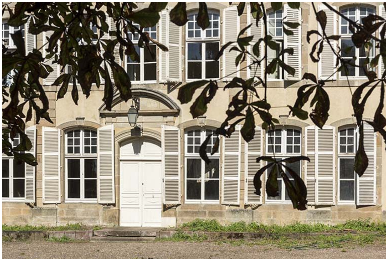
Façade antérieure : vue rapprochée. 70, Vougécourt, 1 rue des Marronniers