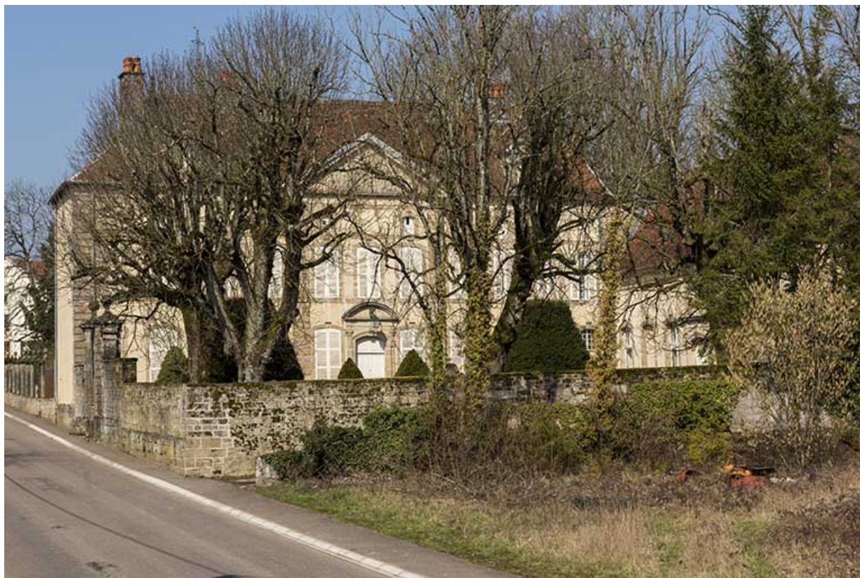
La façade antérieure et le parc vus de la rue, au sud-est.