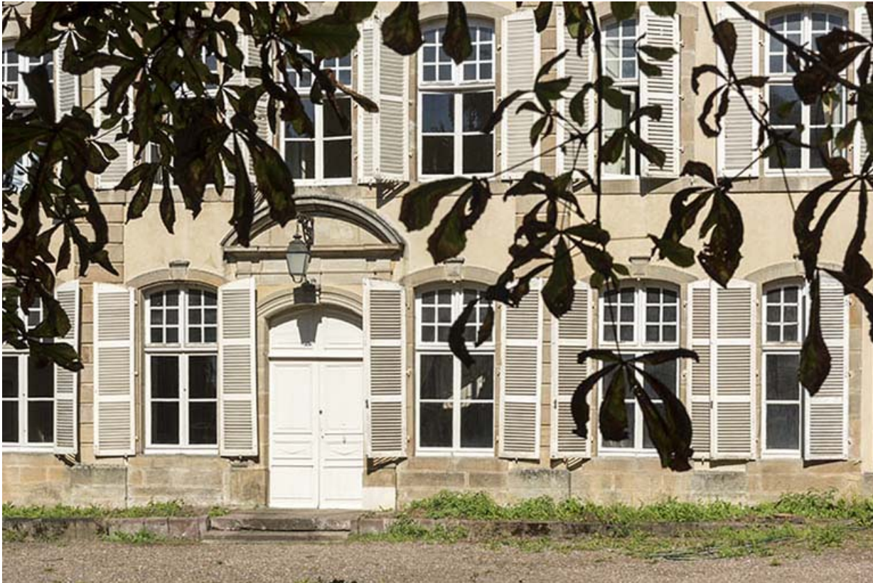
Façade antérieure : vue rapprochée.