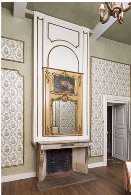
A l'étage, seconde pièce le long de la rue, au sud. 70, Vougécourt, 1 rue des Marronniers