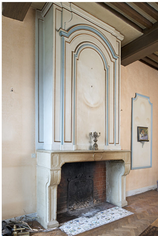
A l'étage : seconde pièce à gauche depuis l'escalier. 70, Vouécourt, 1 rue des Marronniers