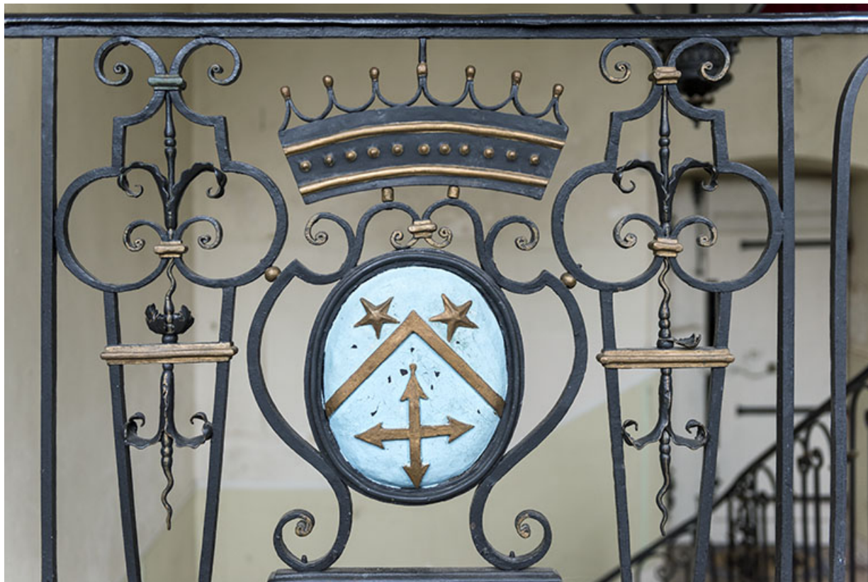
Blason des Simonet sur la rampe d'appui en ferronnerie de l'escalier, à l'étage. 70, Vougécourt, 1 rue des Marronniers