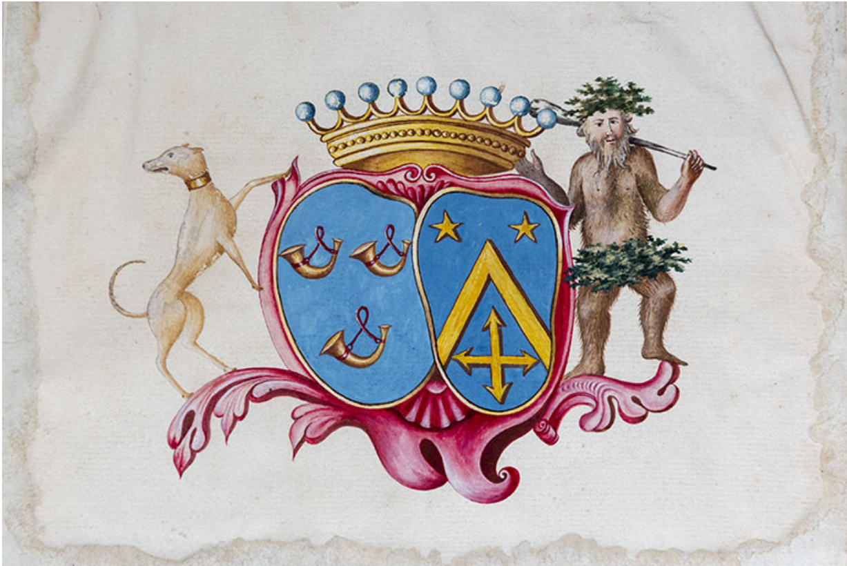
Blason des Simonet et des Tricornot sur le livre d'arpentement des fonds de la seigneurie. (1778) Détail. 70, Vougécourt, 1 rue des Marronniers