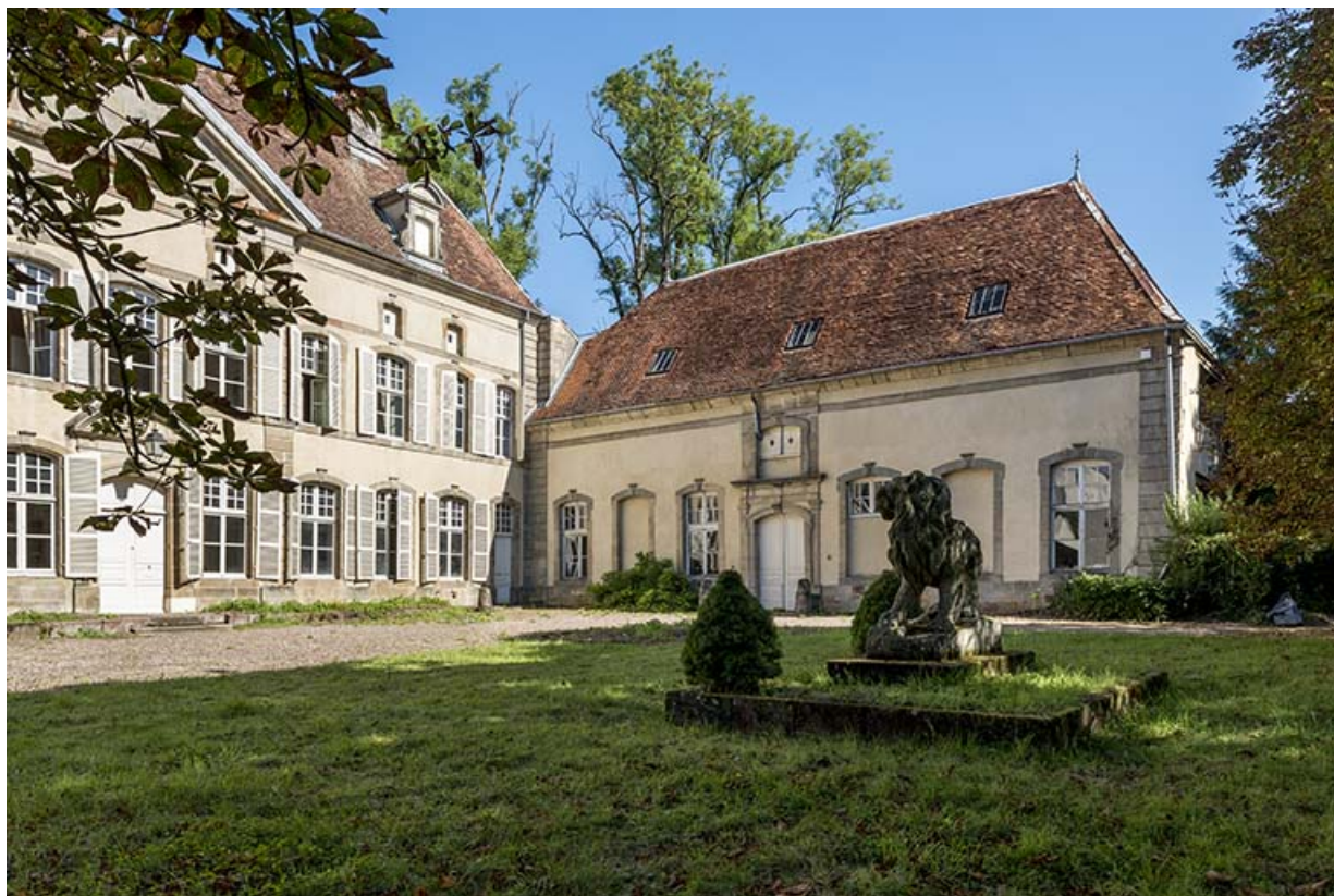
Façades antérieures du château et de la dépendance vues du sud.