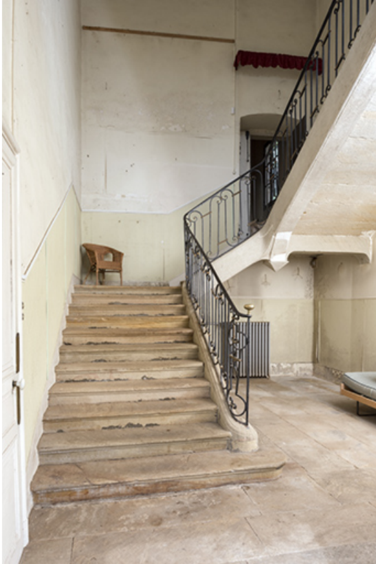
Vue de trois-quart de l'escalier principal.