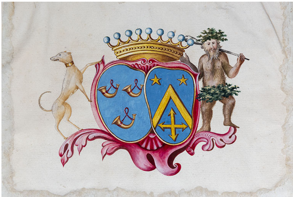
Blason des Simonet et des Tricornot sur le livre d'arpentement des fonds de la seigneurie. (1778) Détail. 70, Vougécourt, 1 rue des Marronniers