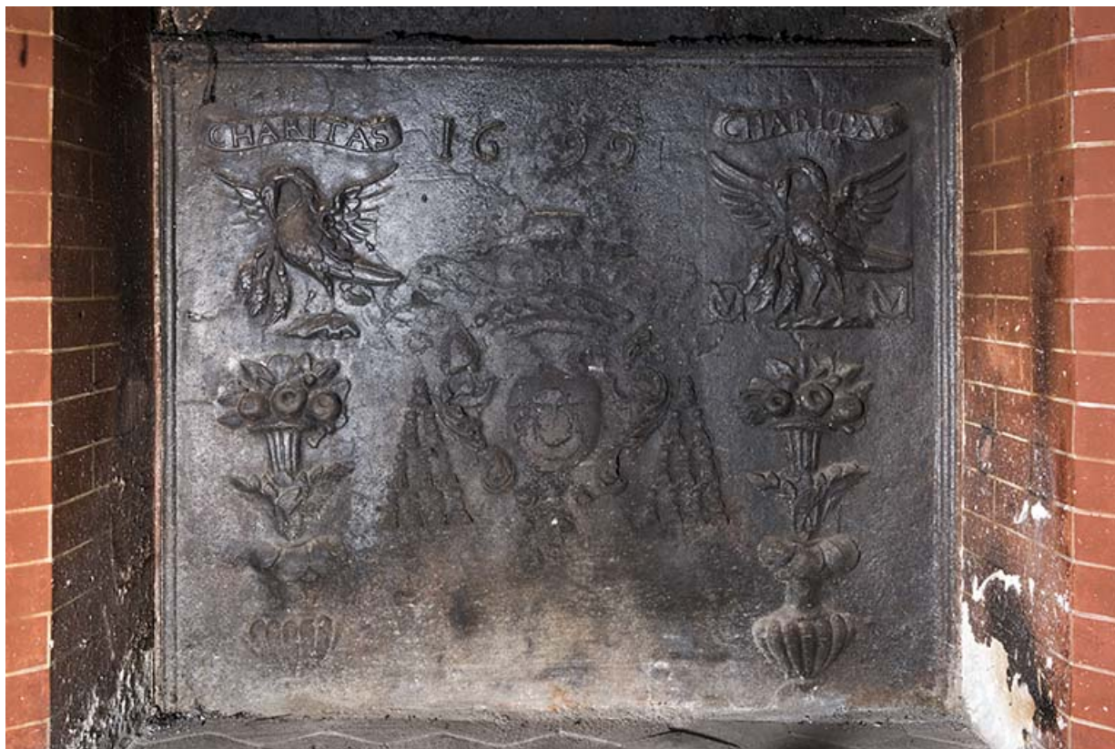
Rez-de-chaussée : première pièce à gauche de l'entrée. Plaque de cheminée. "Charitas 1699". 70, Vougécourt, 1 rue des Marronniers