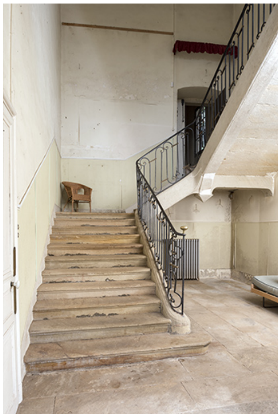
Vue de trois-quart de l'escalier principal.