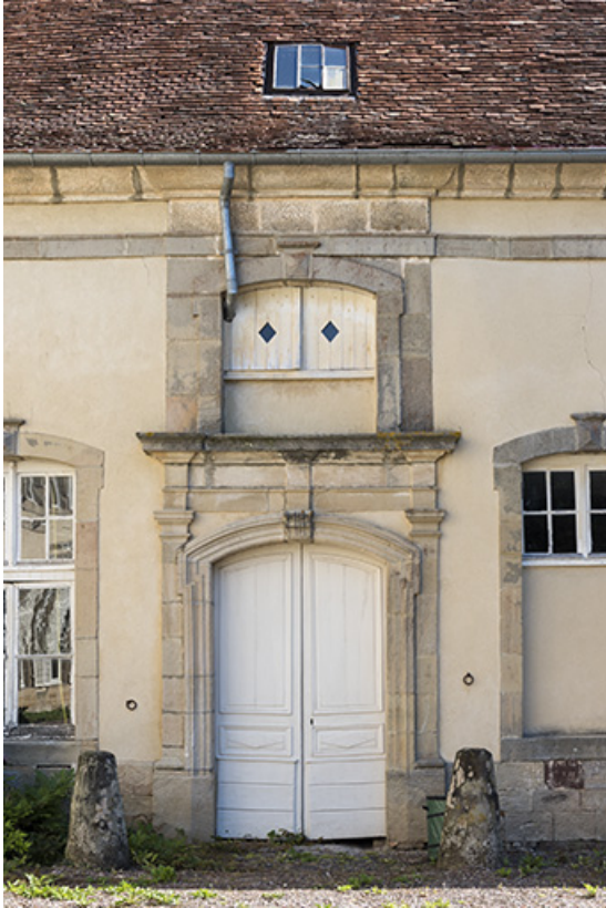
Dépendance : vue de détail de la porte sur cour.