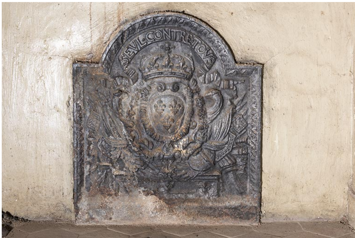
A l'étage : seconde pièce à droite depuis l'escalier. Plaque de cheminée. "Seul contre tous." 70, Vougécourt, 1 rue des Marronniers