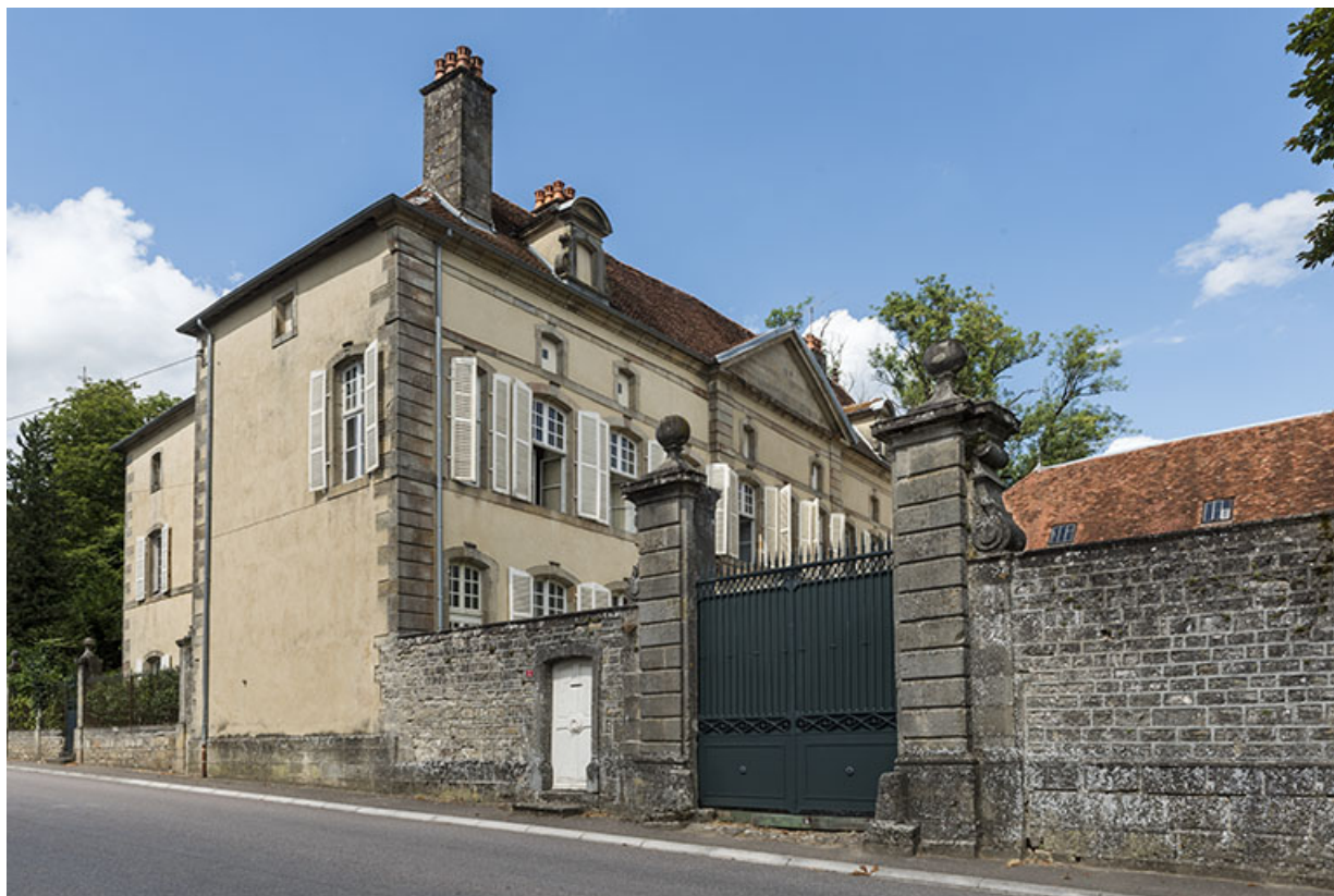
La façade antérieure vue de trois-quart de la rue, du sud.