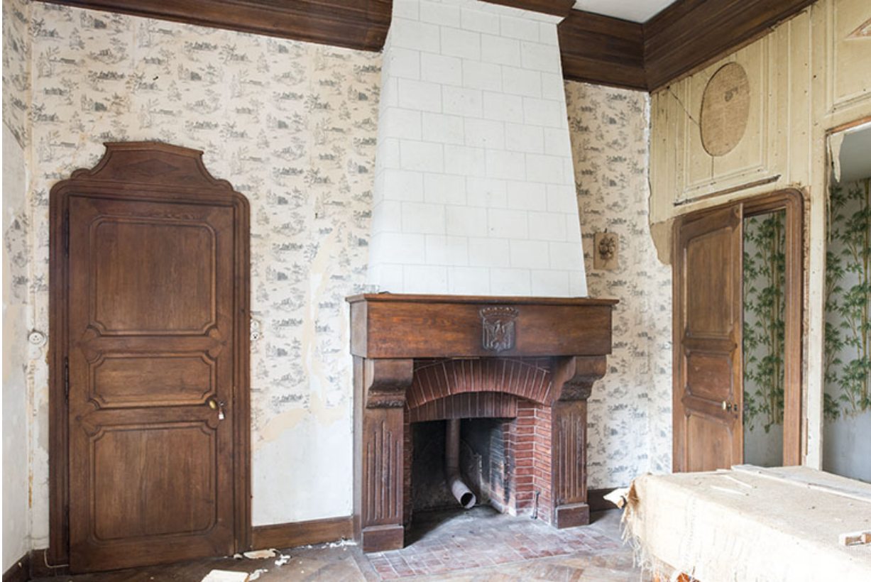
Rez-de-chaussée : pièce le long de la rue, au sud.