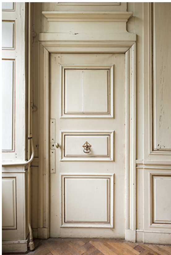
Rez-de-chaussée : première pièce à gauche de l'entrée. Détail de baie et lambris de revêtement. 70, Vouécourt, 1 rue des Marronniers