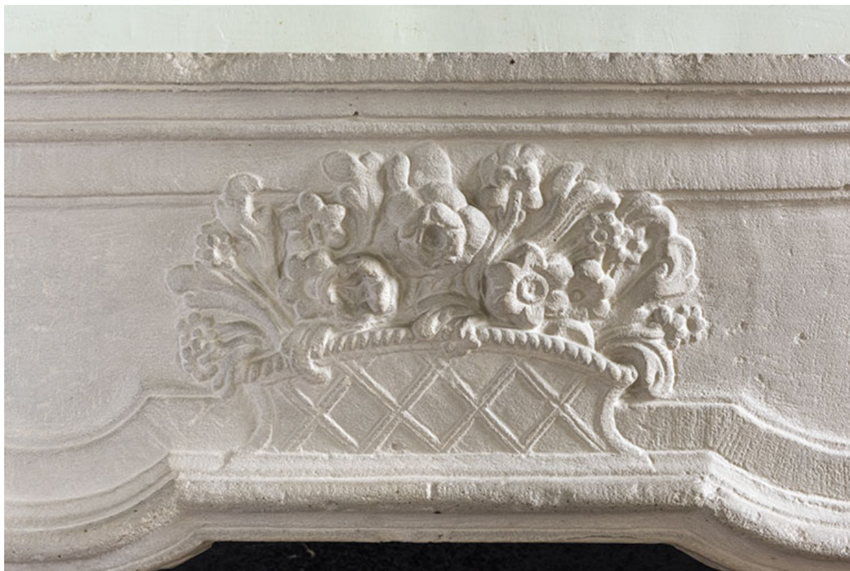
A l'étage : première pièce à droite depuis l'escalier. Détail du manteau de cheminée. 70, Vougécourt, 1 rue des Marronniers