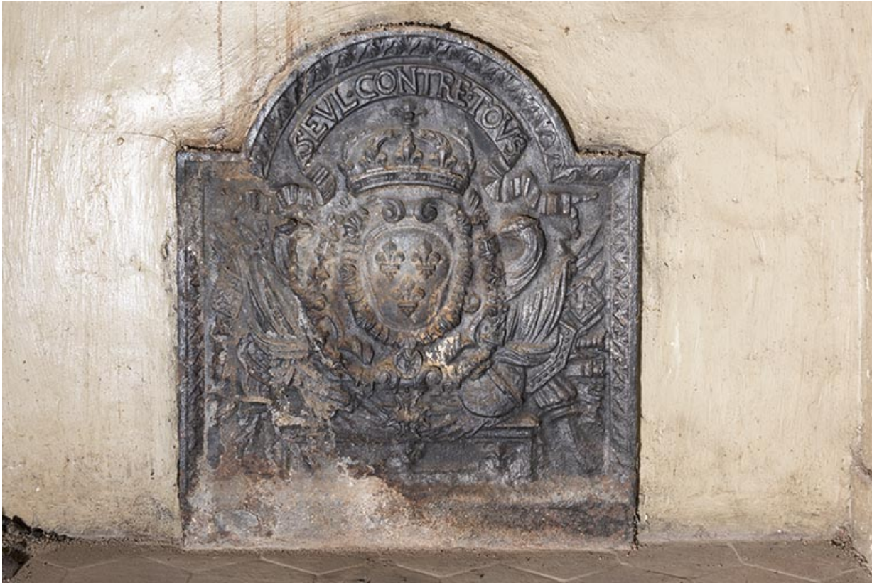
A l'étage : seconde pièce à droite depuis l'escalier. Plaque de cheminée. "Seul contre tous." 70, Vouécourt, 1 rue des Marronniers