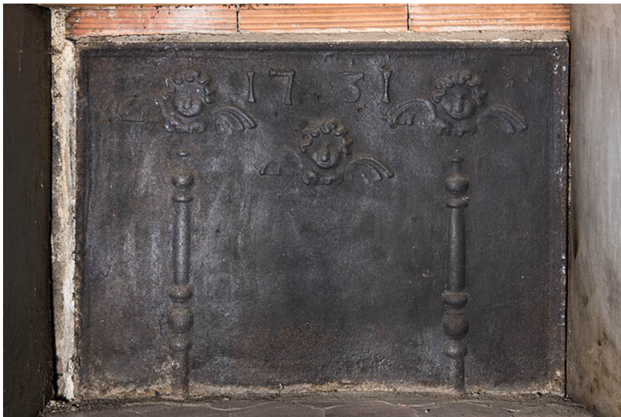
Rez-de-chaussée : deuxième pièce à gauche de l'entrée, dans l'angle sud. Plaque de cheminée. (1731) 70, Vougécourt, 1 rue des Marronniers