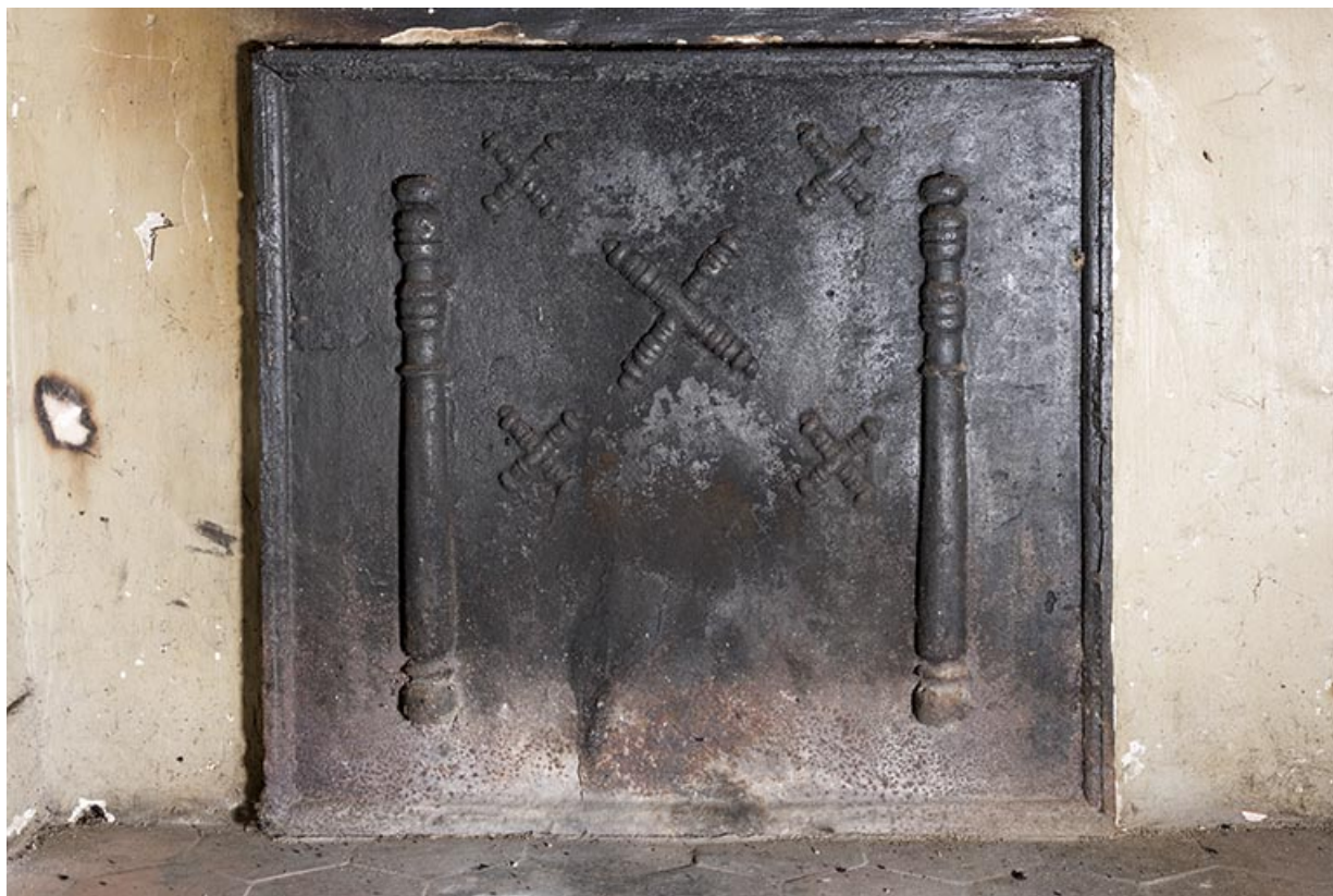
A l'étage : première pièce à droite depuis l'escalier. Plaque de cheminée. 70, Vougécourt, 1 rue des Marronniers