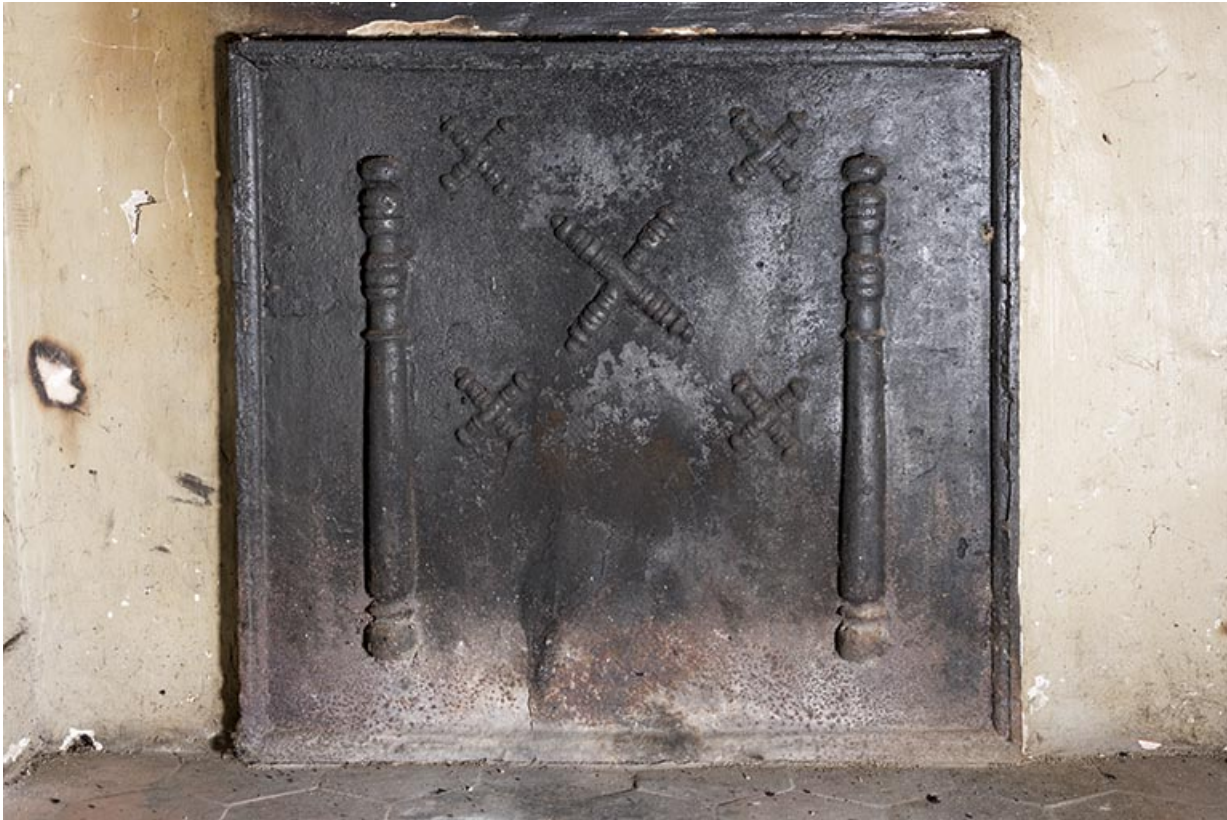
A l'étage : première pièce à droite depuis l'escalier. Plaque de cheminée. 70, Vougécourt, 1 rue des Marronniers