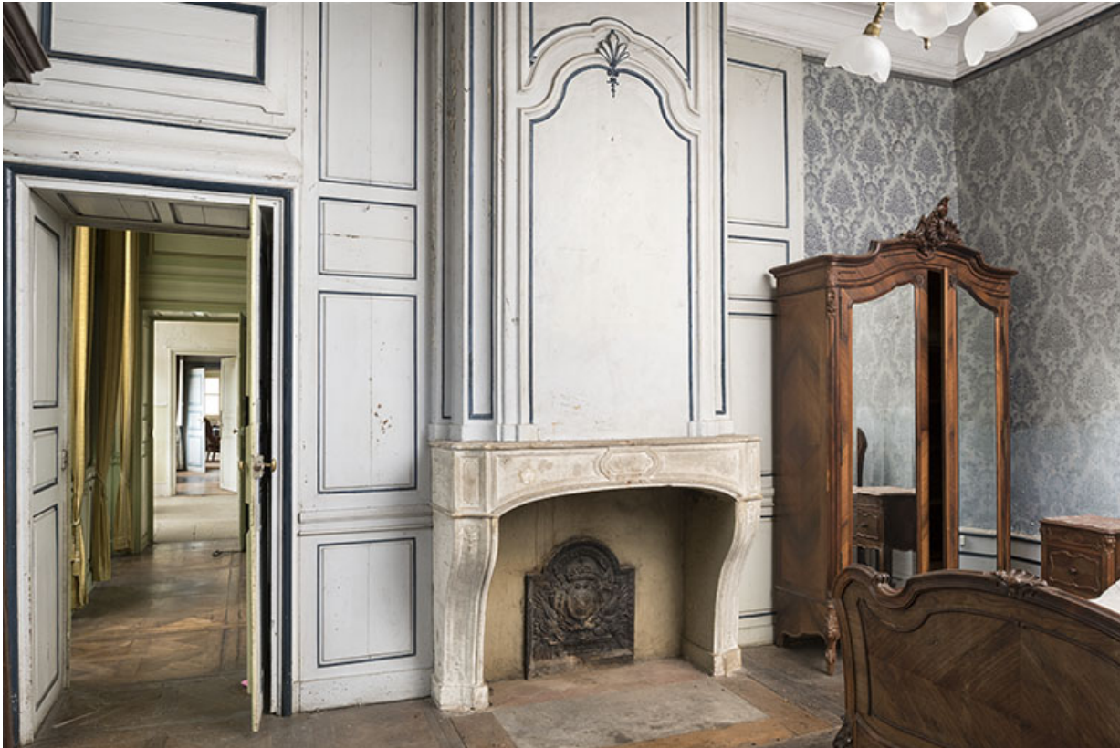
A l'étage : seconde pièce à droite depuis l'escalier.