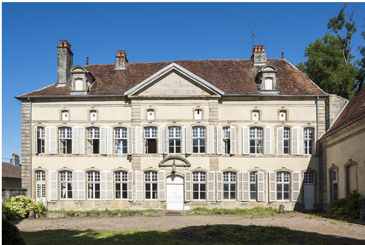
Château de Vougécourt.