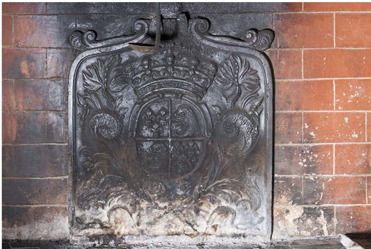
A l'étage : seconde pièce à gauche depuis l'escalier. Plaque de cheminée. 70, Vougécourt, 1 rue des Marronniers