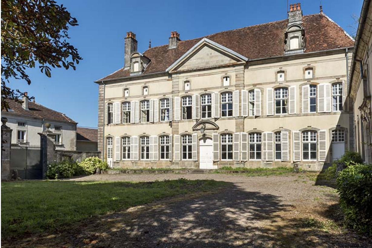
Façade principale vue de l'est.