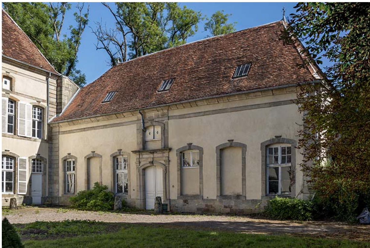
Dépendance : vue du sud de la façade antérieure.