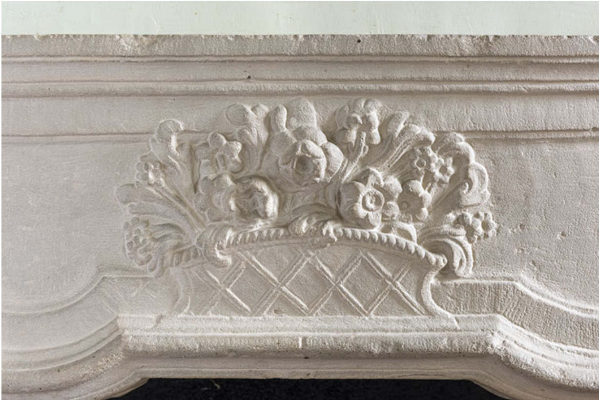
A l'étage : première pièce à droite depuis l'escalier. Détail du manteau de cheminée. 70, Vougécourt, 1 rue des Marronniers