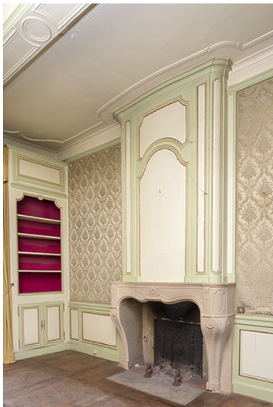
A l'étage : première pièce à droite depuis l'escalier. 70, Vouécourt, 1 rue des Marronniers