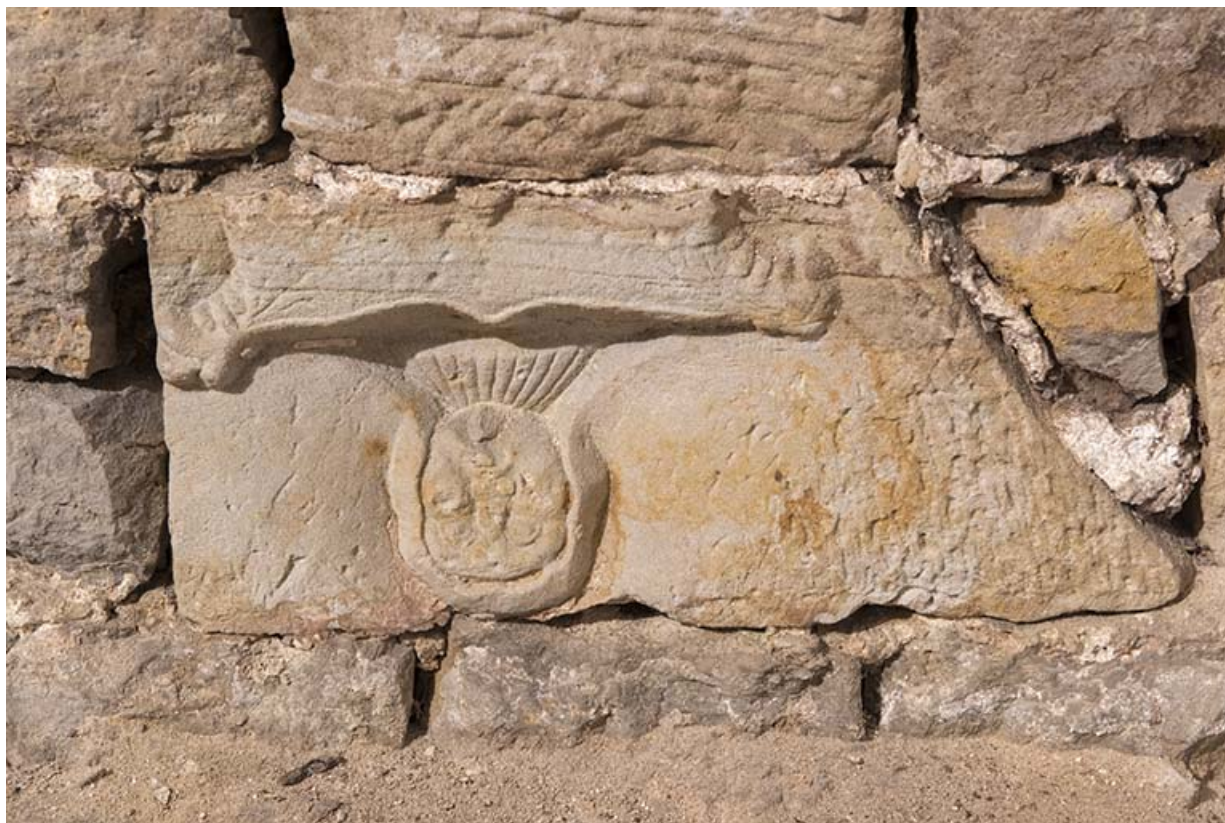
Element de bas-relief en remploi dans le sous-sol.