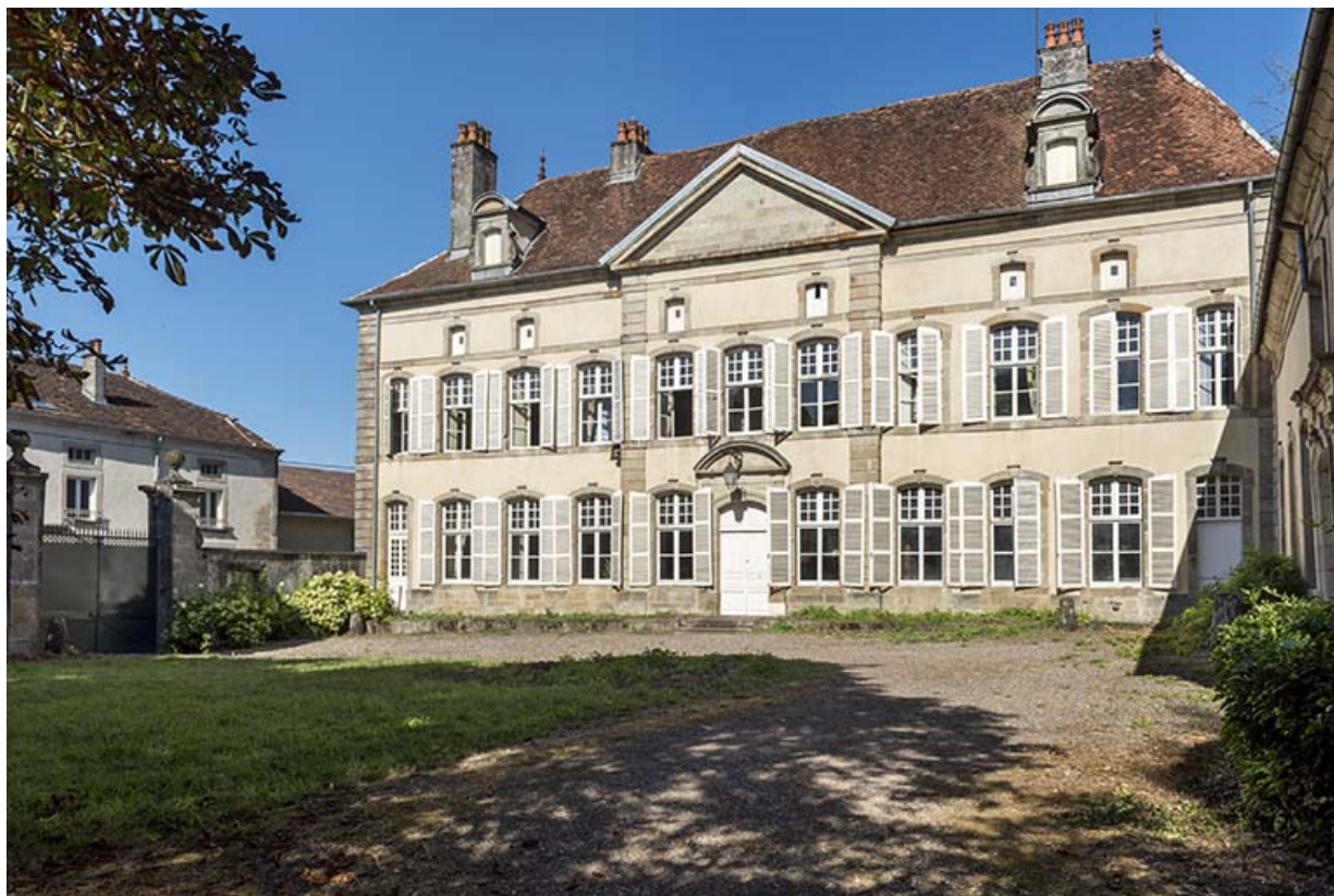
Façade principale vue de l'est.