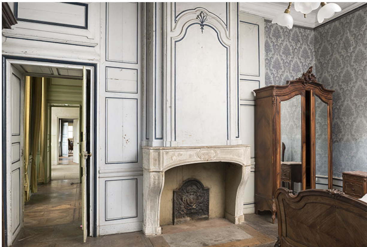
A l'étage : seconde pièce à droite depuis l'escalier. 70, Vougécourt, 1 rue des Marronniers