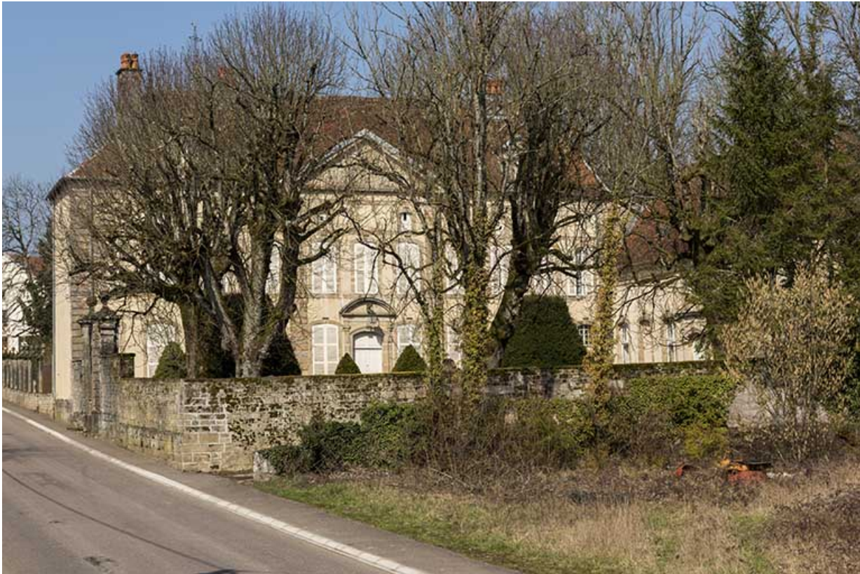
La façade antérieure et le parc vus de la rue, au sud-est.