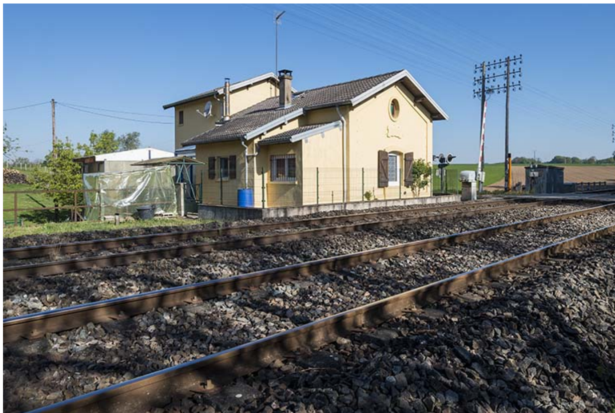
Vue depuis le Sud. 70, Chaux-lès-Port