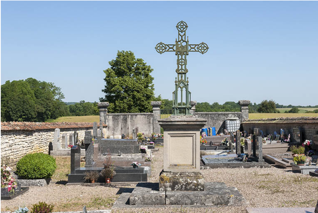
Croix au milieu du cimetière.