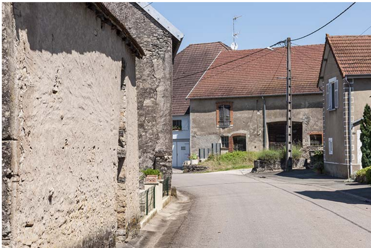
Rue Jean Emile Lotscher.