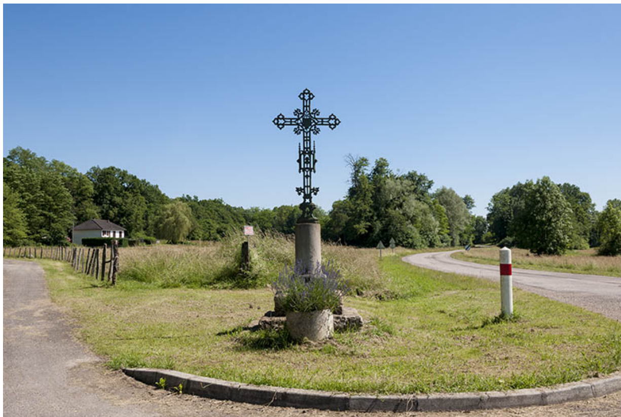
Croix de chemin. 70, Chaux-lès-Port