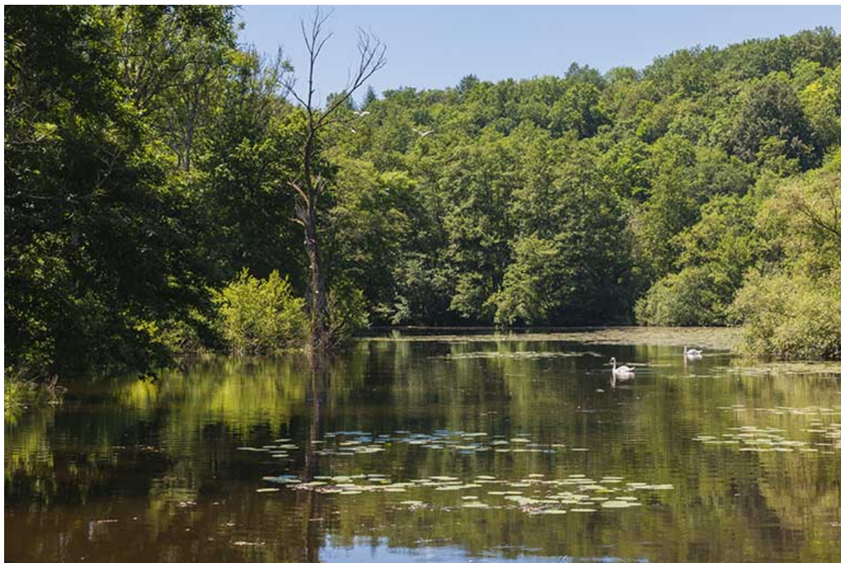
L'étang de Velotte. 70, Chaux-lès-Port