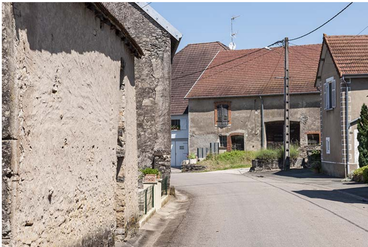
Rue Jean Emile Lotscher. 70, Chaux-lès-Port