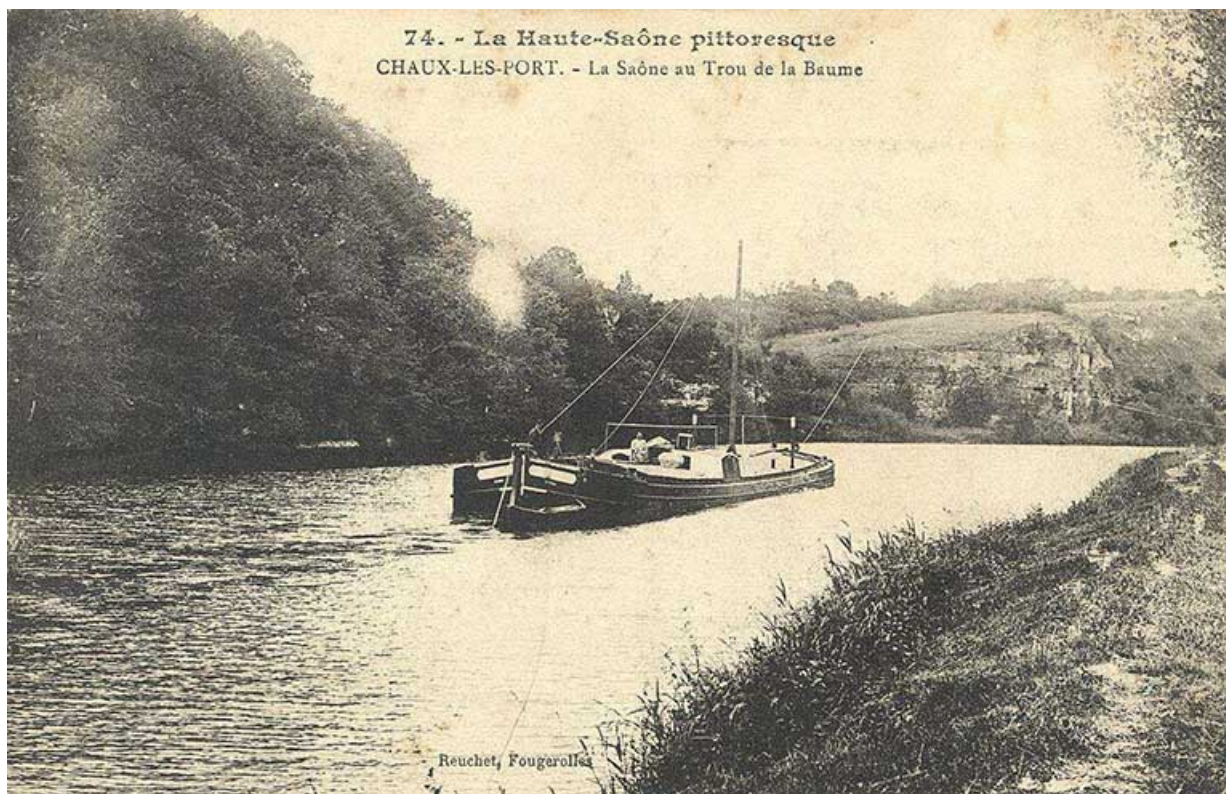
Chaux-lès-Ports - La Saône au Trou de la Baume, carte postale. 70, Chaux-lès-Port