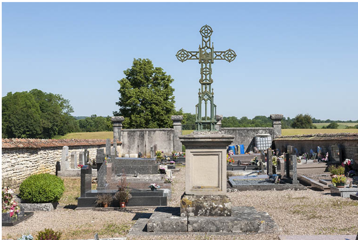
Croix au milieu du cimetière.