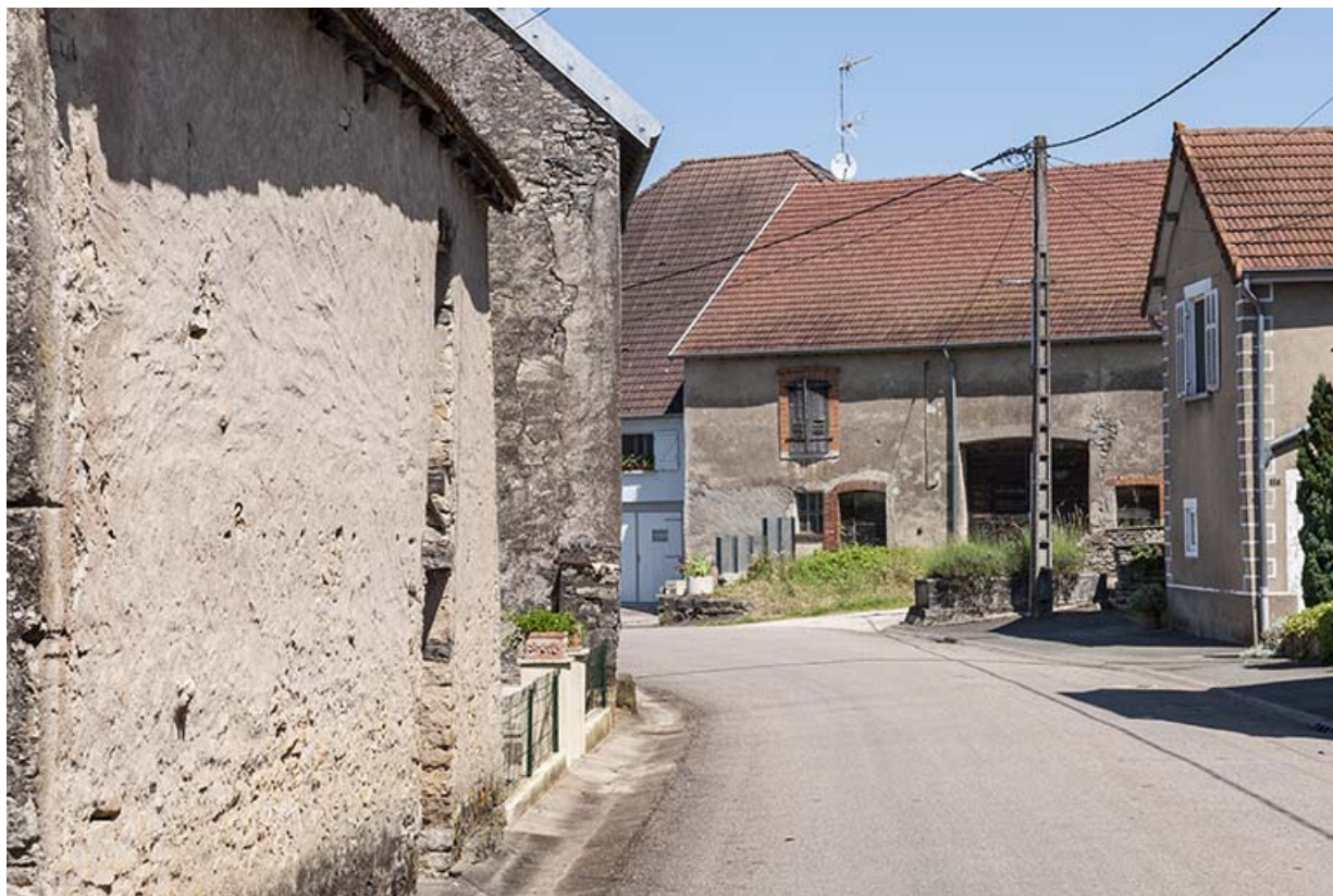
Rue Jean Emile Lotscher. 70, Chaux-lès-Port