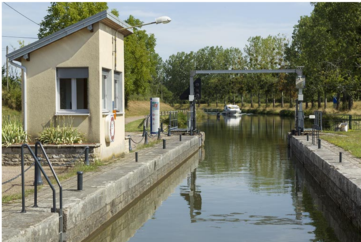
Poste de commande et un bateau montant se présentant devant le sas de l'écluse ouverte. 70, Ferrières-lès-Scey