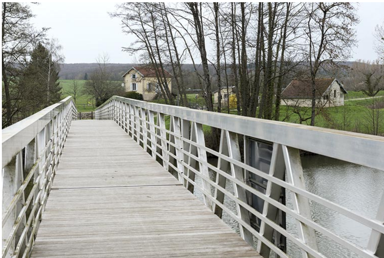
Passerelle enjambant la Saône. Vue de dessus.