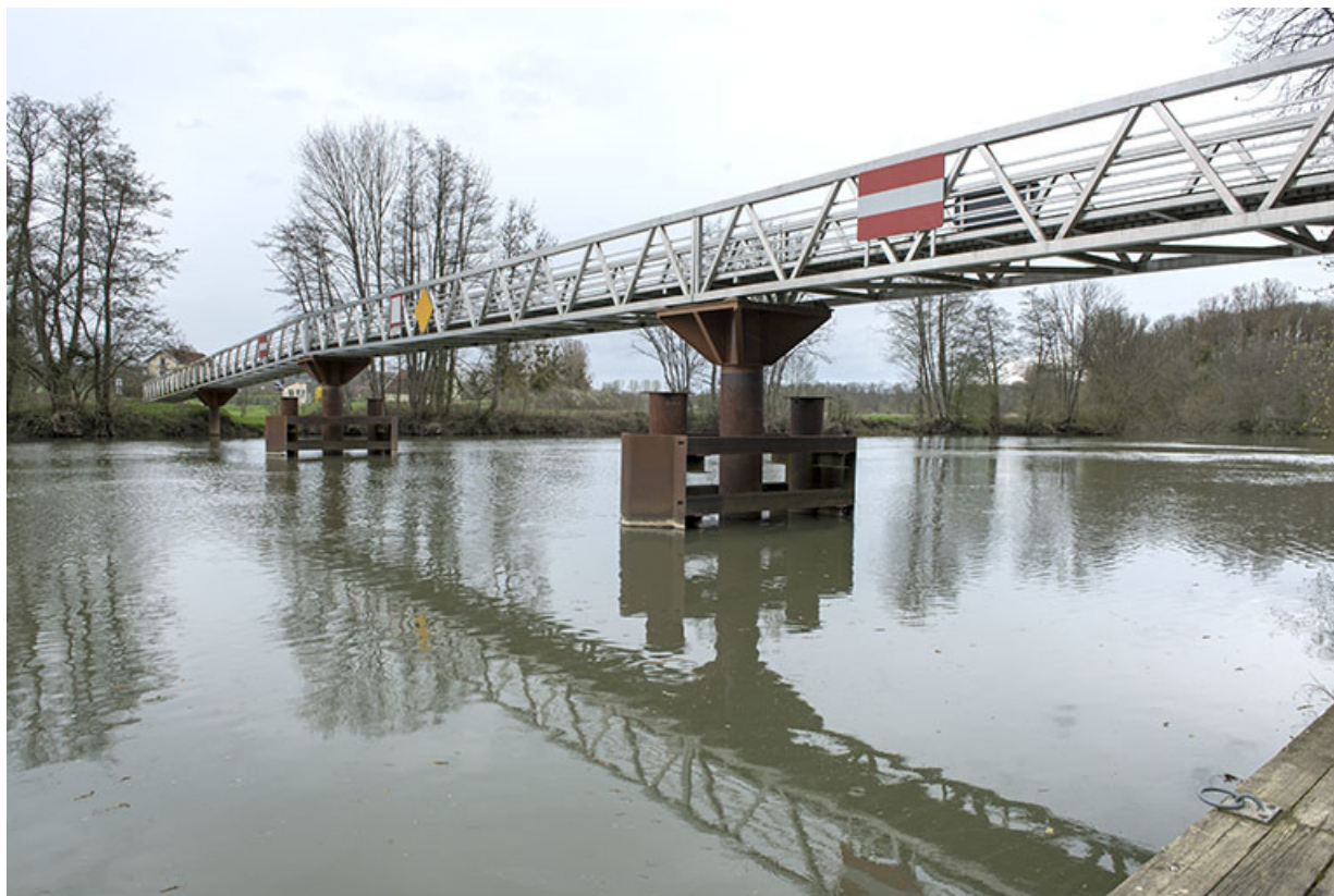
Passerelle enjambant la Saône.