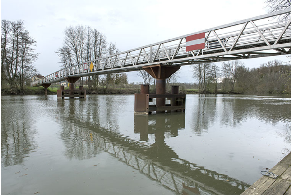
Passerelle enjambant la Saône.