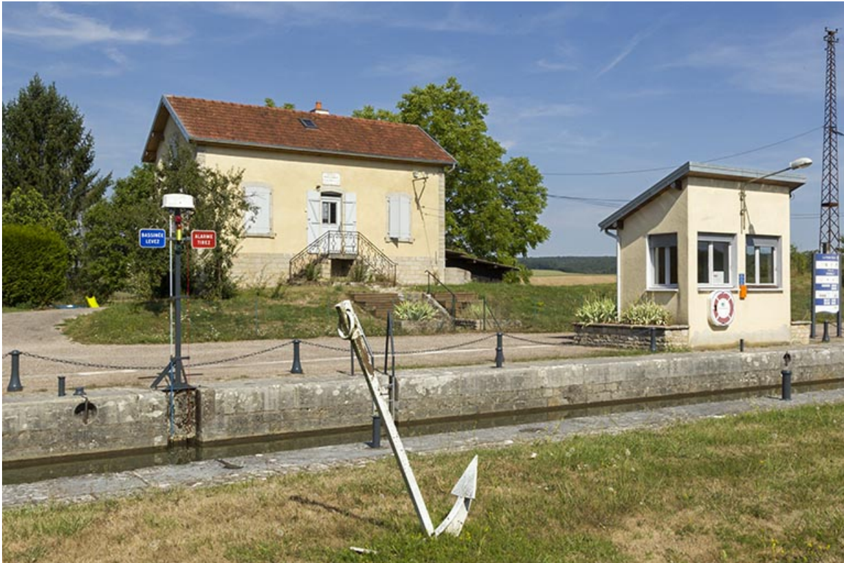
Le poste de commande et la maison d'éclusier depuis la rive gauche. 70, Ferrières-lès-Scey