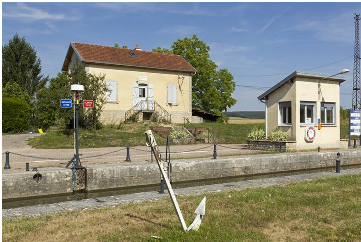
Le poste de commande et la maison d'éclusier depuis la rive gauche. 70, Ferrières-lès-Scey