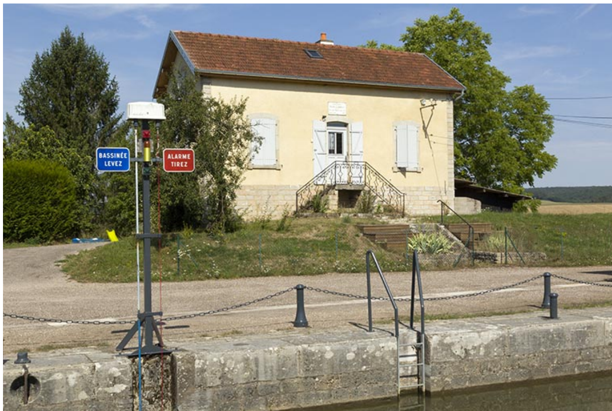
Vue de face de la maison d'éclusier.