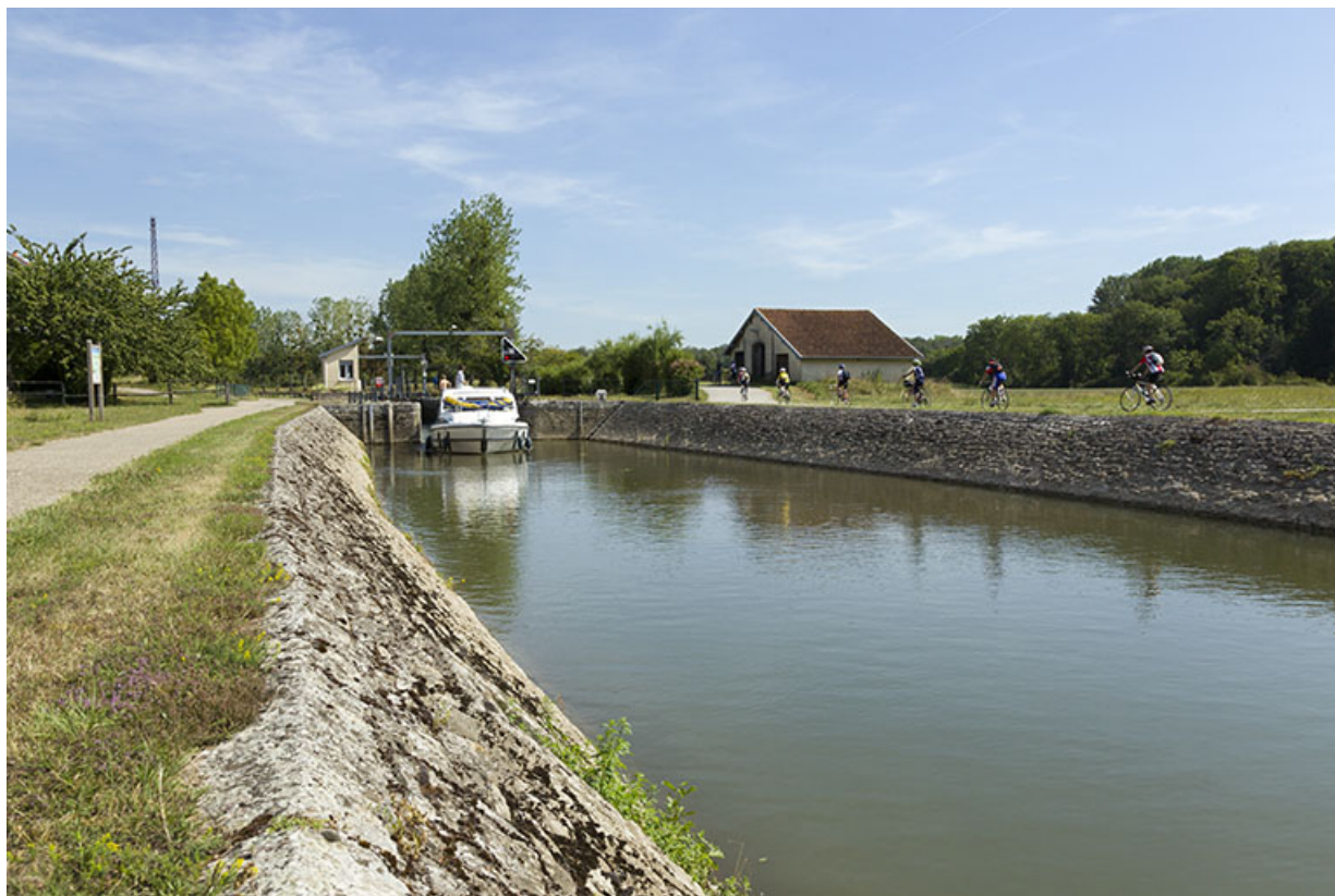
Depuis la rive droite en aval, vue sur le site d'écluse.