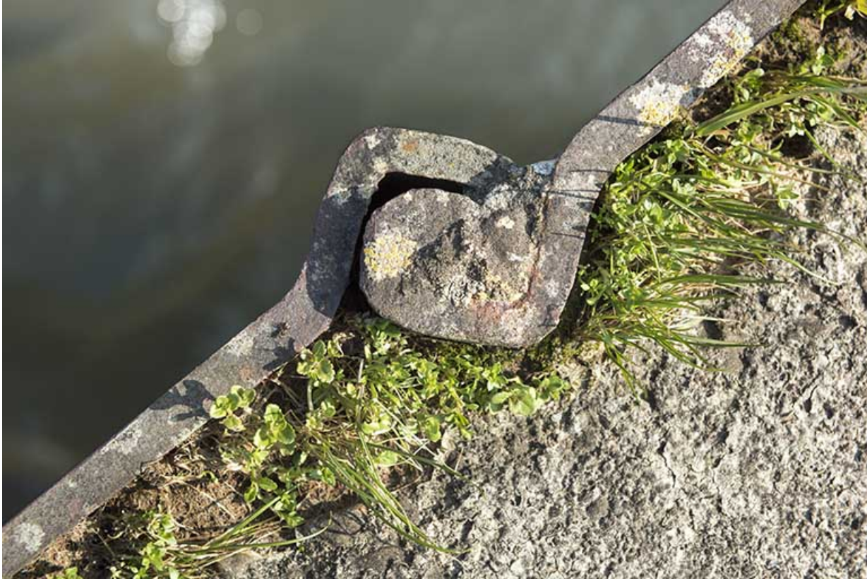
Détail d'assemblage (serrure) des palplanches en aval du barrage mobile.

70, Cendrecourt, lieudit : corne des Prés Popet Pré Popet