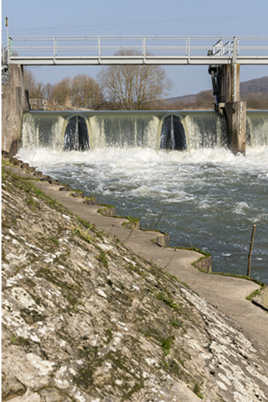
Vue de détail de la berge et du barrage depuis la rive droite en aval.

70, Cendrecourt, lieudit : corne des Prés Popet Pré Popet