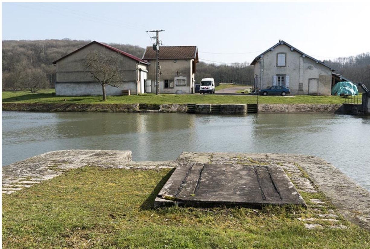
La Saône, la maison du garde et le hangar, vus de la rive droite en amont du barrage. 70, Cendrecourt, lieudit : corne des Prés Popet Pré Popet