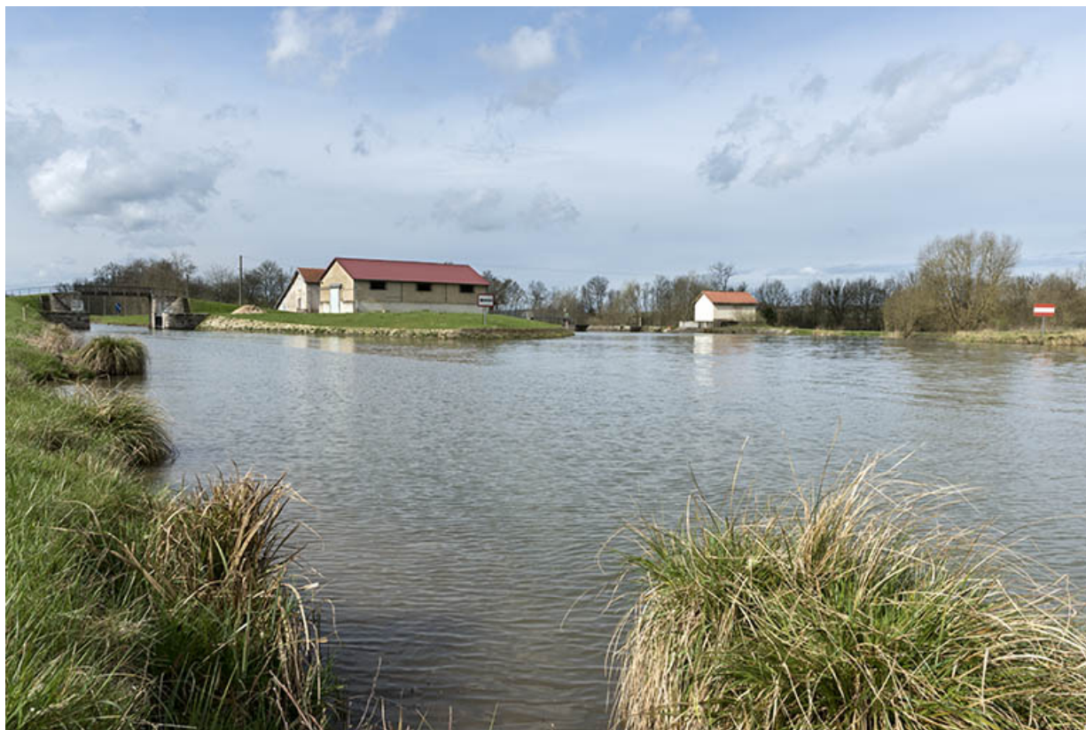
Vue d'ensemble de la porte de garde, passerelle, hangar (Voies navigables de France) et maison du garde, vues de la rive gauche en amont.

70, Cendrecourt, lieudit : corne des Prés Popet Pré Popet