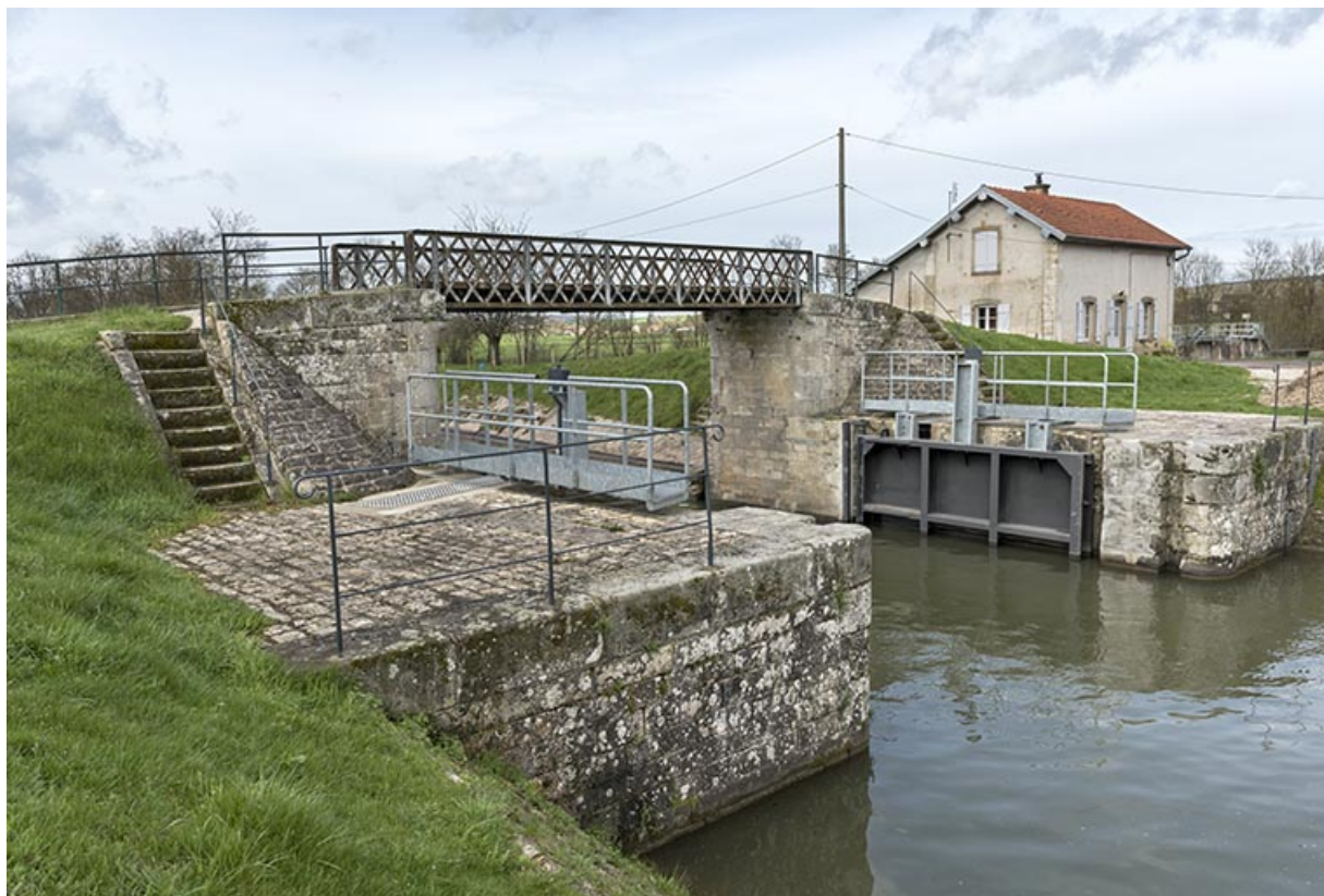
Porte de garde, passerelle et maison du garde, vues de la rive gauche en amont.