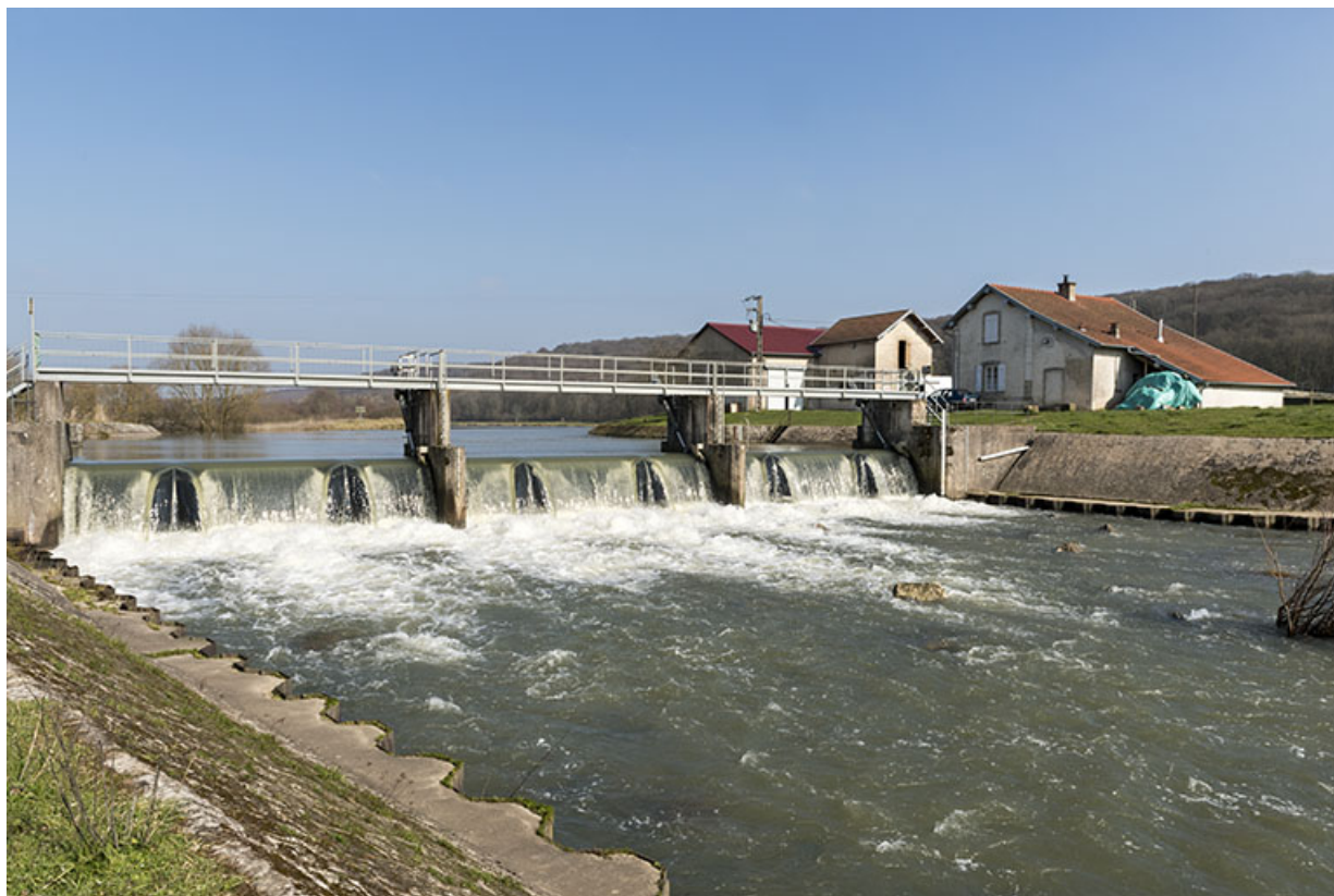
Le barrage vu de la rive droite en aval.