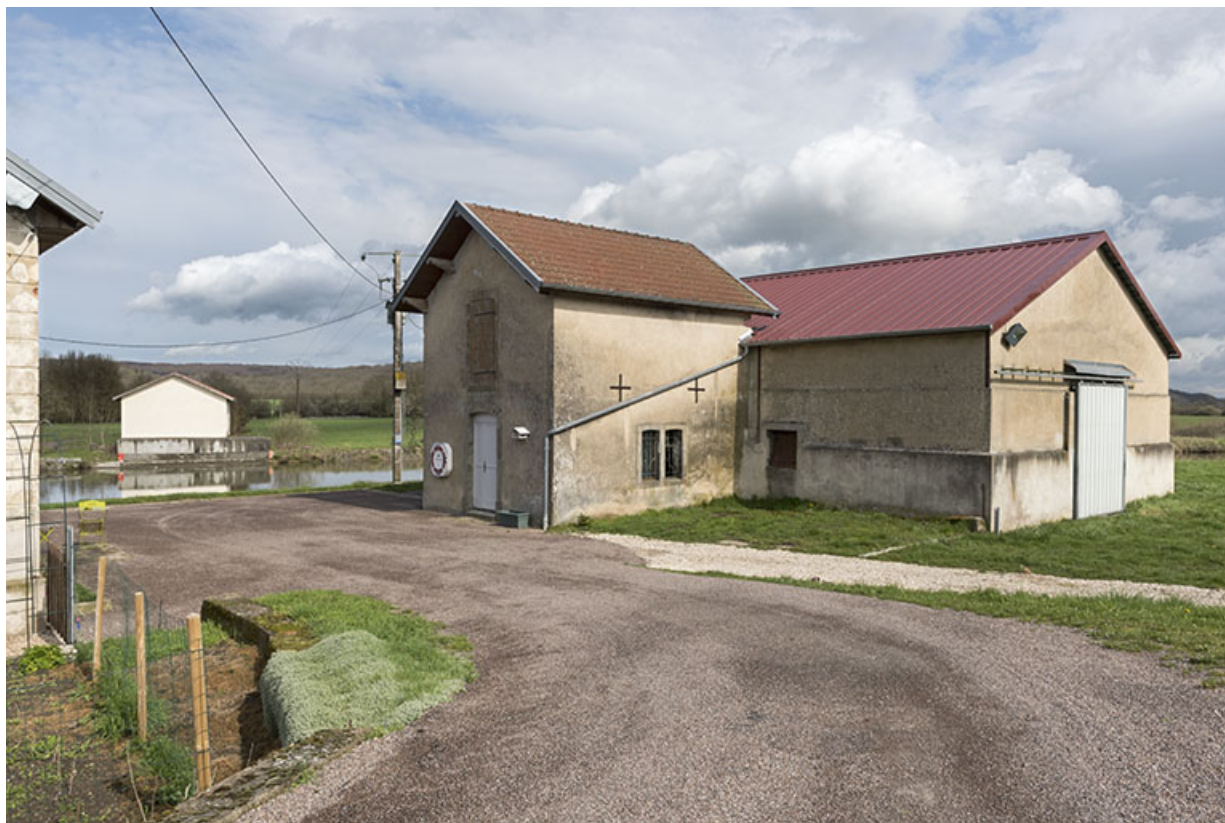
Vue de trois-quart sud du hangar. (Voies navigables de France)

70, Cendrecourt, lieudit : corne des Prés Popet Pré Popet