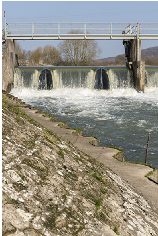
Vue de détail de la berge et du barrage depuis la rive droite en aval.

70, Cendrecourt, lieudit : corne des Prés Popet Pré Popet