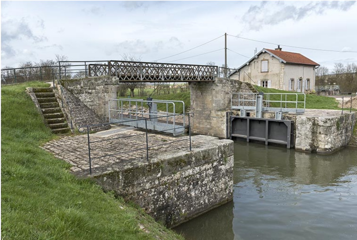
Porte de garde, passerelle et maison du garde, vues de la rive gauche en amont.