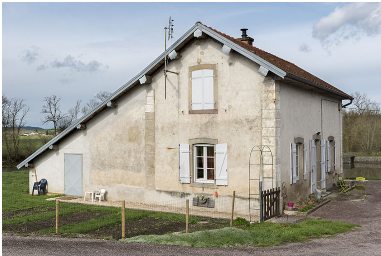
Vue de trois-quart sud de la maison de garde.

70, Cendrecourt, lieudit : corne des Prés Popet Pré Popet