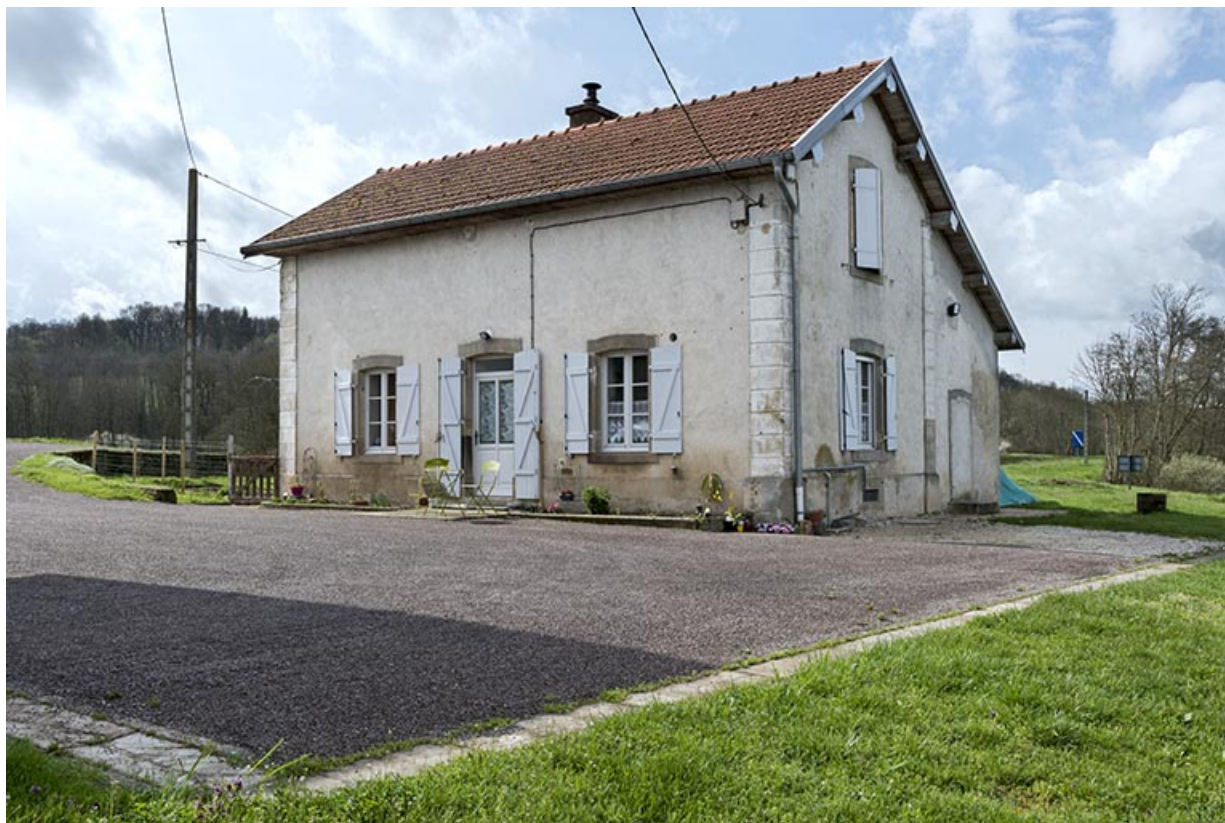
Vue de trois-quart nord de la maison de garde.

70, Cendrecourt, lieudit : corne des Prés Popet Pré Popet