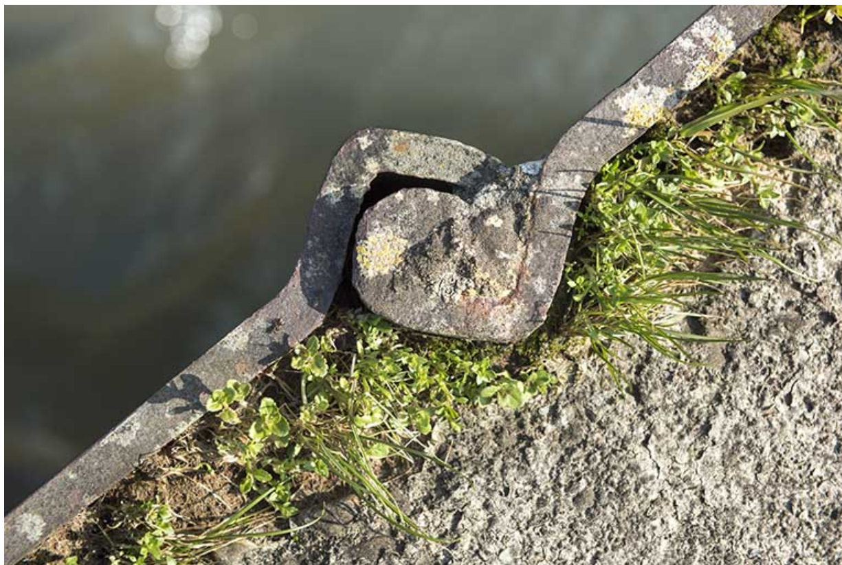
Détail d'assemblage (serrure) des palplanches en aval du barrage mobile.

70, Cendrecourt, lieudit : corne des Prés Popet Pré Popet