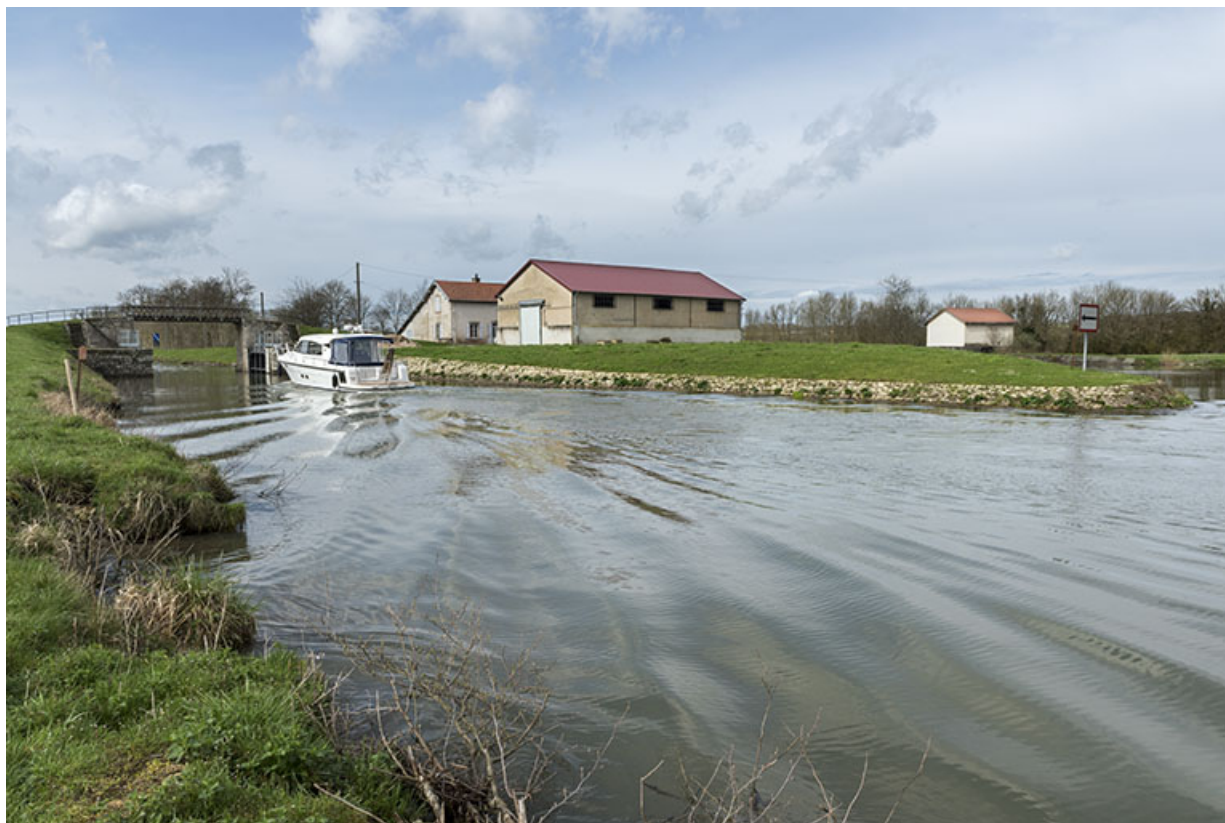
Bateau avalant à l'approche de la porte de garde.

70, Cendrecourt, lieudit : corne des Prés Popet Pré Popet