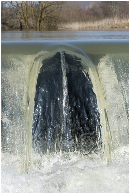
Vue rapprochée du barrage.

70, Cendrecourt, lieudit : corne des Prés Popet Pré Popet