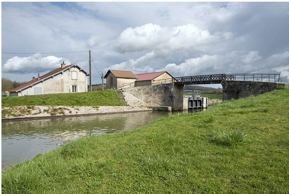
La porte de garde, la maison du garde, le hangar (Voies navigables de France), la passerelle vus de la rive gauche en aval. 70, Cendrecourt, lieudit : corne des Prés Popet Pré Popet