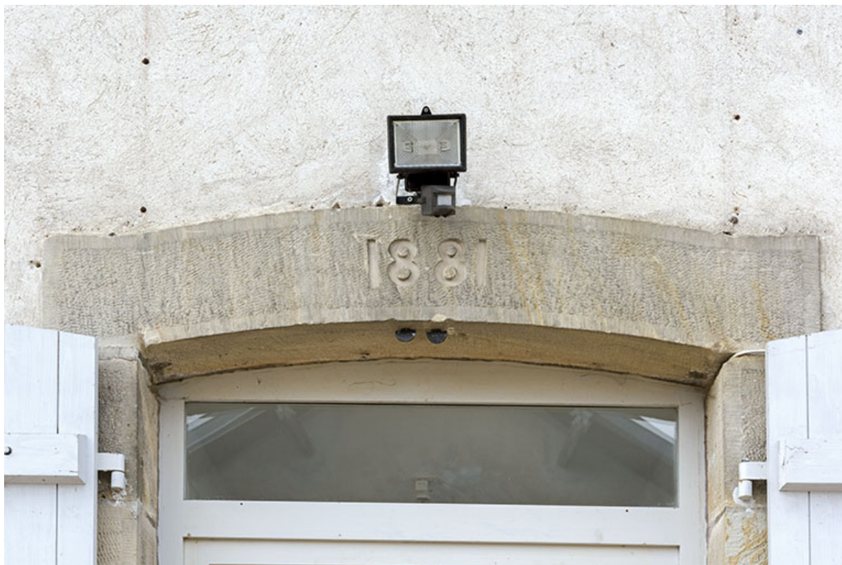
Date portée 1881 sur le linteau de la porte d'entrée.

70, Cendrecourt, lieudit : corne des Prés Popet Pré Popet