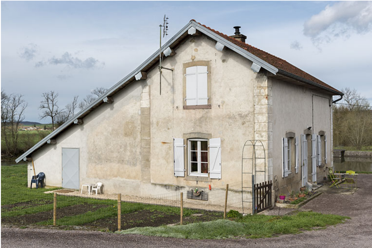
Vue de trois-quart sud de la maison de garde.

70, Cendrecourt, lieudit : corne des Prés Popet Pré Popet