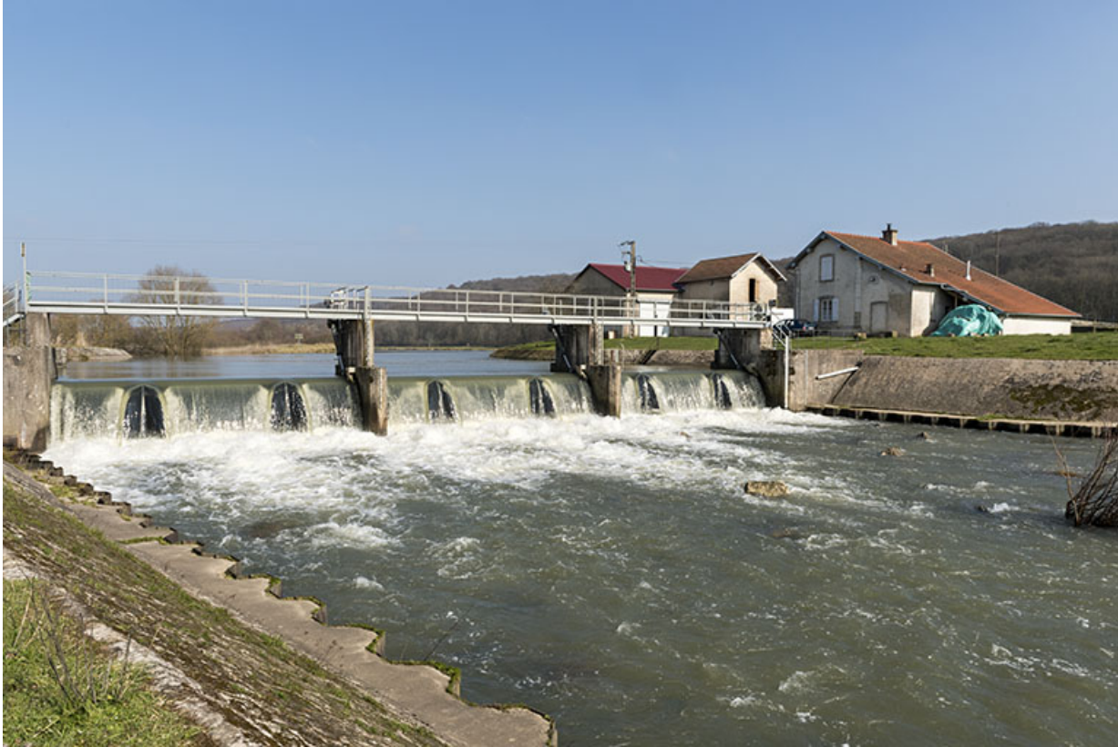
Le barrage vu de la rive droite en aval.