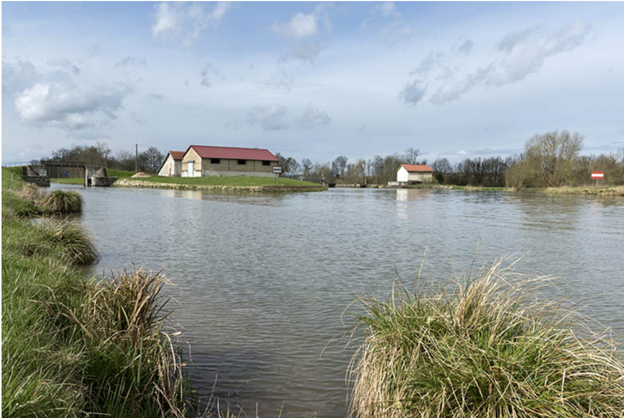
Vue d'ensemble de la porte de garde, passerelle, hangar (Voies navigables de France) et maison du garde, vues de la rive gauche en amont.

70, Cendrecourt, lieudit : corne des Prés Popet Pré Popet