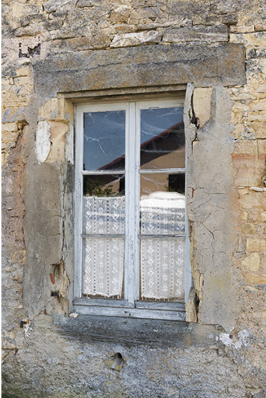
Détail d'une ouverture, mur pignon.