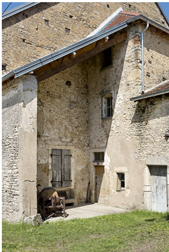
La partie abritée de la façade antérieure.