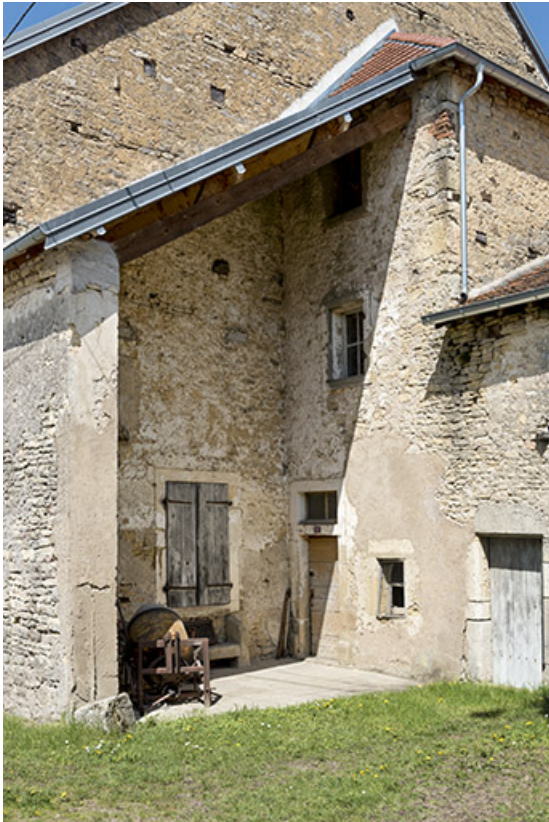
La partie abritée de la façade antérieure.