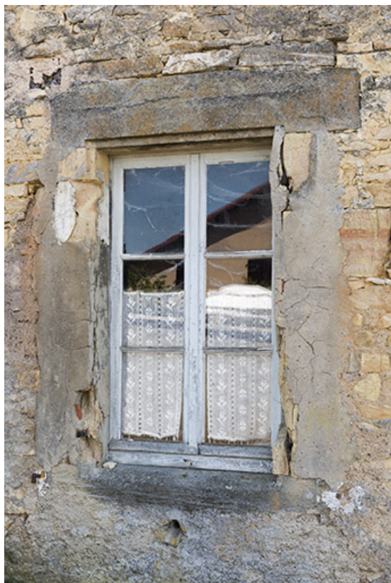
Détail d'une ouverture, mur pignon.