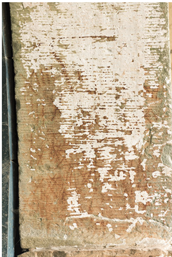
Détail d'une pierre de la porte de grange.