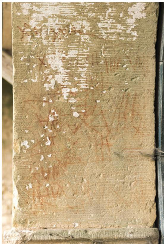
Détail d'une pierre de la porte de grange. 70, Demangevelle