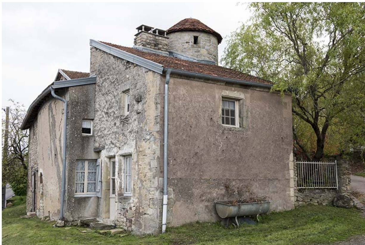
Maison avec tour d'escalier entre la rue de la poste et grande rue. Vue rapprochée de l'ouest. 70, Demangevelle