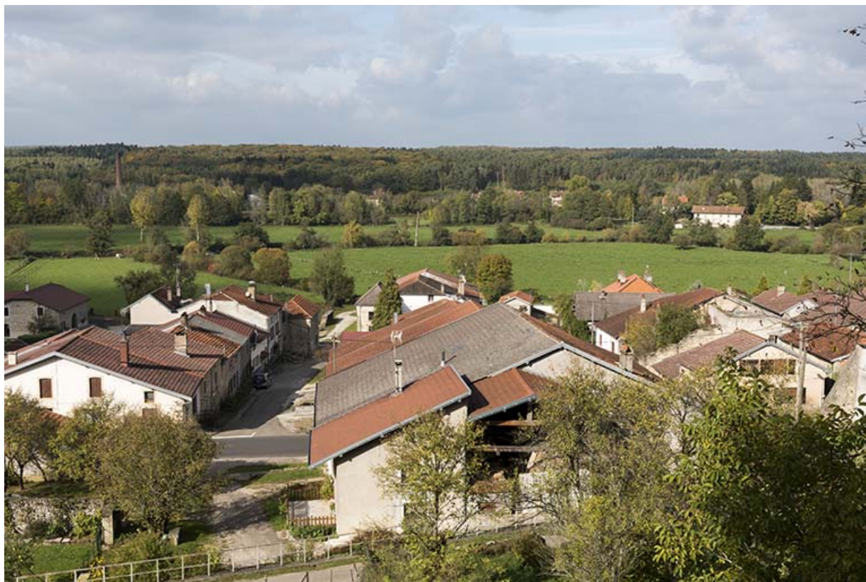
Vue d'ensemble du village groupé depuis la butte du château. 70, Demangevelle