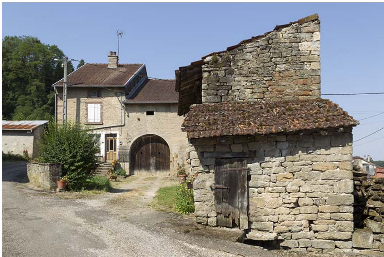
Vue de l'est de la ferme, 4 rue du Marchemont. 70, Demangevelle