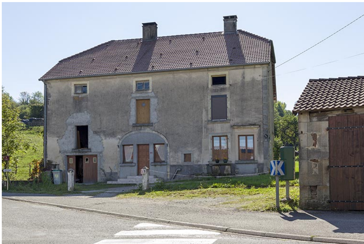
Maison 2 rue Saint isidore 70, Demangevelle