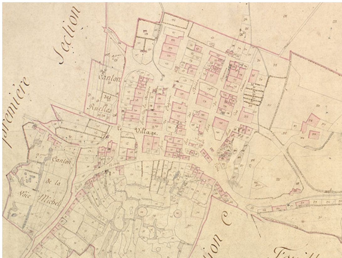
Détail du cadastre ancien. Au pied du château. 70, Demangevelle