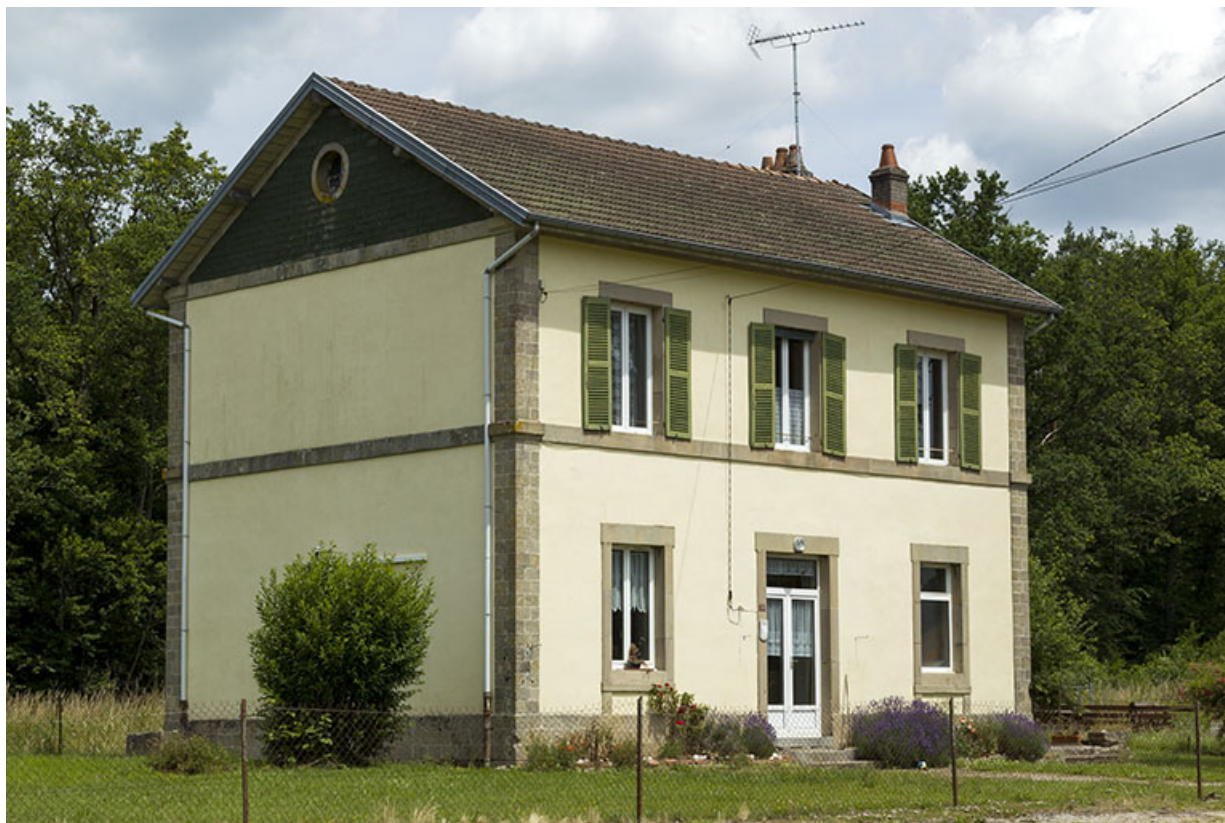
Ancienne gare, 30 rue de la filature. 70, Demangevelle