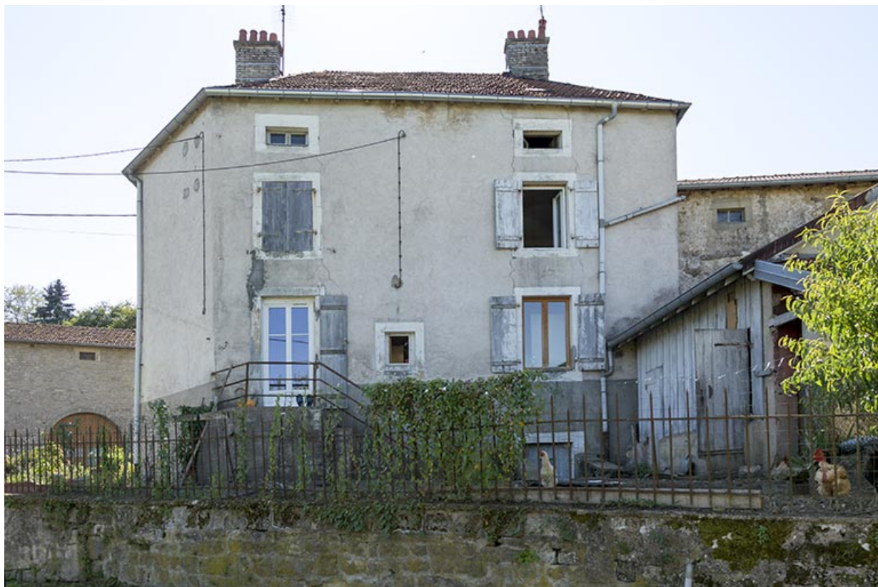
Façade postérieure de la maison d'habitation, 28 grande rue. 70, Demangevelle