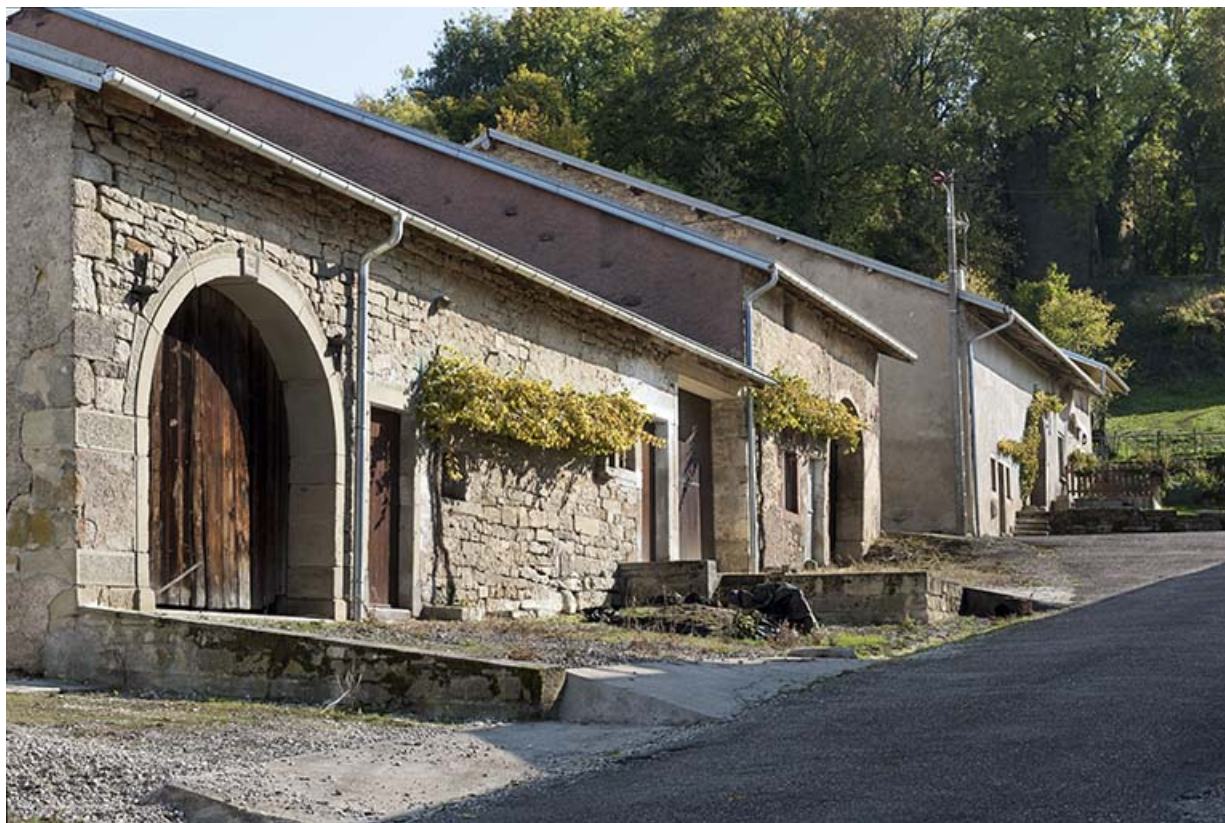
Alignement rue de la fontaine.