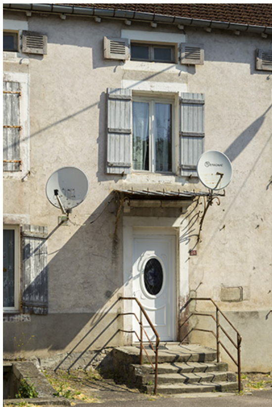
Détail de la façade antérieure de la maison d'habitation, 28 grande rue. 70, Demangevelle