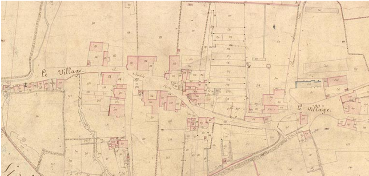
Extrait du cadastre ancien. A l'est près de l'église. 70, Demangevelle