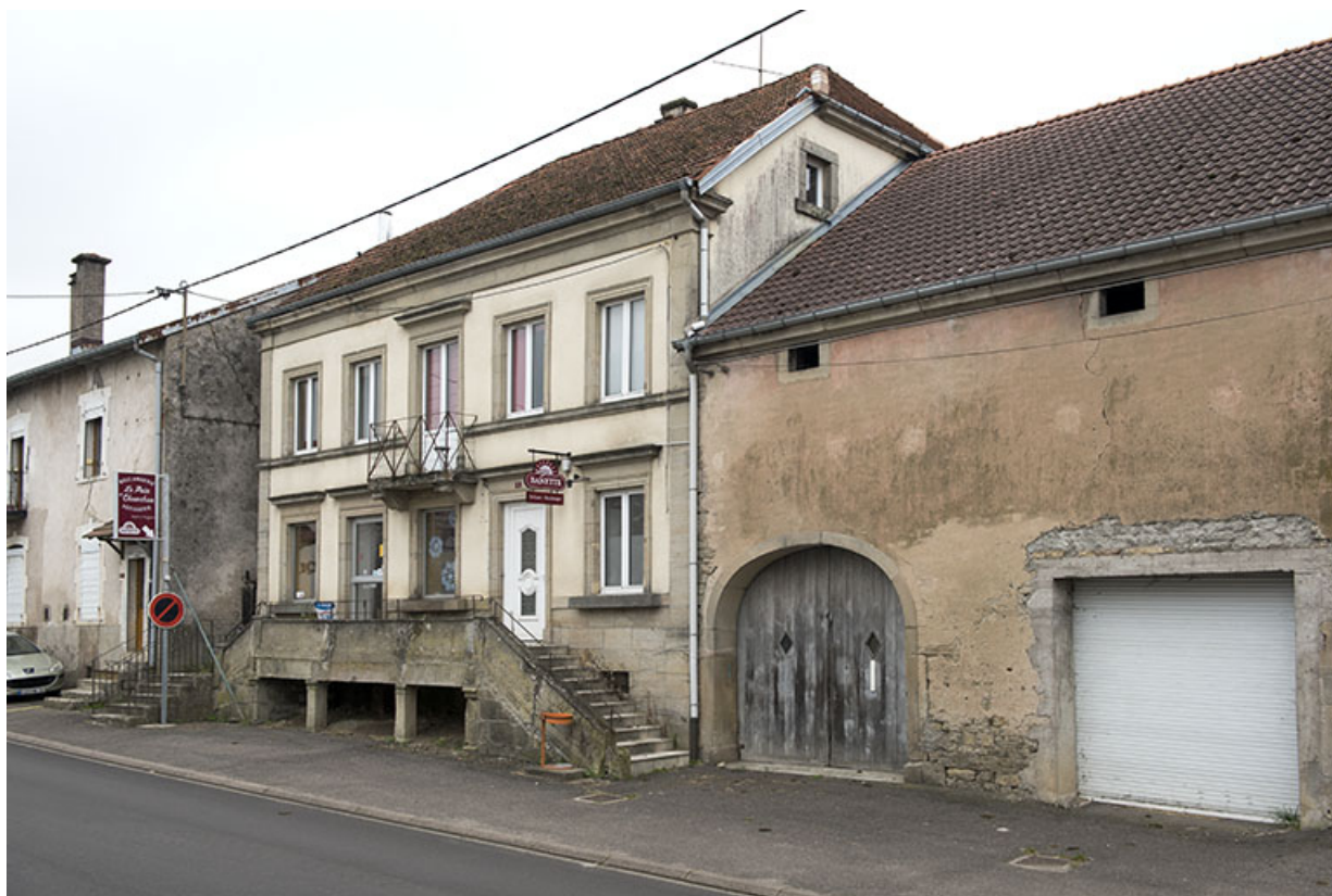
Détail de l'alignement grande rue : ancienne boulangerie. 70, Demangevelle