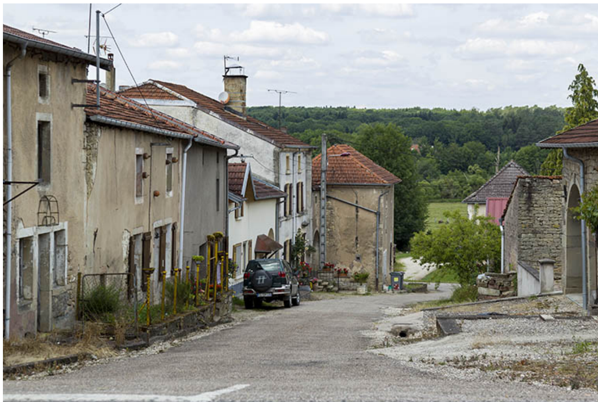
Alignement rue de la fontaine. 70, Demangevelle