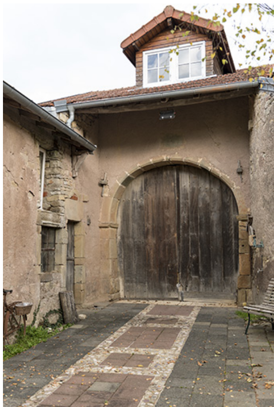
Détail de la porte de grange, à l'arrière, orientée à l'ouest. 70, Demangeville