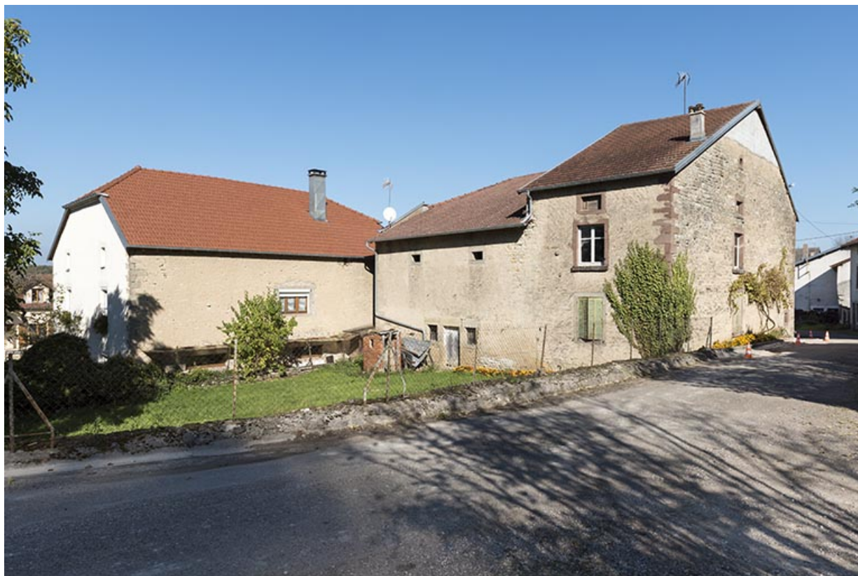
Façade postérieure de la maison 35, grande rue et vue de trois-quart postérieur sud-ouest de la ferme 4 rue du Marchemont. 70, Demangevelle