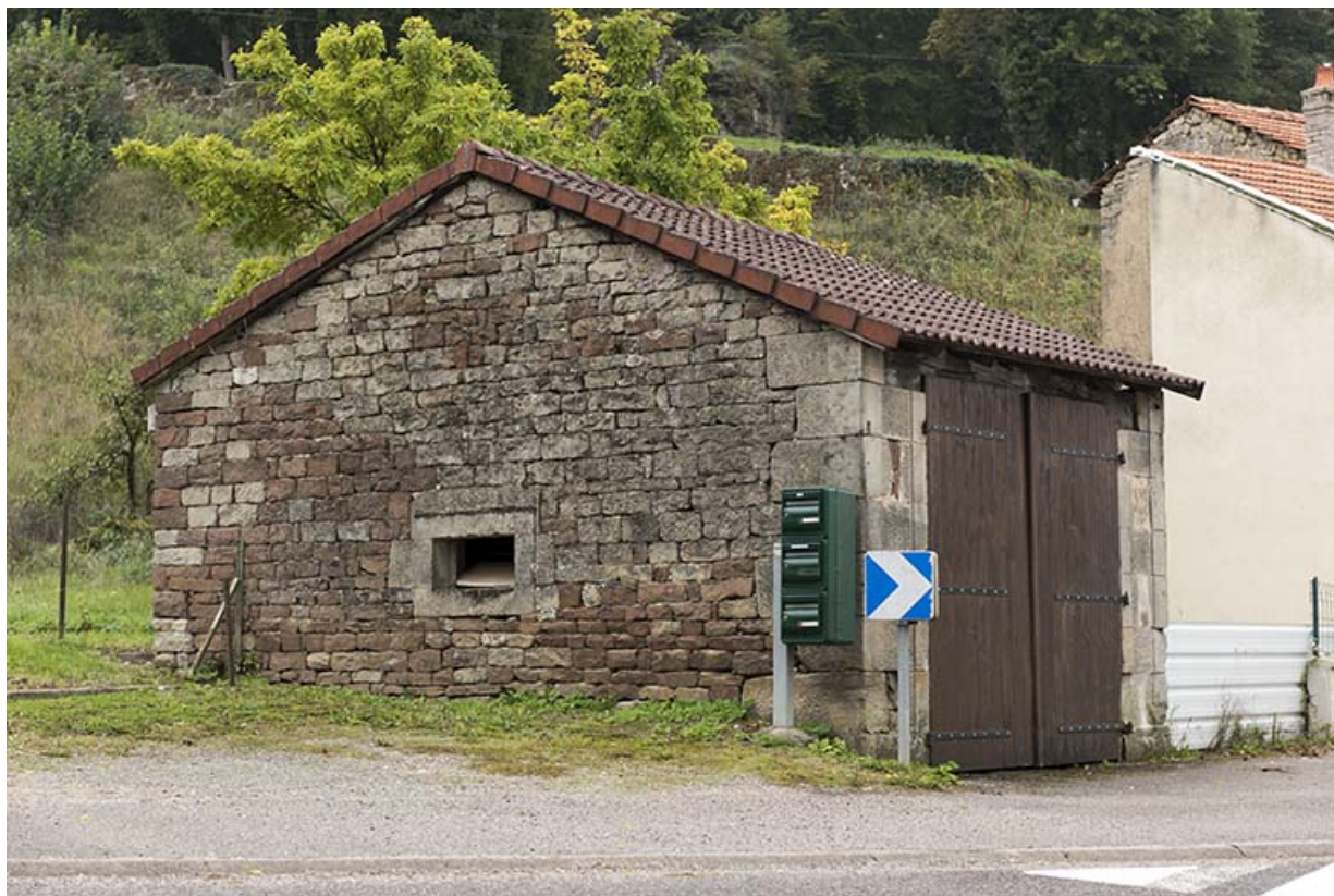
Edicule jouxtant la maison 2, rue St Isidore. 70, Demangevelle