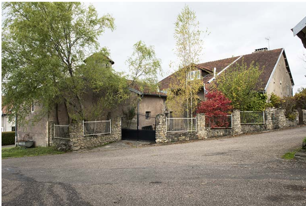
Maison avec tour d'escalier entre la rue de la poste et grande rue. Vue d'ensemble du sud-ouest. 70, Demangevelle