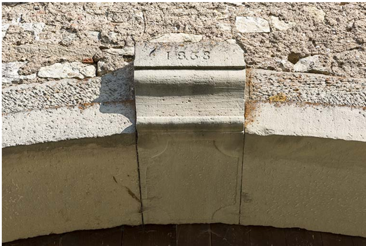
Alignement en bas du village, au nord de la fontaine. Détail de clé de voûte de la porte de grange avec la date 1838. 70, Demangevelle