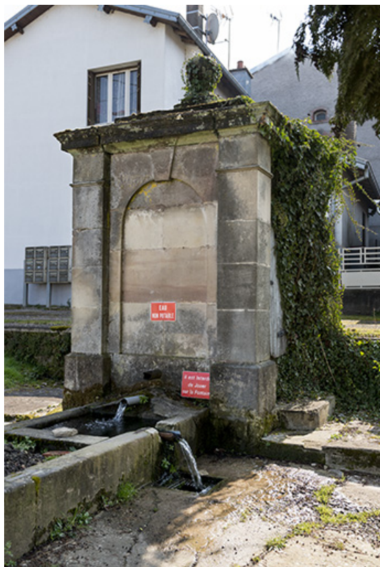
Fontaine vue de trois-quart.