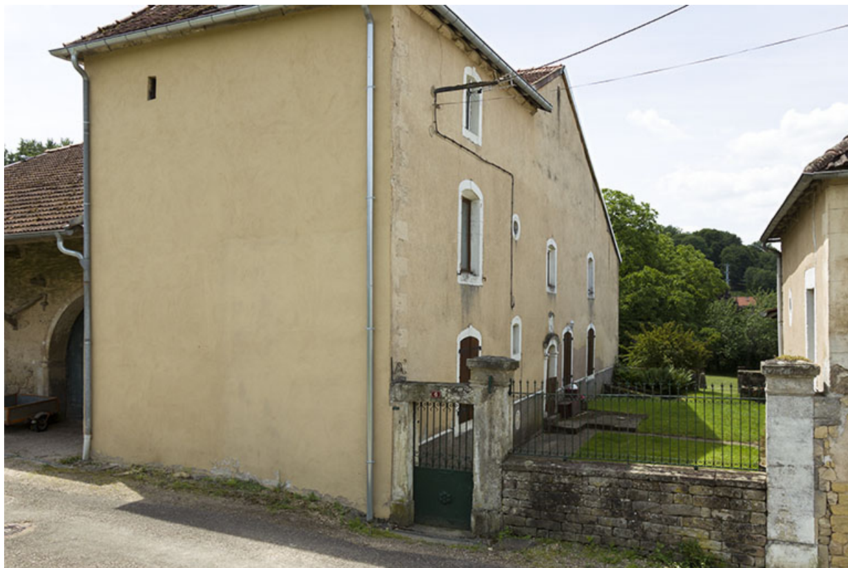
Maison, 6 impasse du sentier.