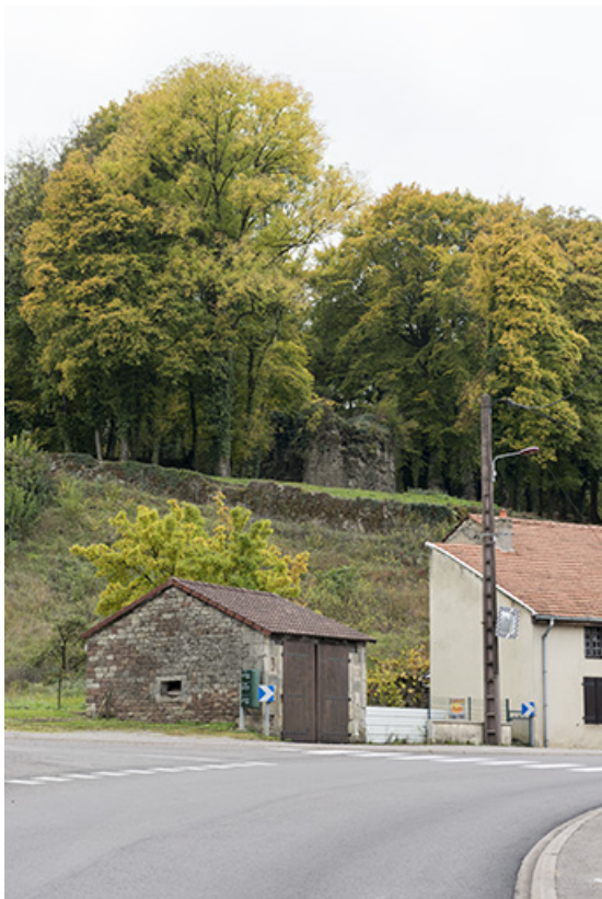
Vue sur une tour du chateau et la grande rue, au carrefour avec la rue St isidore, en direction de Corre. 70, Demangevelle