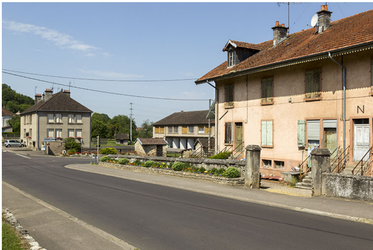
Logements ouvriers le long de la grande rue et au second plan vue de trois quart sur l'ancienne mairie école (1953) 70, Demangevelle