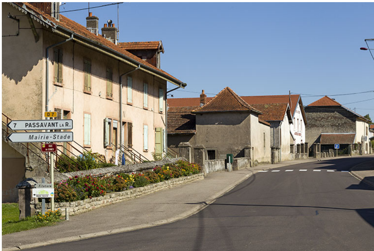
Vue rapprochée de la grande rue, au milieu du village, au carrefour avec la route de Passavant, en direction de Vauvillers. 70, Demangevelle