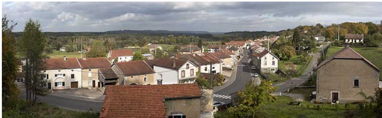
Vue d'ensemble du village depuis l'ouest.