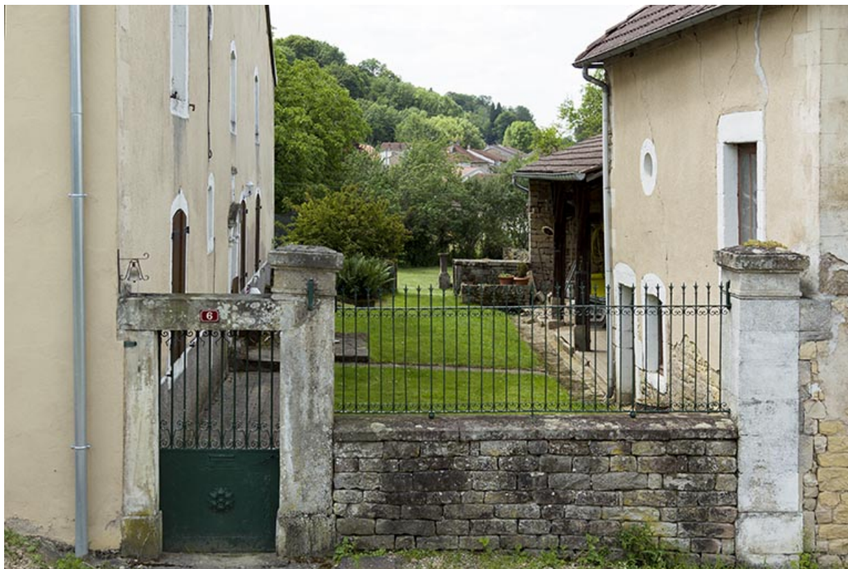
Maison, 6 impasse du sentier. Vue rapprochée. 70, Demangevelle