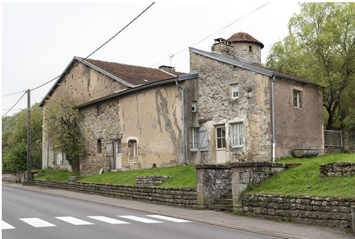
Maison avec tour d'escalier entre la rue de la poste et grande rue. Vue d'ensemble du nord-ouest. 70, Demangevelle