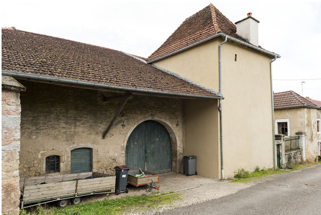
Maison, 6 impasse du sentier. Vue d'ensemble de trois-quart. 70, Demangevelle