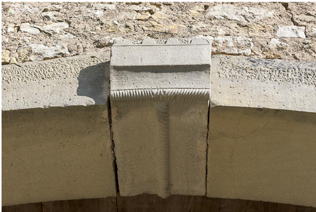
Alignement en bas du village, au nord de la fontaine. Élément de sculpture sur la clé de voute de la porte de grange. 70, Demangevelle