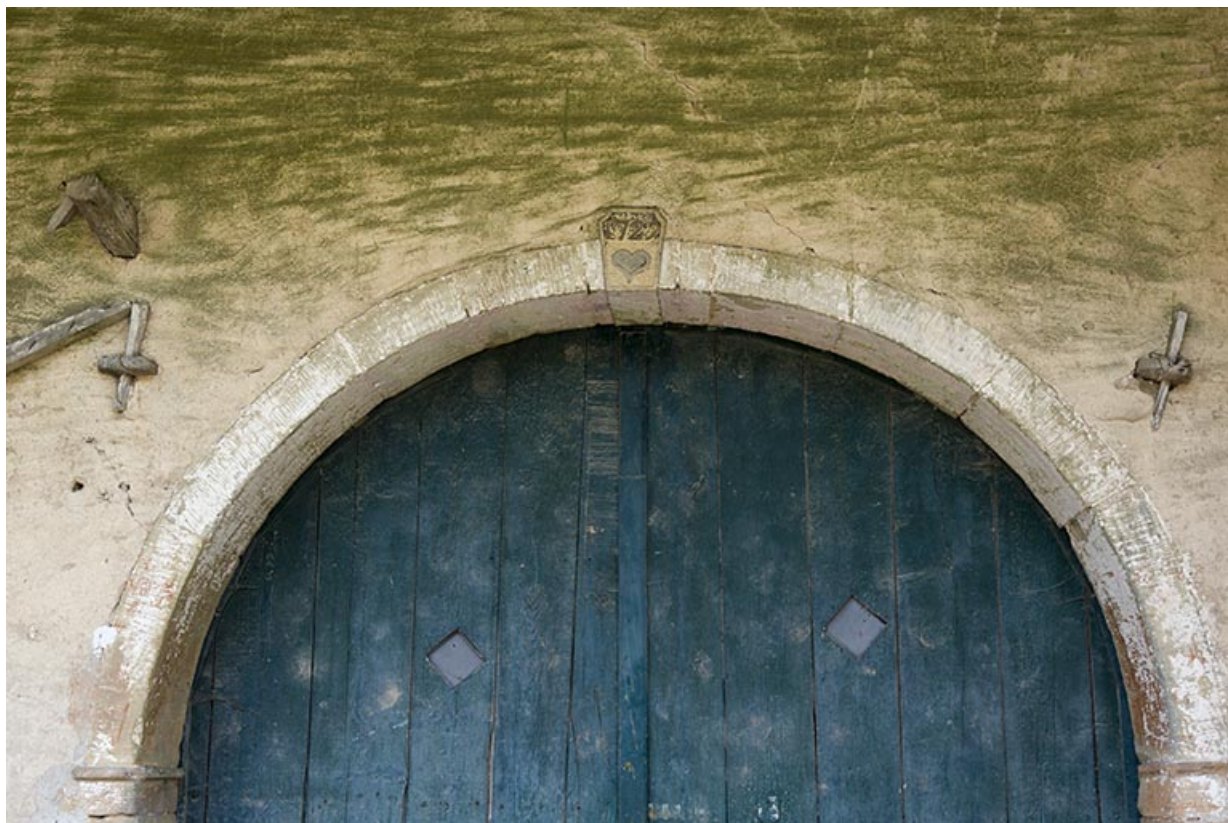
Détail de la porte de grange et date portée (1729) maison impasse du sentier. 70, Demangevelle