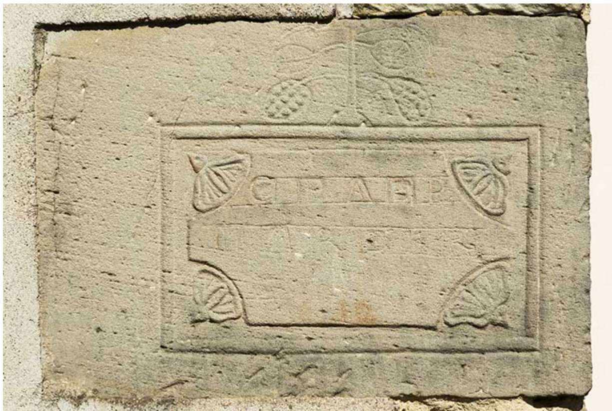
Inscription sur la façade antérieure de la maison 32 grande rue. 70, Demangevelle