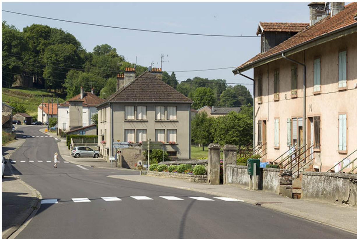
Vue de la grande rue, au milieu du village, à proximité de la route de Passavant, en direction de Corre. 70, Demangevelle