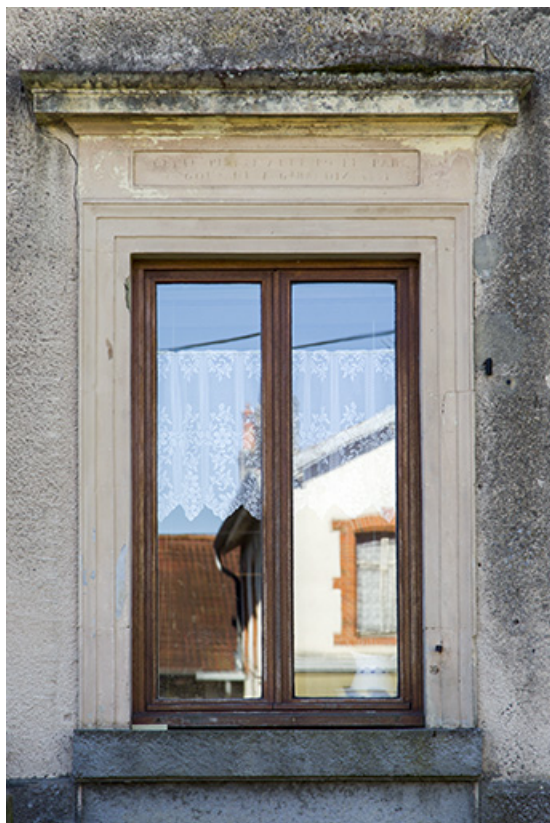
Détail de la baie de l'étage et de l'inscription 2, rue Saint isidore (cette pierre a été posée par Goux et Girardin (?) 1831 (?) 70, Demangevelle