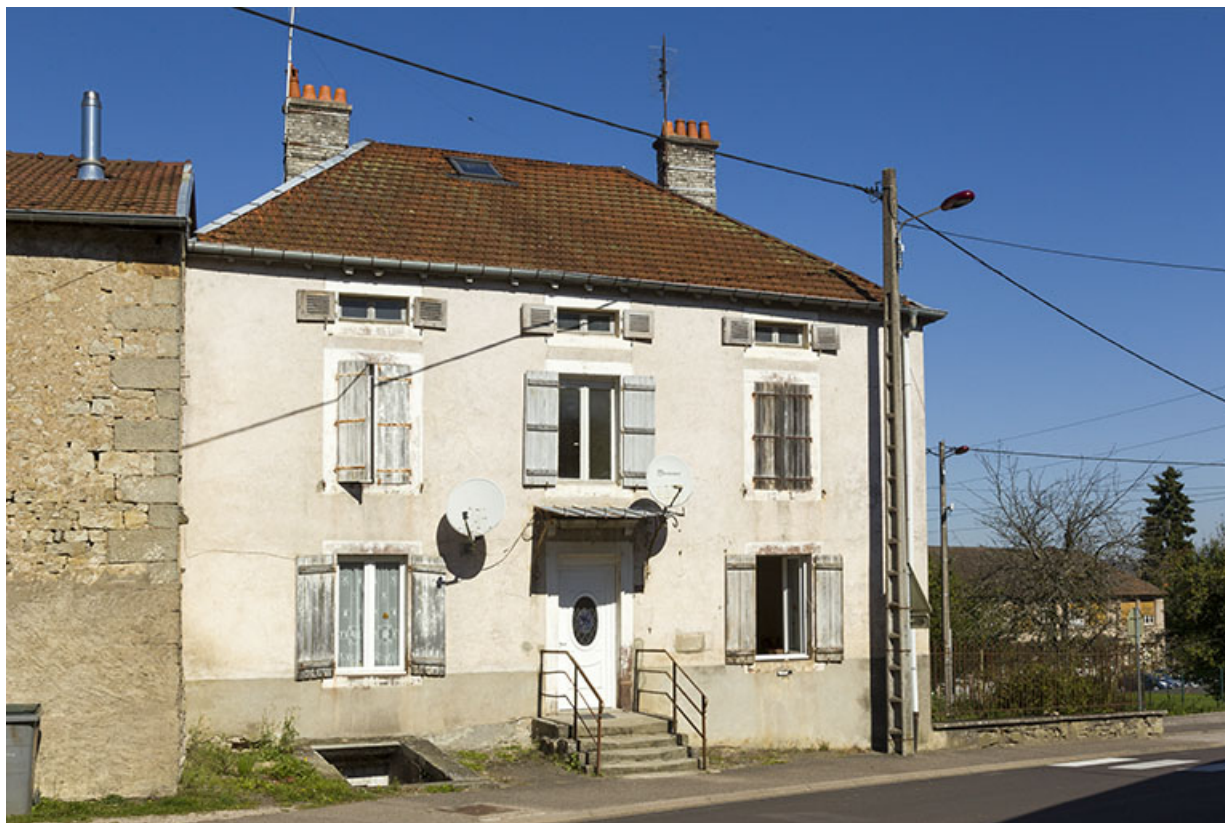
Façade antérieure sur la grande rue de la maison d'habitation, 28 grande rue. 70, Demangevelle