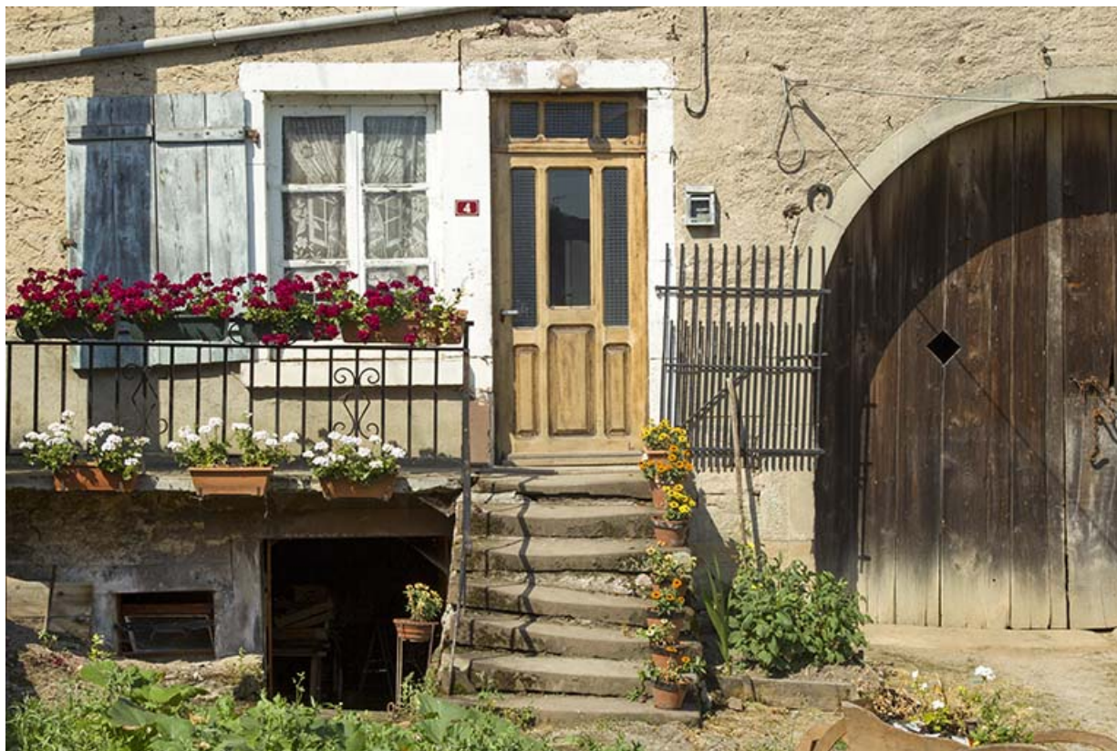
Vue de la façade antérieure de la ferme, 4 rue du Marchemont. 70, Demangevelle