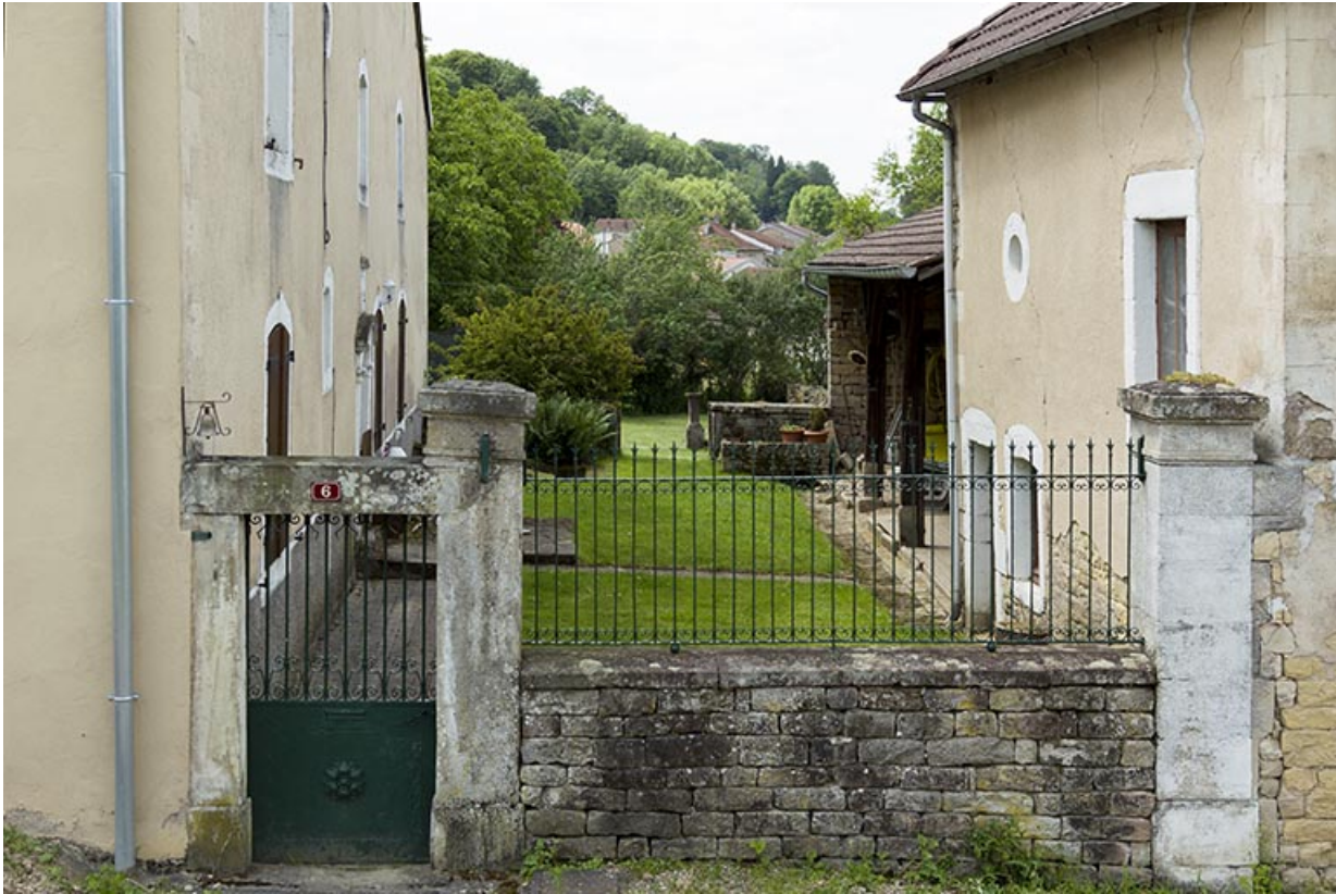
Maison, 6 impasse du sentier. Vue rapprochée. 70, Demangevelle