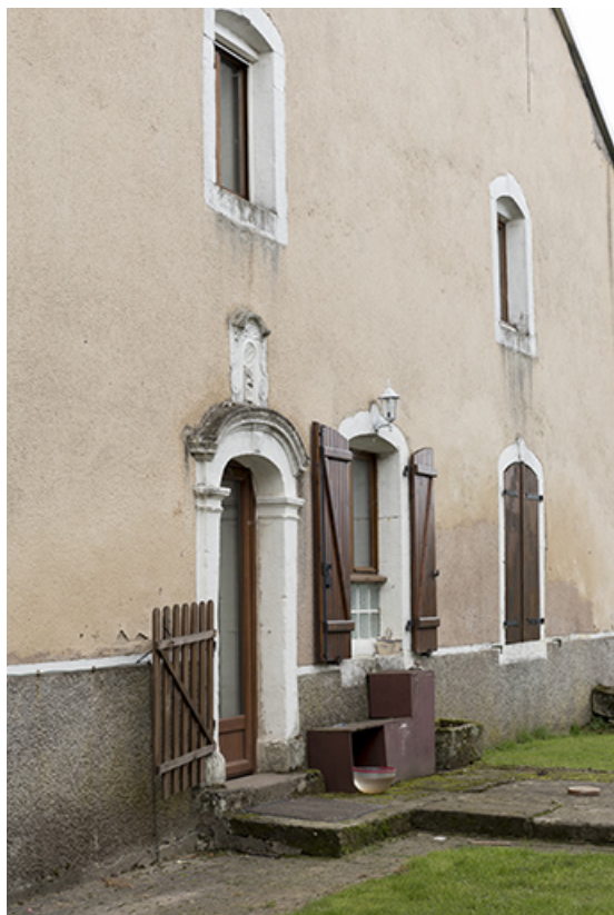
Détail de la façade antérieure.