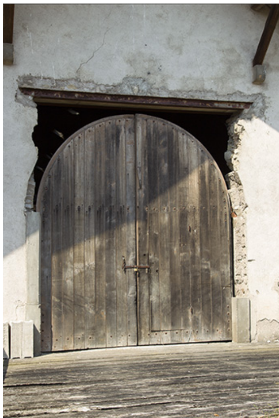
Détail d'une porte de grange sur la façade est des ateliers municipaux. 70, Demangevelle