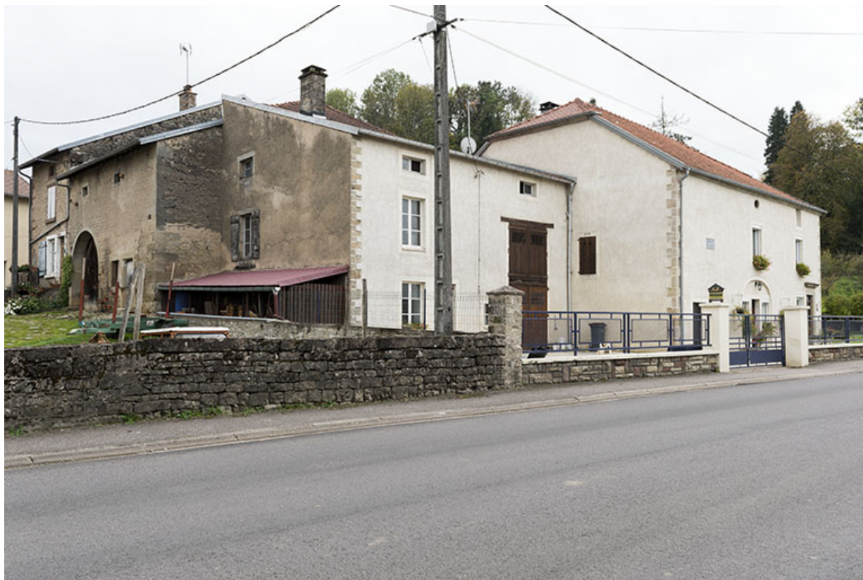
Maison 35, grande rue, vue de trois-quart est. 70, Demangevelle