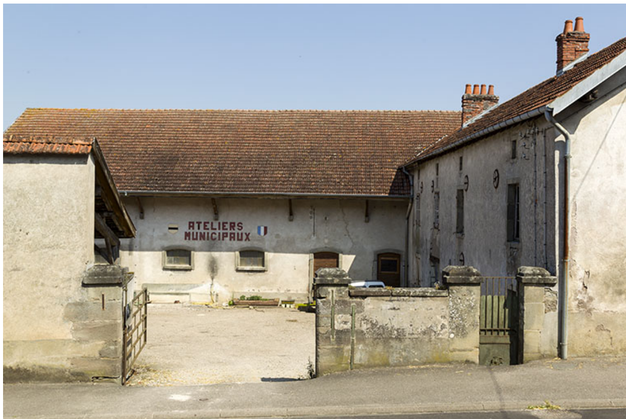
20 grande rue : les ateliers municipaux sont installés dans une ancienne ferme des filatures. 70, Demangevelle