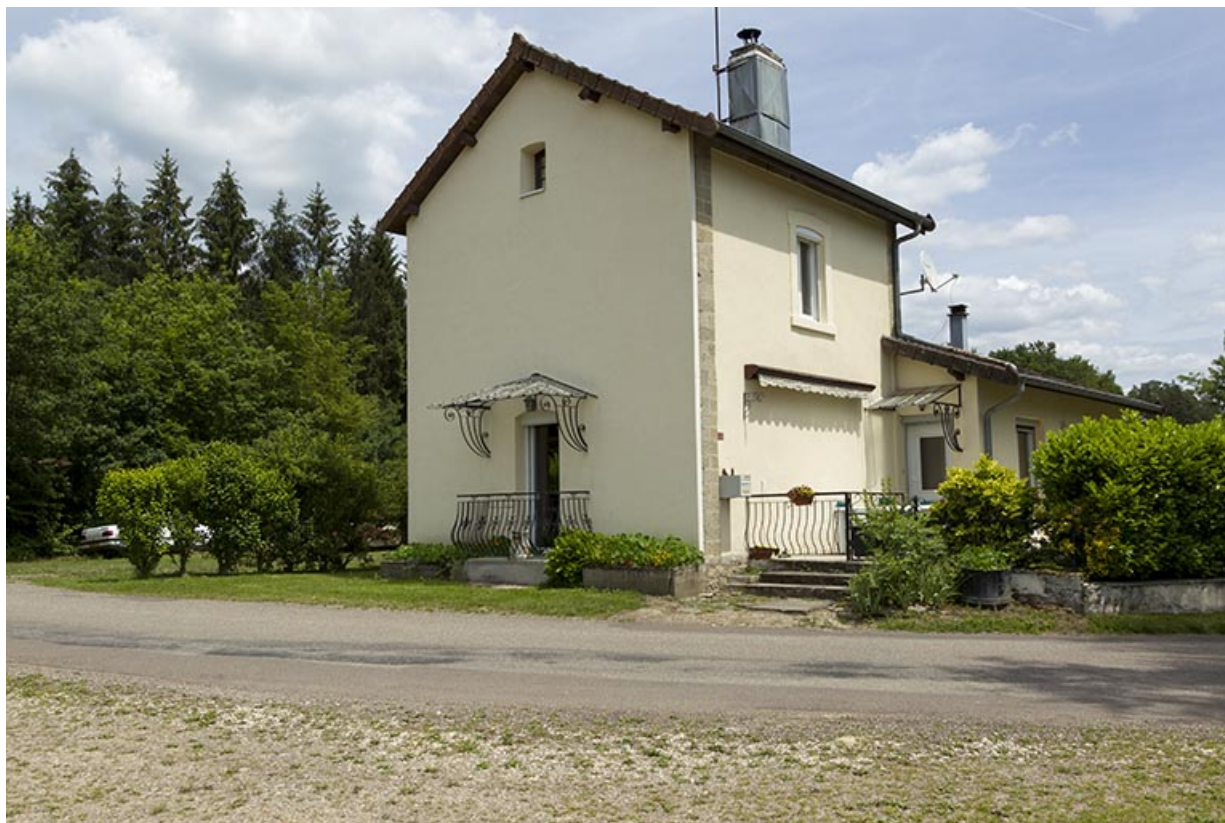
Ancienne maison du chef de gare, 32 rue de la filature. 70, Demangevelle