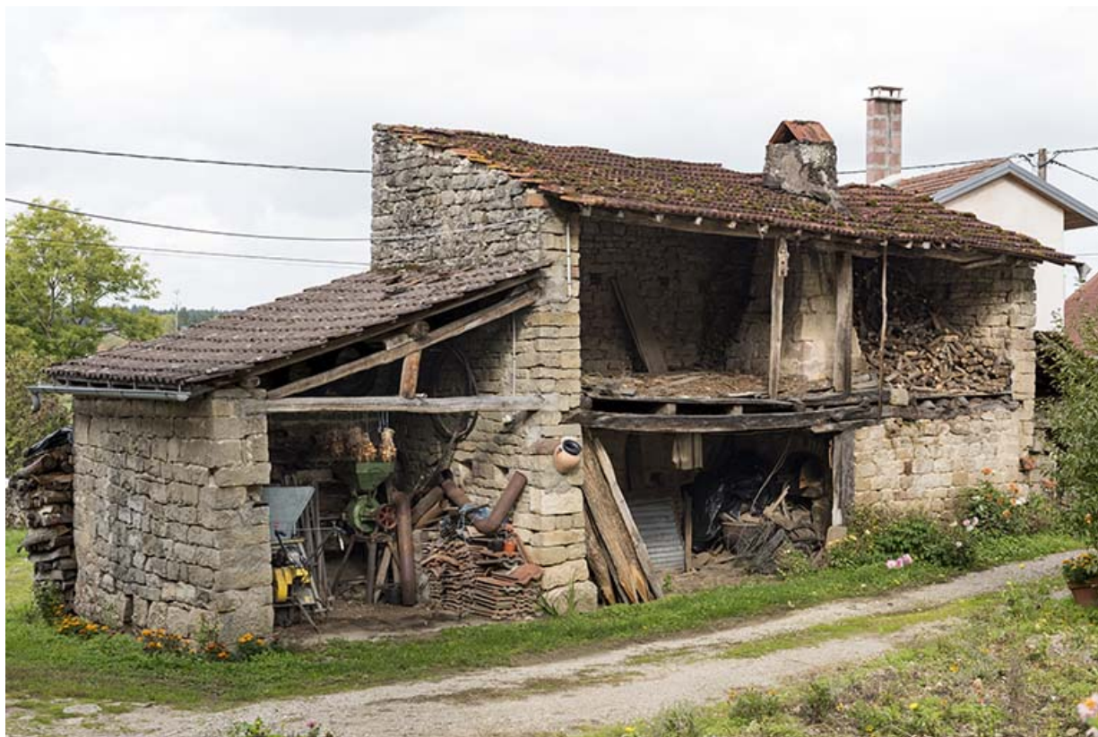
Edicule contenant un four attenant à la ferme, 4 rue du Marchemont. 70, Demangevelle