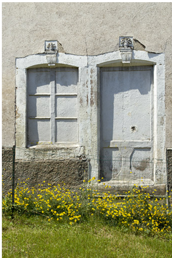
Détail de baies d'une maison d'habitation, 19 rue de la poste. 70, Demangevelle