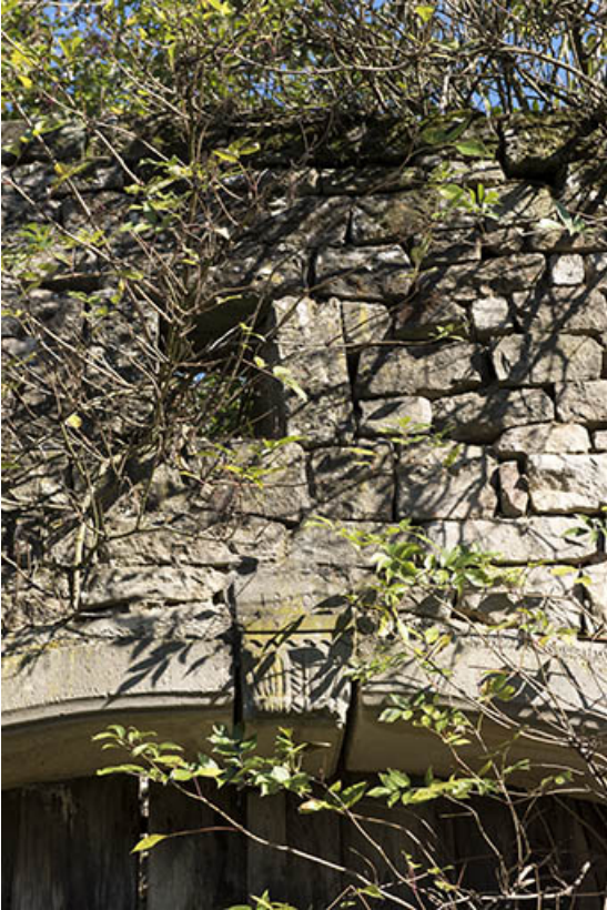
Date portée 1820 sur la porte de grange d'une maison ruinée, 4 rue de l'adjoint. 70, Demangevelle