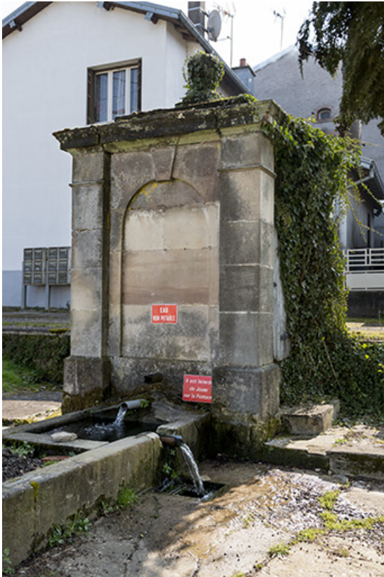
Fontaine vue de trois-quart.