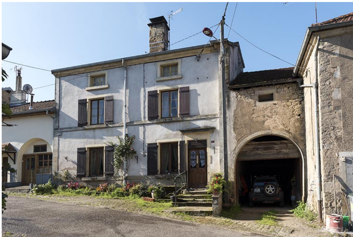
Maison 9 rue de la fontaine.