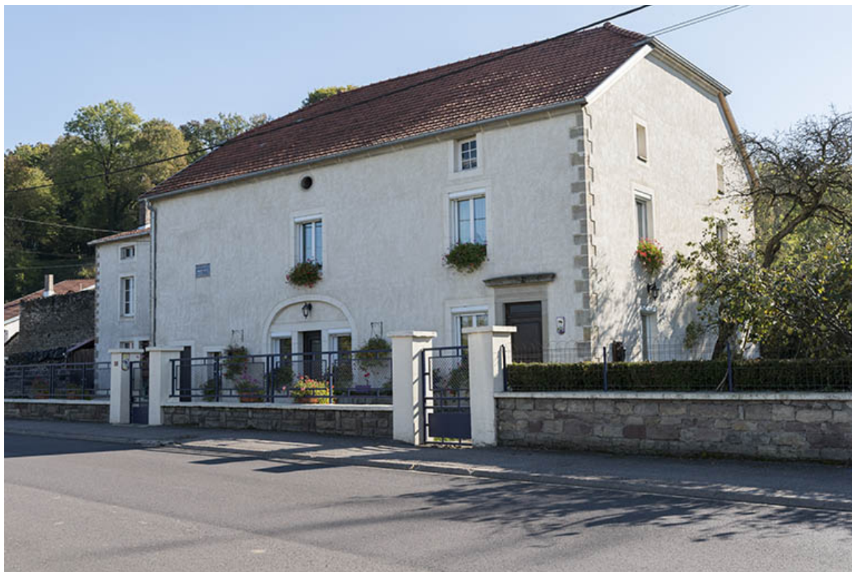
Maison 35, grande rue, vue de trois-quart nord-ouest. 70, Demangevelle