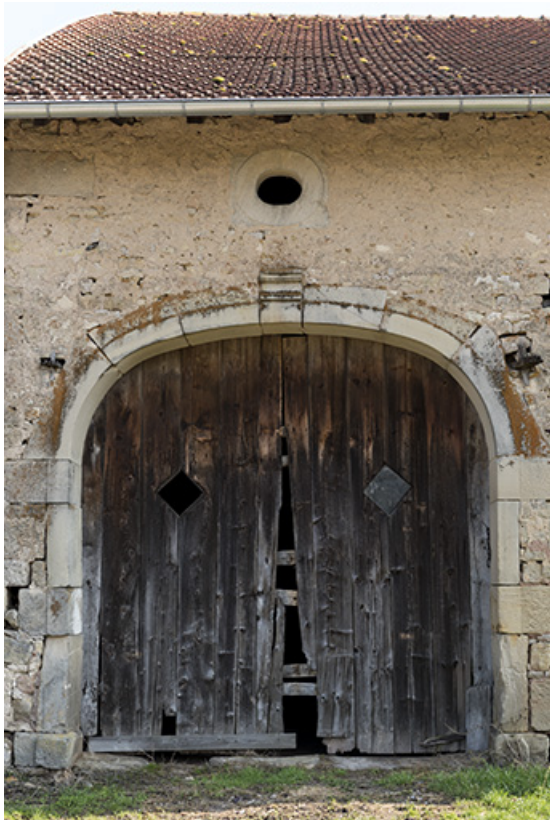
Alignement en bas du village, au nord de la fontaine. Détail de la porte charretière en anse de panier et de l'oculus ovale oblong. 70, Demangevelle