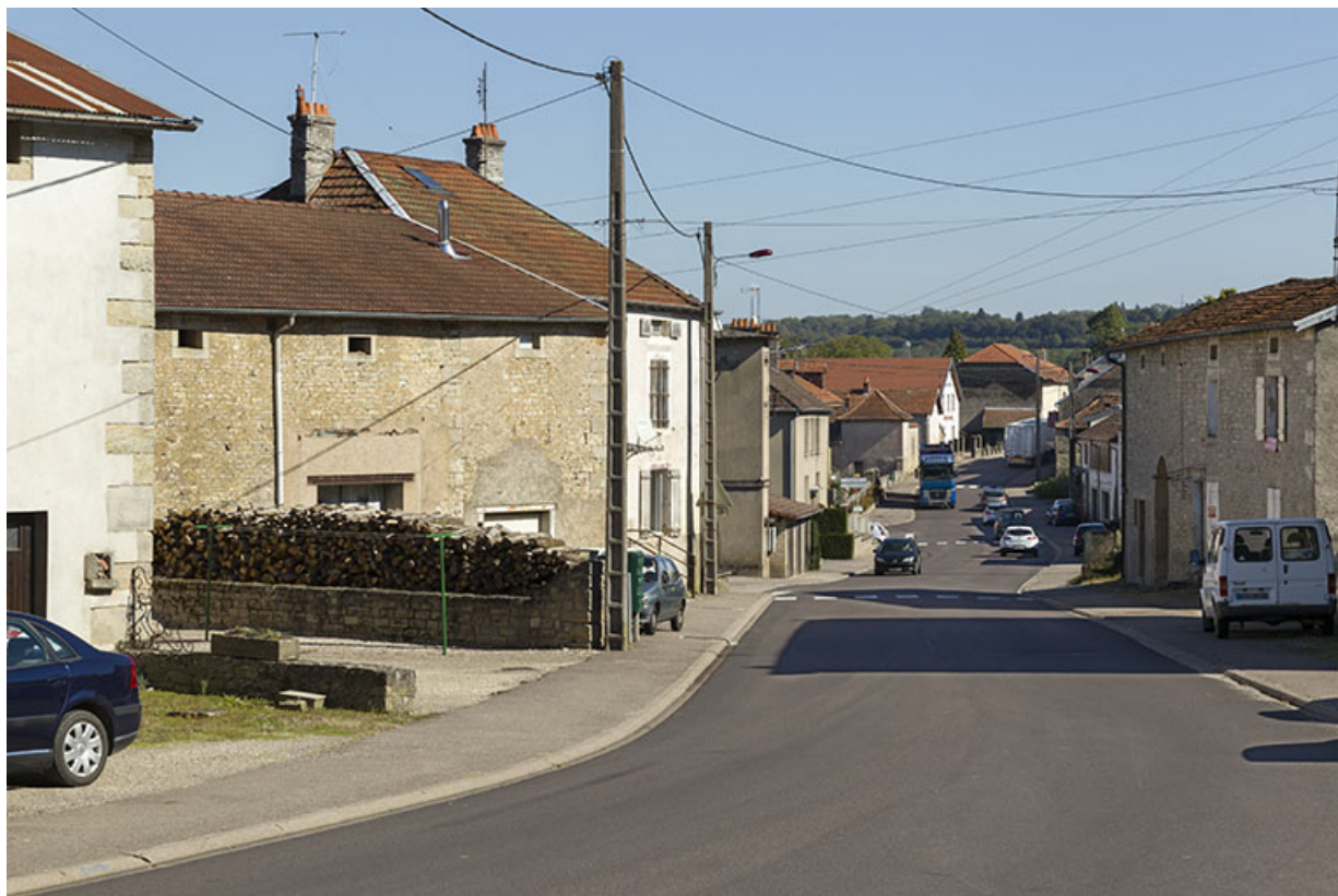
Vue de la grande rue, au milieu du village, à proximité de la route de Passavant, en direction de Vauvillers. 70, Demangevelle