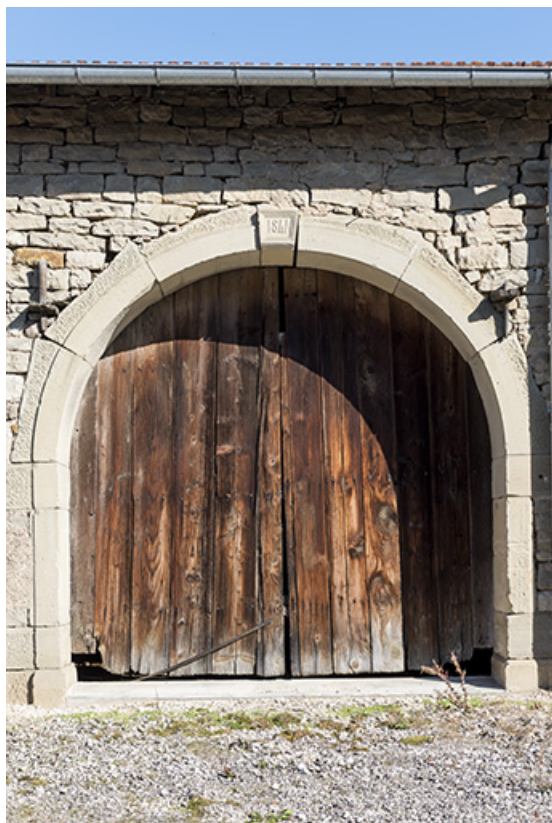
Rue de la fontaine. Détail de porte de grange avec date portée : 1841. 70, Demangevelle