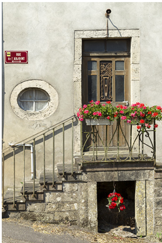
Vue rapprochée de l'entrée principale de la maison 3, rue de l'adjoint. 70, Demangevelle