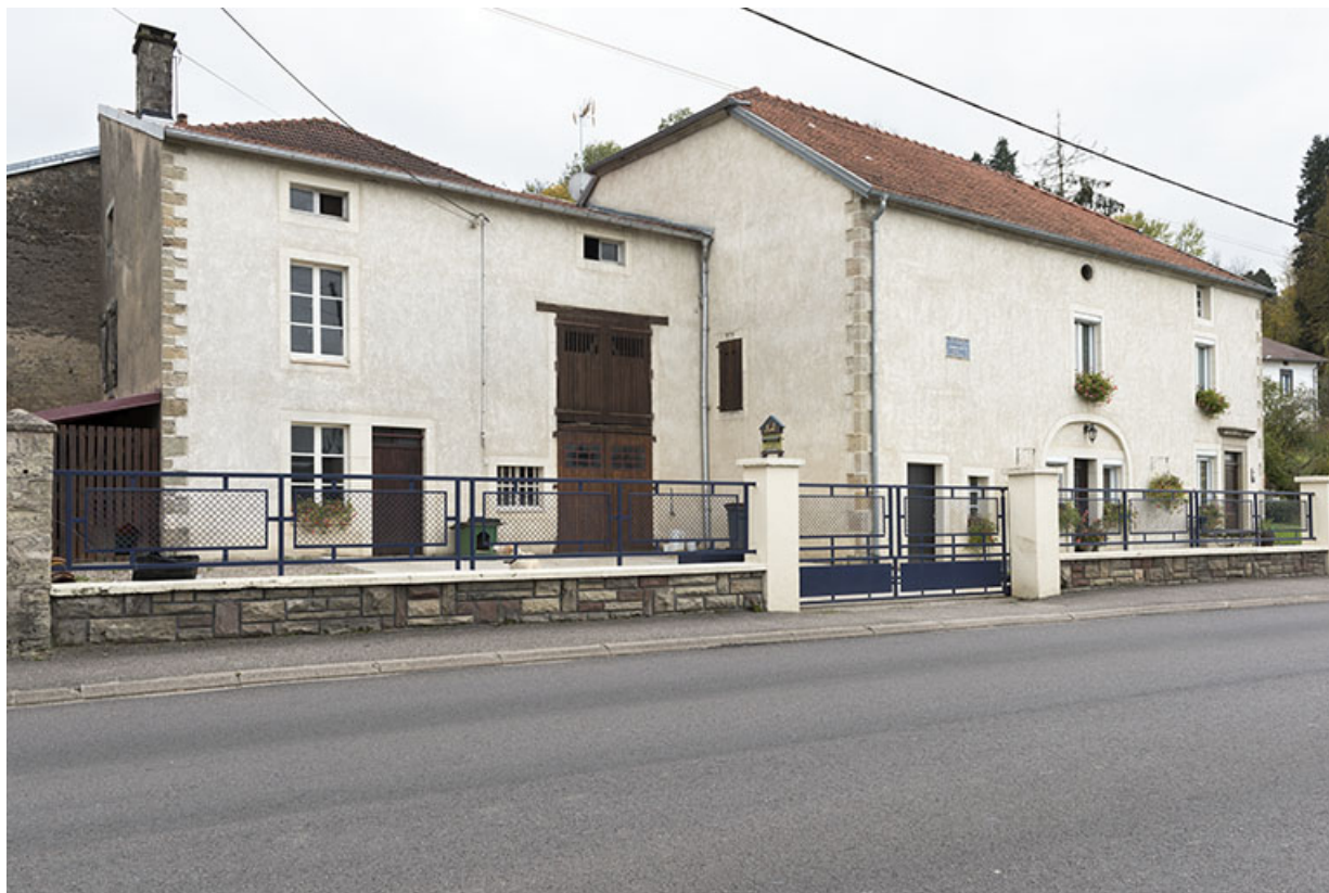
Maison 35, grande rue, vue de trois-quart nord-est. 70, Demangevelle