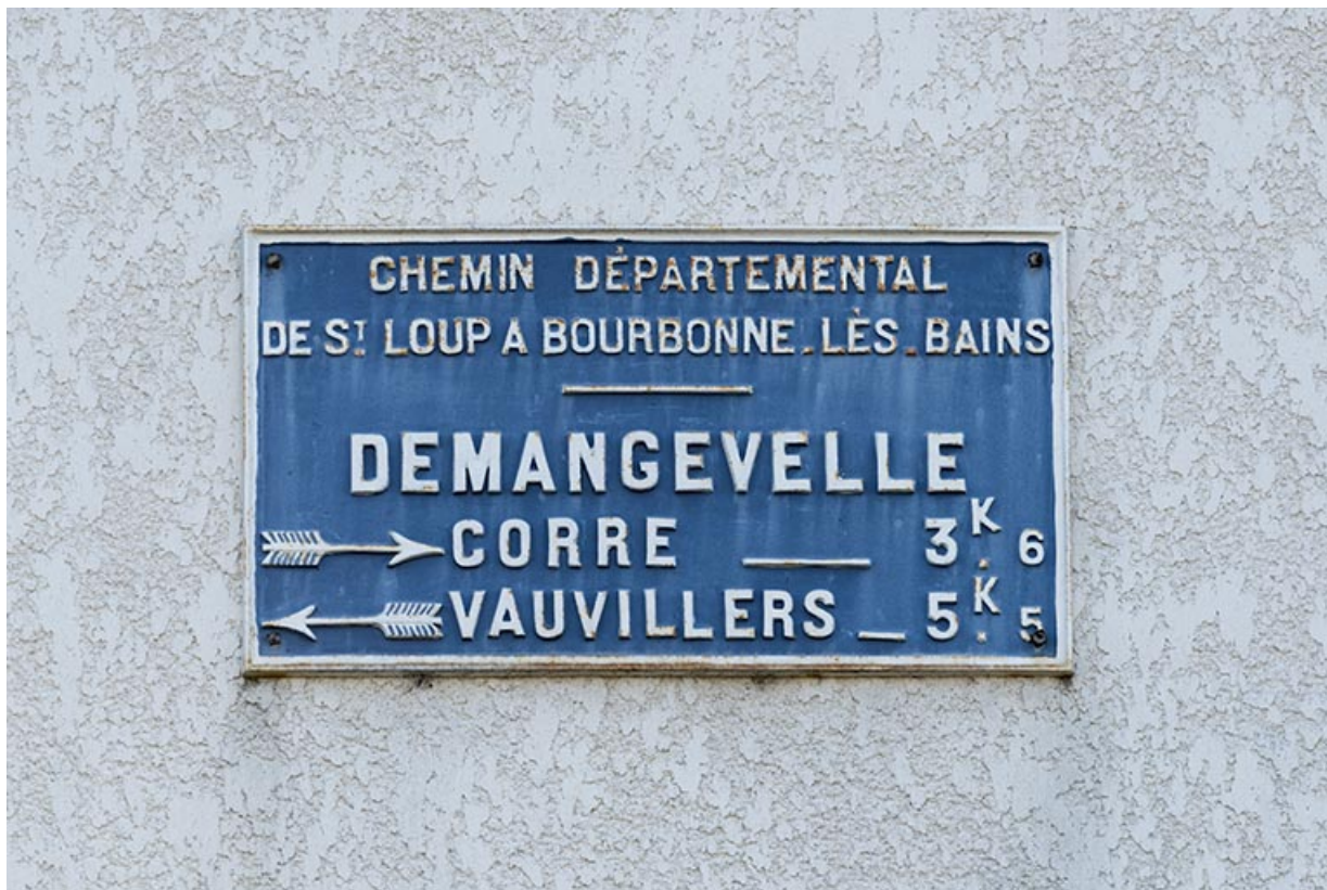
Détail d'une plaque d'indication géographique posée sur la façade antérieure 35, grande rue. 70, Demangevelle