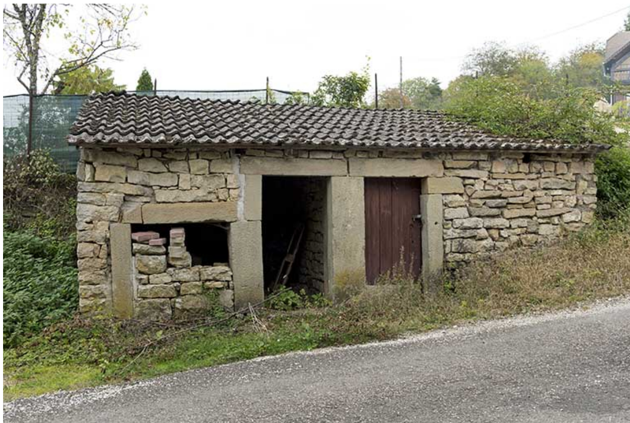
Ancienne soue à cochons face à la maison 6 impasse du sentier. 70, Demangevelle