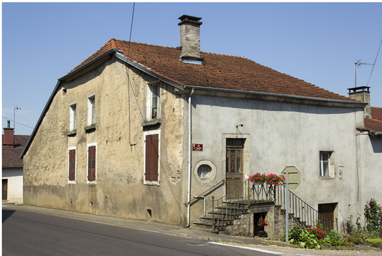
Maison 3 rue de l'adjoint, à l'angle de la grande rue. 70, Demangevelle