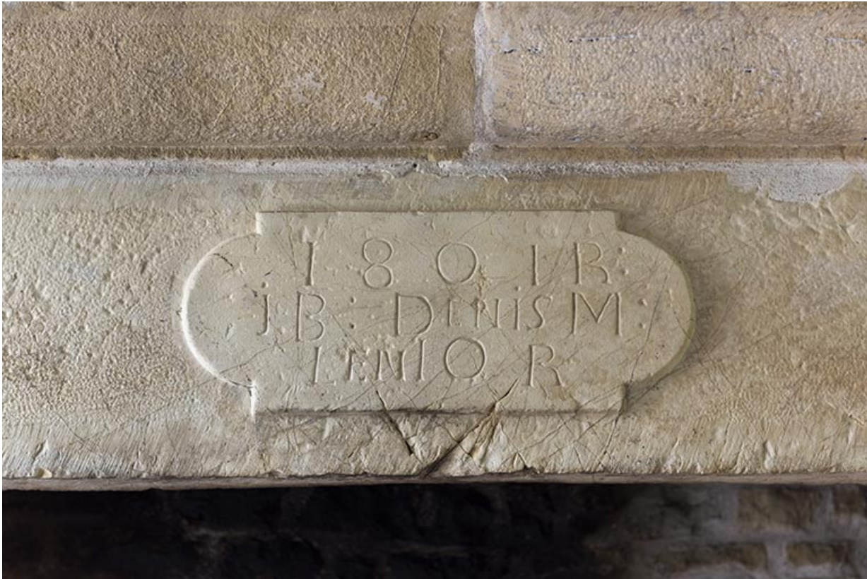
Détail sur le linteau de la cheminée.

70, Aisey-et-Richécourt, 1 rue de l' Église