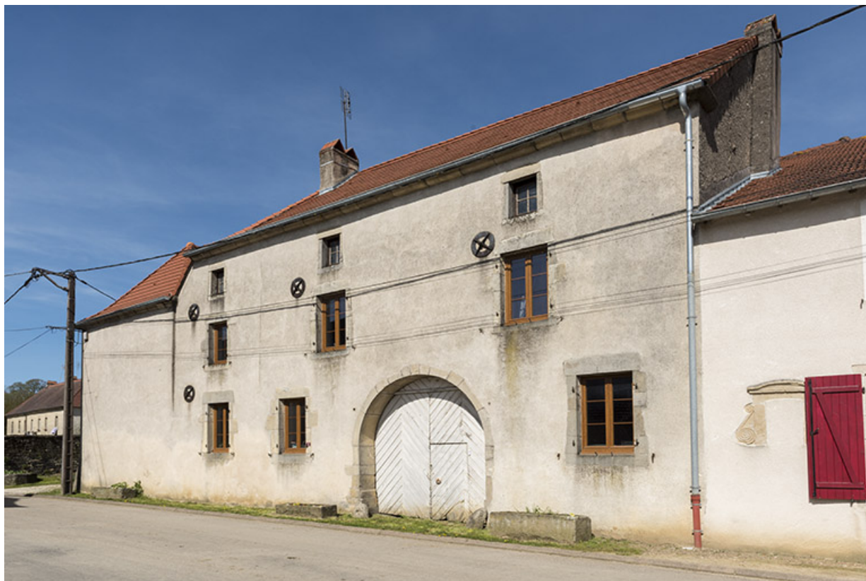
La façade sur rue avec la porte cochère.

70, Aisey-et-Richecourt, 1 rue de l' Église