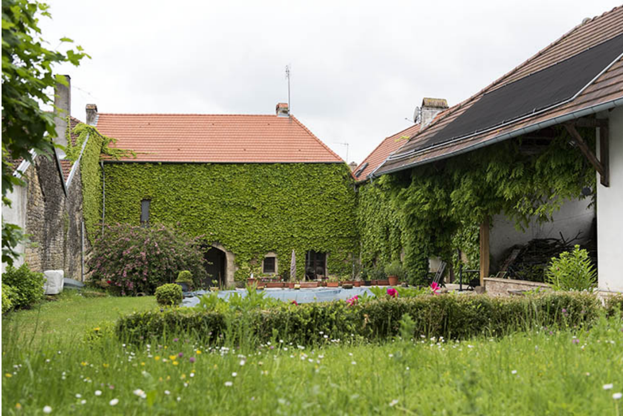
Vue générale de la cour intérieure.

70, Aisey-et-Richecourt, 1 rue de l' Église