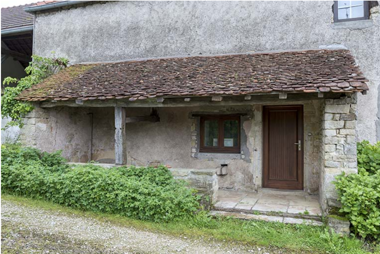
Auvent protégeant l'entrée.

70, Aisey-et-Richecourt, 1 rue de l' Église