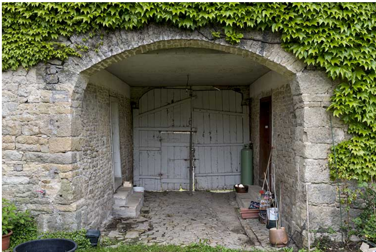
La porte cochère, cour intérieure.

70, Aisey-et-Richecourt, 1 rue de l' Église