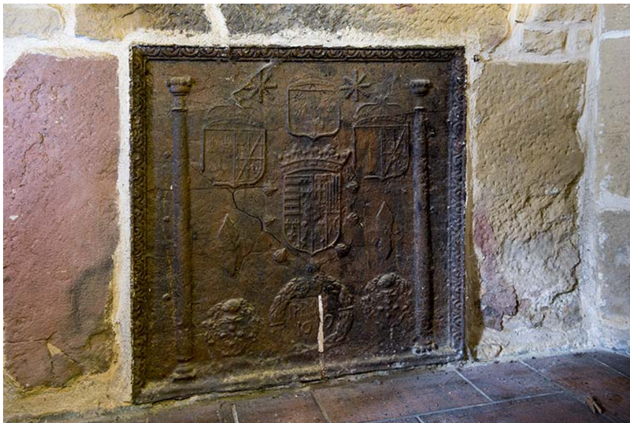
Plaque de cheminée dans la seconde ferme.

70, Aisey-et-Richecourt, 1 rue de l' Église