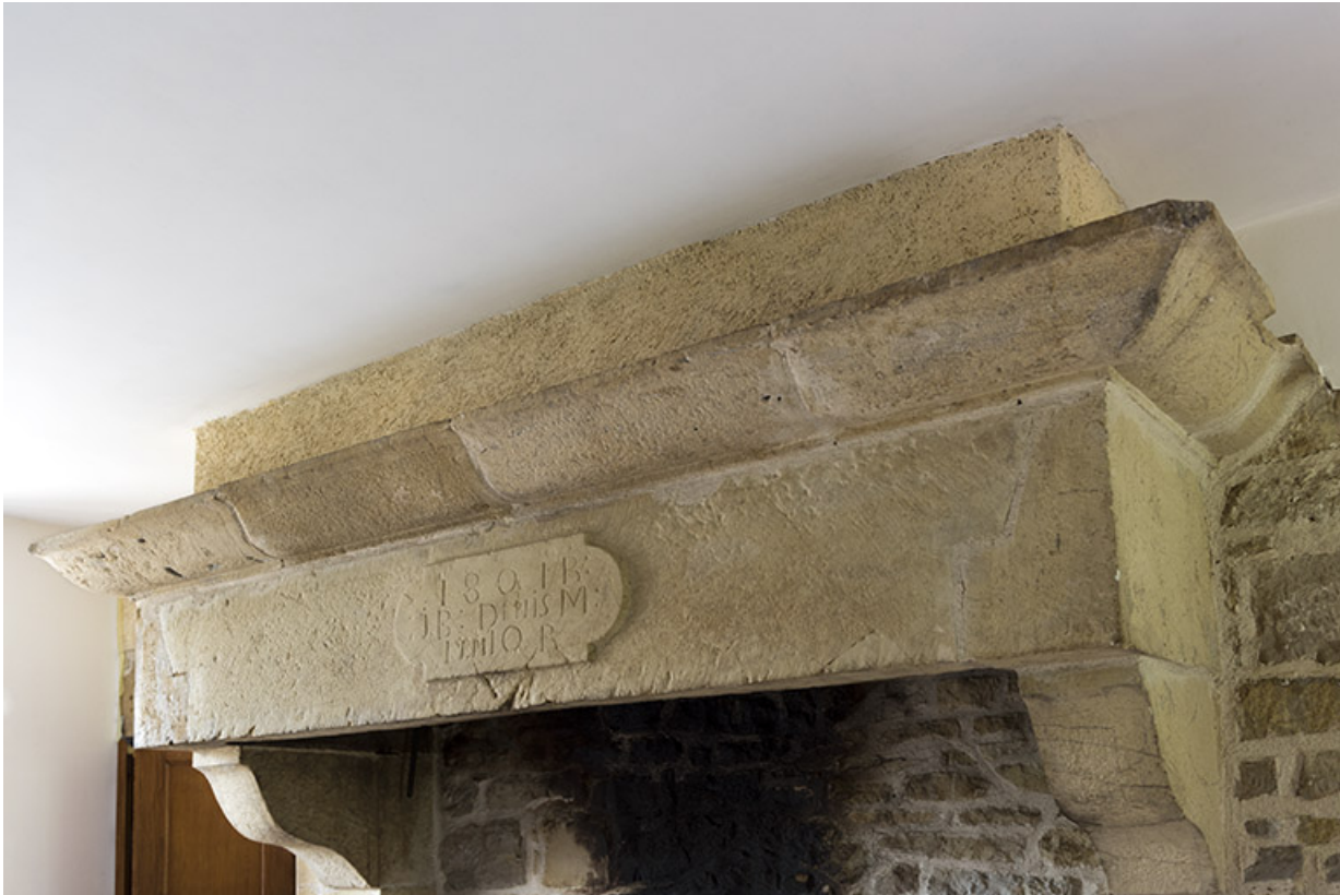
Cheminée dans la ferme côté rue.

70, Aisey-et-Richécourt, 1 rue de l' Église