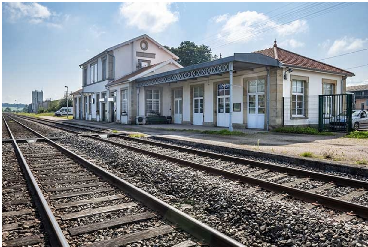
La gare, vue éloignée depuis les voies.