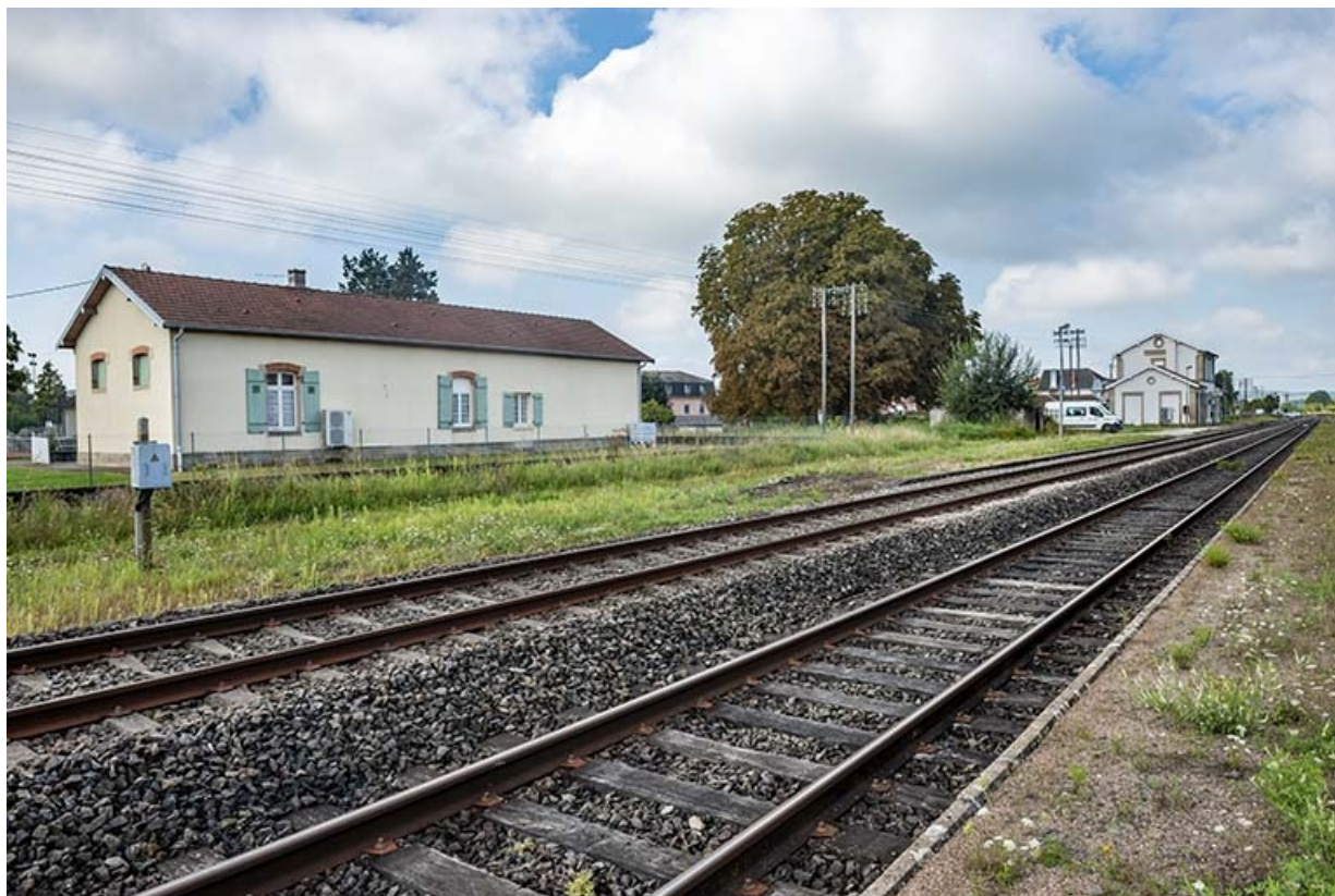
La maison, ancien bâtiment de bureau, vue éloignée.