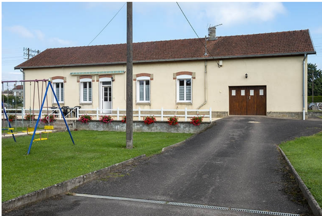
La maison, ancien bâtiment de bureau.