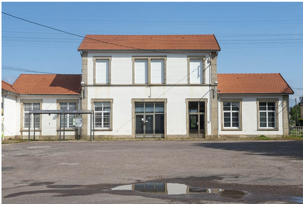
La gare, vue de face partielle.