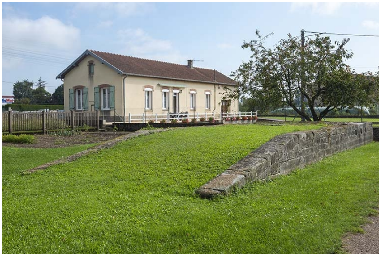
La maison, ancien bâtiment de bureau.