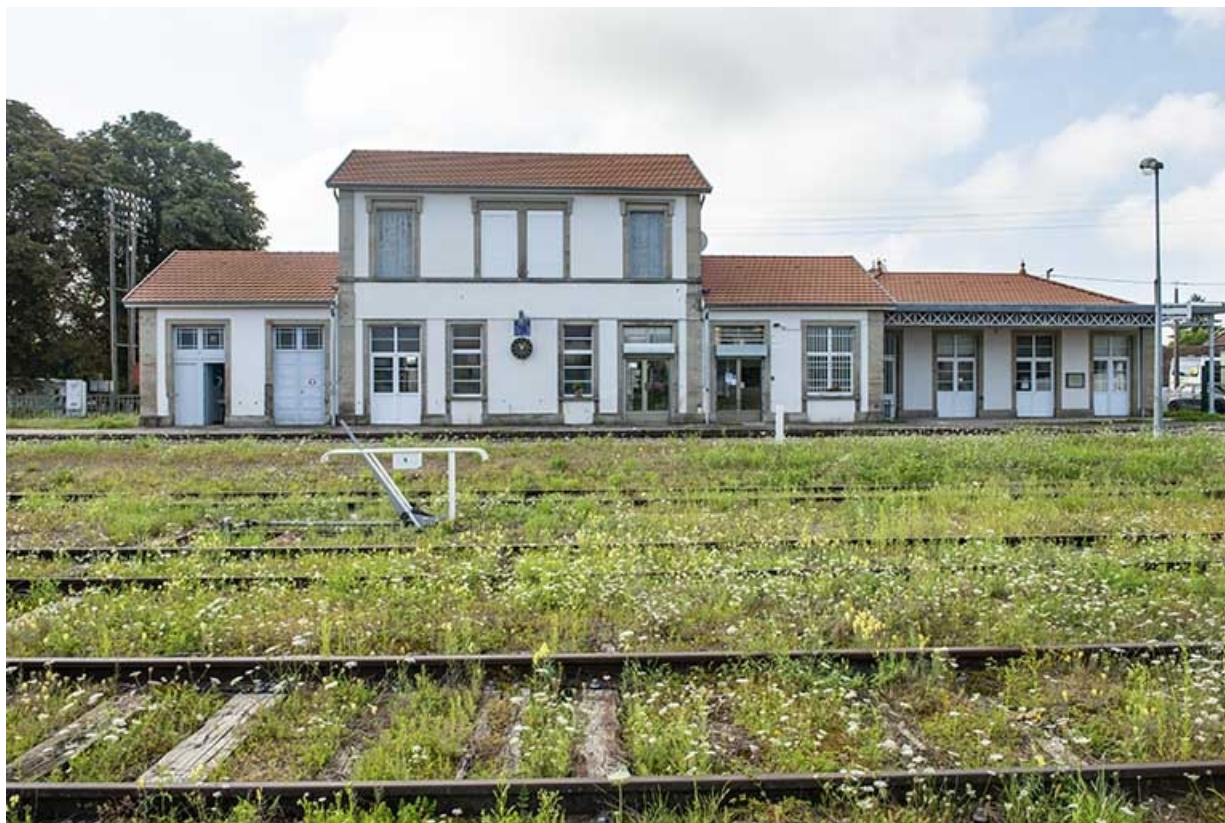
La gare, vue éloignée depuis les voies.