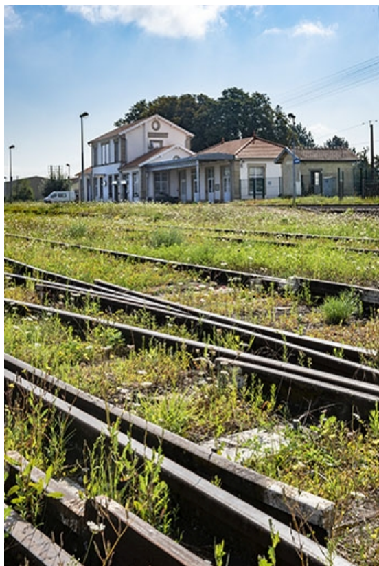
La gare, vue éloignée depuis les voies.