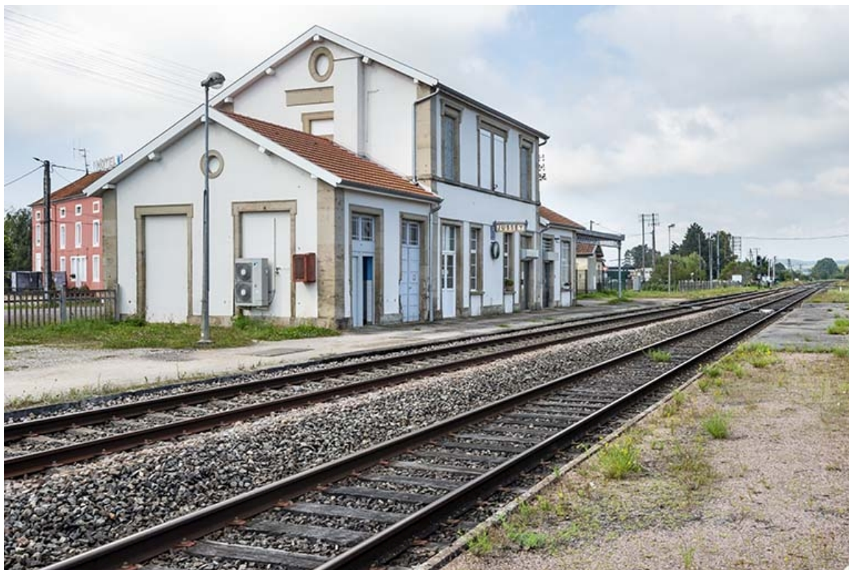
La gare, de trois quarts gauche.