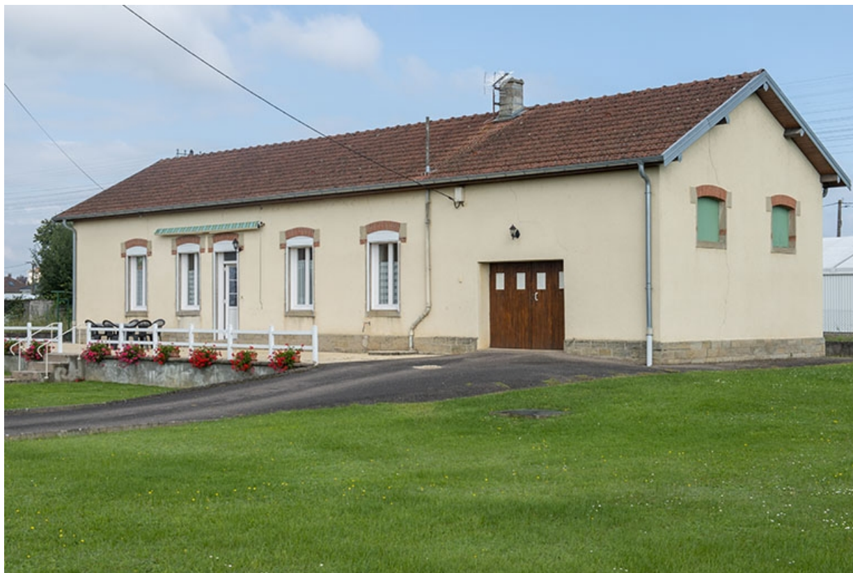
La maison, ancien bâtiment de bureau.