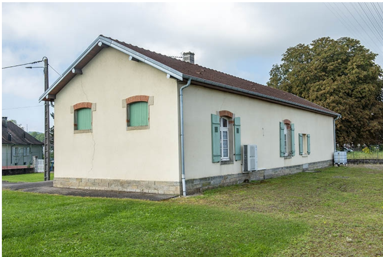
La maison, ancien bâtiment de bureau, façade postérieure.