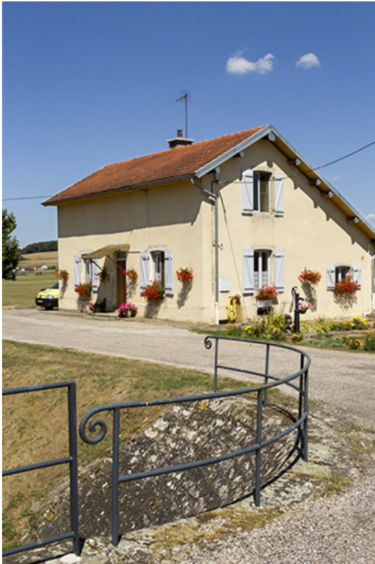
La maison, vue de profil.

70, Montureux-lès-Baulay, lieudit : la Prairie