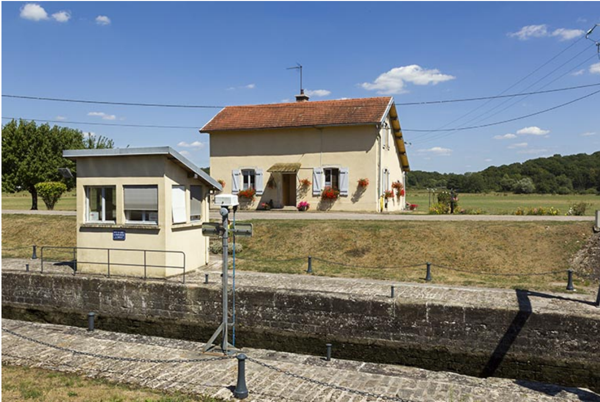
La maison d'éclusier, et le poste de commande au premier plan.

70, Montureux-lès-Baulay, lieudit : la Prairie