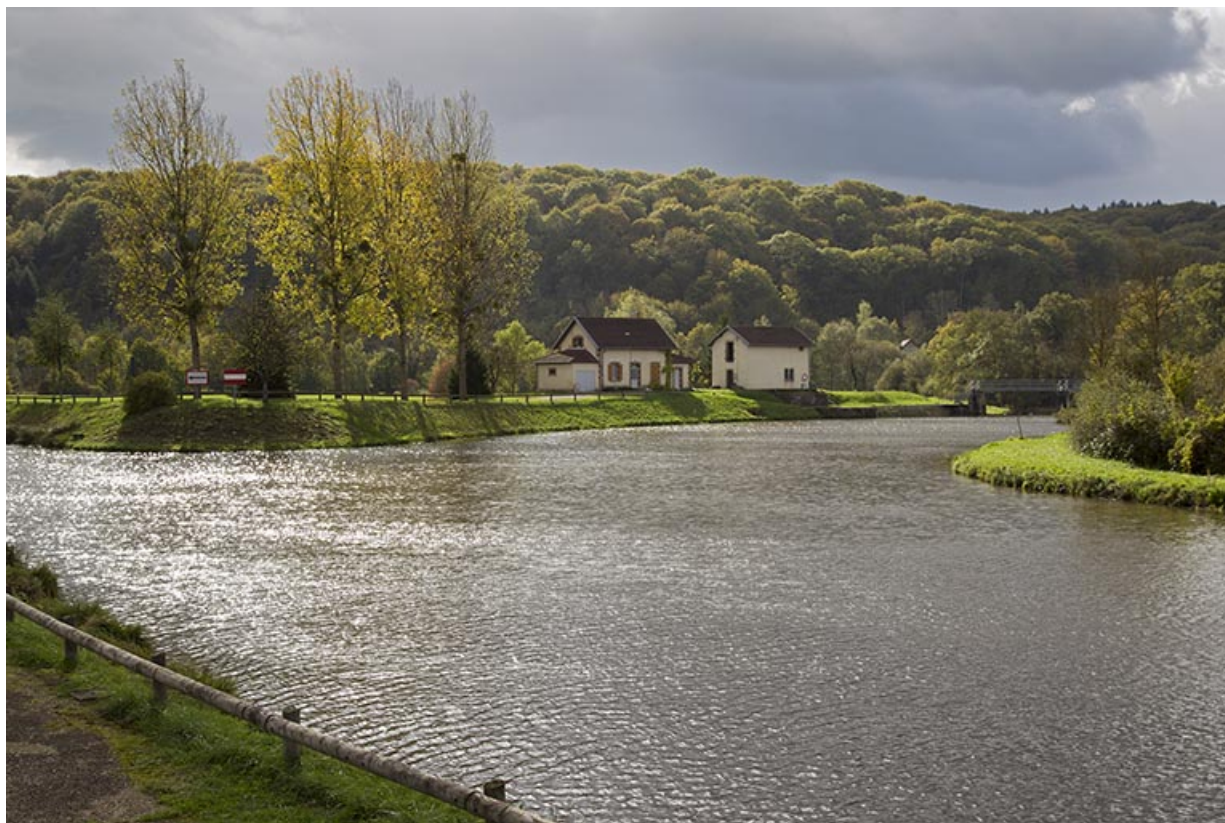
Entrée du canal de navigation et le site du barrage mobile.