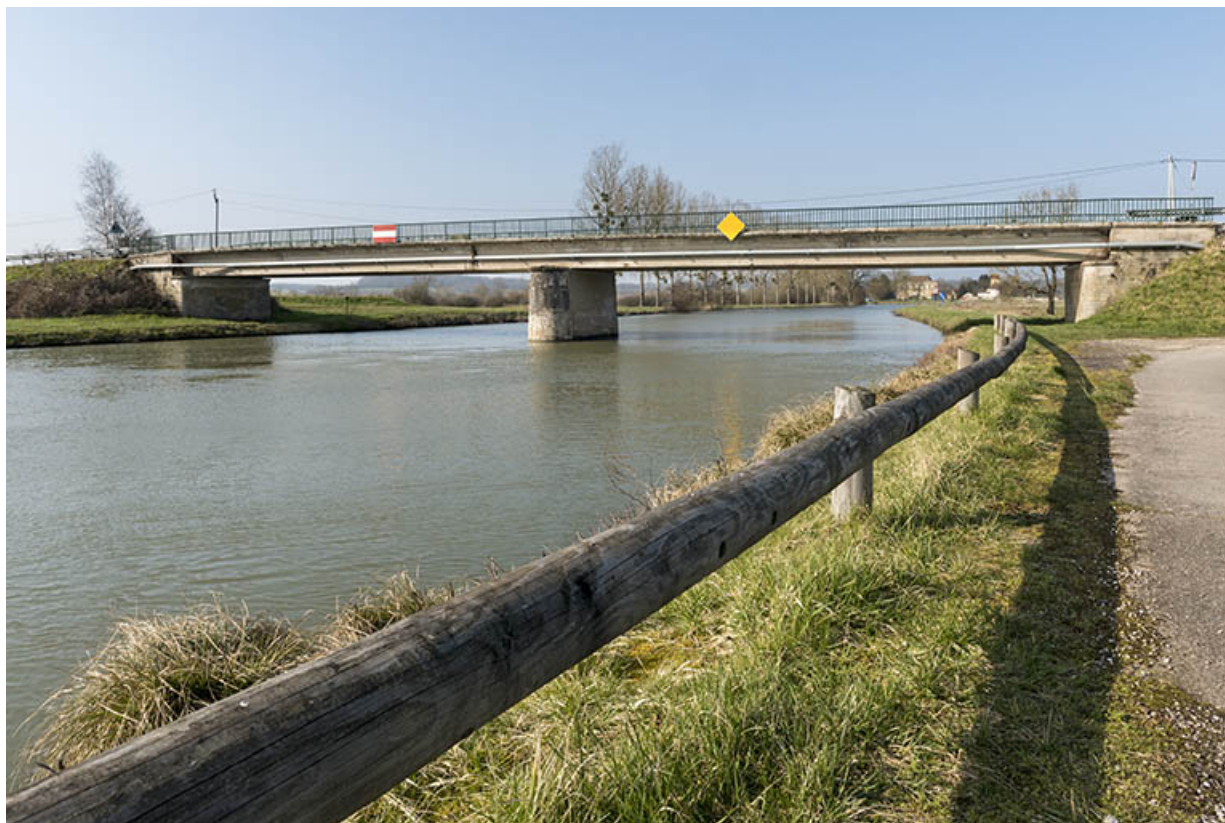
Pont routier franchissant la rivière.