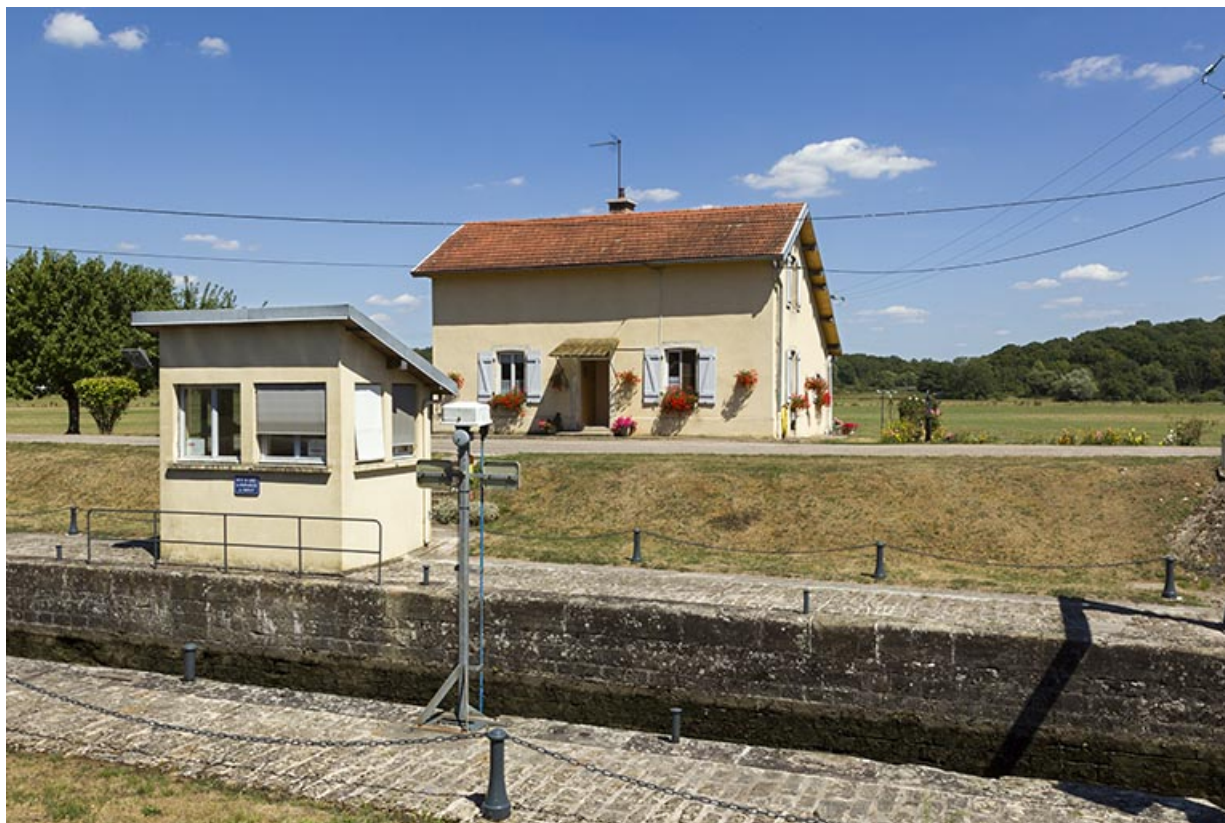
La maison d'éclusier, et le poste de commande au premier plan.

70, Montureux-lès-Baulay, lieudit : la Prairie