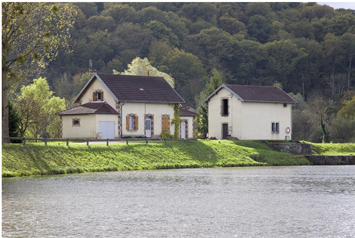
Maison du barragiste et le magasin à aiguilles.