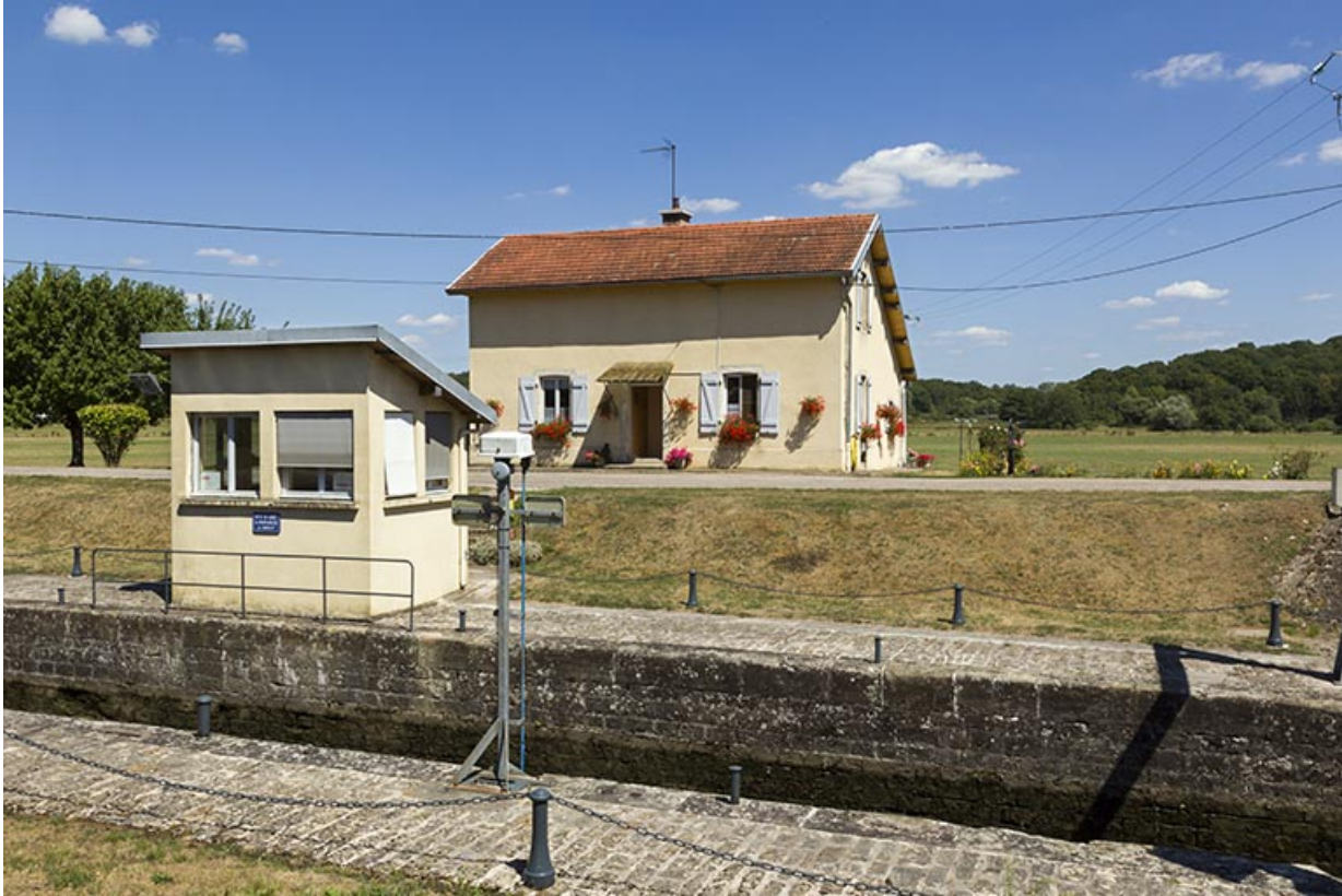
La maison d'éclusier, et le poste de commande au premier plan.

70, Montureux-lès-Baulay, lieudit : la Prairie