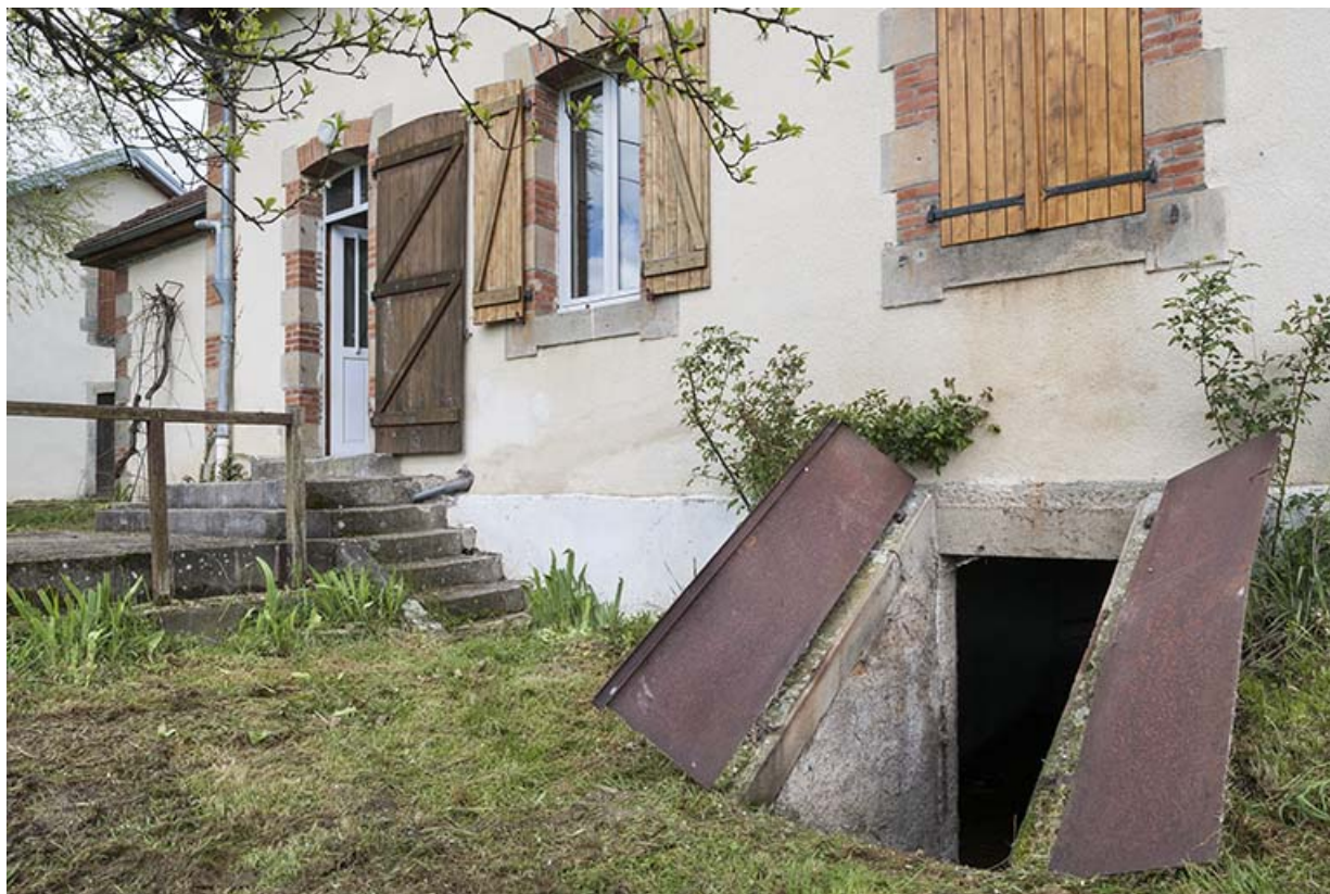
Vue générale sur la façade postérieure de la maison.