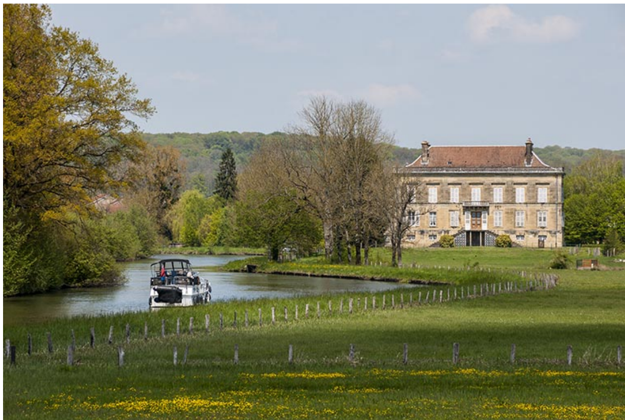
Le château, longé par la Saône. 70, Montureux-lès-Baulay