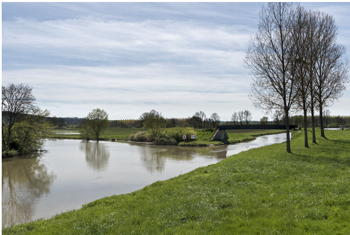
Jonction de la première dérivation et de la rivière en aval.