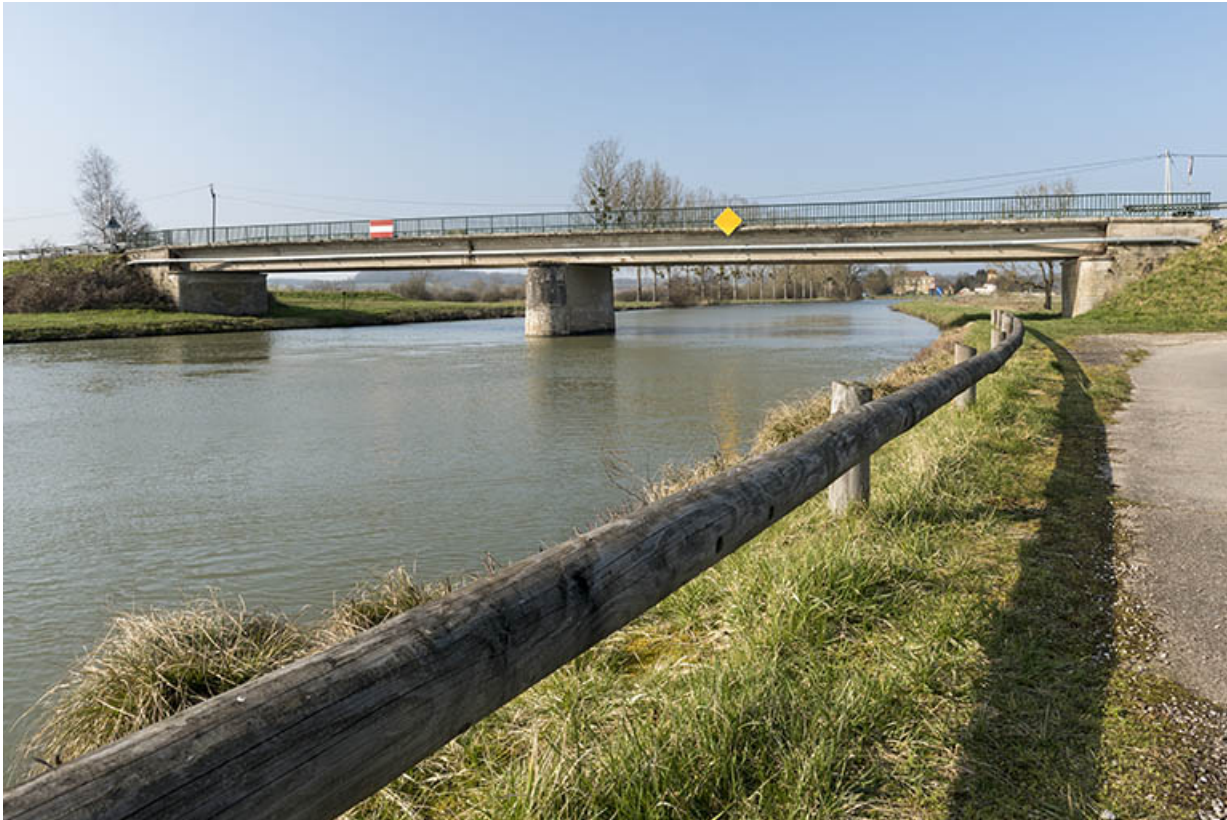
Pont routier franchissant la rivière.