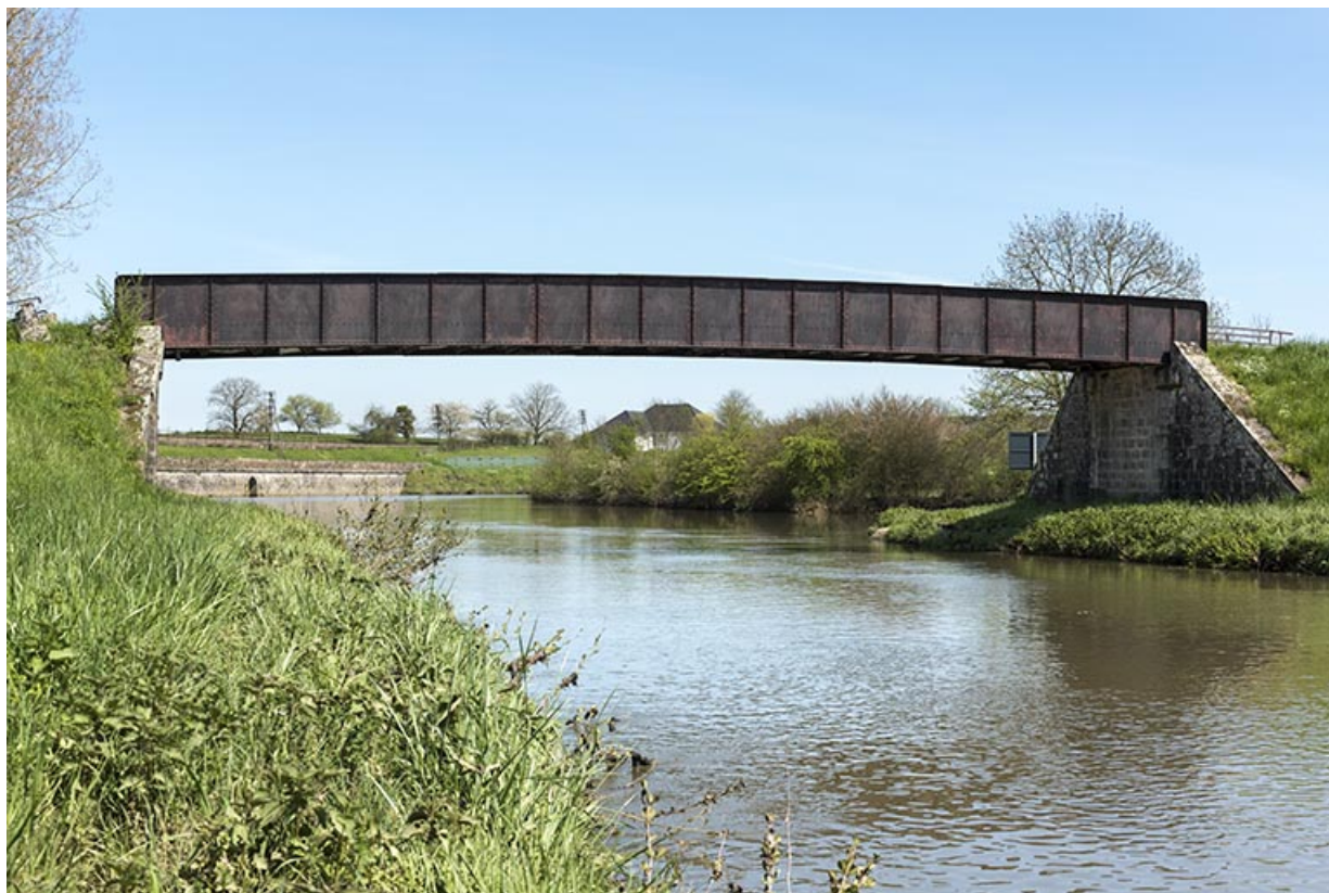
Pont permettant de franchir la première dérivation non éclusée du bief. 70, Montureux-lès-Baulay