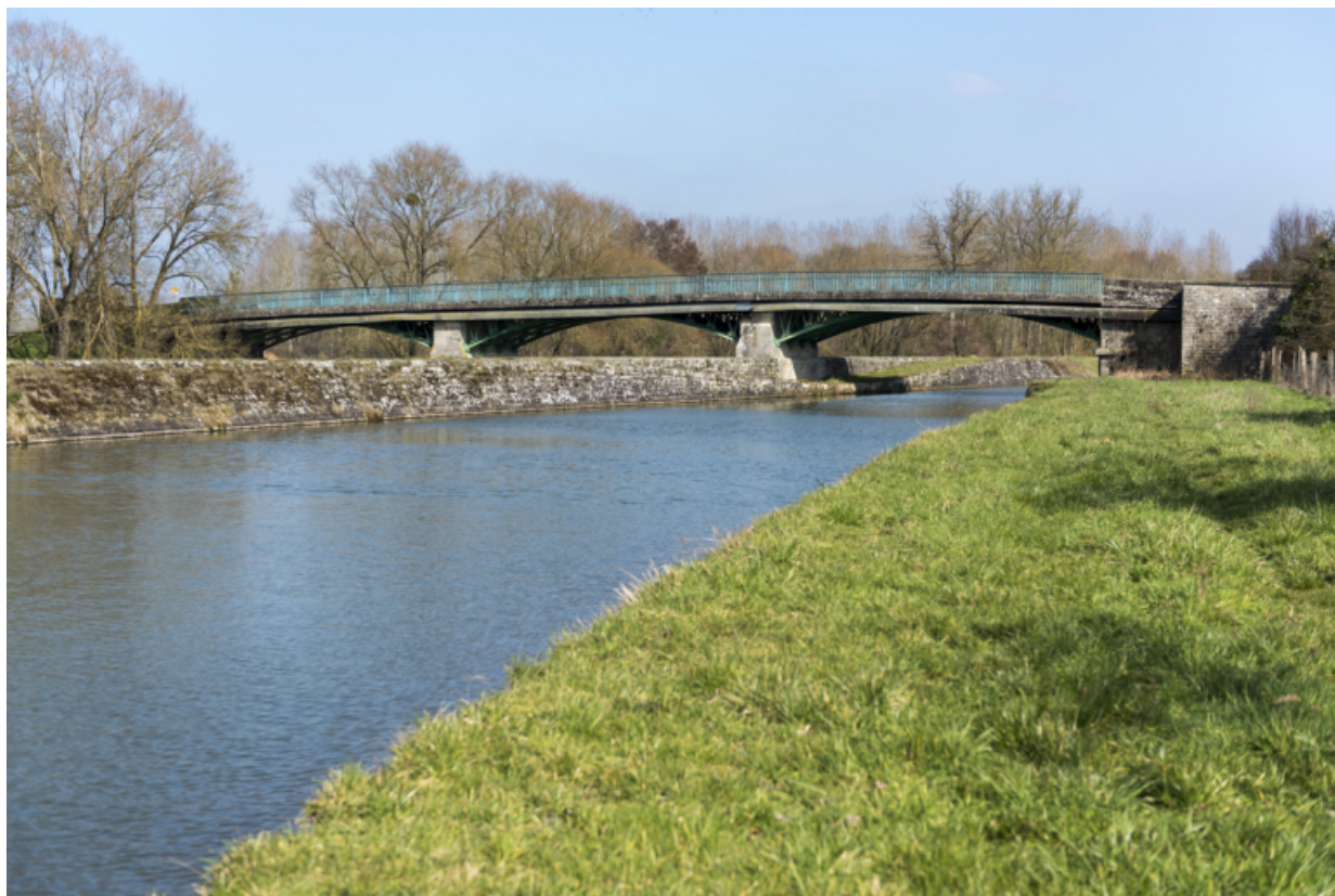
Vue depuis l'aval