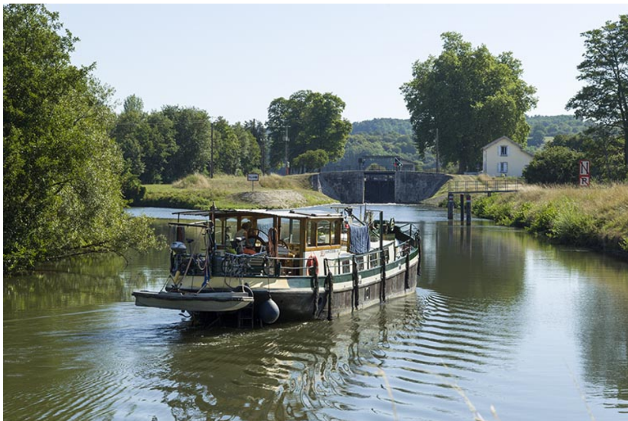
Bâteau en aval du bief.