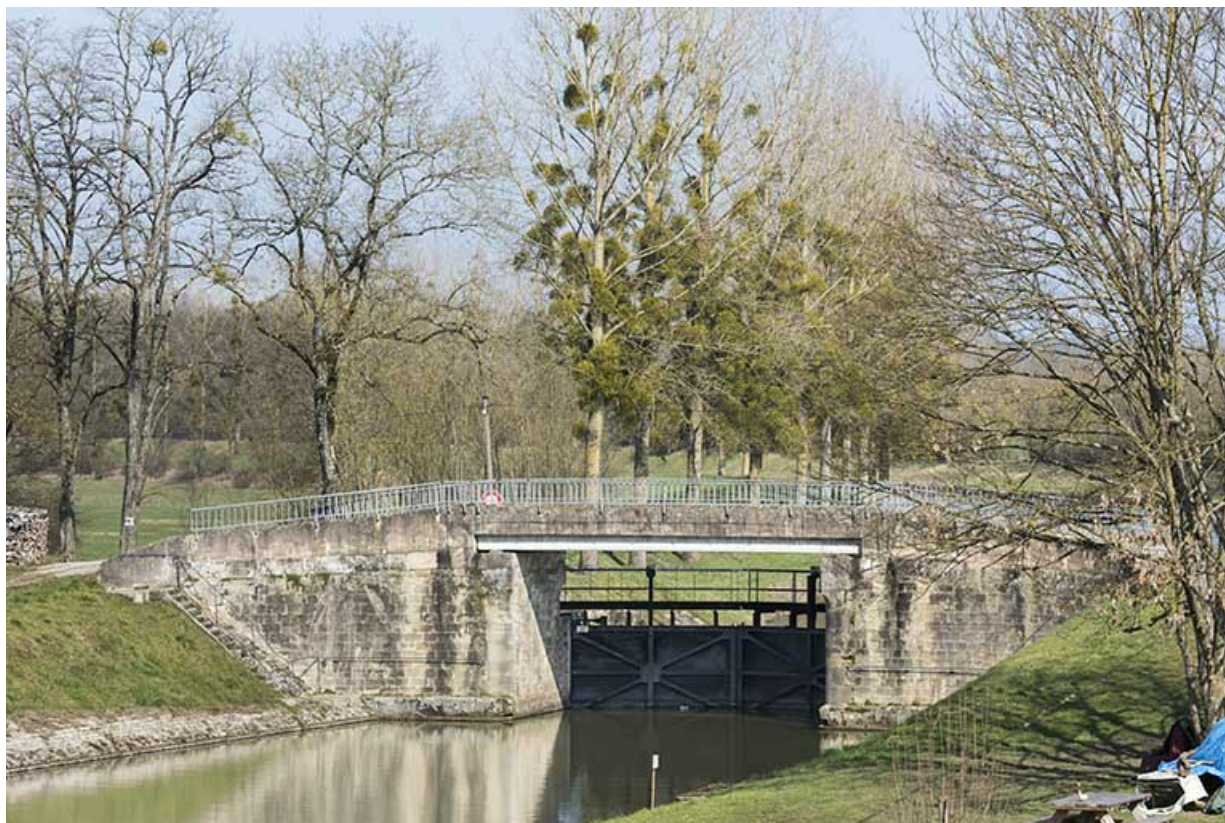
La porte de garde.