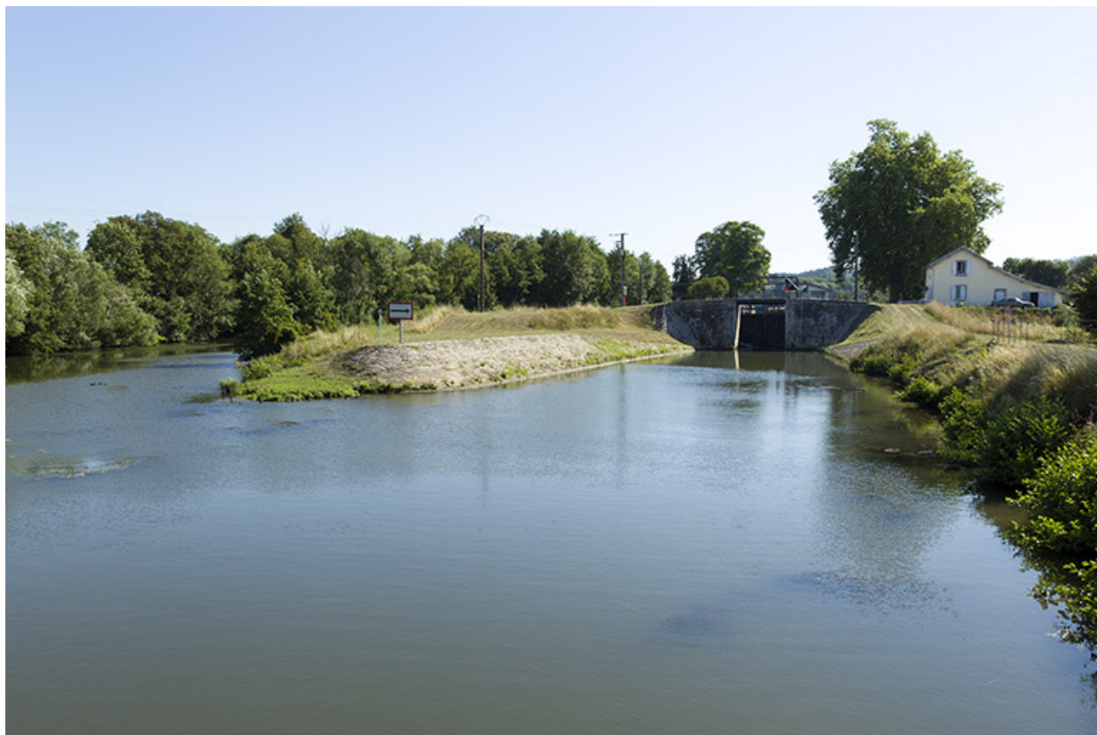
Fin de la dérivation d'Ormoy et début du bief de Cendrecourt.