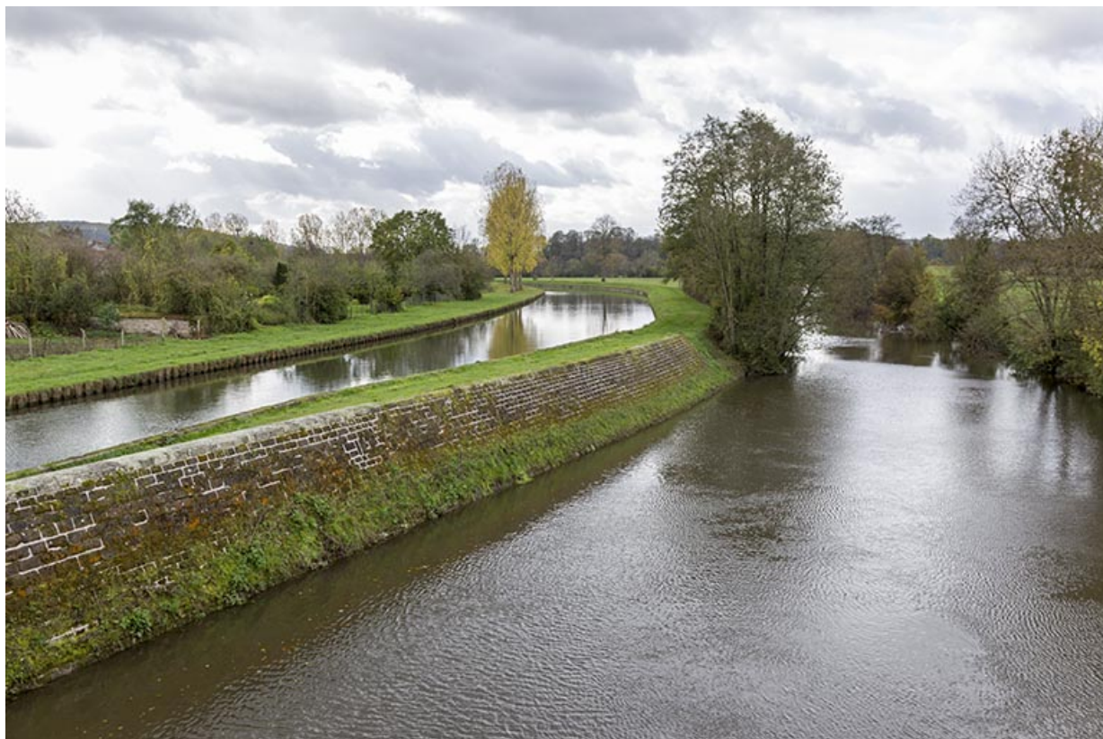
La sône et le canal de navigation.