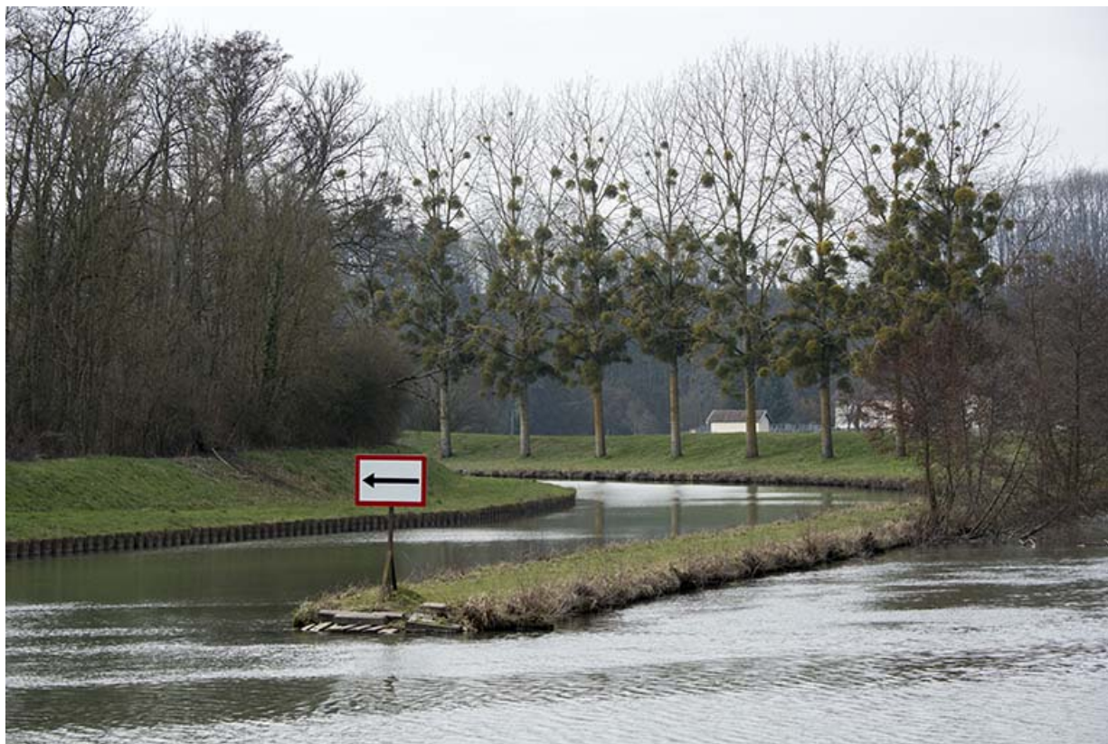
Entrée du canal de navigation d'Ormoy. 70, Ormoy