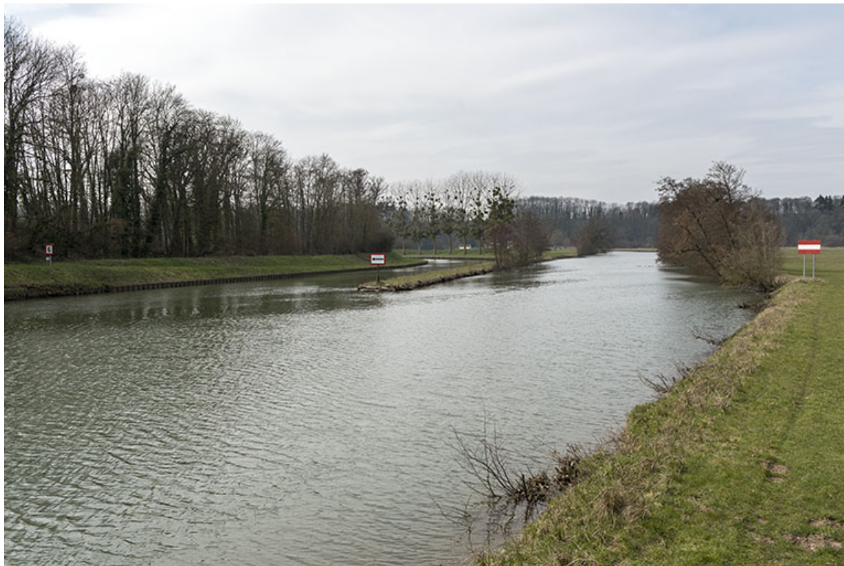
La sône et l'entrée de la dérivation.