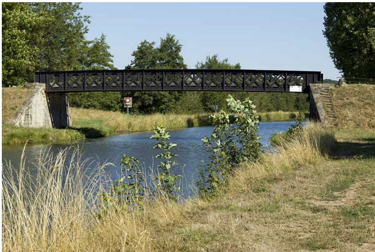
Le pont depuis l'aval.