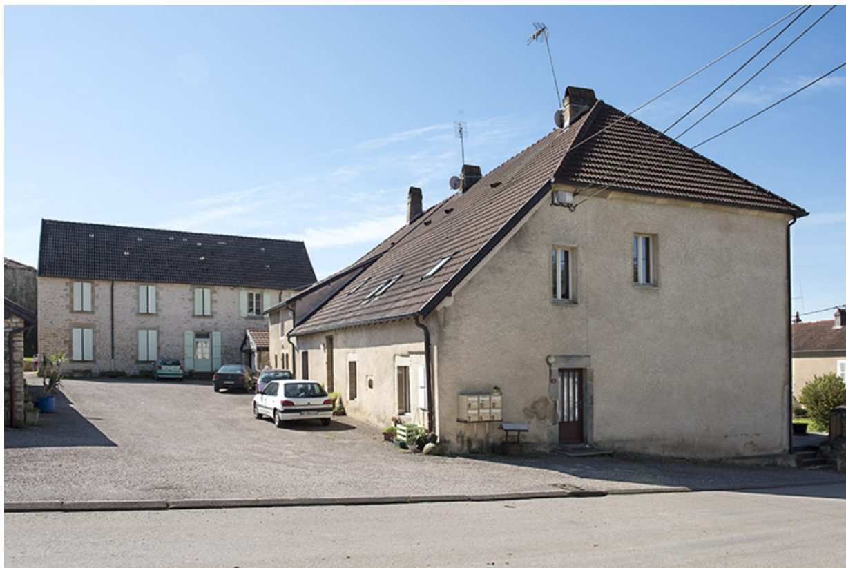
Vue d'ensemble depuis la voie publique.

70, Aisey-et-Richecourt rue du Petit Mont