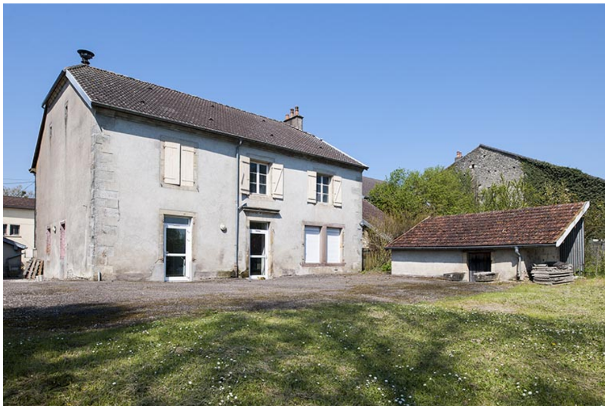
Vue d'ensemble de la façade postérieure avec les anciens cabinets d'aisance. 70, Montureux-lès-Baulay, 10 Grande Rue