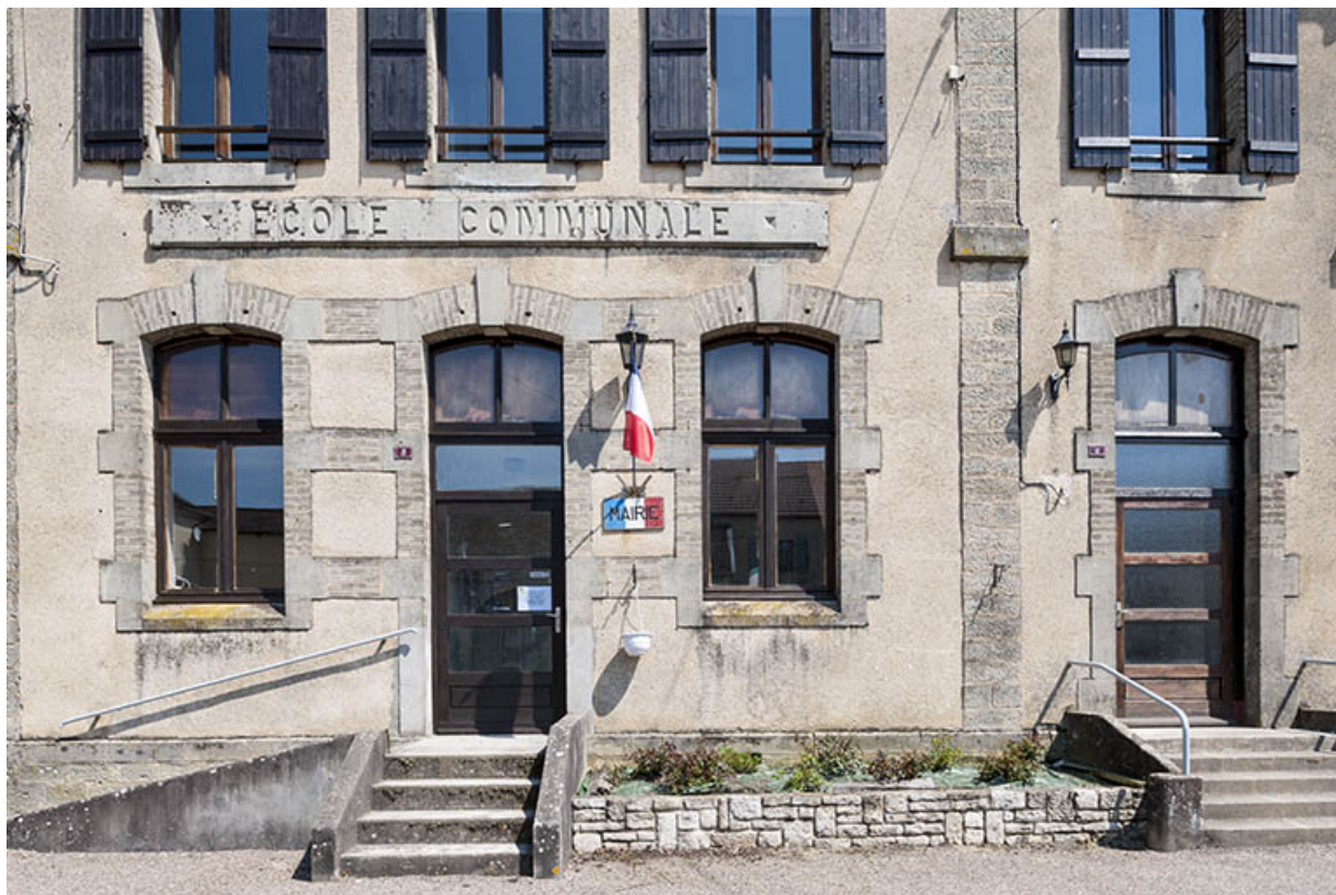
Vue de détail, rez-de-chaussée de la façade principale.