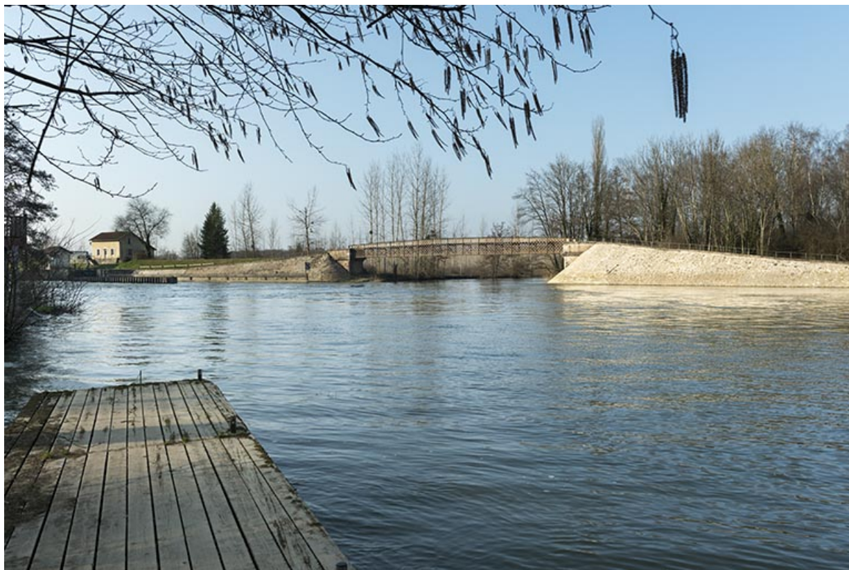
Passerelle sur la Lanterne, au confluent avec la Saône, vue de la rive droite en aval. 70, Conflandey