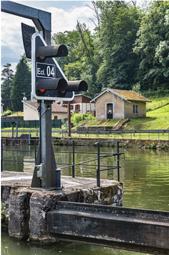
Le panneau de signalisation de l'écluse et le magasin à aiguilles du barrage. 70, Conflandey