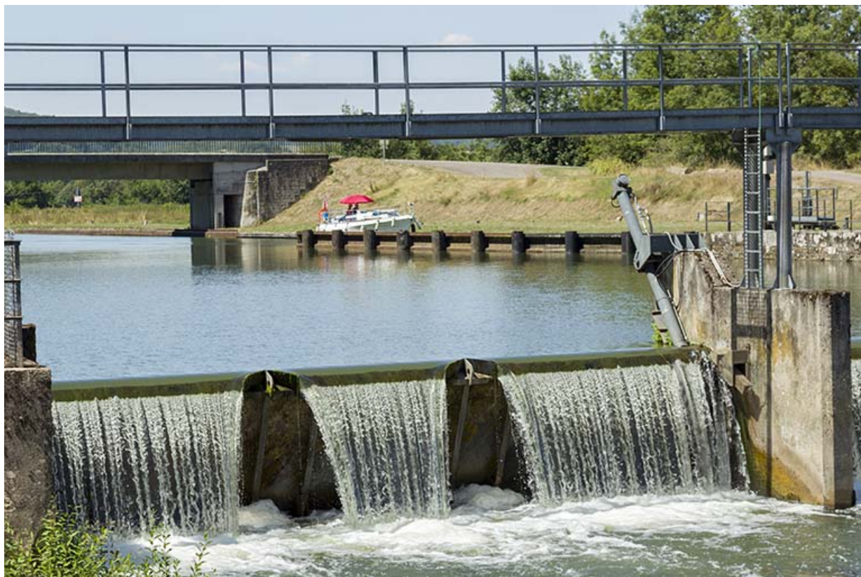
Barrage de Conflandey, vue rapprochée de la rive droite en aval. 70, Conflandey