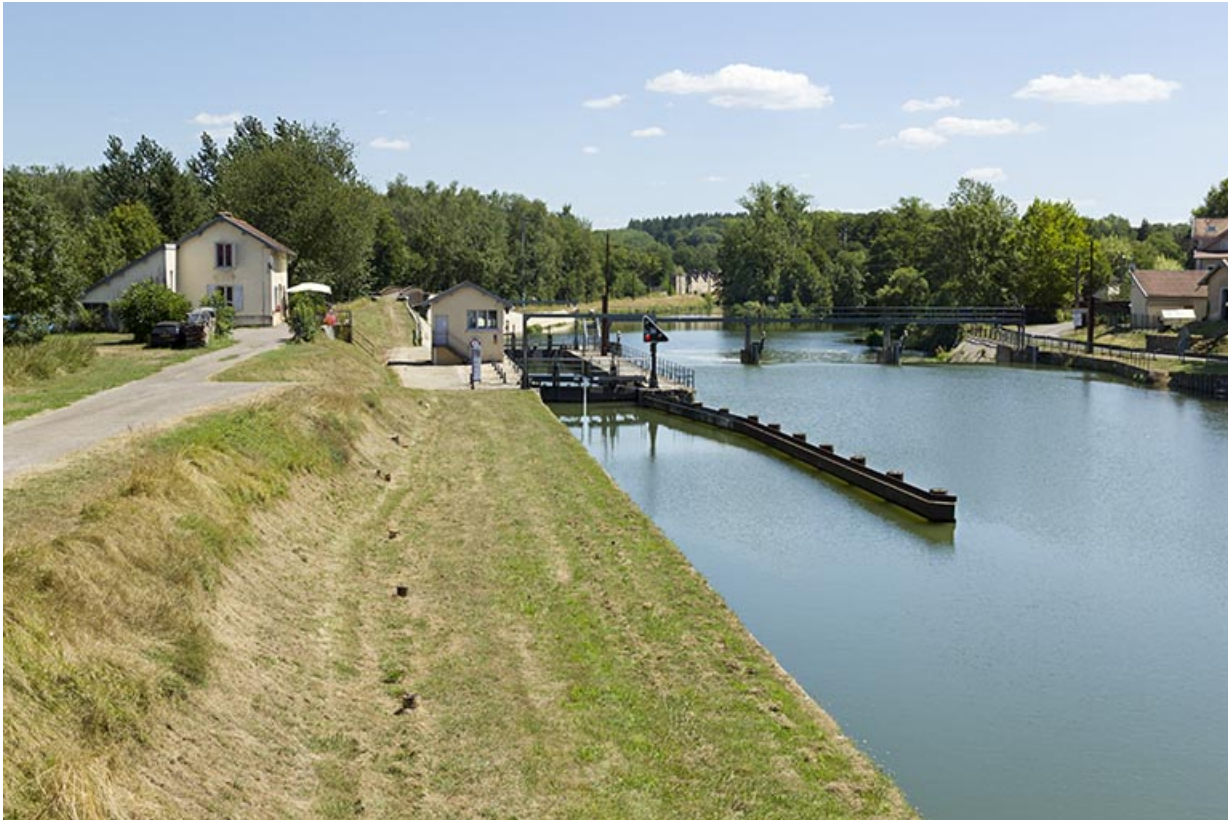
Depuis la rive gauche, en amont, vue du site : barrage et écluse. 70, Conflandey