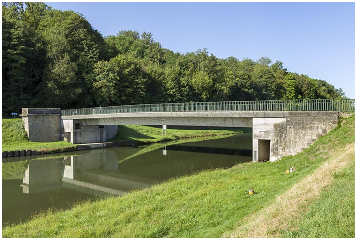
Pont de la D152 enjambant le canal.