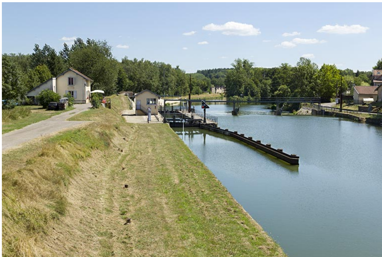
Depuis la rive gauche, en amont, vue du site : barrage et écluse. 70, Conflandey