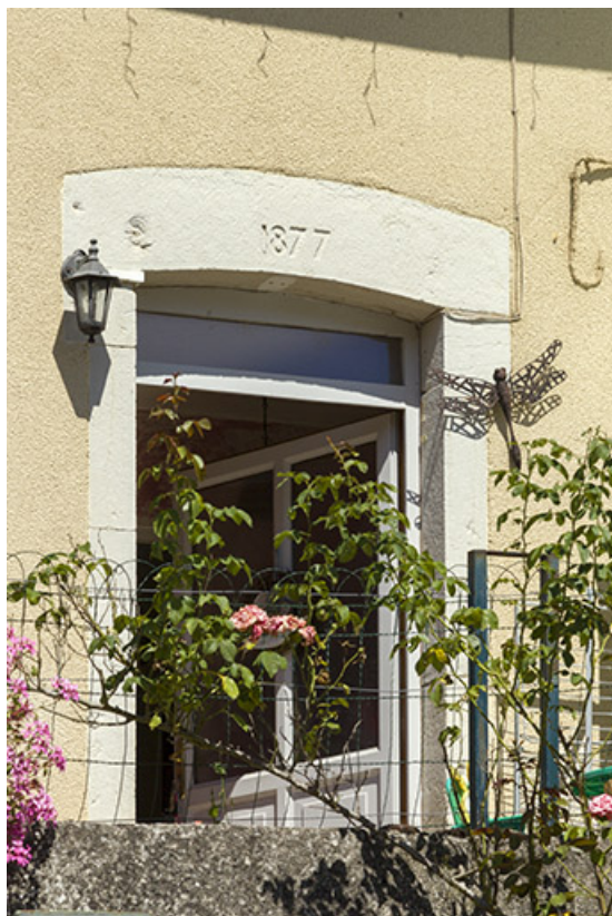
Détail de la date portée sur le linteau de la baie d'entrée : 1877.