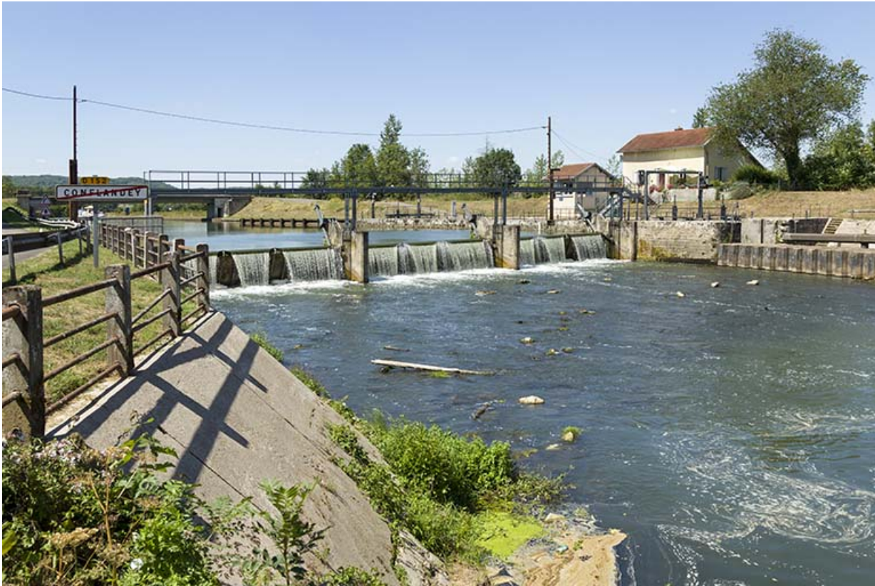
Barrage de Conflandey vu de la rive droite en aval.