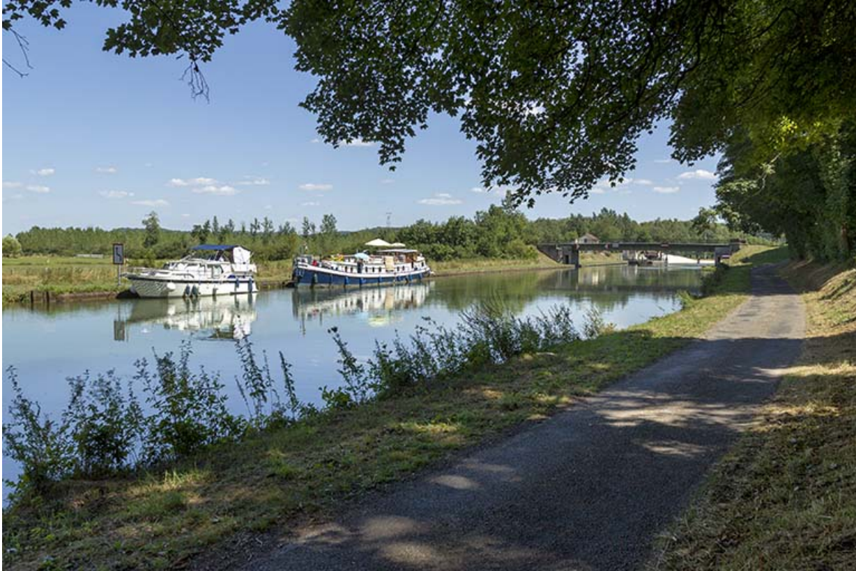
Vue éloignée du site d'écluse en amont du pont depuis la rive droite. 70, Conflandey