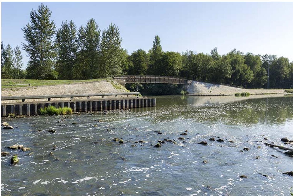
Passerelle sur la Lanterne, au confluent avec la Saône, vue de la rive droite en amont. 70, Conflandey