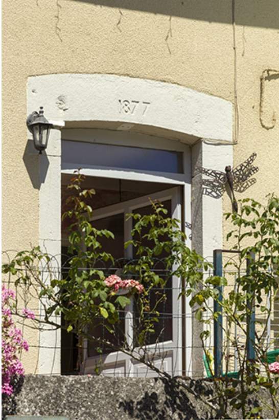
Détail de la date portée sur le linteau de la baie d'entrée : 1877.