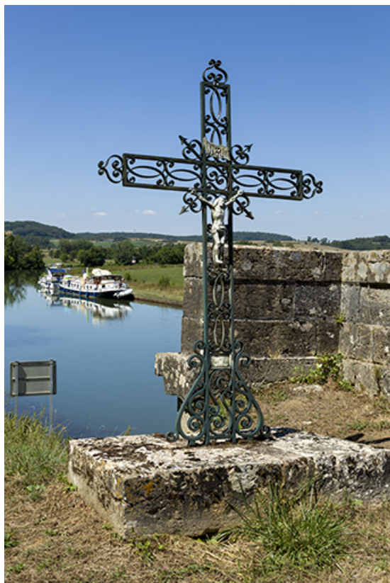
Croix de chemin à proximité du pont de la départementale. 70, Conflandey