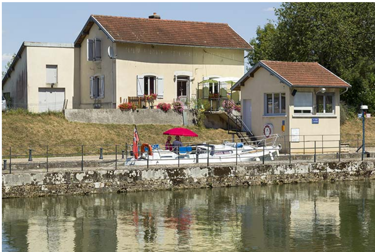
Vue de trois-quart sud-ouest de la maison d'éclusier et du poste de commande. 70, Conflandey