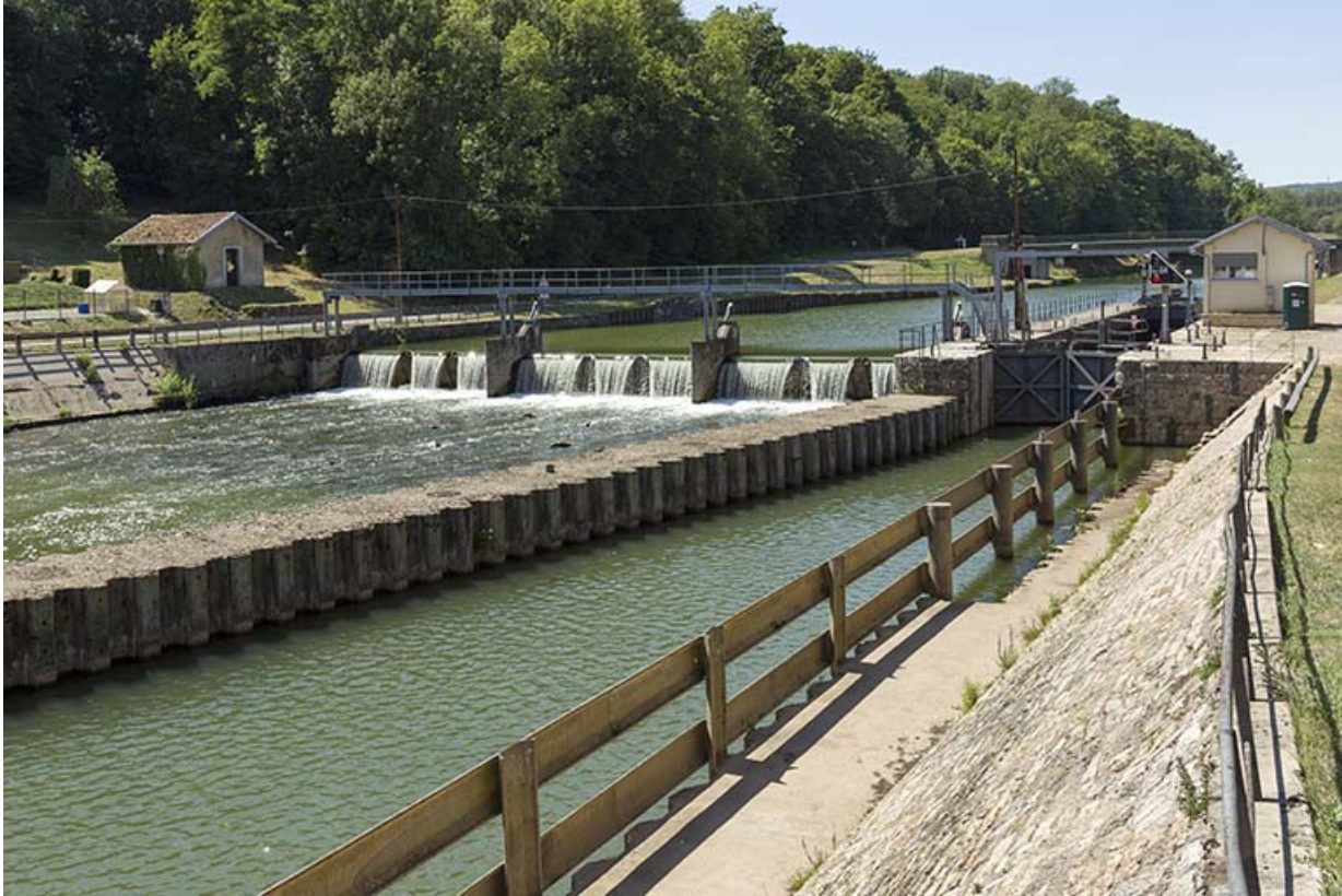
Depuis la rive gauche, en aval, vue sur le barrage, le site d'écluse, le poste de commande. 70, Conflandey