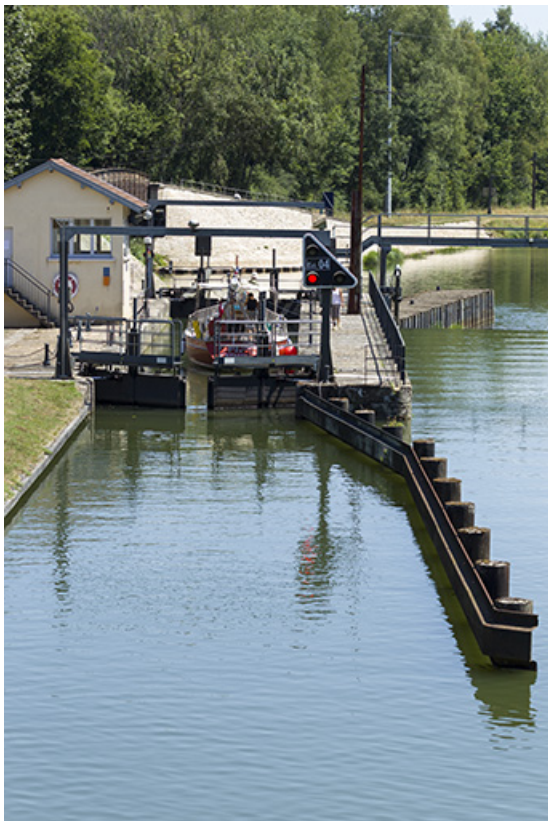
Un bateau avalant dans le sas de l'écluse vue d'amont. 70, Conflandey