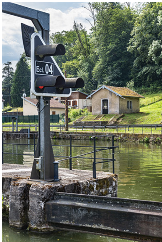
Le panneau de signalisation de l'écluse et le magasin à aiguilles du barrage. 70, Conflandey