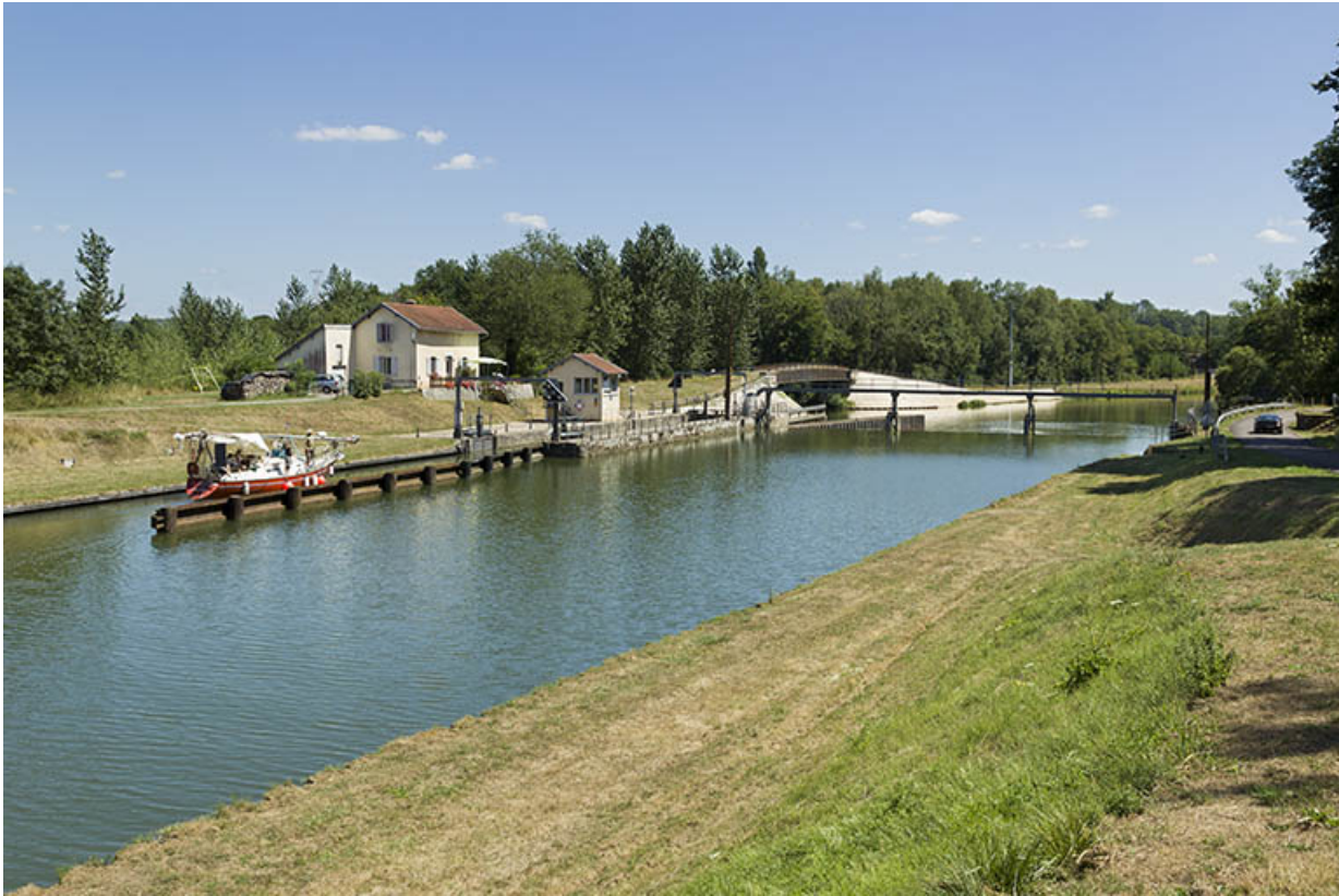
Depuis la rive droite, en amont, vue du site : barrage et écluse. 70, Conflandey