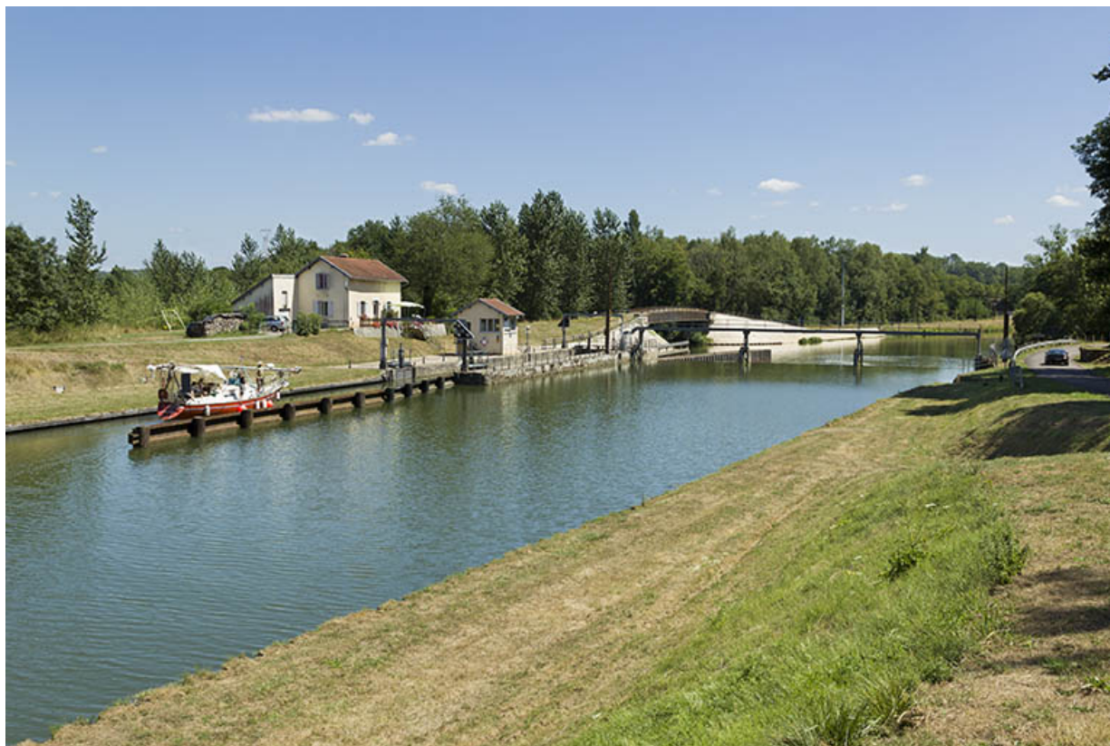
Depuis la rive droite, en amont, vue du site : barrage et écluse. 70, Conflandey