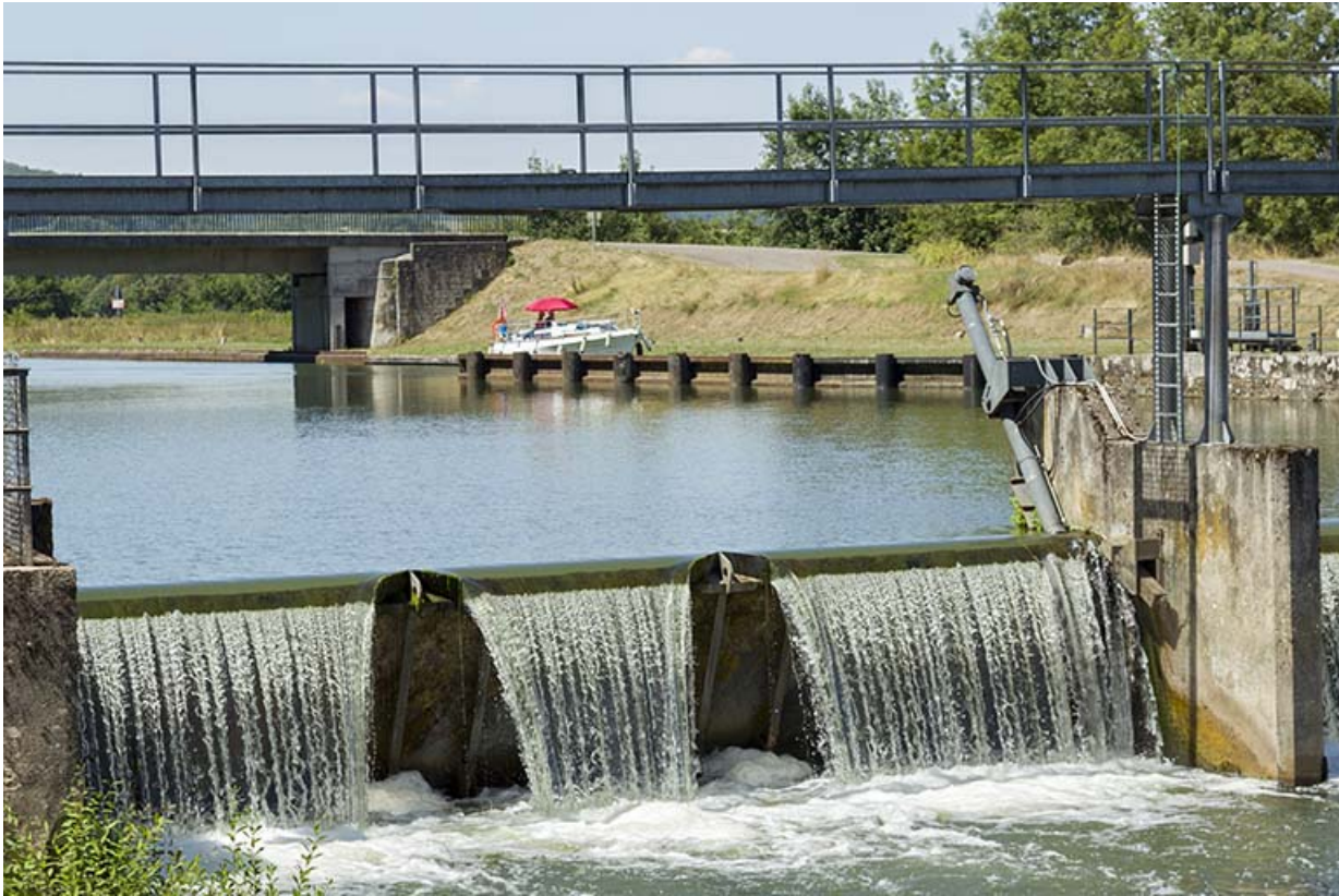
Barrage de Conflandey, vue rapprochée de la rive droite en aval.