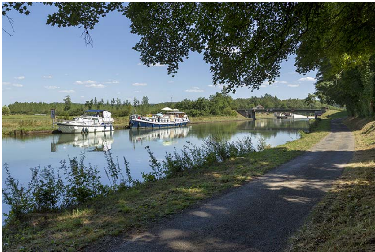
Vue éloignée du site d'écluse en amont du pont depuis la rive droite. 70, Conflandey