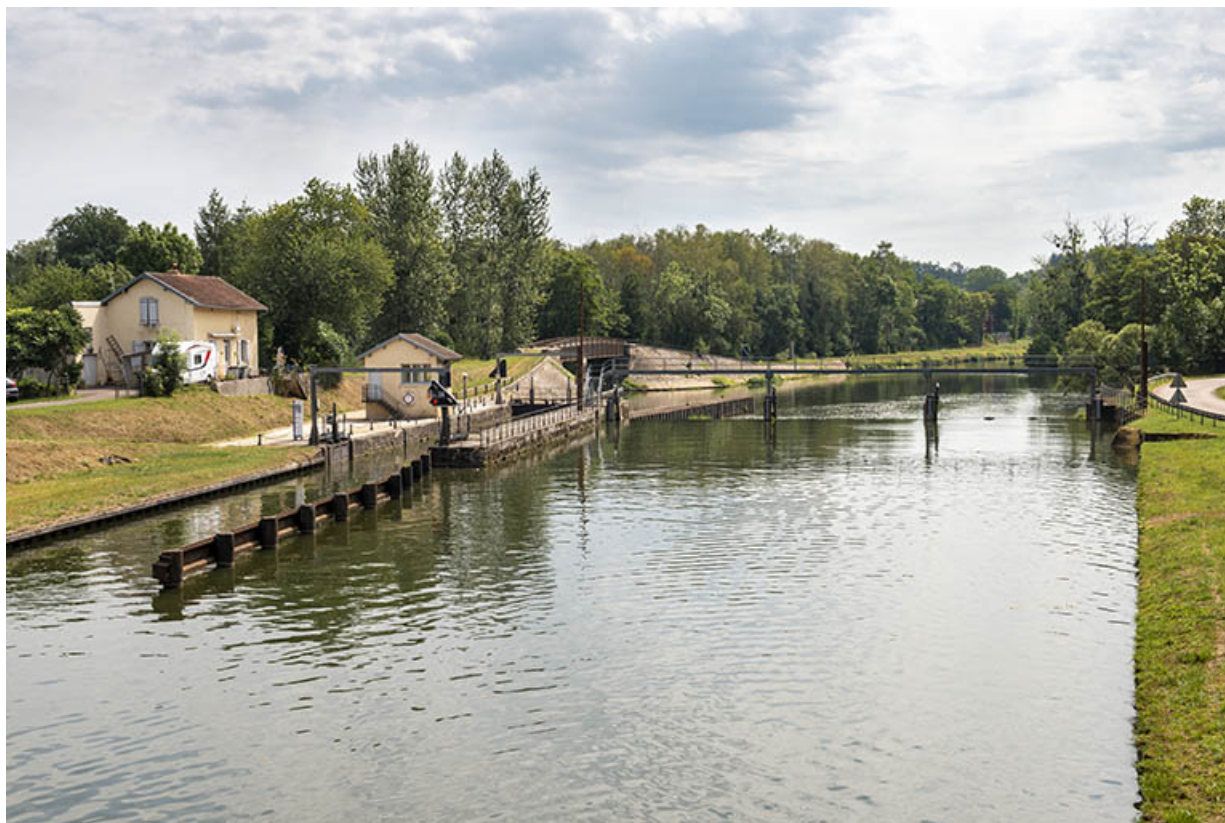
Le site d'écluse. 70, Conflandey