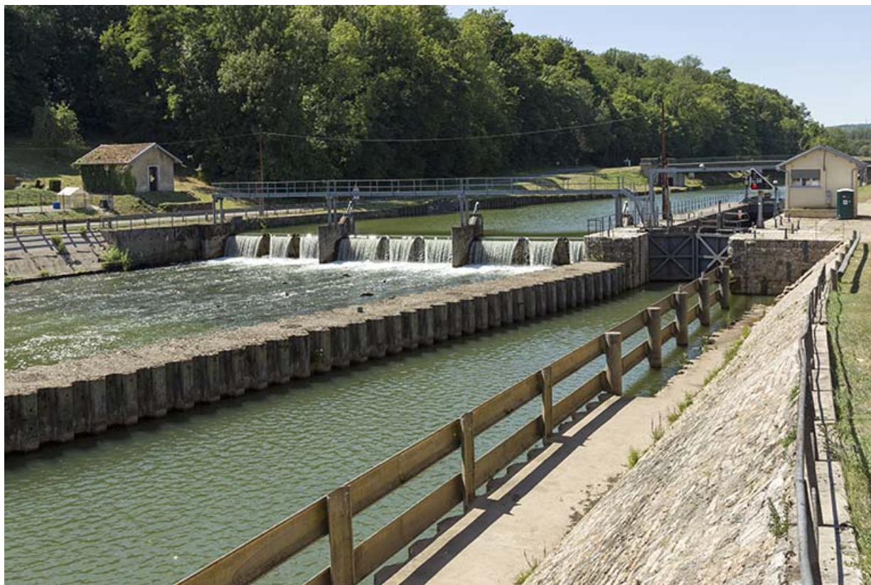
Depuis la rive gauche, en aval, vue sur le barrage, le site d'écluse, le poste de commande. 70, Conflandey