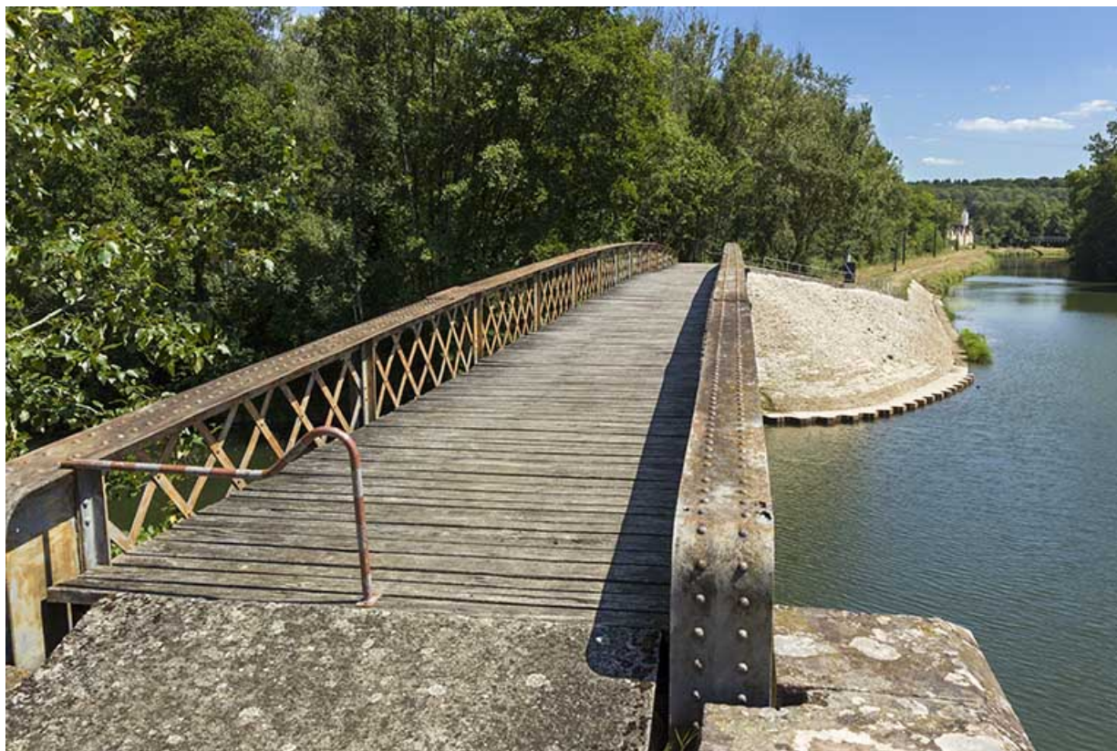
Jouxtant l'écluse en aval, passerelle enjambant La Lanterne. 70, Conflandey