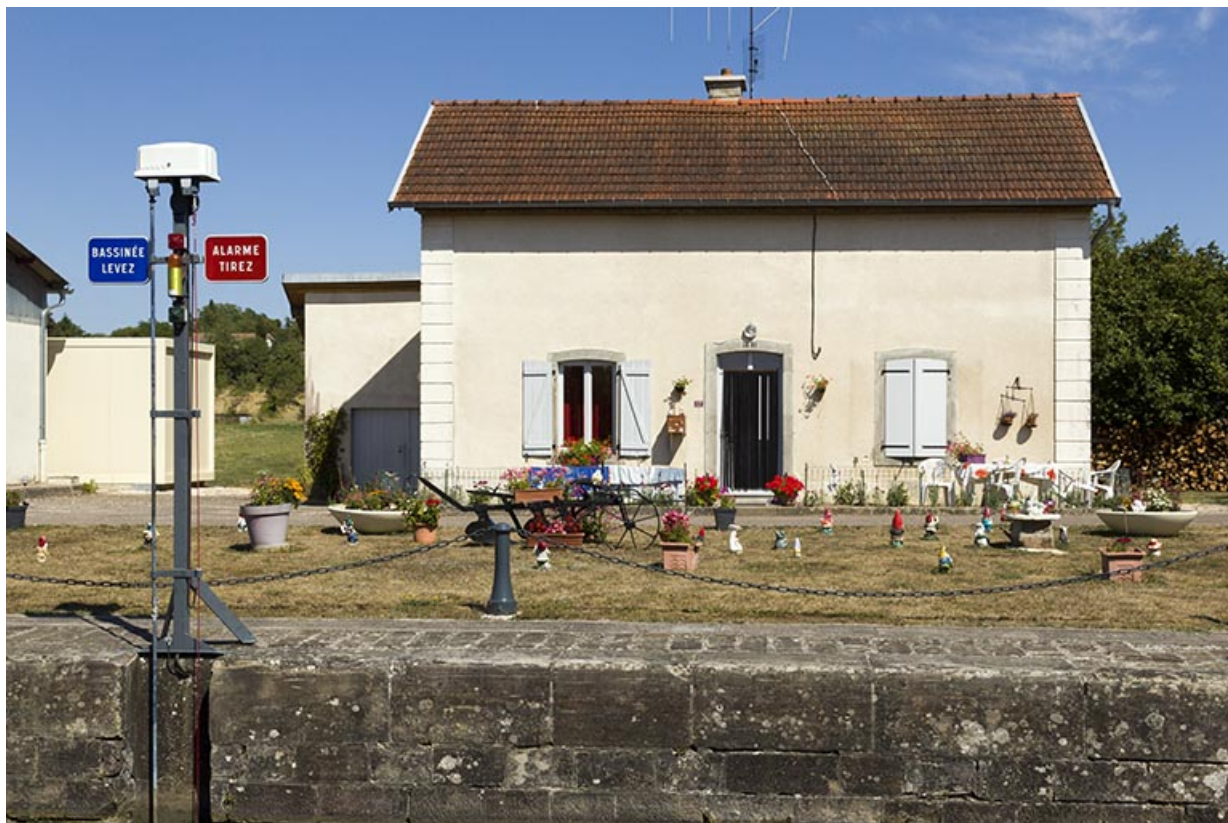
Vue depuis la rive droite de la façade antérieure de la maison d'éclusier et de son jardin d'agrément.