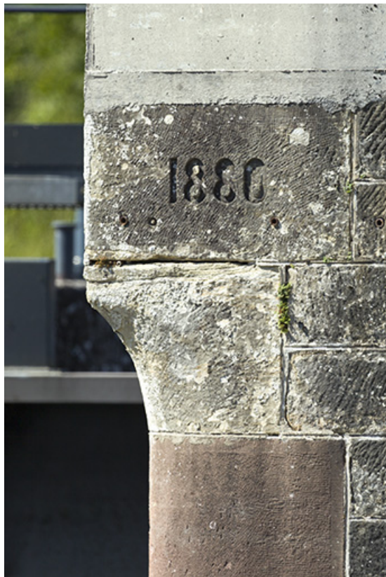
Date portée 1880 dans la maçonnerie (aval).