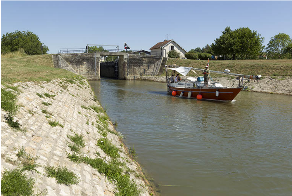
Vue de l'écluse et d'un bateau avalant, depuis l'aval.