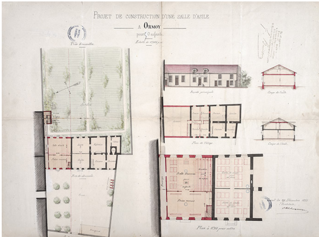
Projet de construction d'une salle d'asile (1881). 70, Ormoy