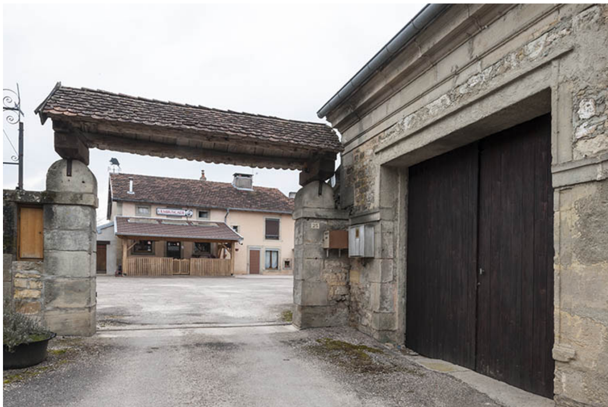
Ancienne maison des soeur.