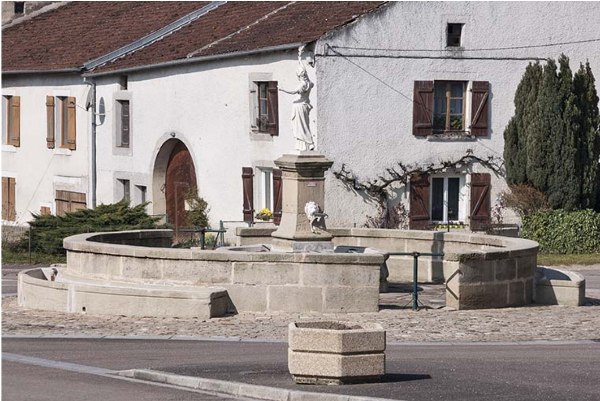
La fontaine, place principale.