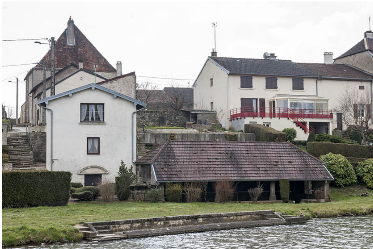
Le lavoir au bord du bief.