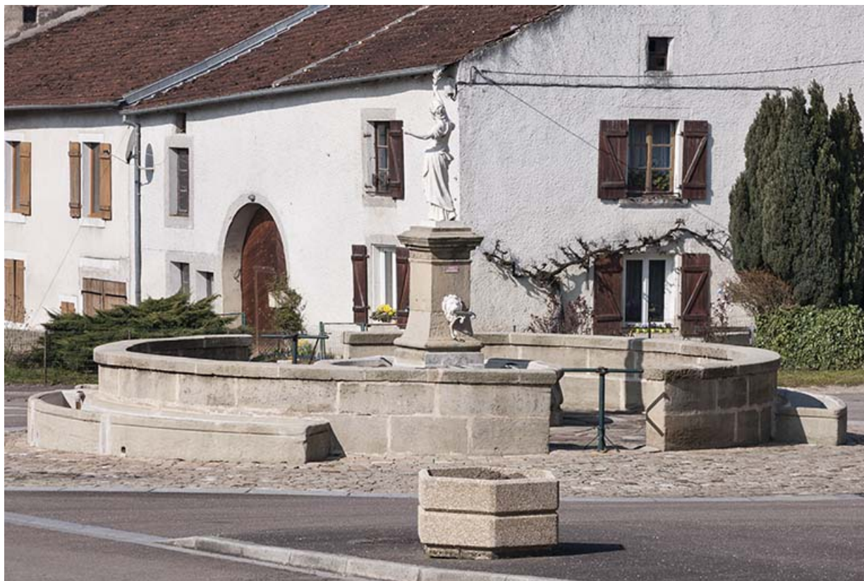
La fontaine, place principale. 70, Ormoy