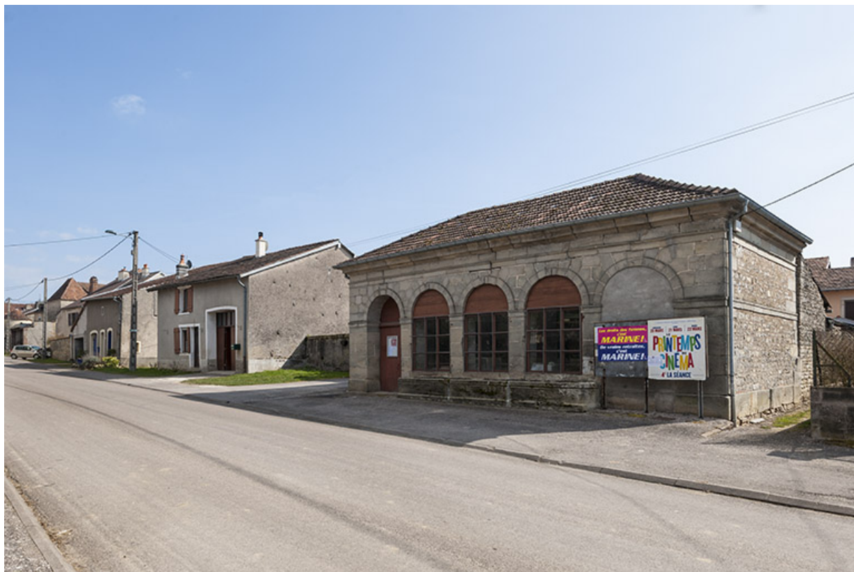
Ancien lavoir, rue Antoine Lumière. 70, Ormoy