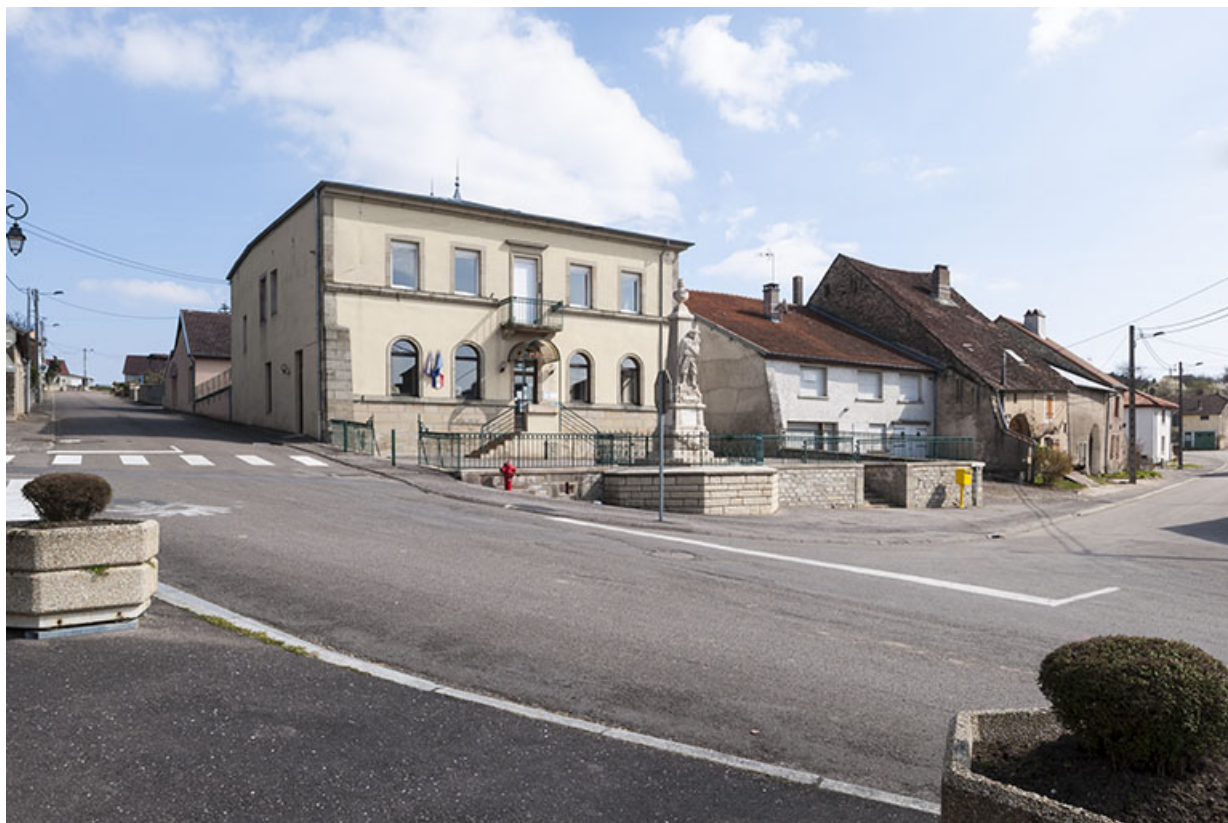
La maison commune depuis l'église.