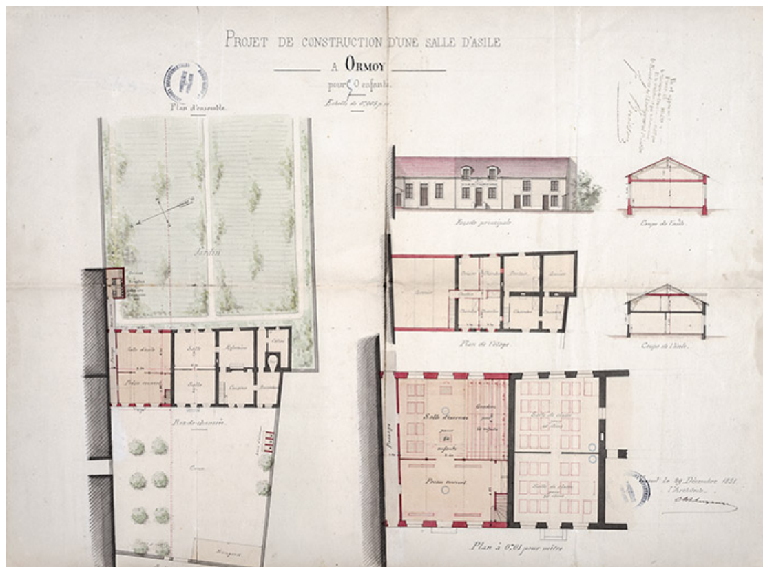
Projet de construction d'une salle d'asile (1881). 70, Ormoy