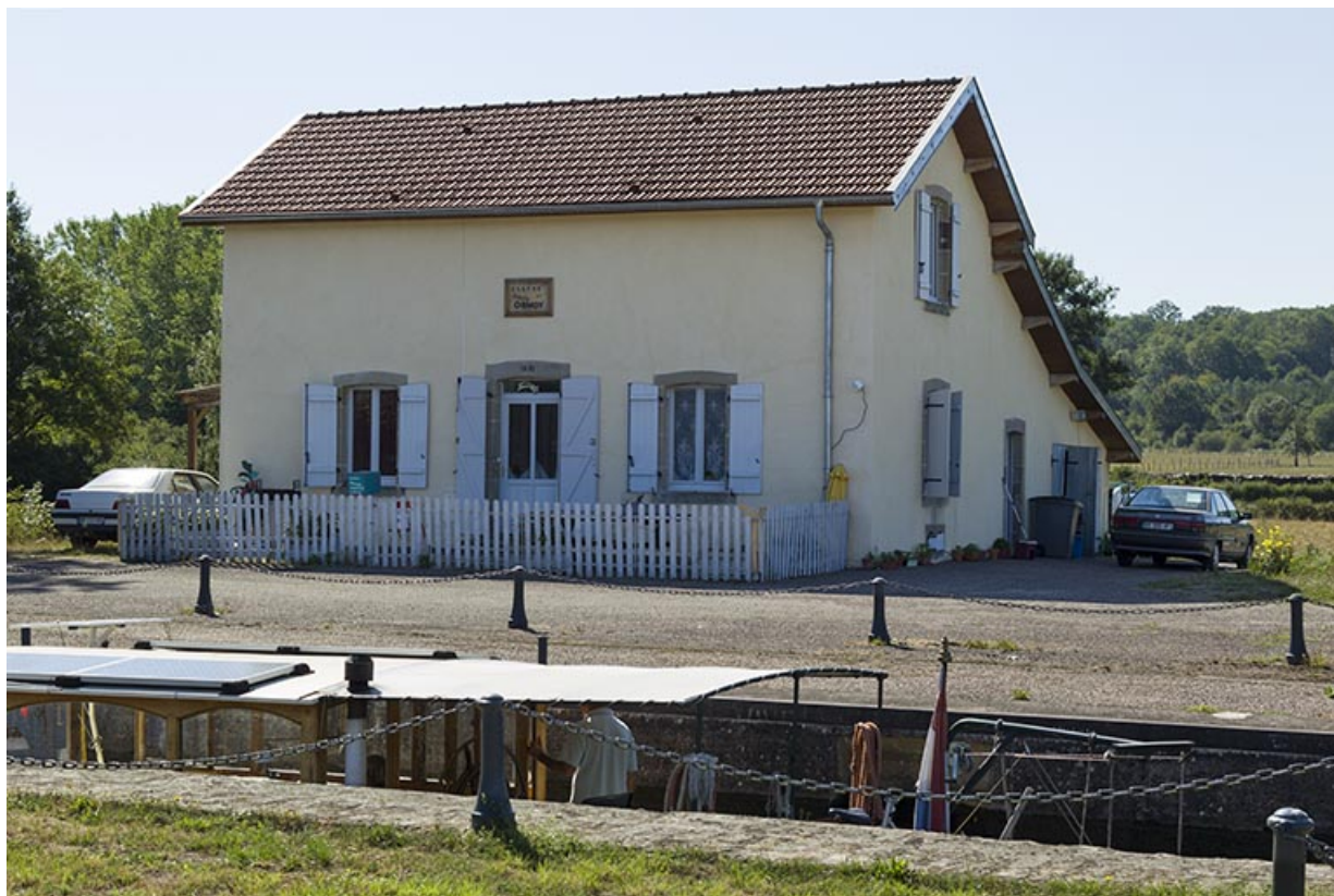
La maison d'éclusier.