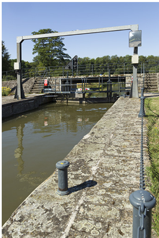
Vue sur un bajoyer et les portes en arrière plan. 70, Ormoy, lieudit : En la fonte