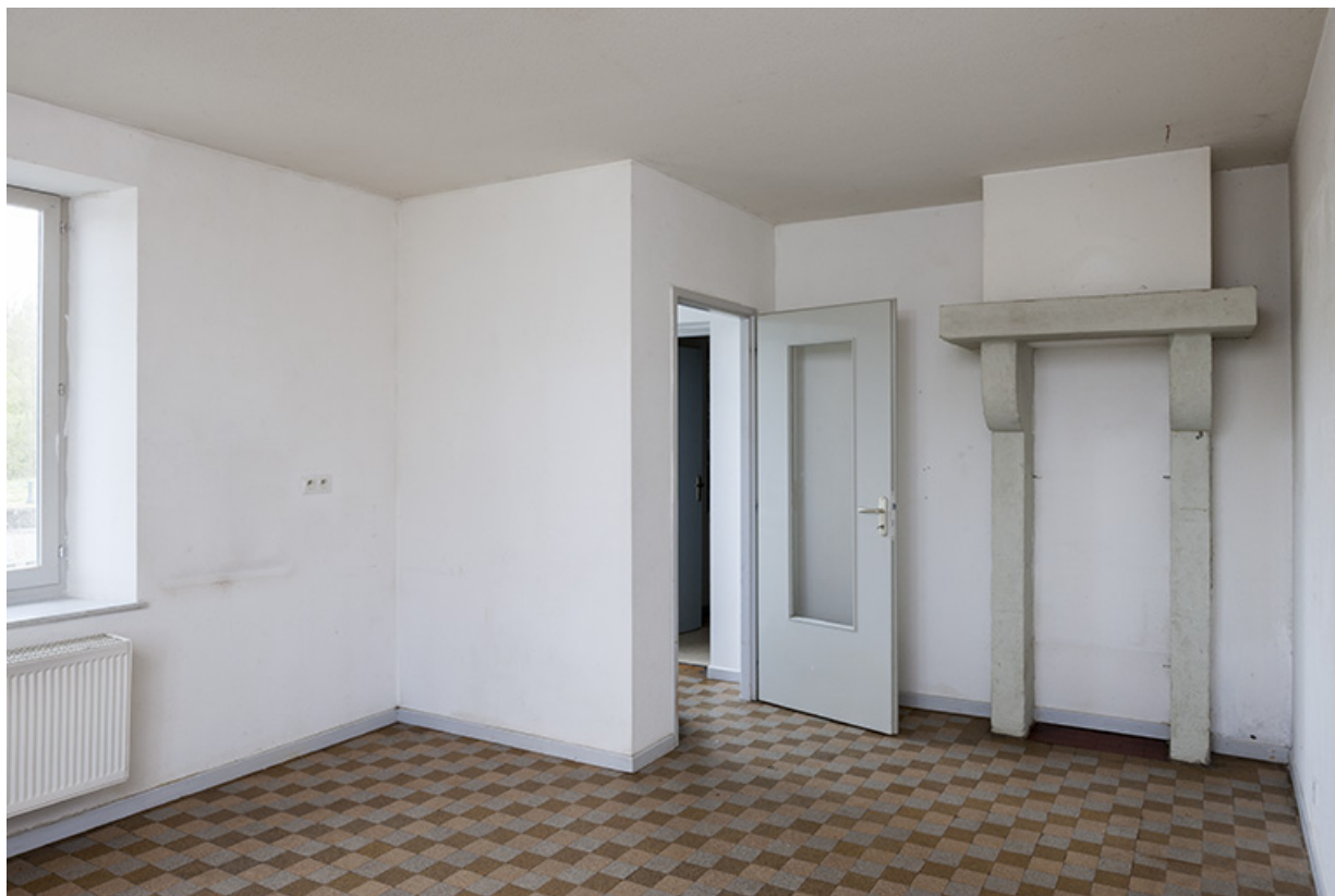
Rez-de-chaussée, cuisine et vestibule d'entrée de la maison d'éclusier.