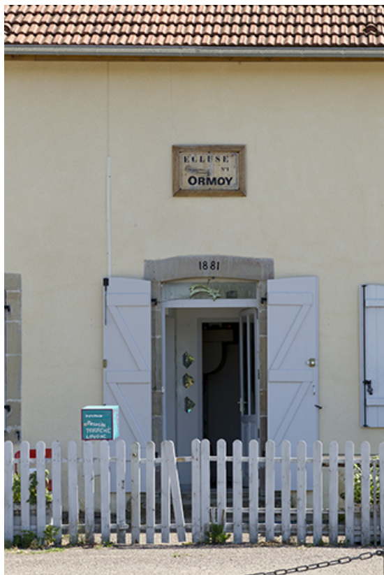
Porte d'entrée avec sa plaque signalétique.