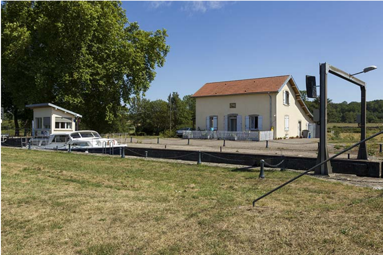
Le site d'écluse, vue d'ensemble.