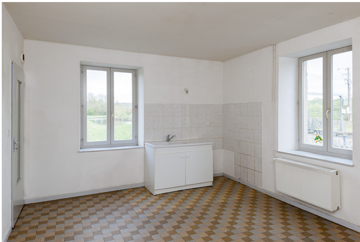
Rez-de-chaussée, cuisine de la maison d'éclusier.