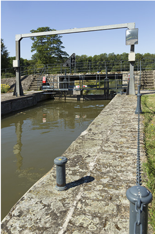
Vue sur un bajoyer et les portes en arrière plan.