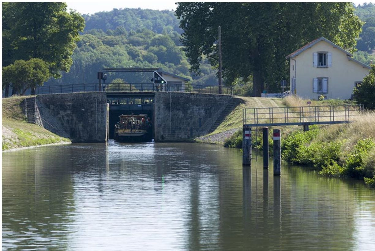
Site d'écluse, Ormoy.