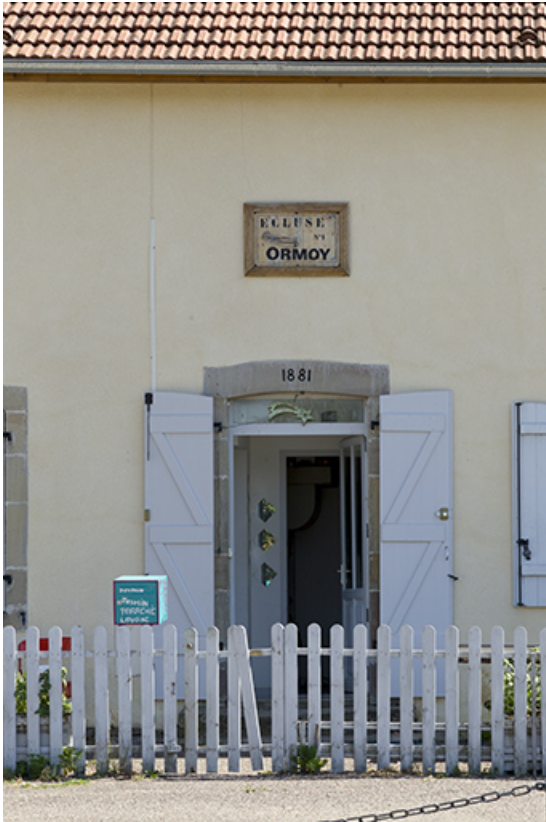
Porte d'entrée avec sa plaque signalétique.