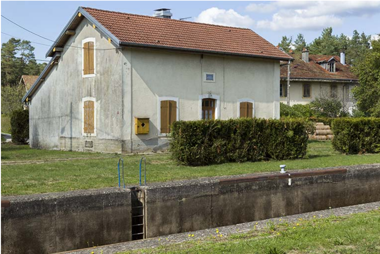
Vue de trois-quart sud-ouest de la maison d'éclusier.