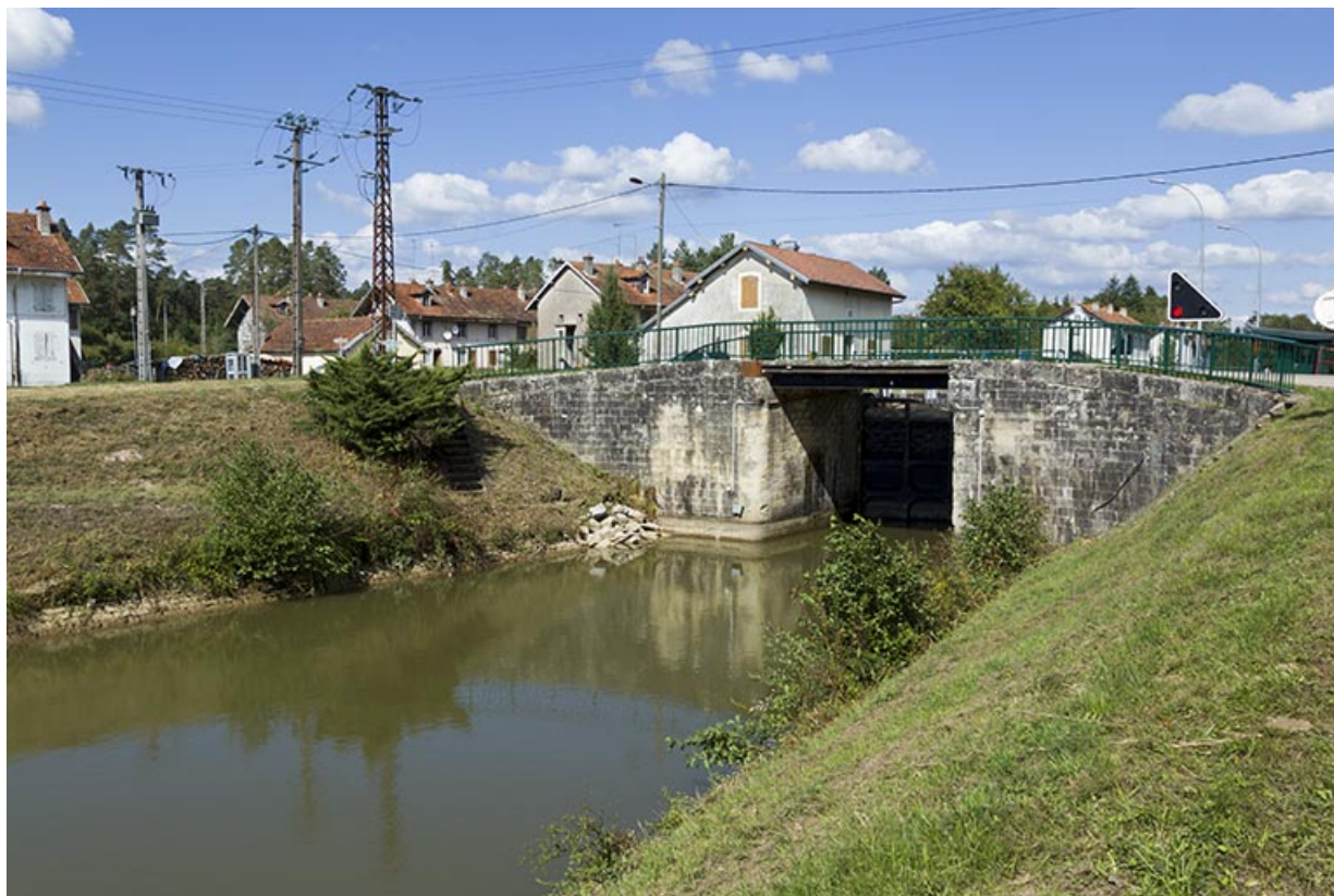
Depuis l'aval, vue sur le pont routier. 70, Demangevelle