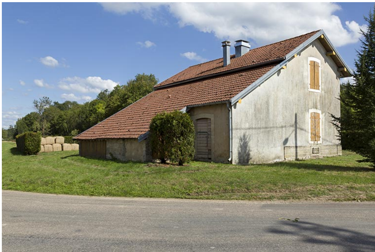
Vue de trois-quart nord-ouest de la maison d'éclusier. 70, Demangevelle