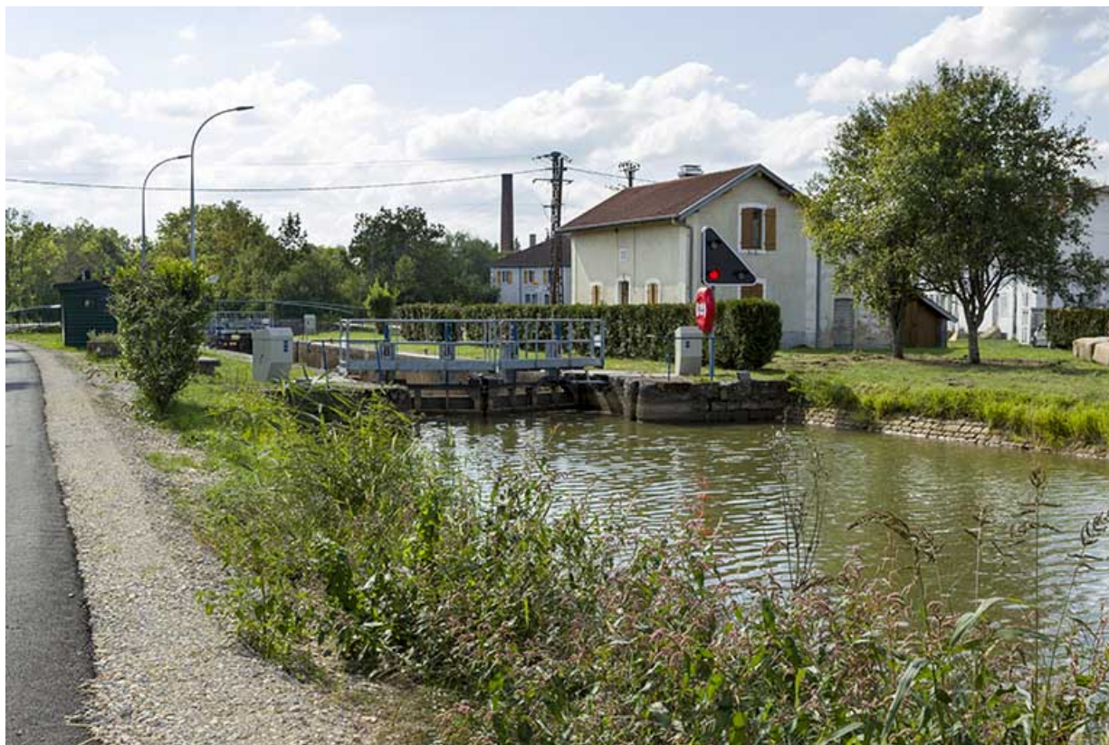
Vue d'ensemble du site d'écluse depuis la rive gauche en amont. 70, Demangevelle