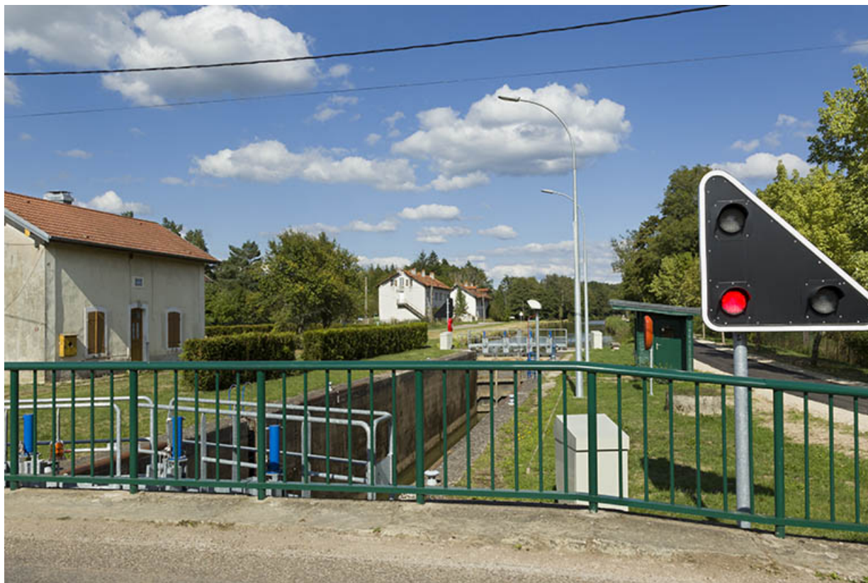
Vue de l'écluse vers l'amont depuis le pont. 70, Demangevelle