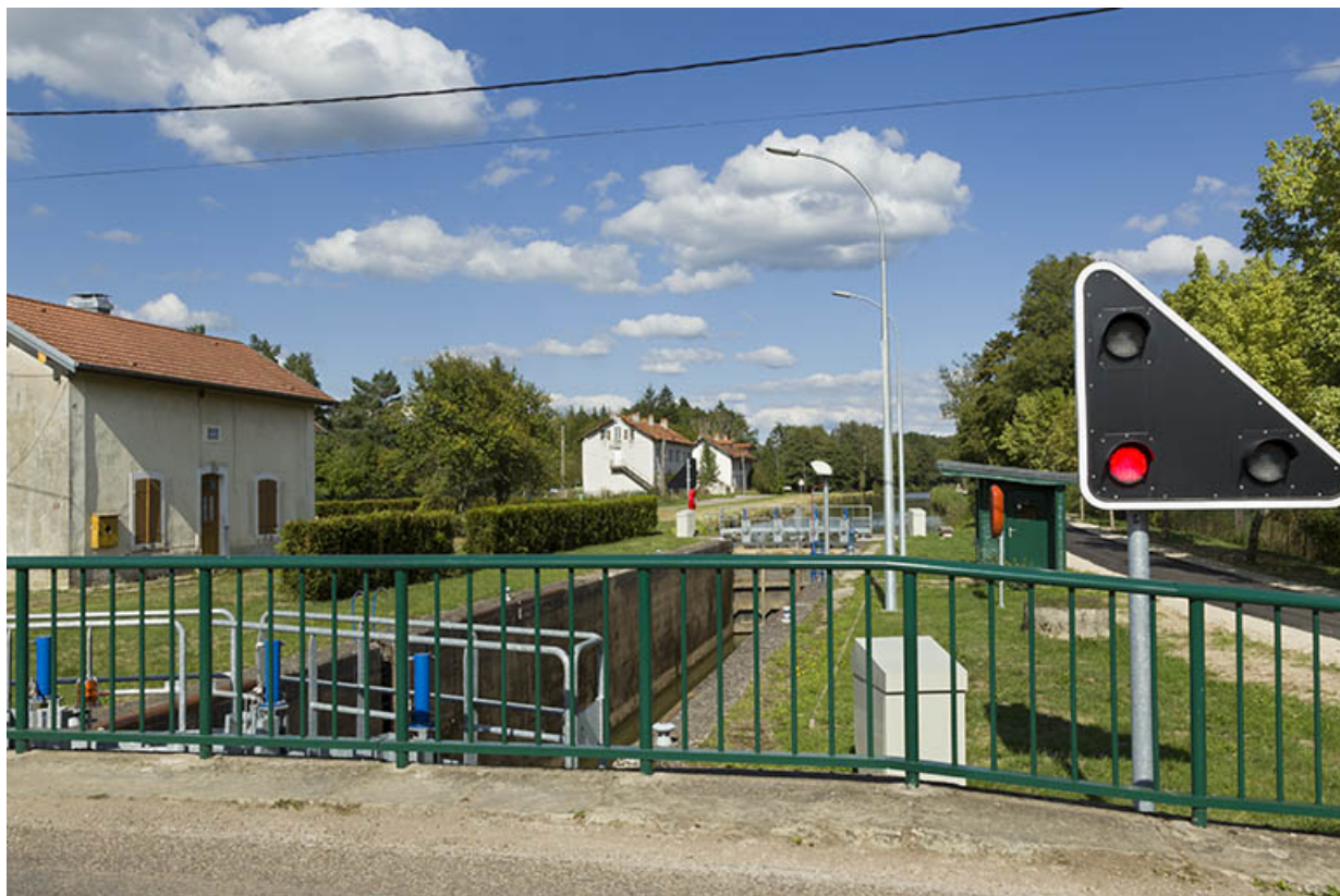
Vue de l'écluse vers l'amont depuis le pont. 70, Demangevelle