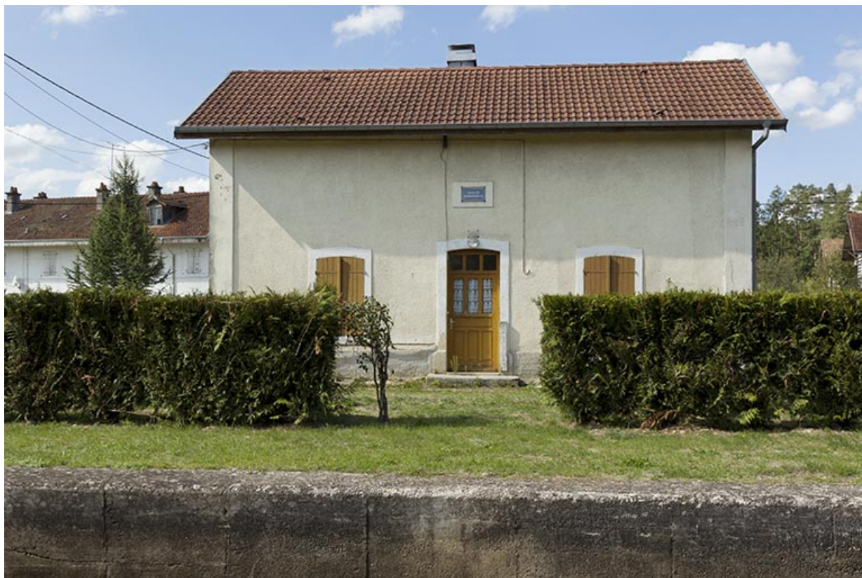
Vue de face de la maison d'éclusier.