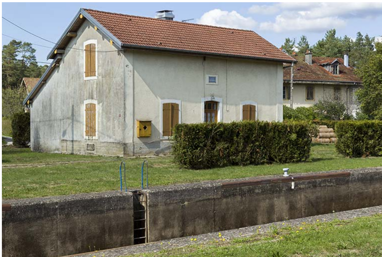
Vue de trois-quart sud-ouest de la maison d'éclusier. 70, Demangevelle