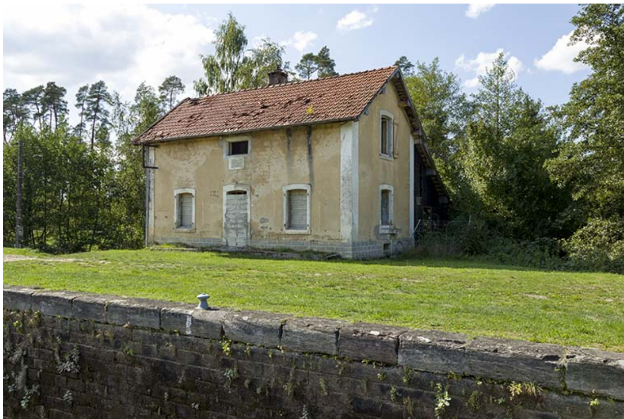
Vue de trois-quart est de la maison d'éclusier. 70, Demangevelle