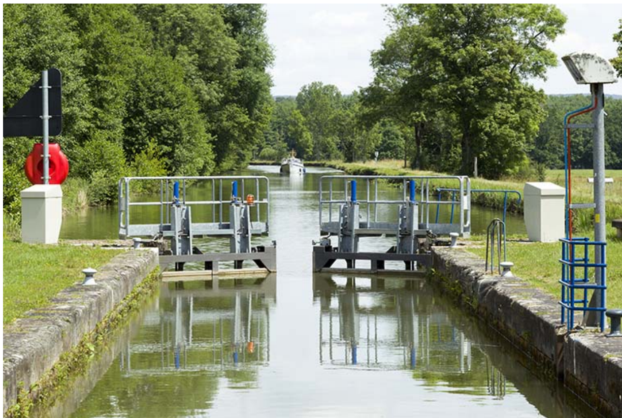
L'ouverture de portes vers l'amont à l'approche d'un bateau avalant. 70, Demangevelle