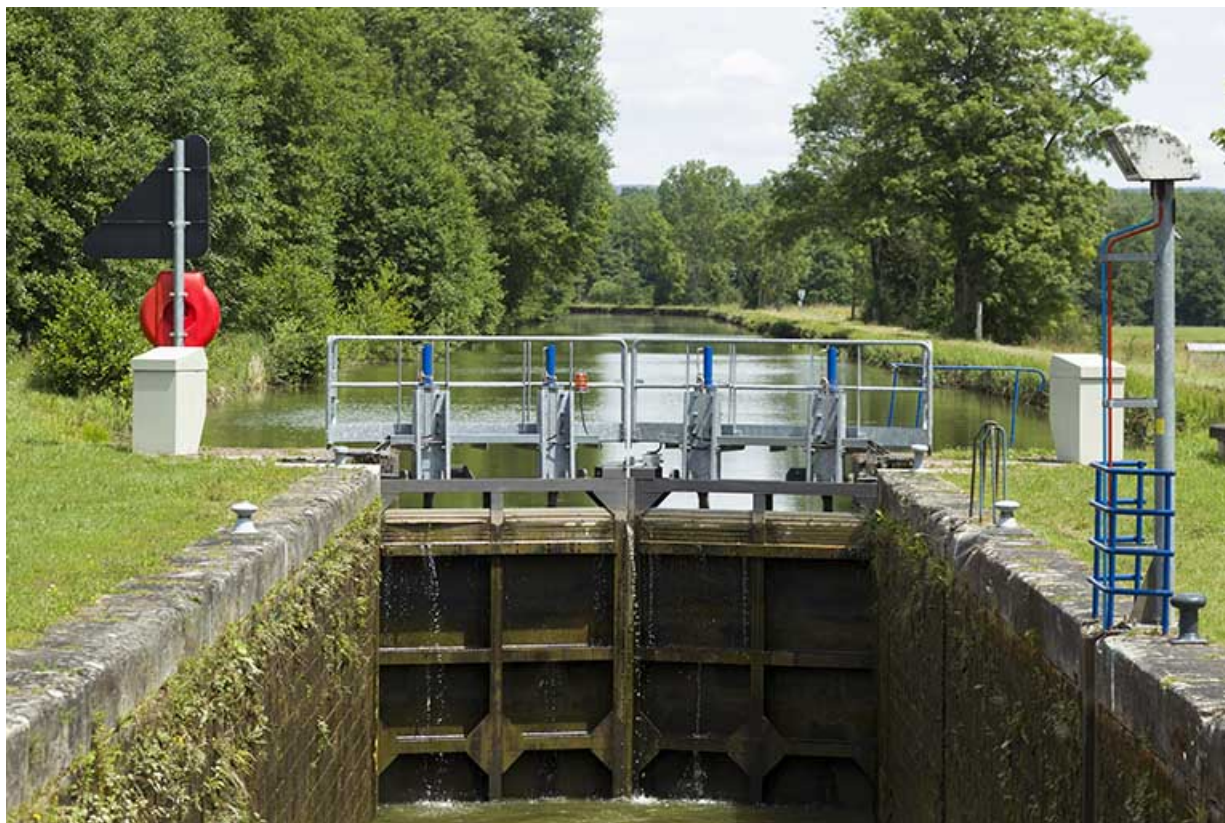
Portes amont fermées : le sas se vide.