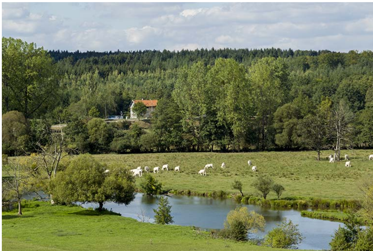
Le Coney et la maison d'éclusier vue du sud-est. 70, Demangevelle