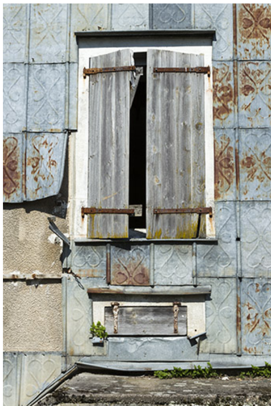
Détail de deux baies et de l'essentage de la façade sud-ouest. 70, Demangevelle