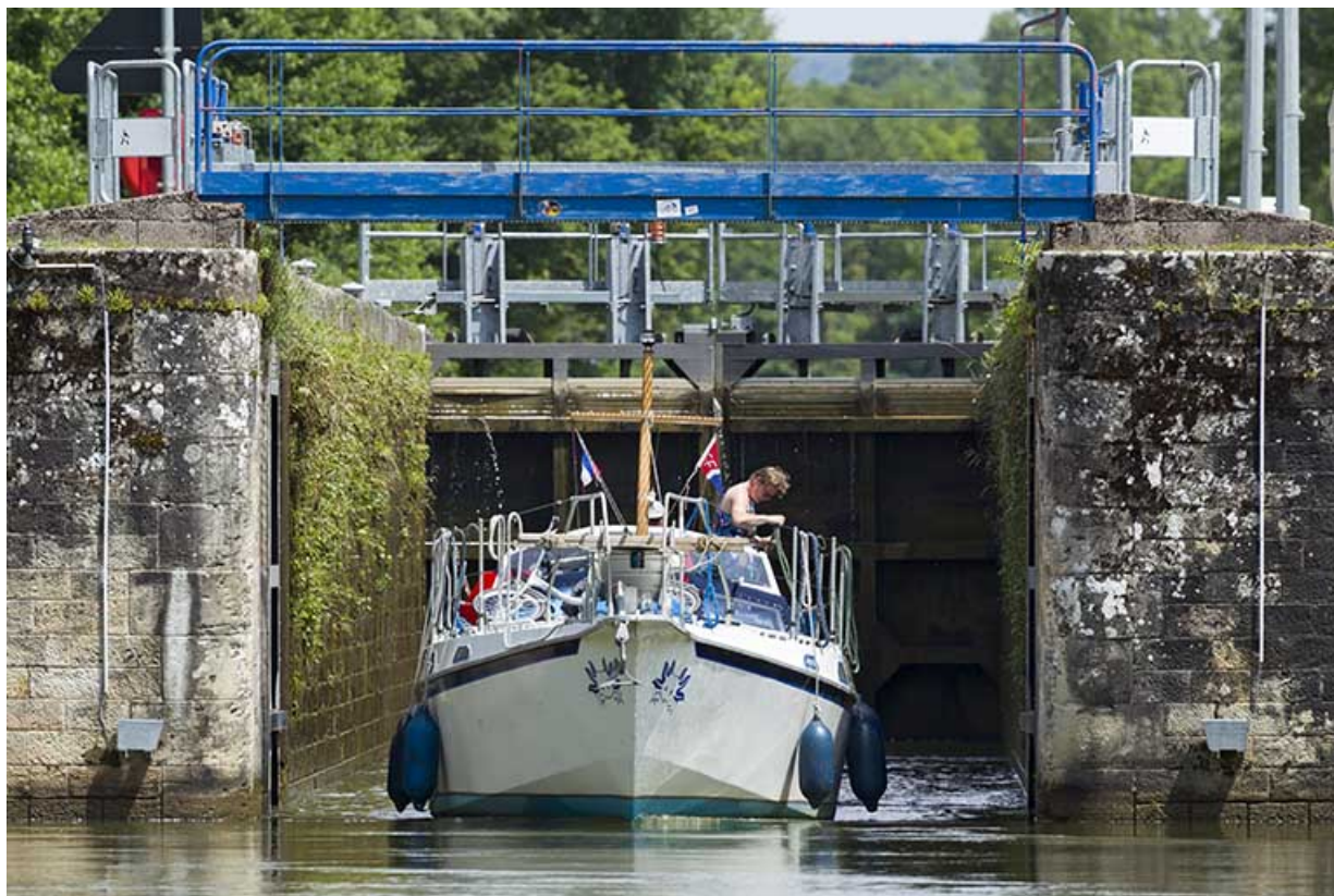
Ecluse n°43, Demangevelle (70).