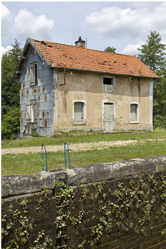
Vue de trois-quart sud de la maison d'éclusier. 70, Demangevelle