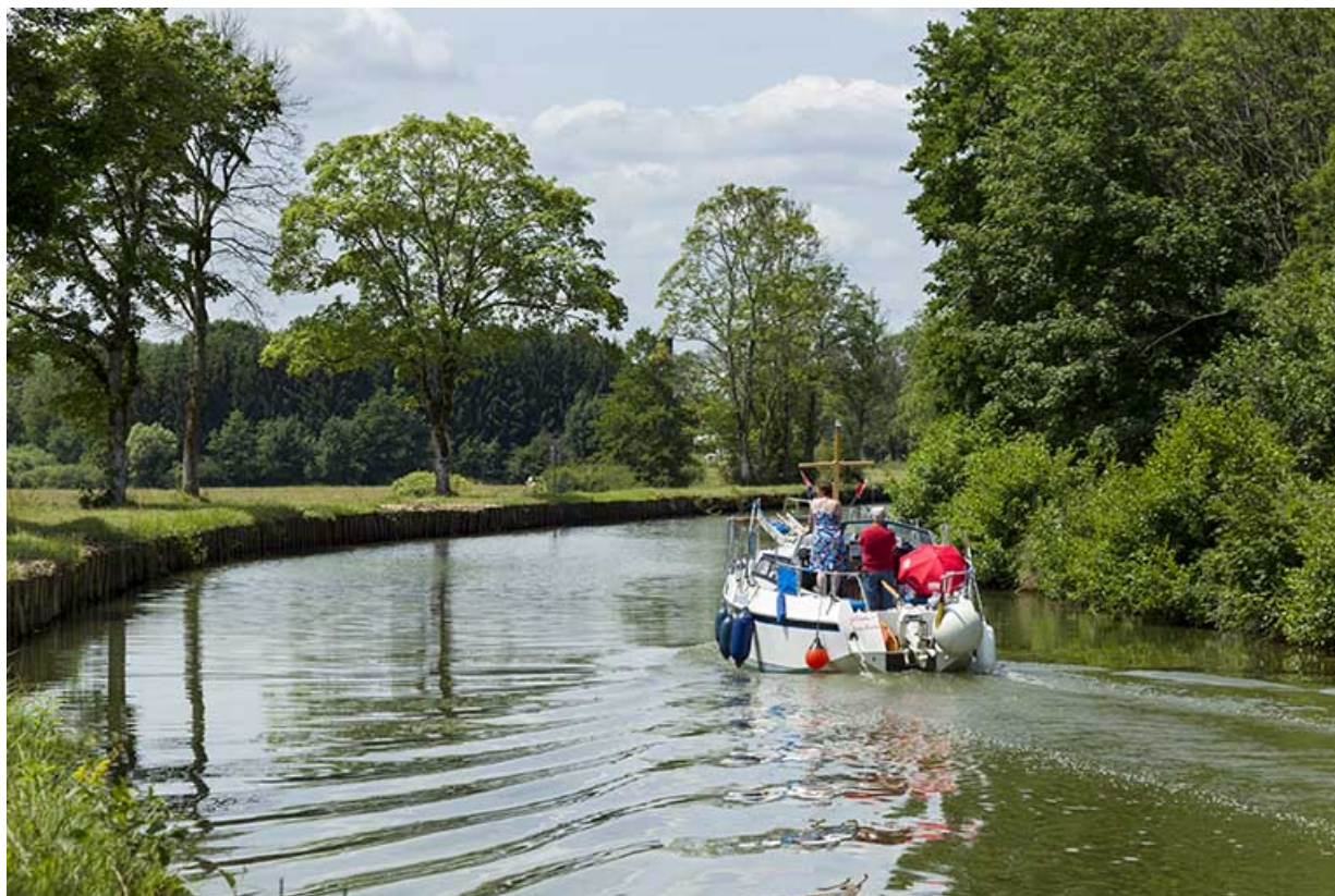
Bateau avalant dans le bief de Demangevelle.