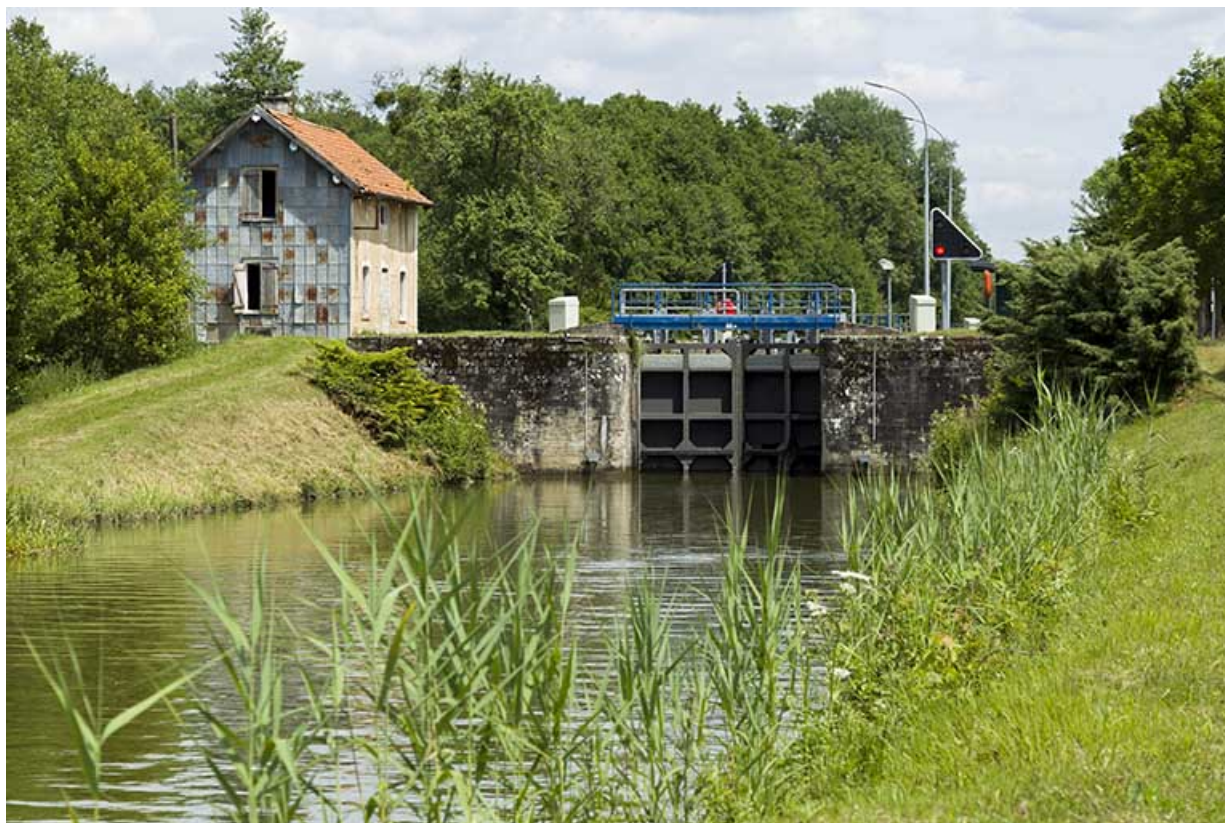
Vue de l'écluse et de sa maison depuis l'aval au sud-ouest.