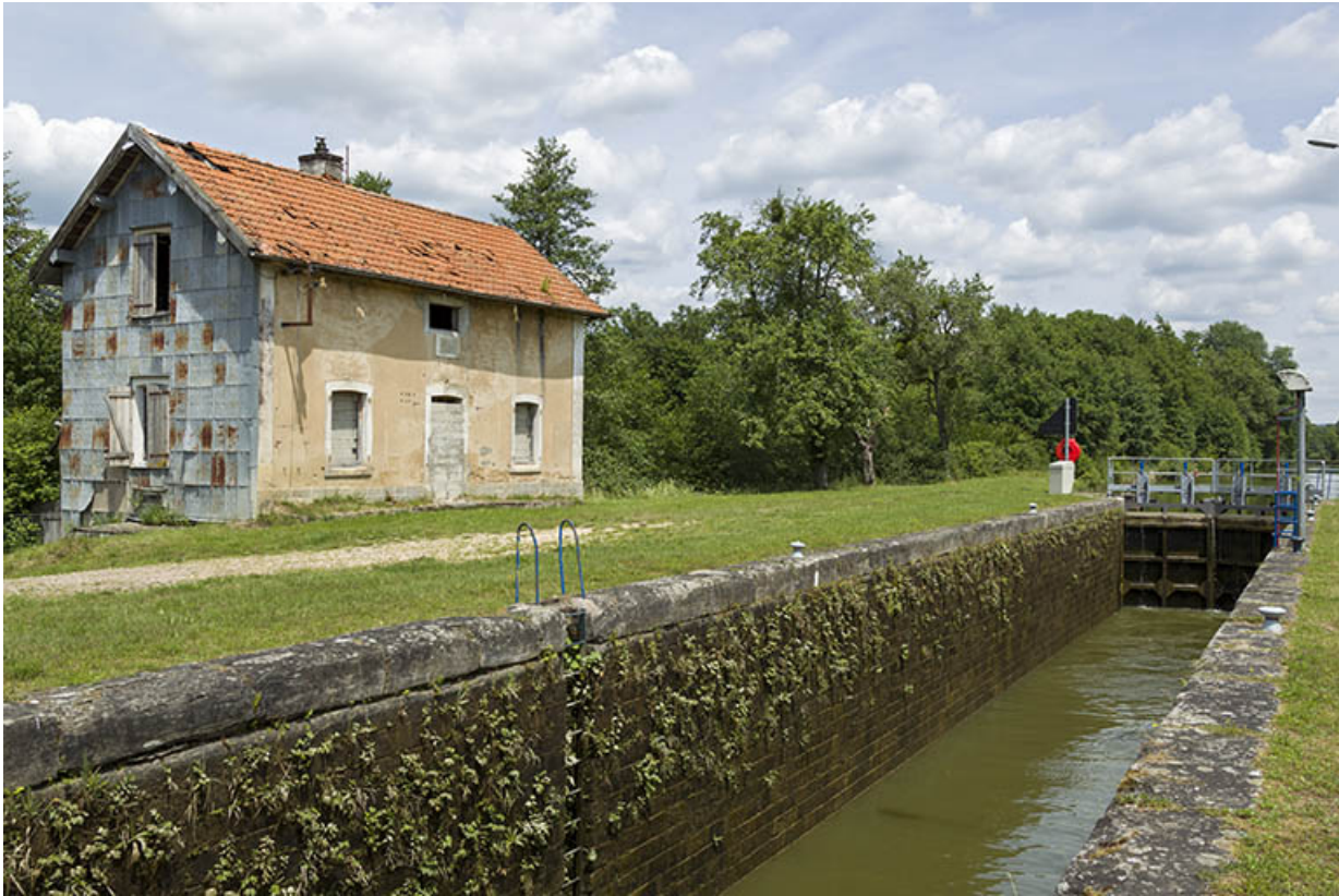
Vue du sas et vue de trois-quart sud de la maison d'éclusier.