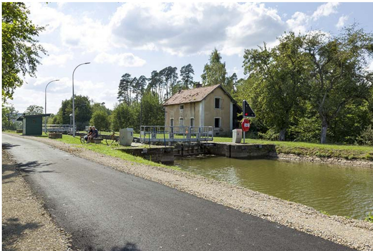
Vue du site d'écluse, du poste de commandement, de la maison d'éclusier depuis la rive gauche en amont. 70, Demangevelle