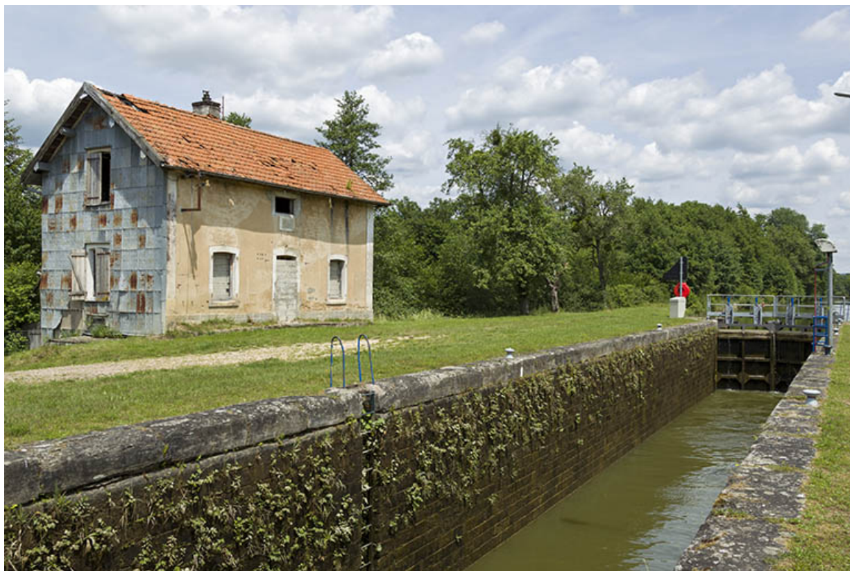
Vue du sas et vue de trois-quart sud de la maison d'éclusier. 70, Demangevelle