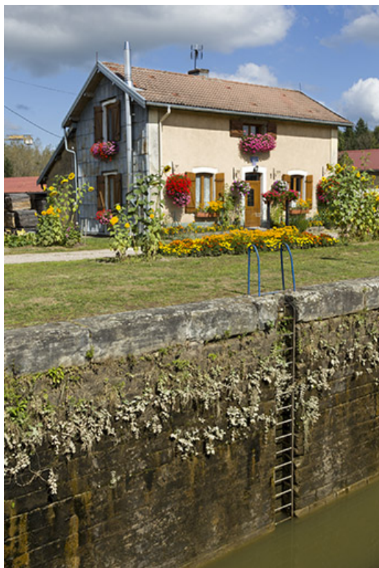
Vue de trois-quart sud-ouest de la maison éclusière depuis la rive gauche.