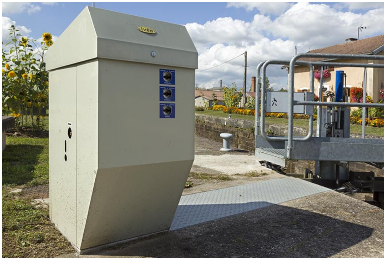
Boitier de commande de l'écluse sur la rive gauche.