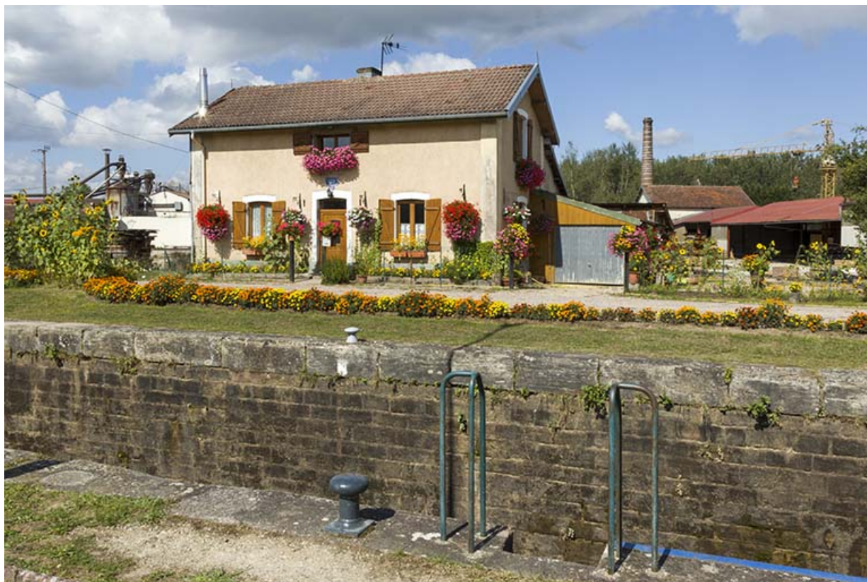
Façade antérieure de la maison d'éclusier depuis la rive gauche.