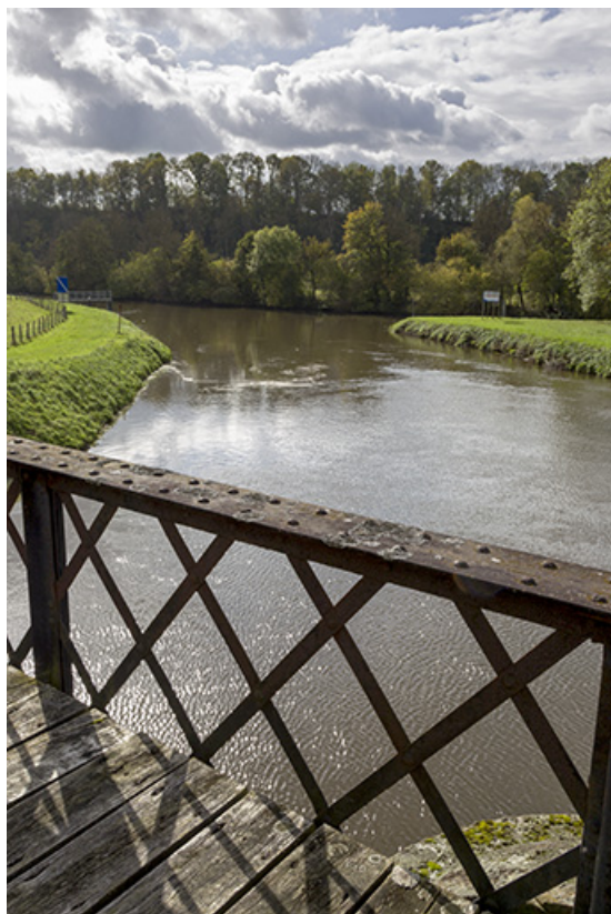
Depuis la passerelle enjambant le Coney, vue sur l'aval : confluence avec la Saône.

70, Corre chemin communal de contre hâlage, lieudit : le derrière de l'écluse