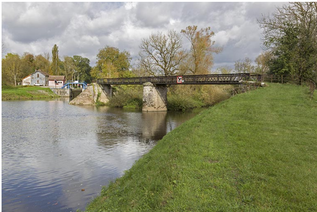
En amont de la confluence avec la Saône, la confluence du Coney et du canal, site d'écluse et passerelle sur le Coney, depuis le sud-est.

70, Corre chemin communal de contre hâlage, lieudit : le derrière de l'écluse