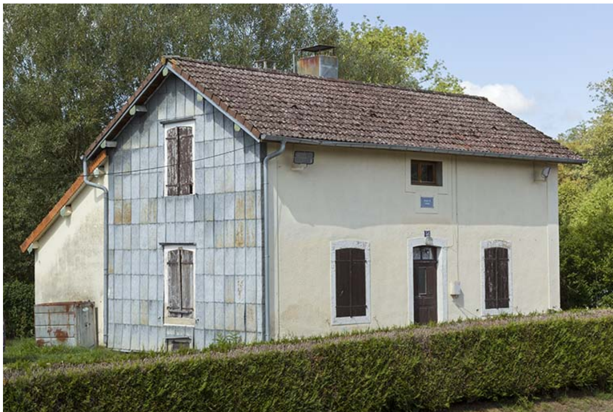
Maison d'éclusier de Corre : vue de trois-quart sud-est.

70, Corre chemin communal de contre hâlage, lieudit : le derrière de l'écluse