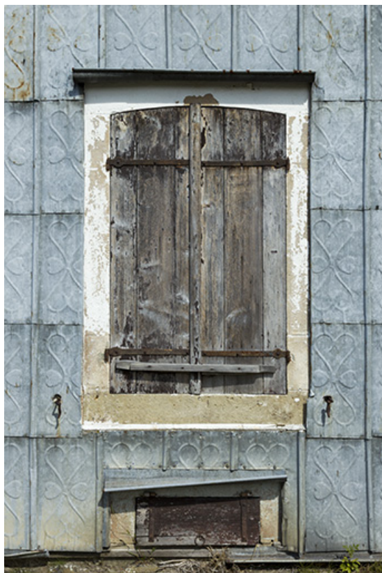
Maison d'éclusier de Corre : détail de deux baies de rez-de-chaussée et de l'essentage de tôle de la façade sud. 70, Corre chemin communal de contre hâlage, lieudit : le derrière de l'écluse