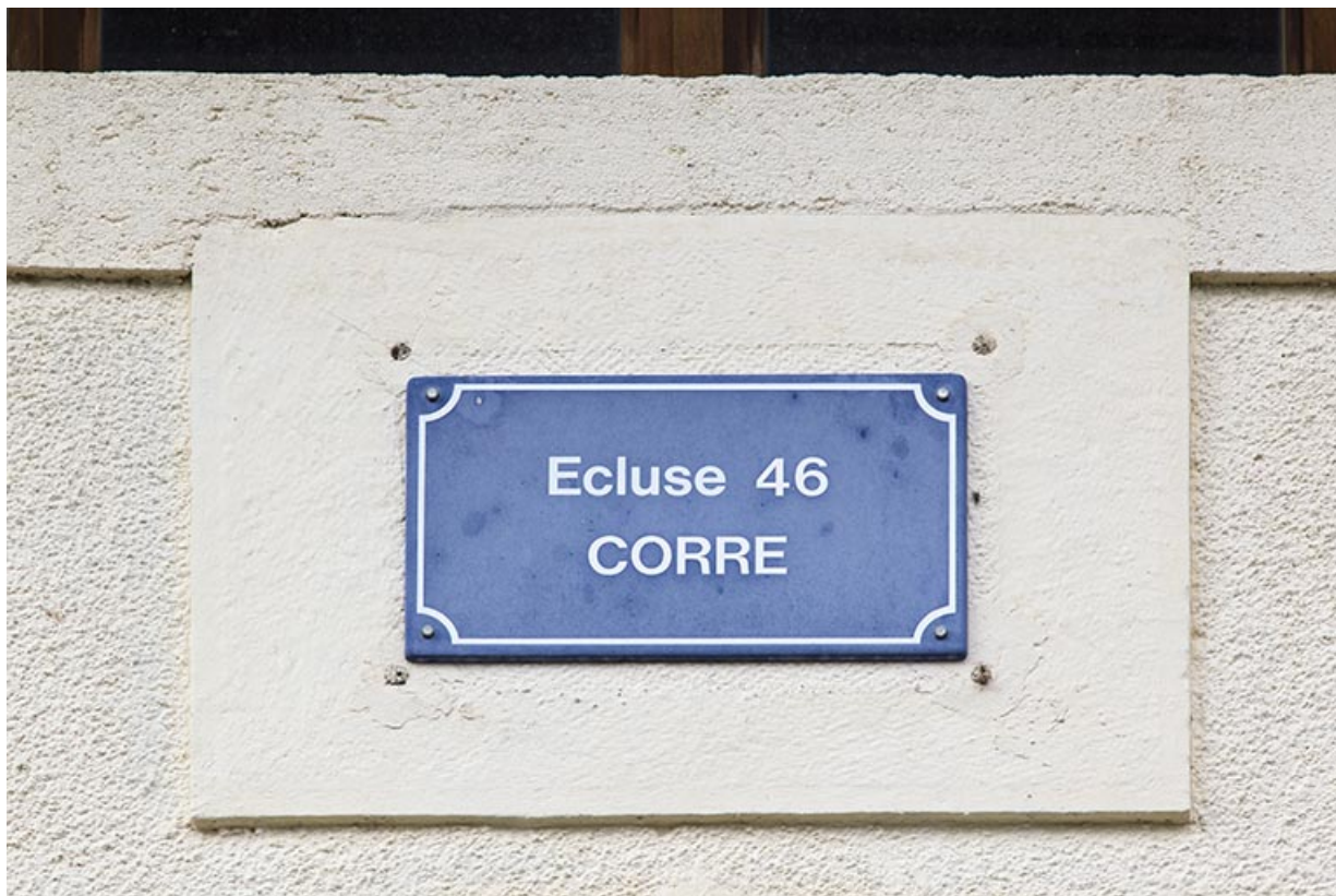
Maison d'éclusier de Corre : détail de la plaque d'identification de l'écluse.

70, Corre chemin communal de contre hâlage, lieudit : le derrière de l'écluse