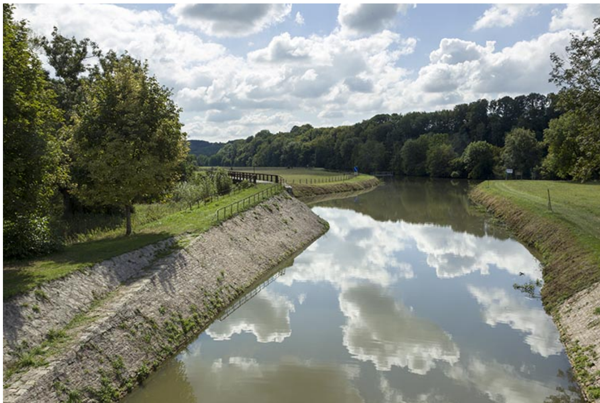
Vue aval depuis l'écluse n°46 du canal des Vosges et la Saône en arrière-plan. 70, Ormoy