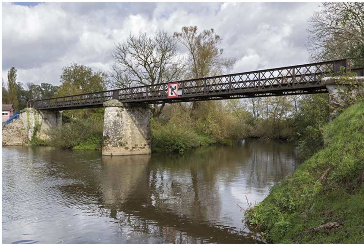
Vue de la passerelle enjambant le Coney depuis le sud-ouest.

70, Corre chemin communal de contre hâlage, lieudit : le derrière de l'écluse