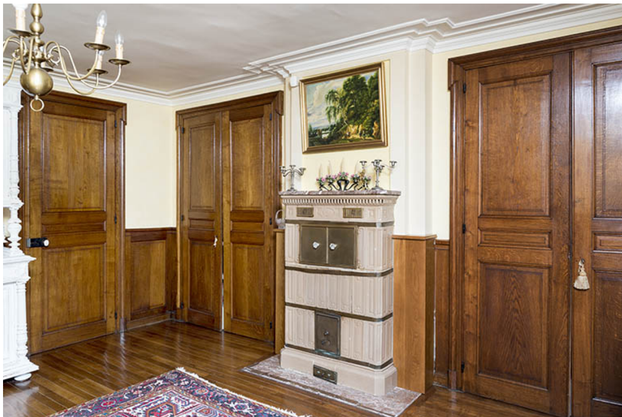
Vue intérieure du rez-de-chaussée : le salon. 70, Corre, 21 rue Plerre Billecard