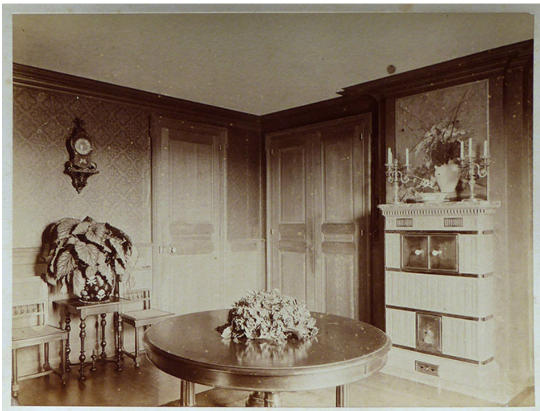
Le pavillon. Photographie de Gaston de Landreville dit Vedastus représentant l'intérieur du pavillon. 70, Corre, 21 rue Pierre Billecard