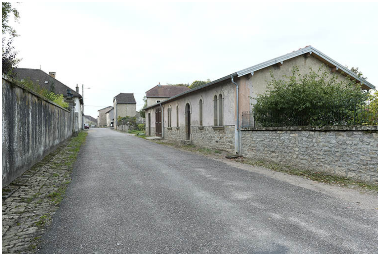
Vue de la rue Billecard depuis l'est, jouxtant au sud la cloture du parc Barbey. 70, Corre, 21 rue Plerre Billecard