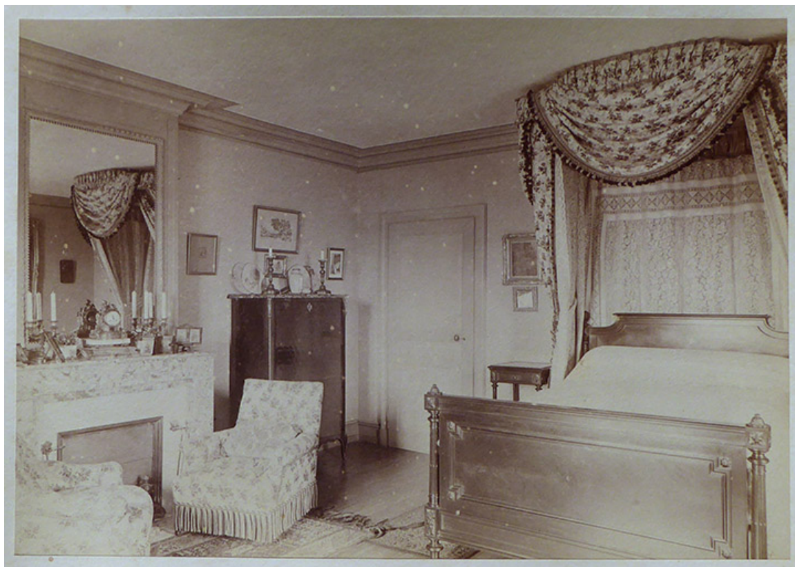
Une chambre dans le pavillon. 70, Corre, 21 rue Plerre Billecard