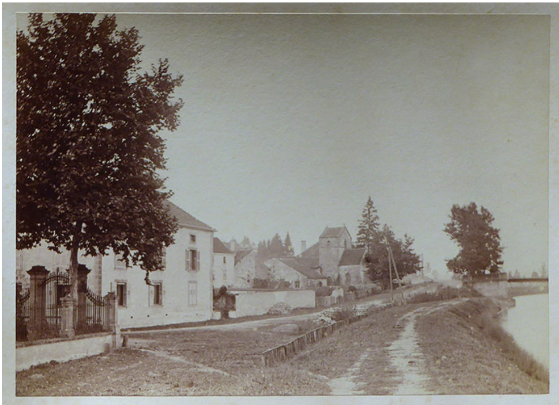
Avenue du canal et vue sur l'église non encore rénovée. Carte postale.