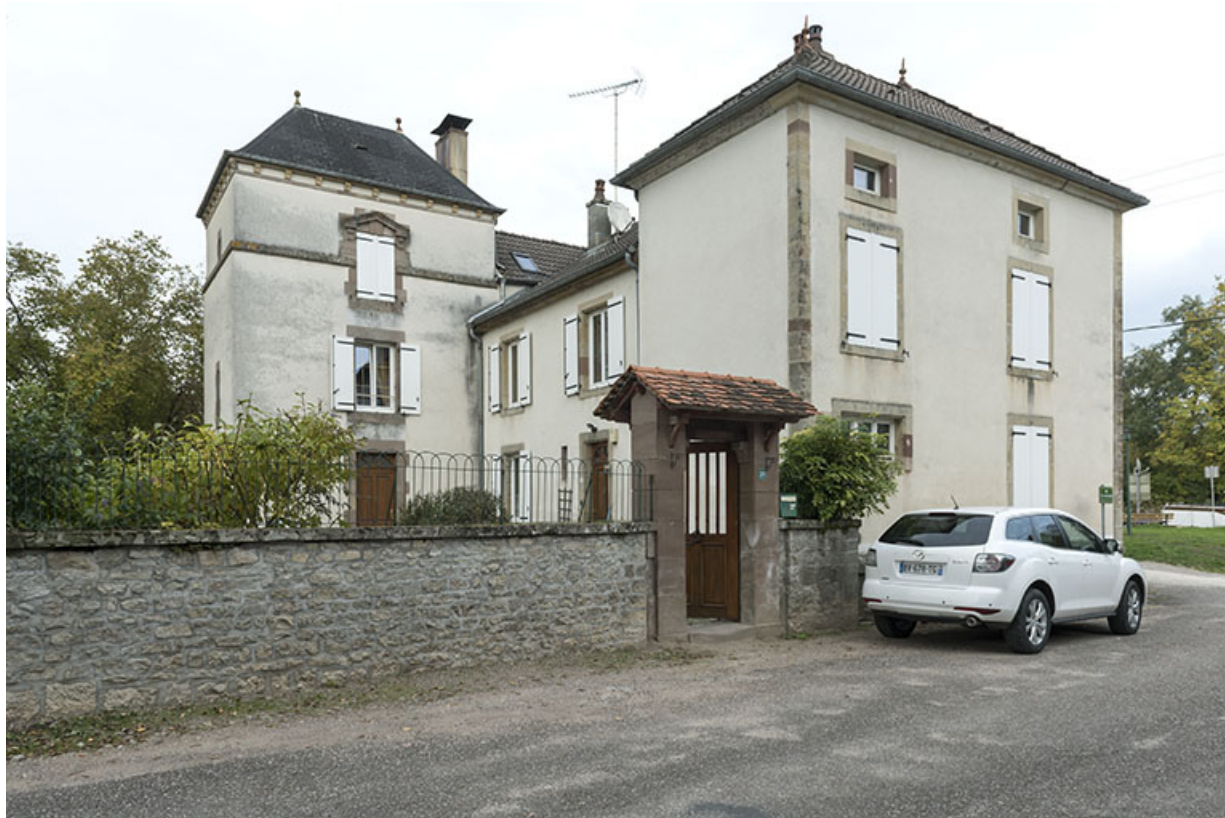
Vue de trois-quart sud-ouest de la maison.