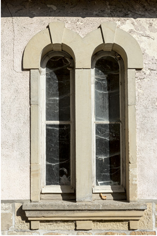
Détail des baies jumelées de l'ancienne dépendance.