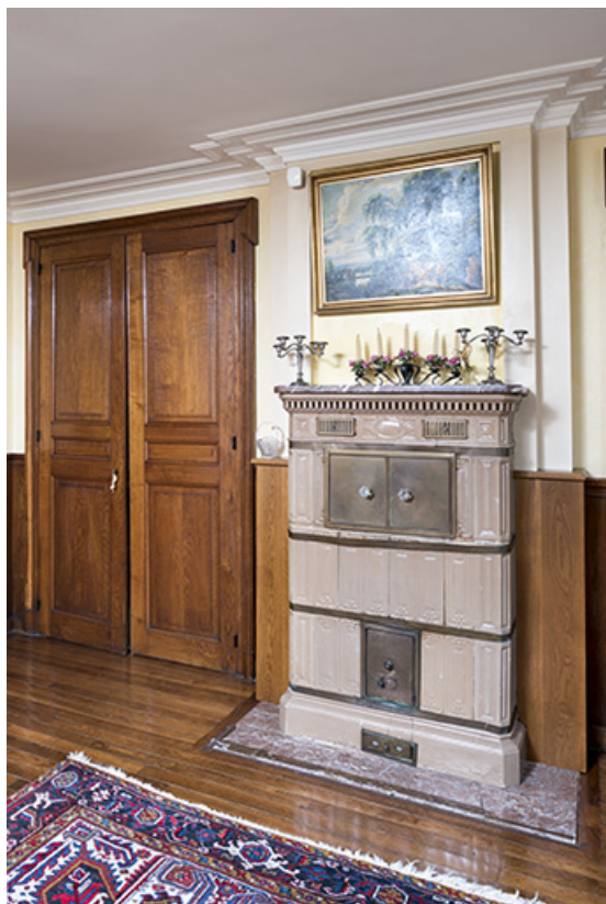
Vue de détail : le poêle.