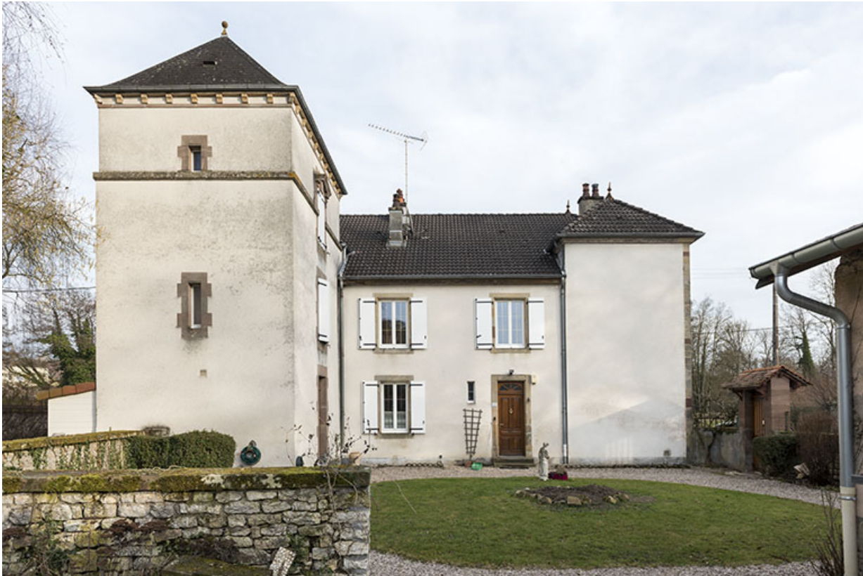
Vue de face depuis l'ouest.