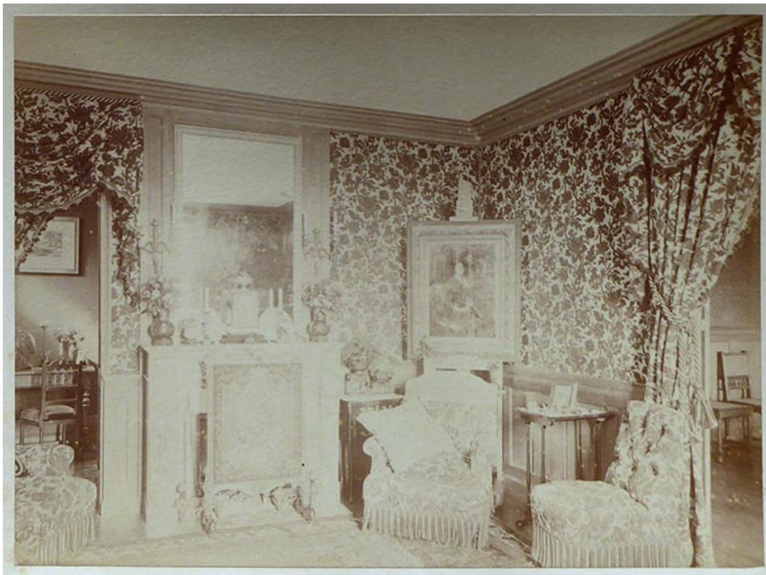
Le pavillon. Photographie de Gaston de Landreville dit Vedastus représentant l'intérieur du pavillon et le portrait de MMe Barbey peint par PAJ Dagnan-Bouveret en 1881.