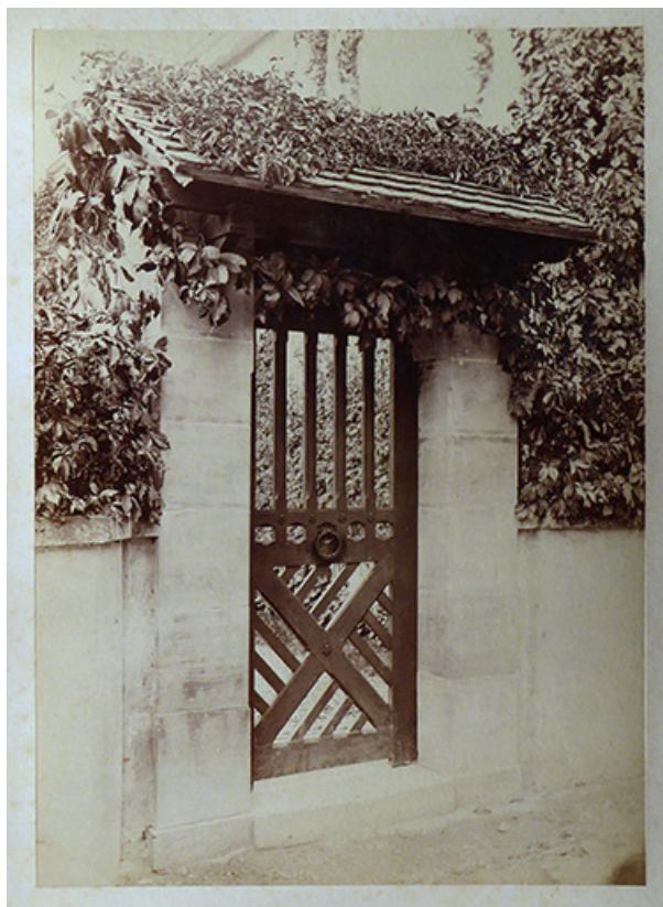
Porte du pavillon. 70, Corre, 21 rue Plerre Billecard