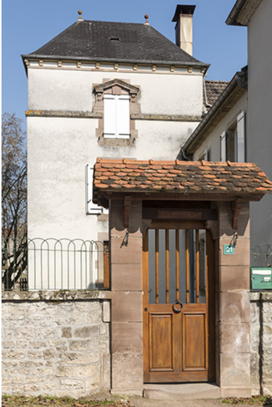
Le portillon vu de la rue.