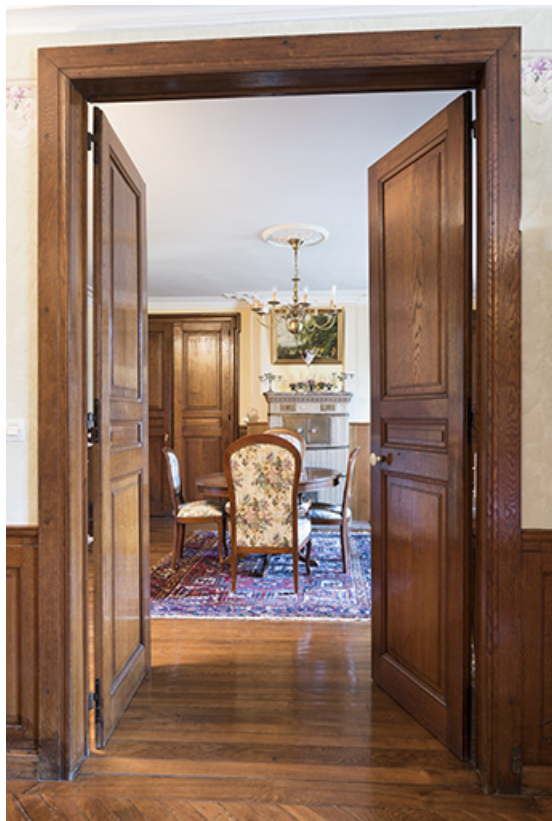
Vue en enfilade des pièces du rez-de-chaussée.