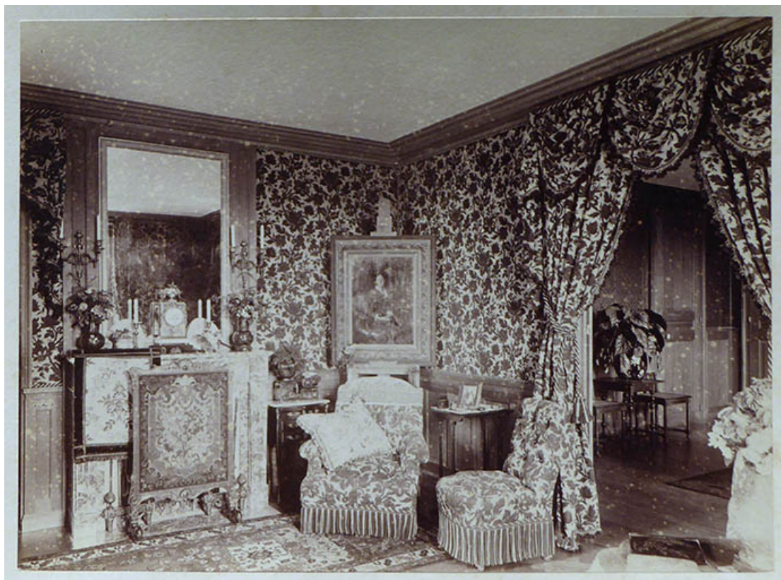
Le pavillon. Photographie de Gaston de Landreville dit Vedastus représentant l'intérieur du pavillon et le portrait de MMe Barbey peint par PAJ Dagnan-Bouveret en 1881.