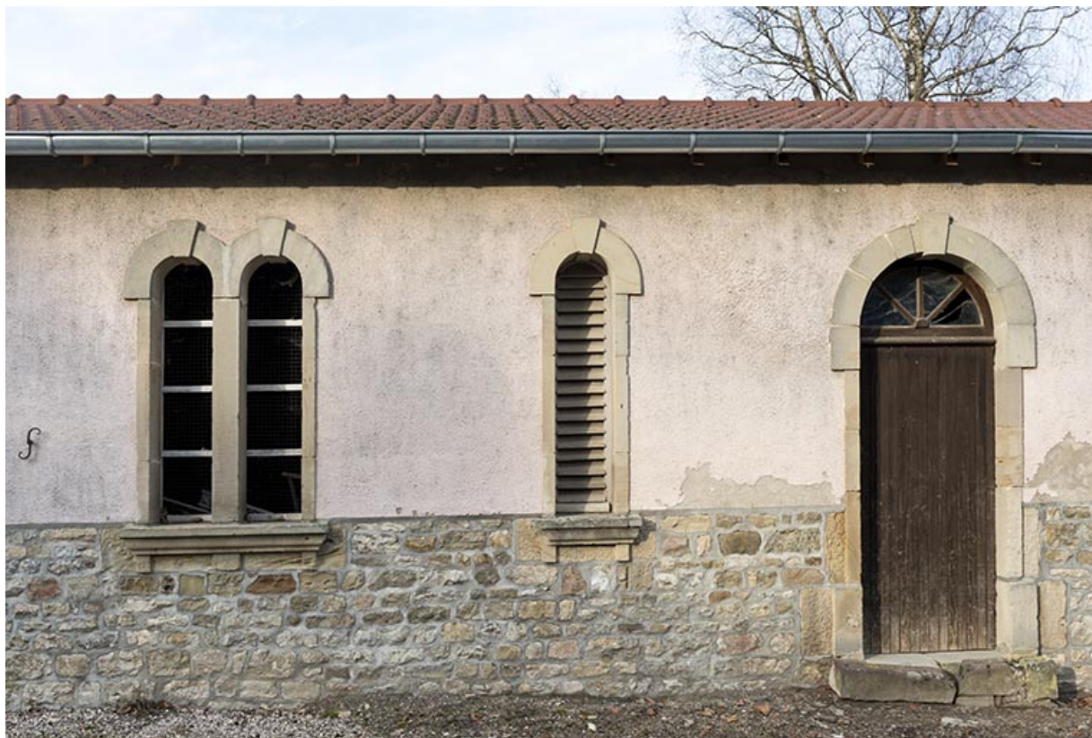
Vue de face de l'ancienne dépendance depuis la rue.