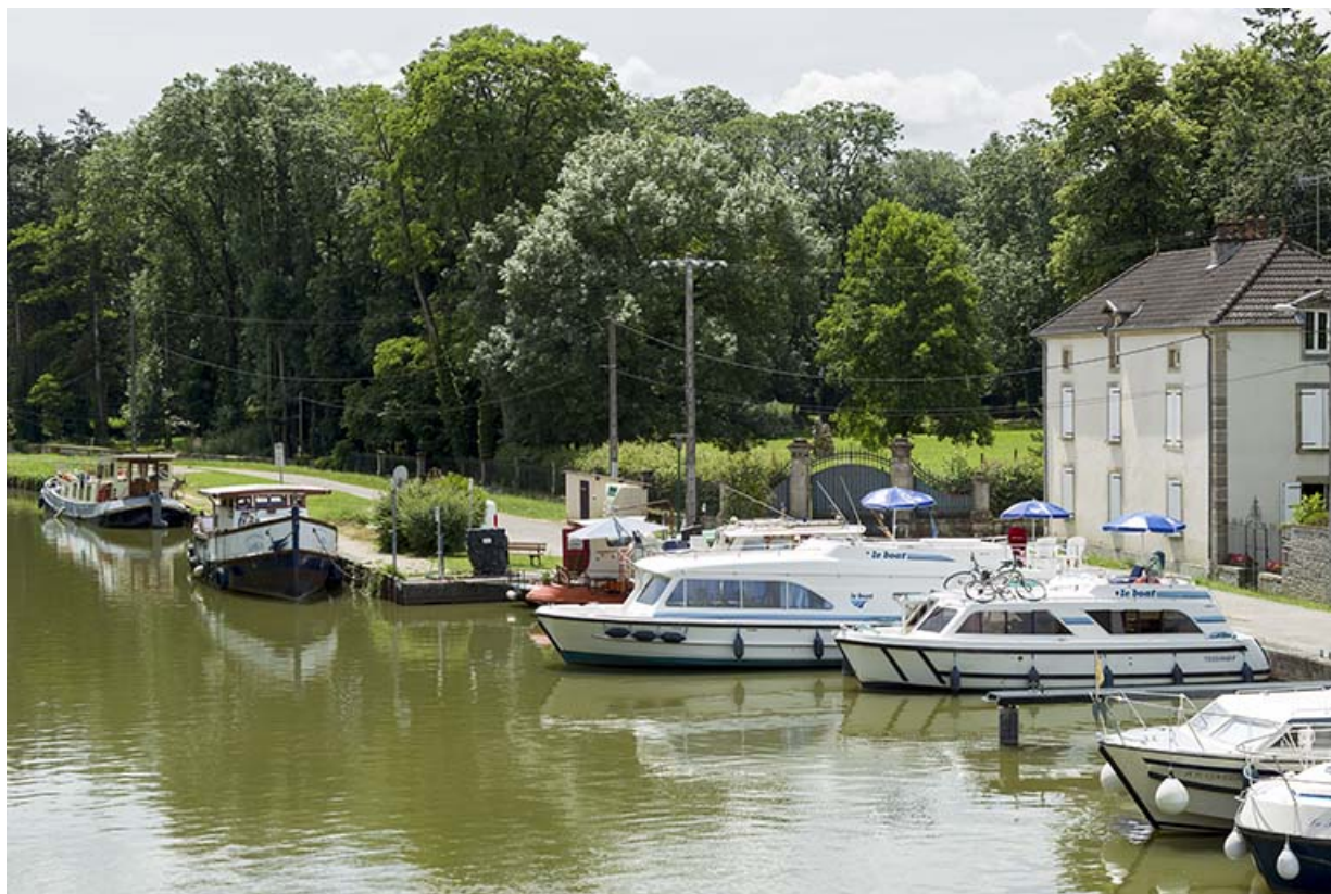
Vue sur le port, le parc Barbey et son portail, la façade est du pavillon Barbey, depuis le nord-est. 70, Corre, 21 rue Plerre Billecard