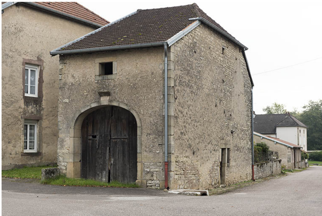
Vue depuis l'angle de la rue Pierre Billecard et de la place du général de Gaulle (ancienne rue St Maurice) sur l'ancien abattoir, ancienne écurie.