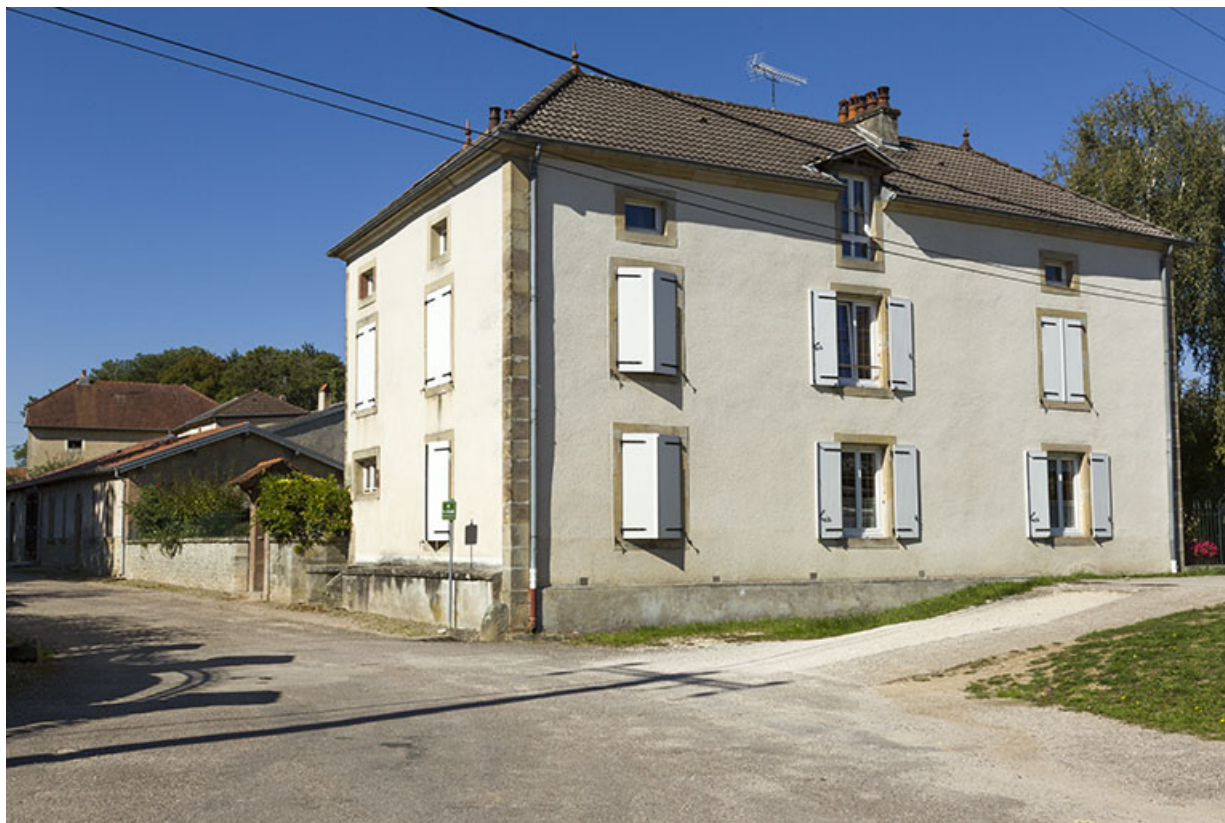
Vue de trois-quart sud-est de la façade donnant sur le canal.