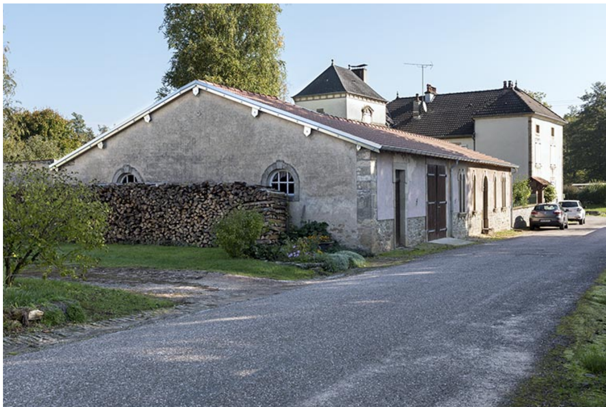
Vue depuis le haut (ouest) de la rue Pierre Billecard sur l'ancienne dépendance. 70, Corre, 21 rue Pierre Billecard