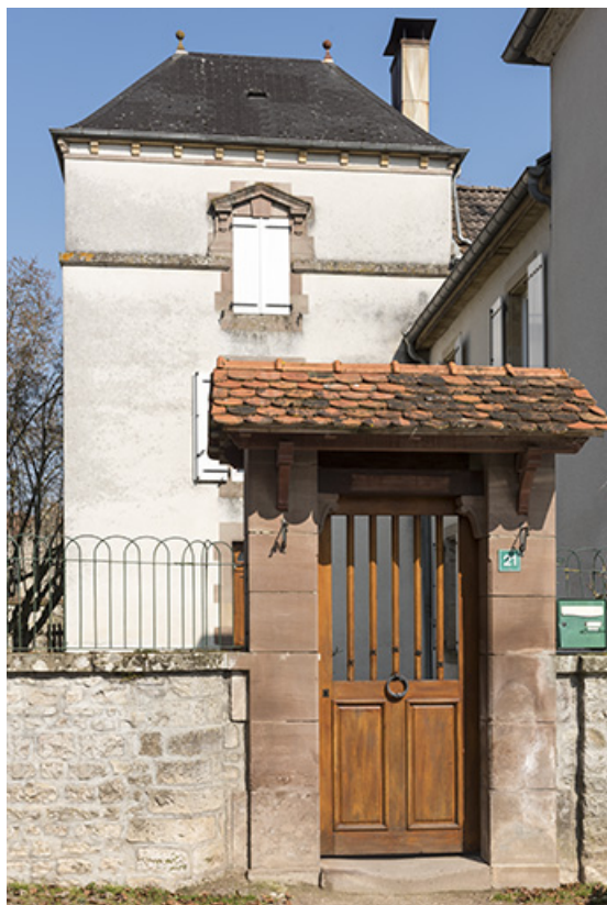
Le portillon vu de la rue.