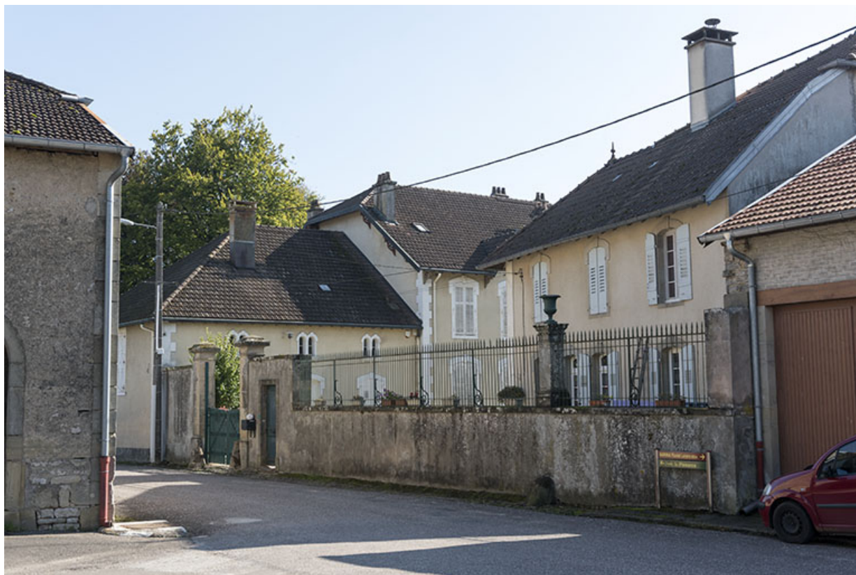
Vue depuis le nord-ouest sur l'entrée de la demeure, sa dépendance et sa façade (nord) sur rue. 70, Corre, 26, lieudit : 28 rue Billecard