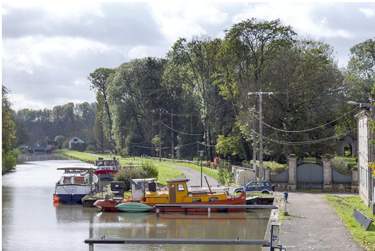
Vue sur le canal, le chemin de contre-hâlage, le port, le parc Barbey et son portail, depuis le nord-est. 70, Corre, 26, lieudit : 28 rue Billecard