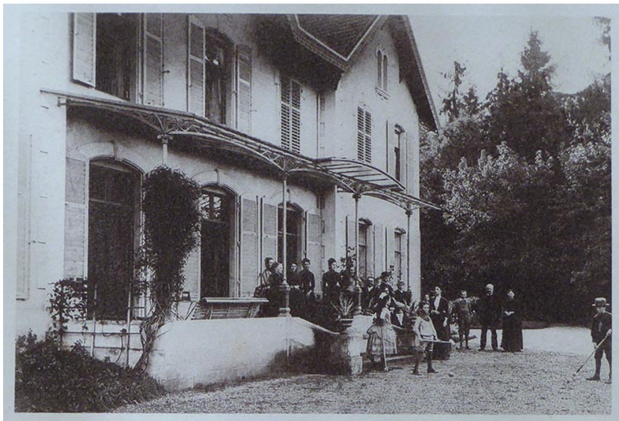
Groupe de personnes sur le perron sous la marquise en septembre 1887. 70, Corre, 26, lieudit : 28 rue Billecard