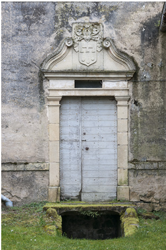
La porte d'entrée.