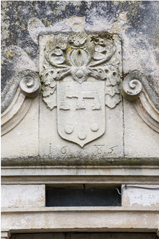
Détail des armoiries surmontant la porte.