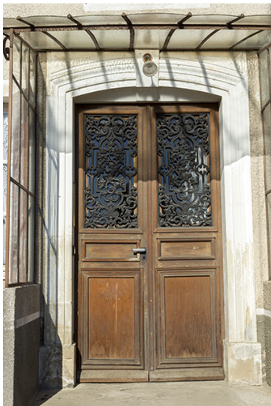
Détail de la porte principale sur rue.