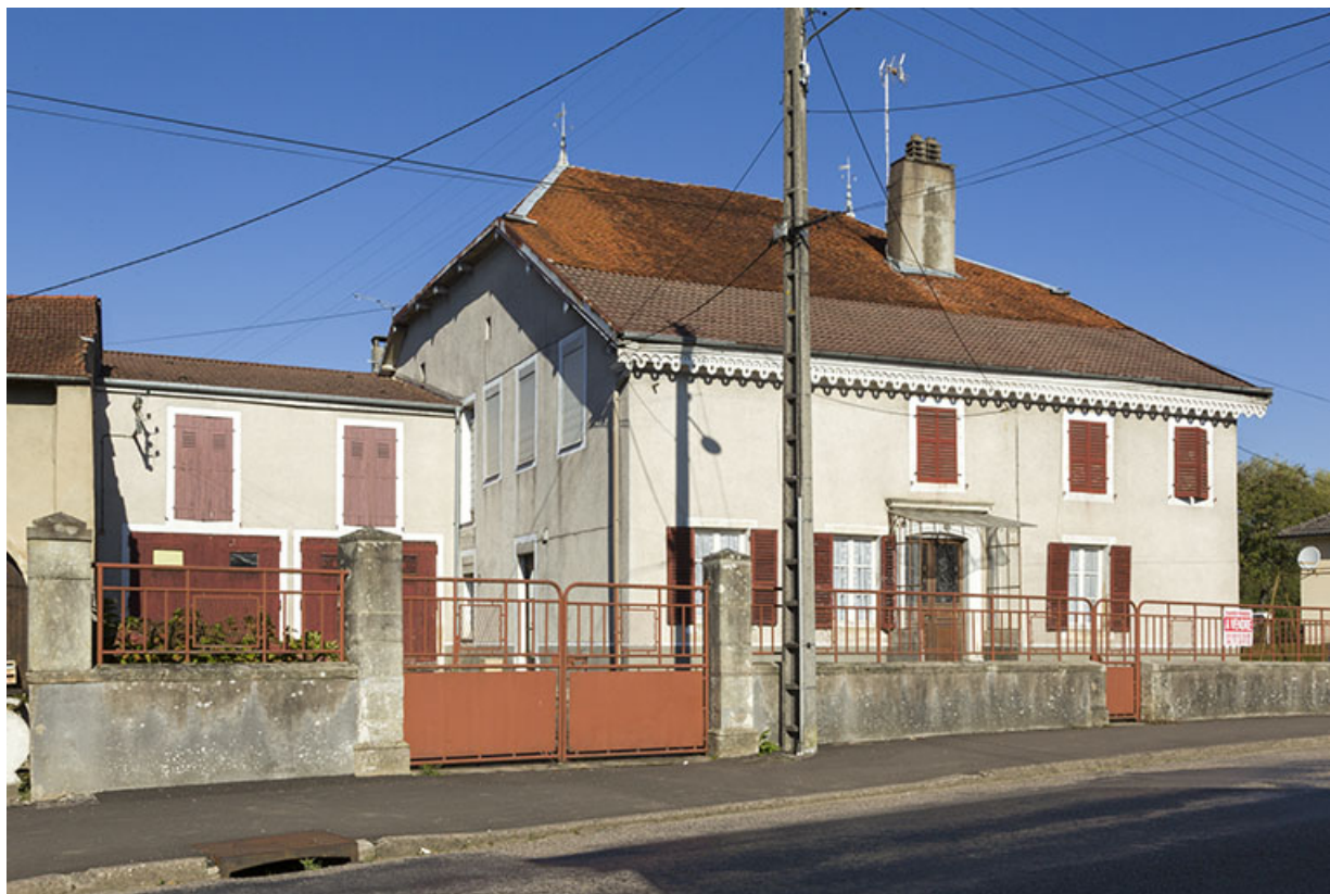
Façade antérieure vue depuis la rue au sud-est.