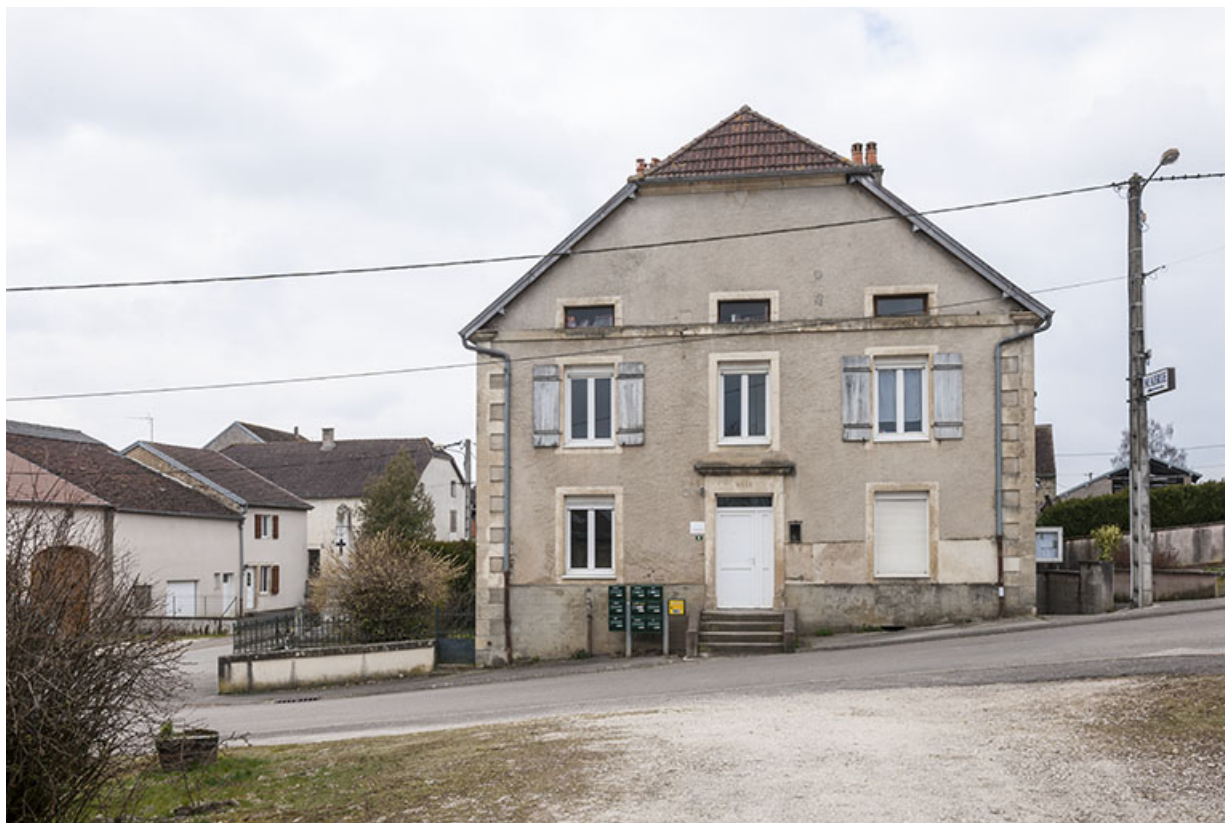
Vue sur la façade principale.