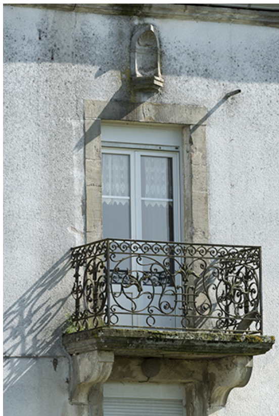
Détail d'une baie.