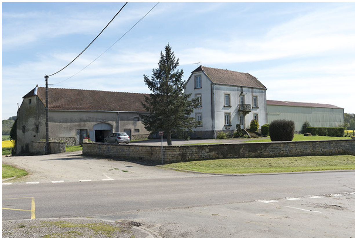
Ferme à l'entrée d'Aisey. 70, Aisey-et-Richecourt