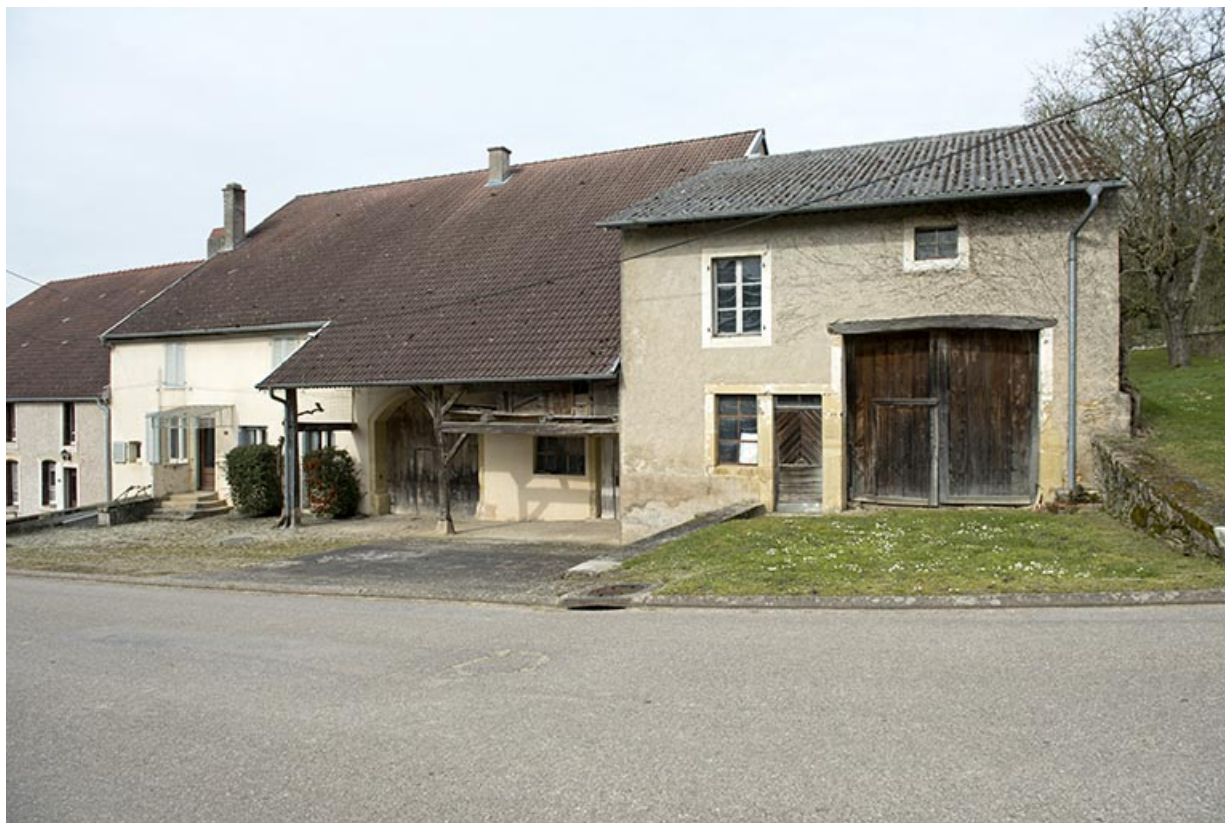
Fermes, Grande rue. 70, Aisey-et-Richecourt