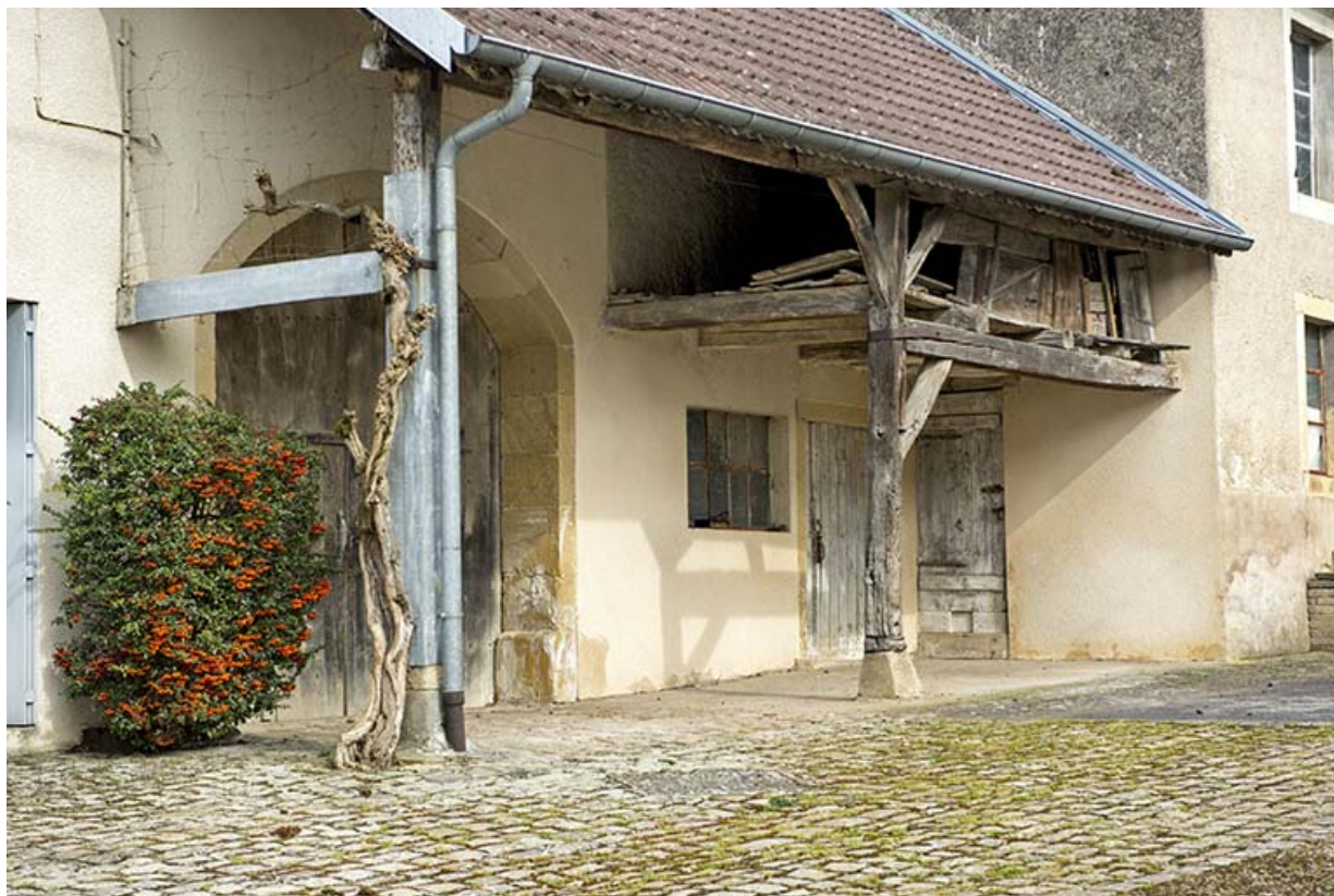
Auvent protégeant l'entrée de la grange.