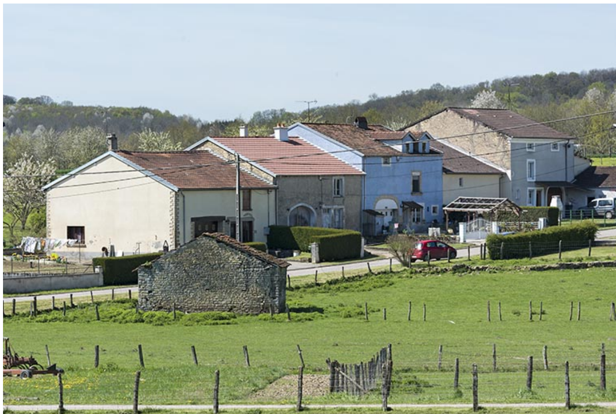
Alignement de fermes à Aisey.