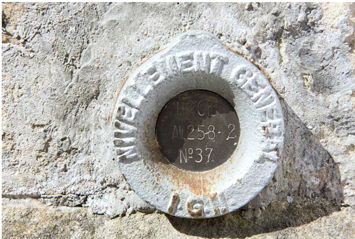
Répère de nivellement, église d'Aisey. 70, Aisey-et-Richecourt