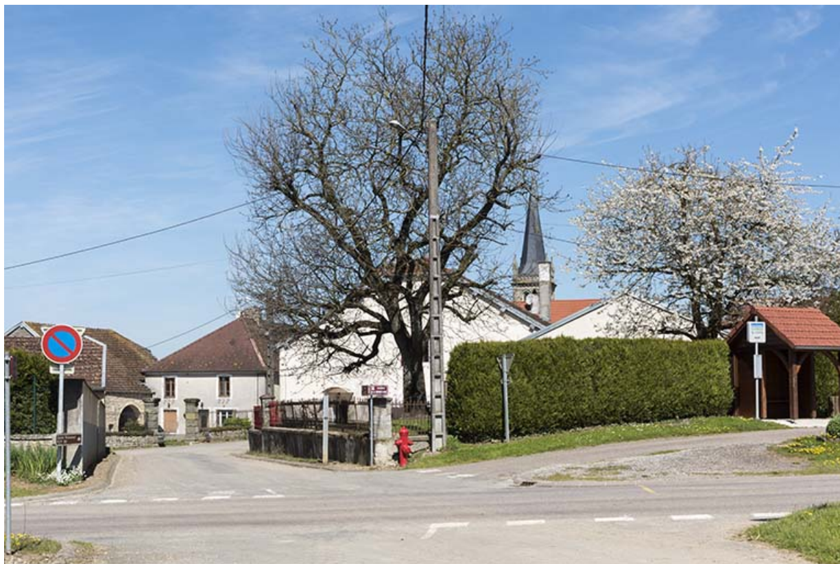
Intersection entre la départementale 44 et la rue de l'Eglise.