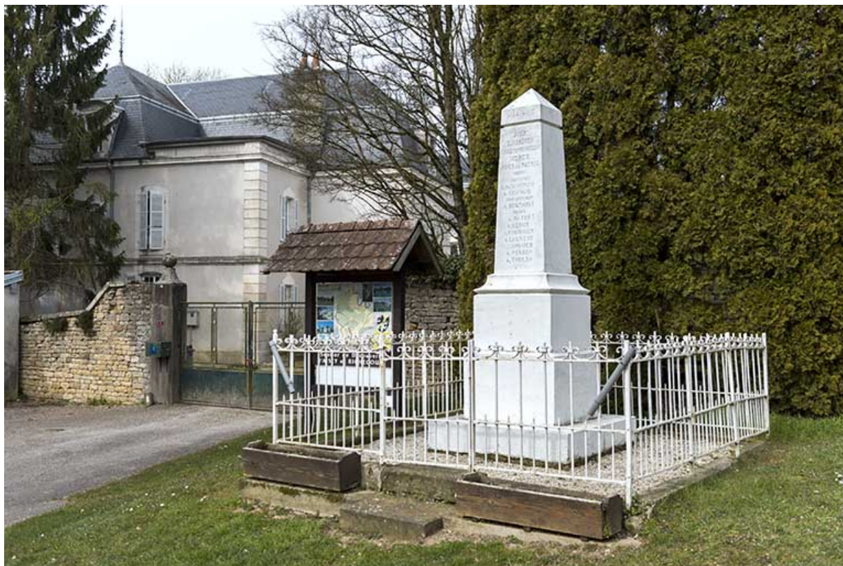
Le monument aux morts à proximité de l'église.