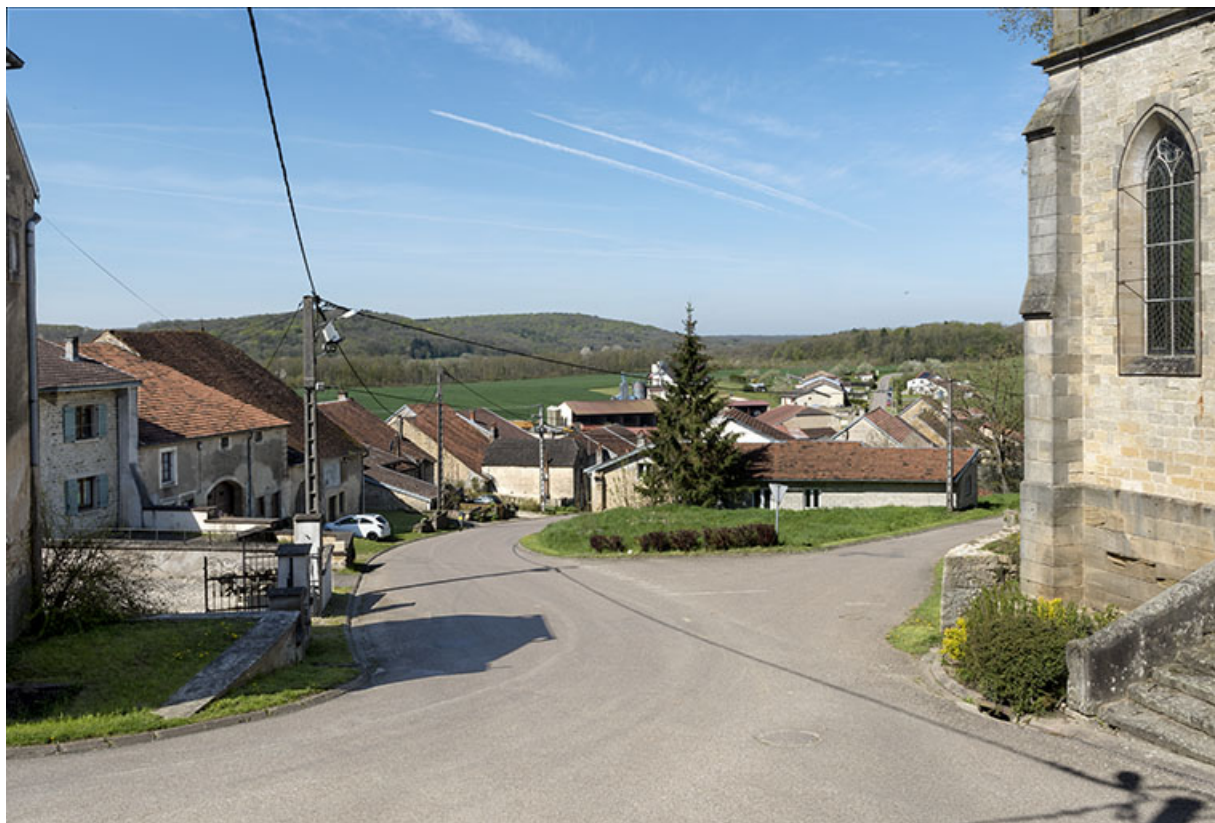
La Grande rue depuis l'église.