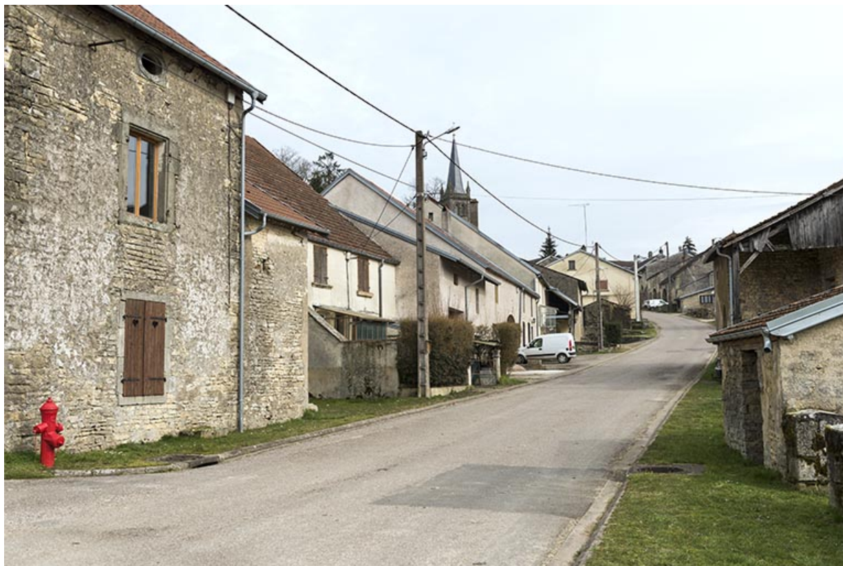
La Grande rue, Aisey. 70, Aisey-et-Richecourt