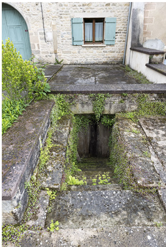
Entrée de cave.