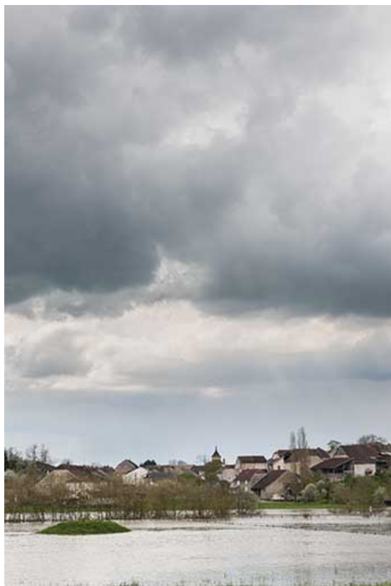
Le village lors d'une crue de la Saône.