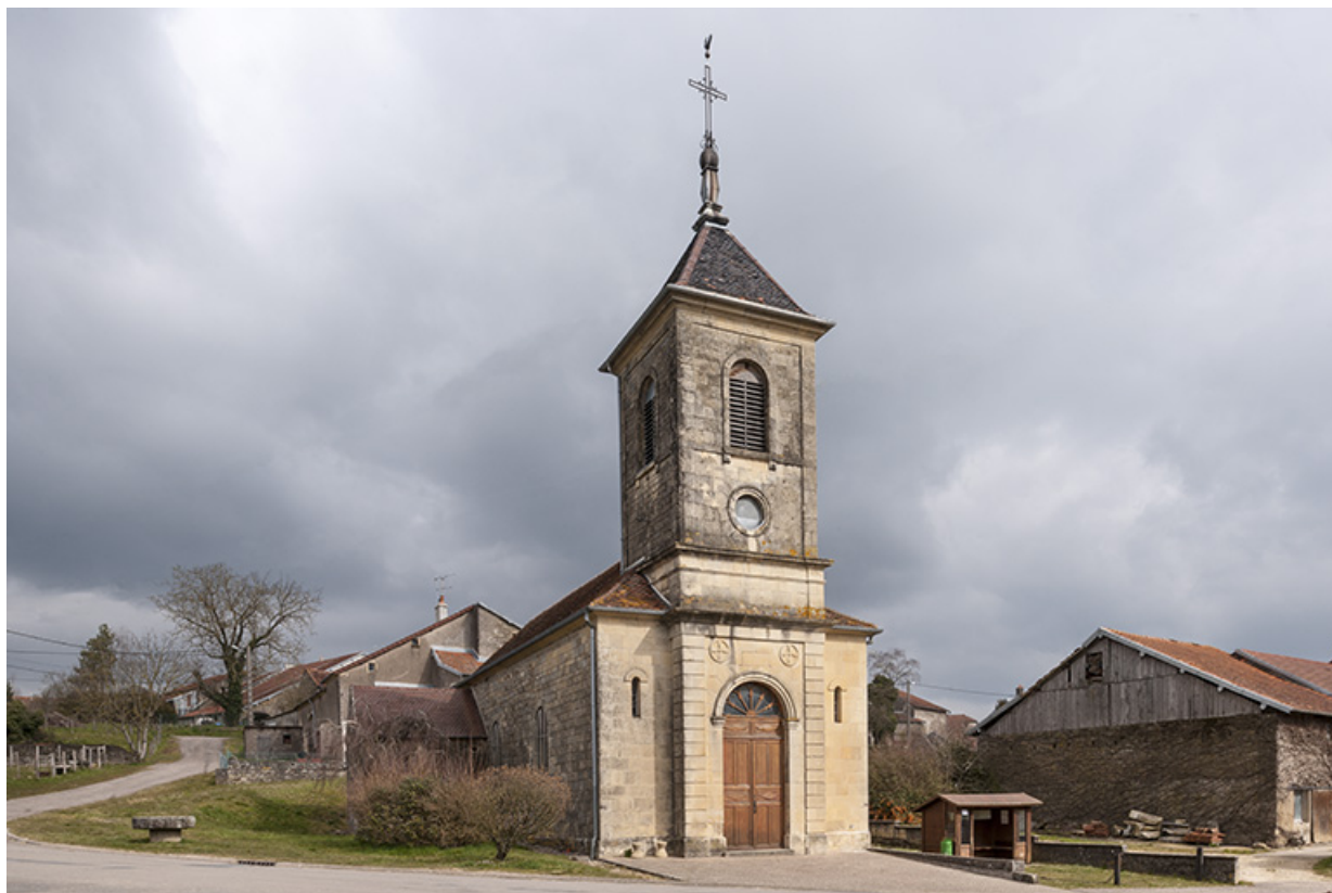
L'église et le bâti présent autour. 70, Fouchécourt