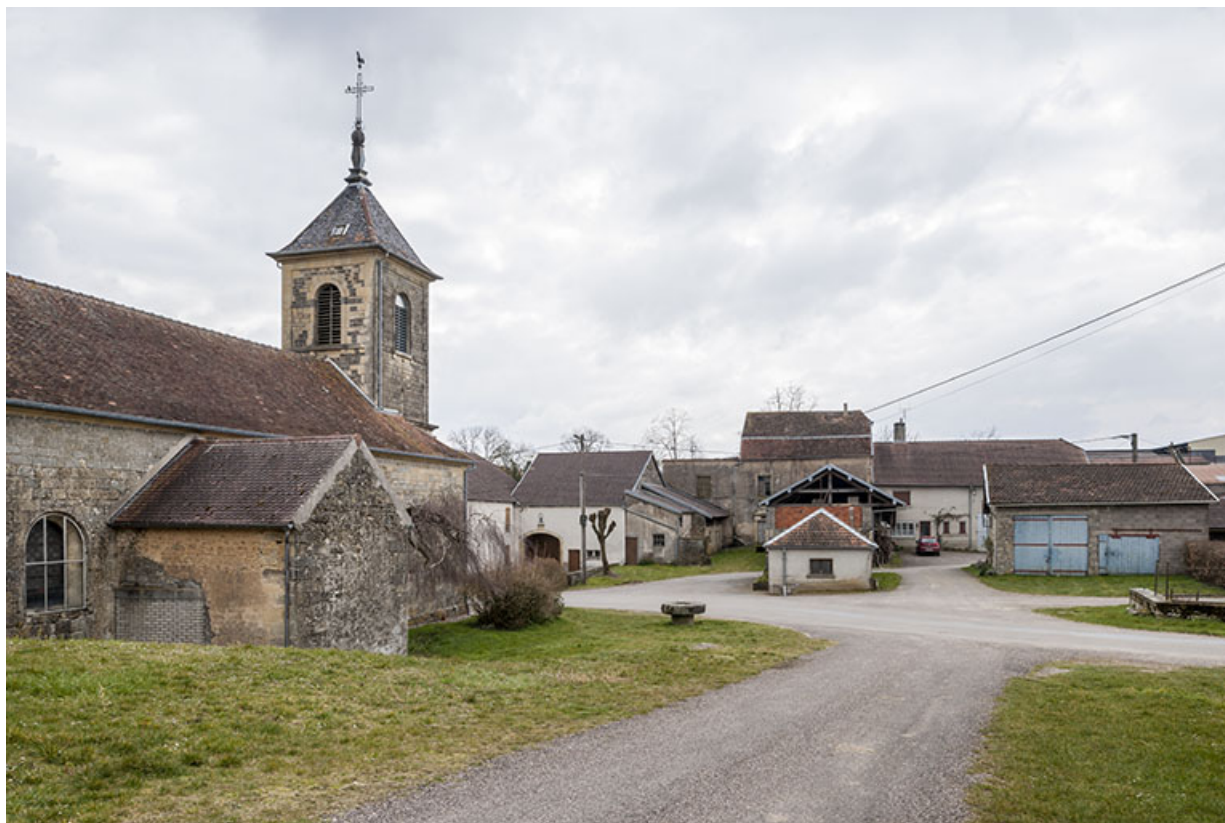
Vue sur le centre du village.