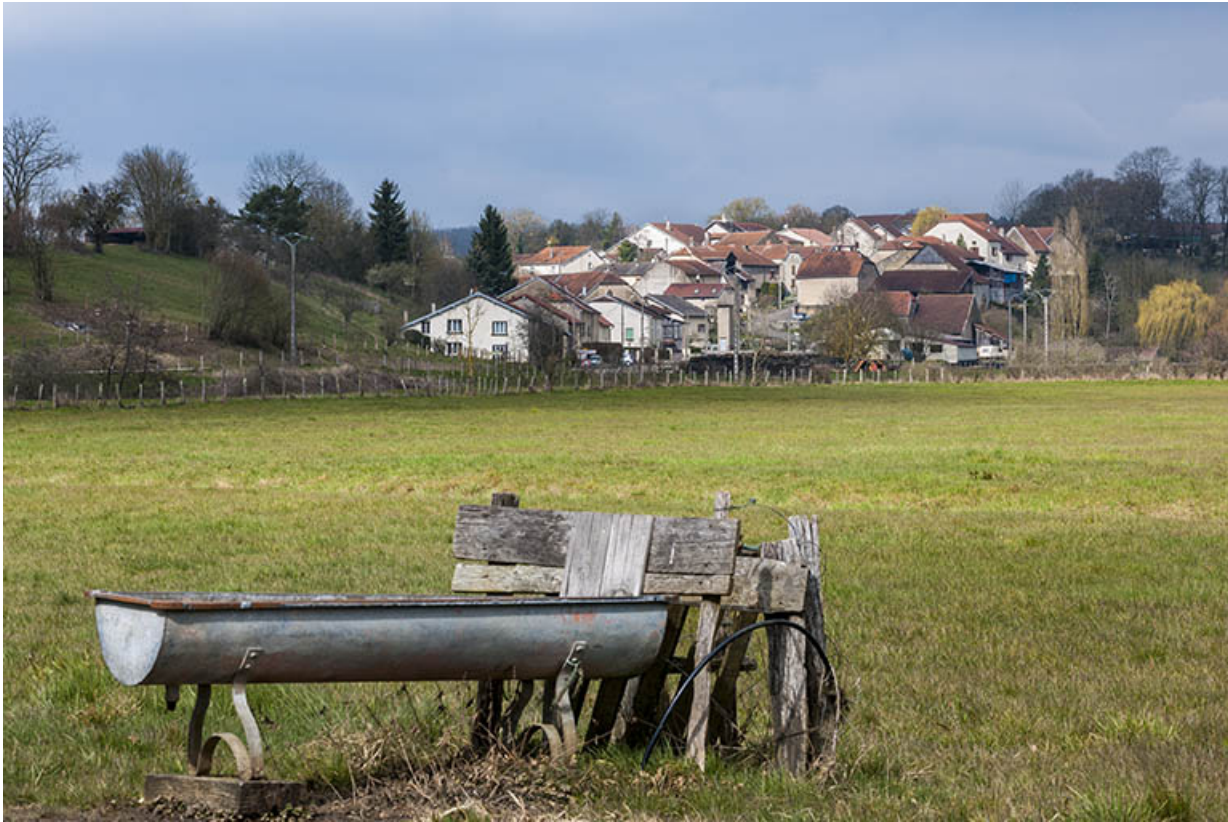
Vue sur le village.