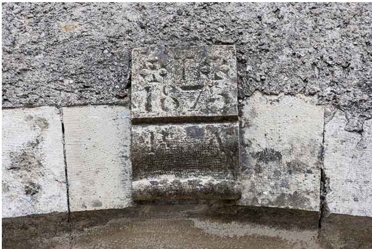
Détail sur une clé de voûte.