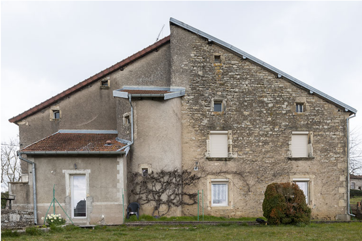
détail sur la maison avec tourelle.