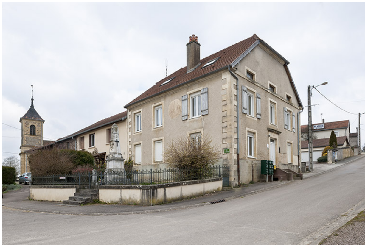
La rue de l'église. 70, Fouchécourt