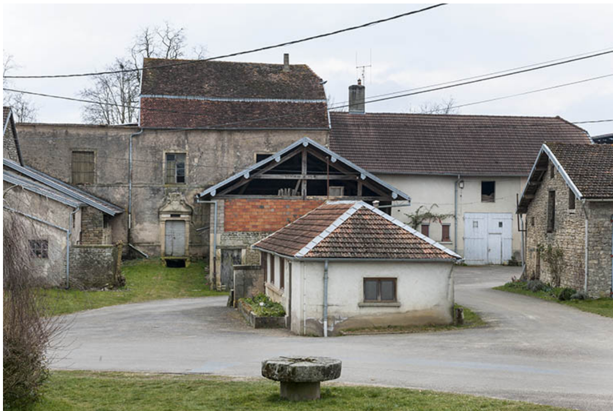
L'ancien lavoir avec en arrière plan, l'ancien presbytère. 70, Fouchécourt