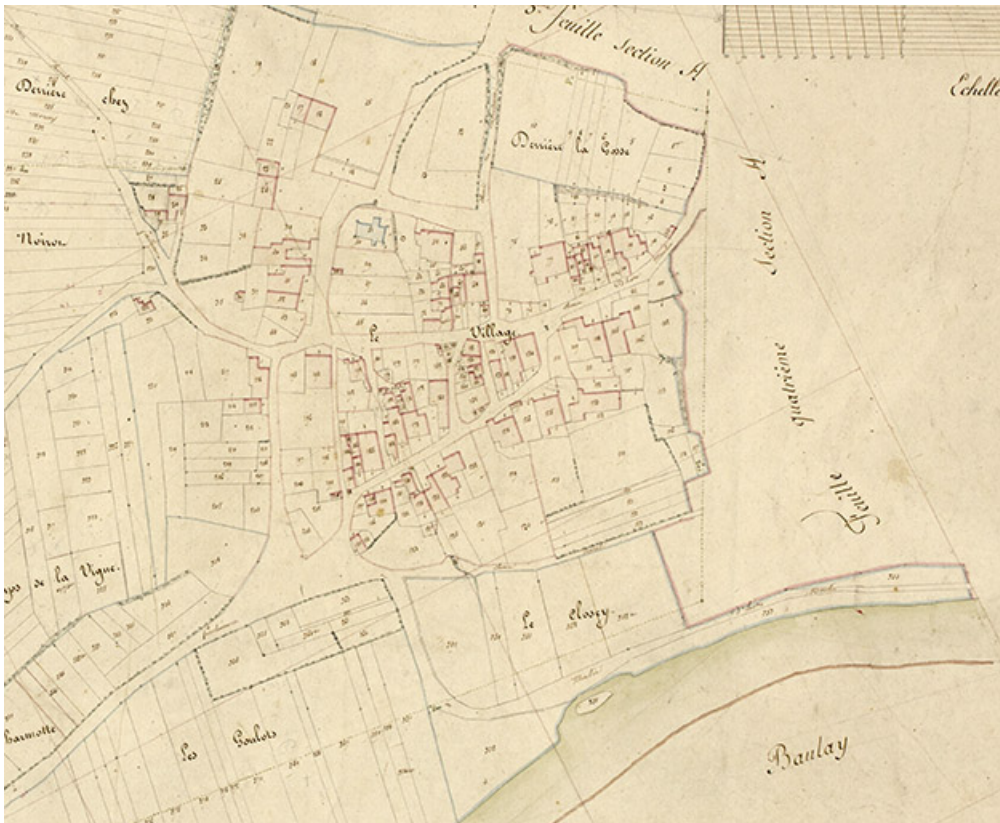
Plan du village extrait du plan cadastral , 1825. 70, Fouchécourt