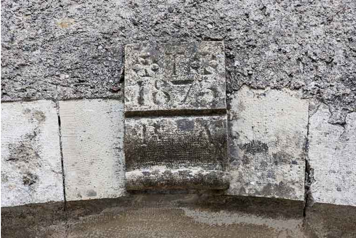
Dtéal sur une clé de voute.