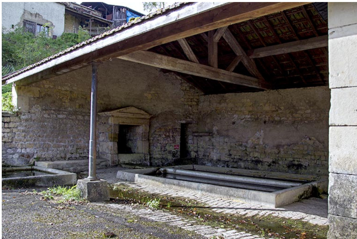
Le lavoir, rue de la Fontaine. 70, Fouchécourt