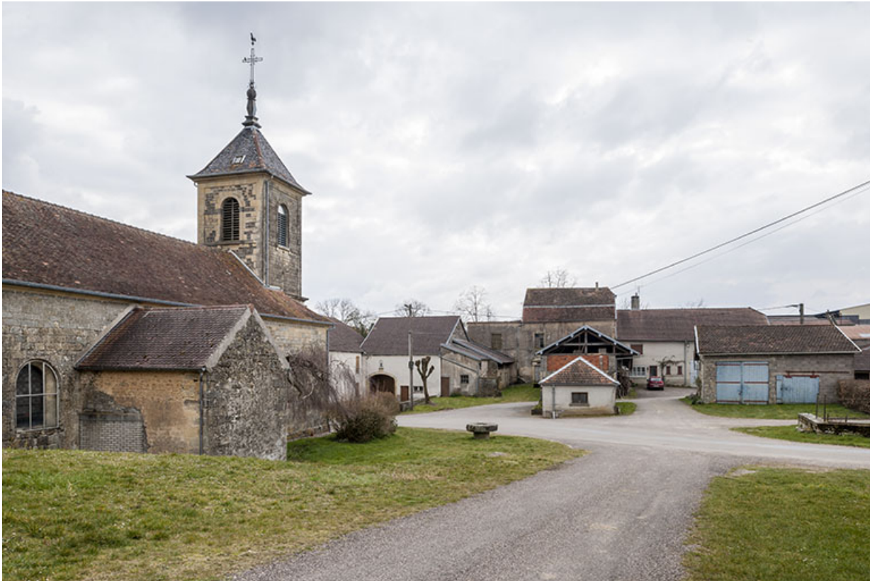
Vue sur le centre du village.