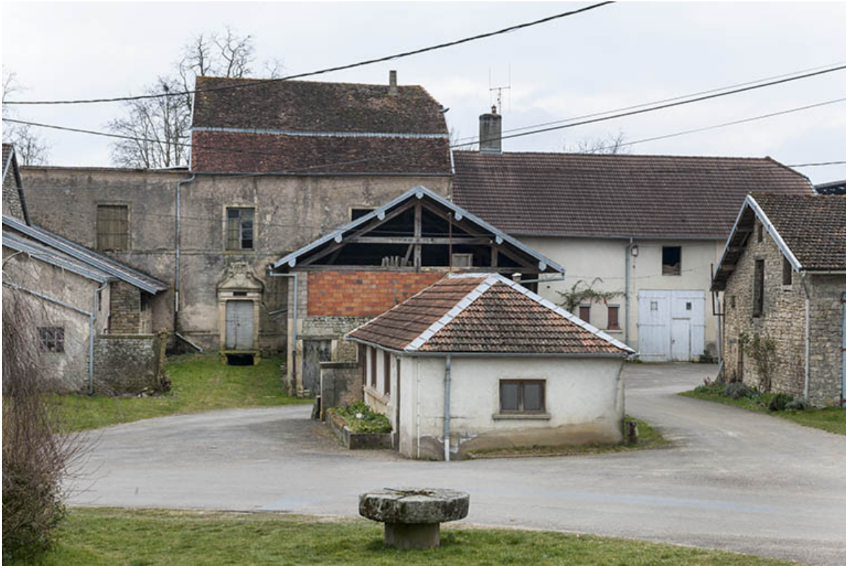
L'ancien lavoir avec en arrière plan, l'ancien presbytère.