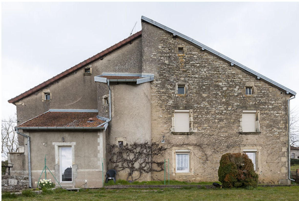
détail sur la maison avec tourelle.