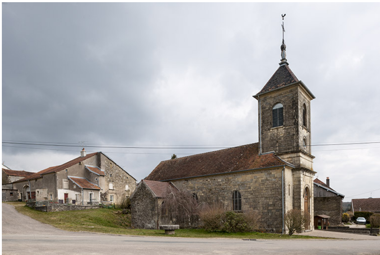
L'église et en arrière plan, une maison avec tourelle. 70, Fouchécourt