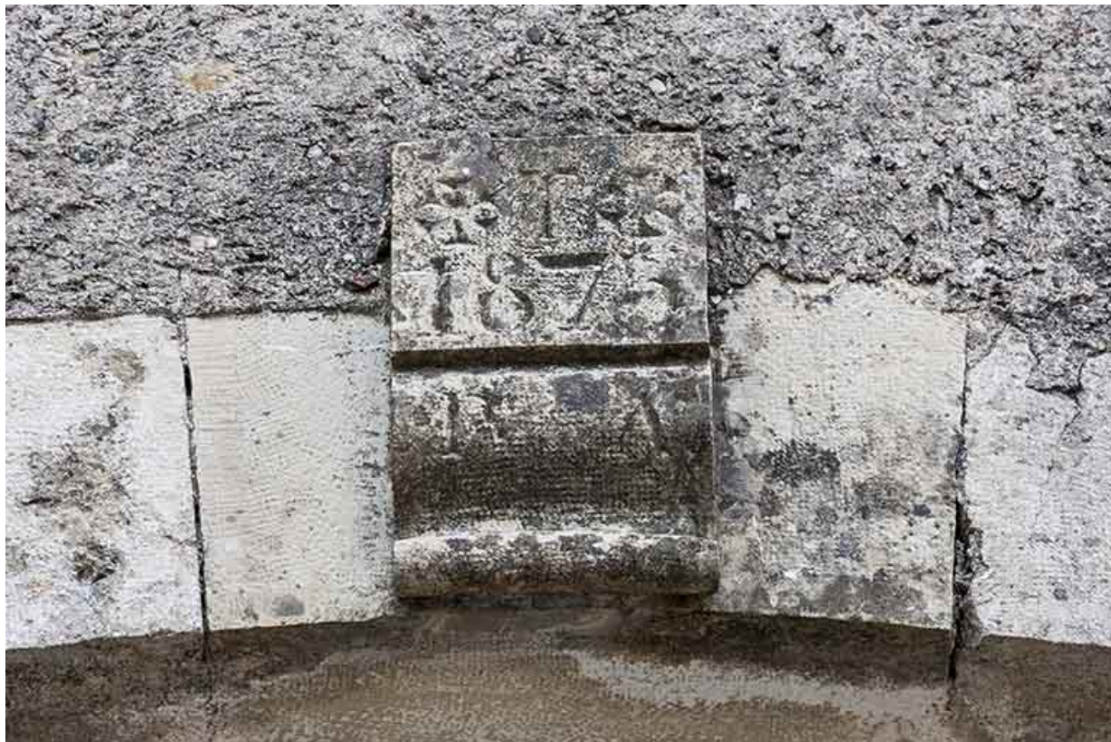
Détail sur une clé de voûte.