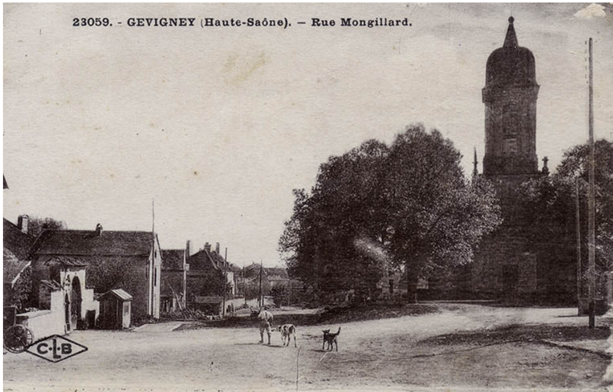
La rue Mongillard avec l'église, carte postale. 70, Gevigney-et-Mercey