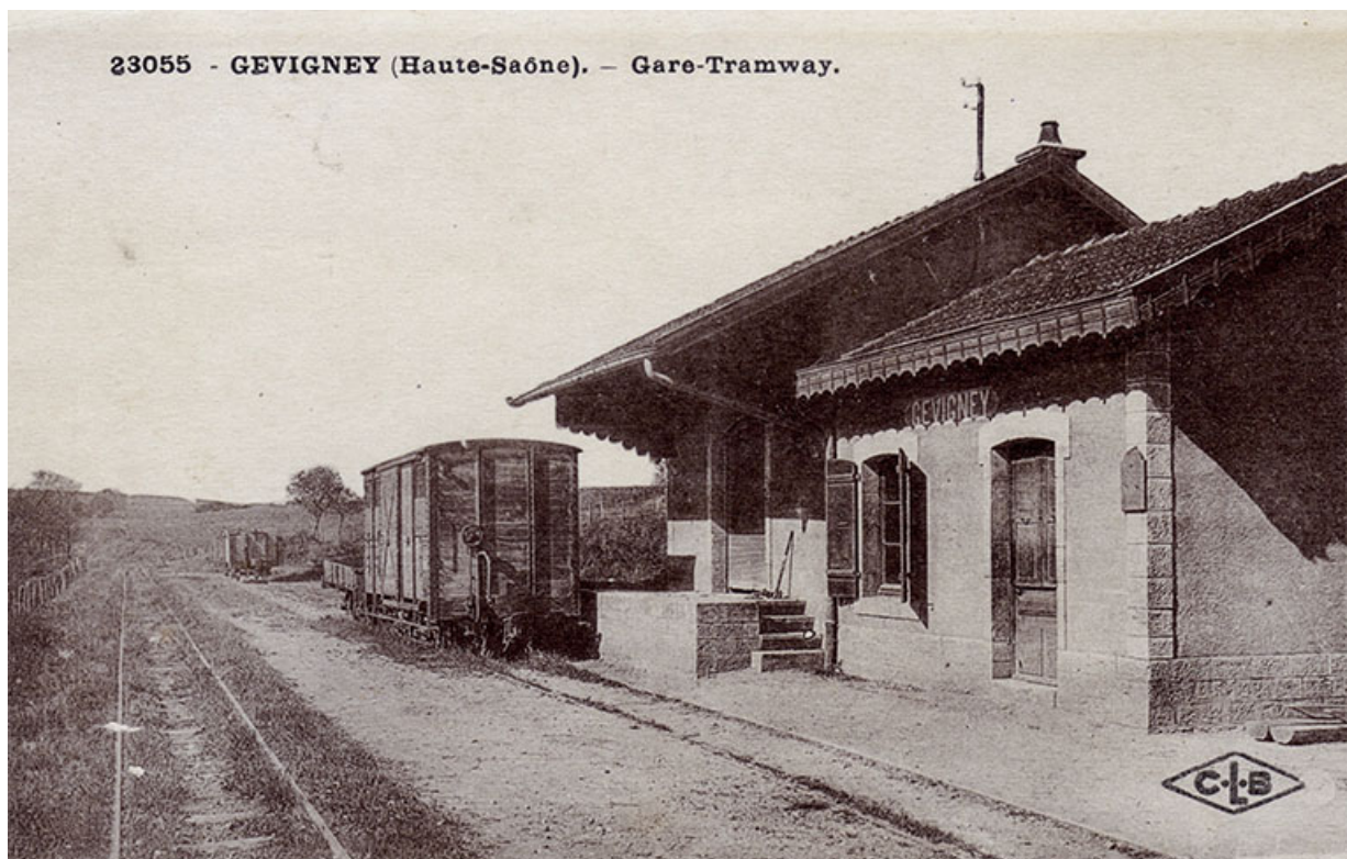
La gare-tramway de Gevigney, carte postale. 70, Gevigney-et-Mercey