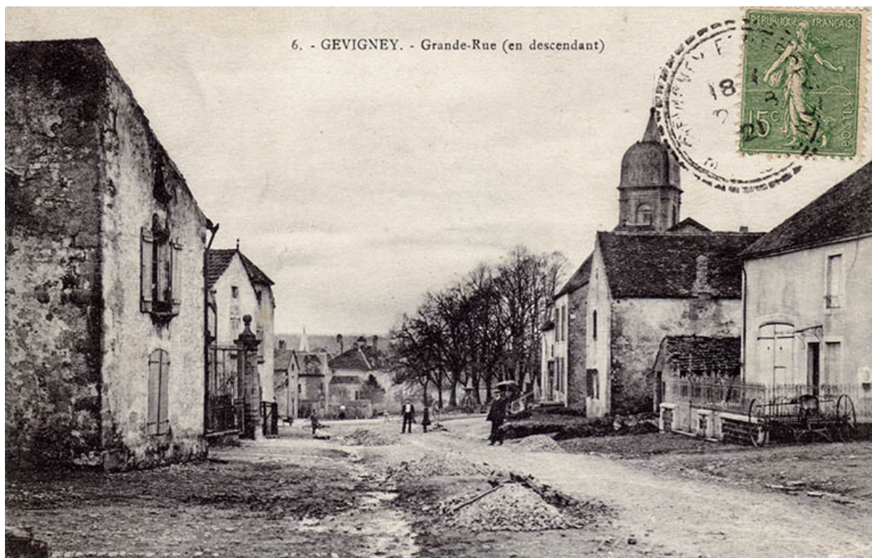
La Grande rue, en descendant, carte postale (1921).