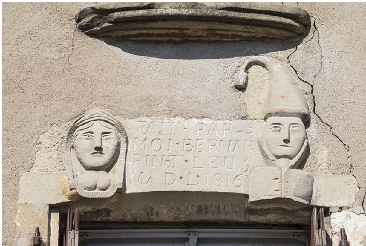
Figurines sur le linteau.