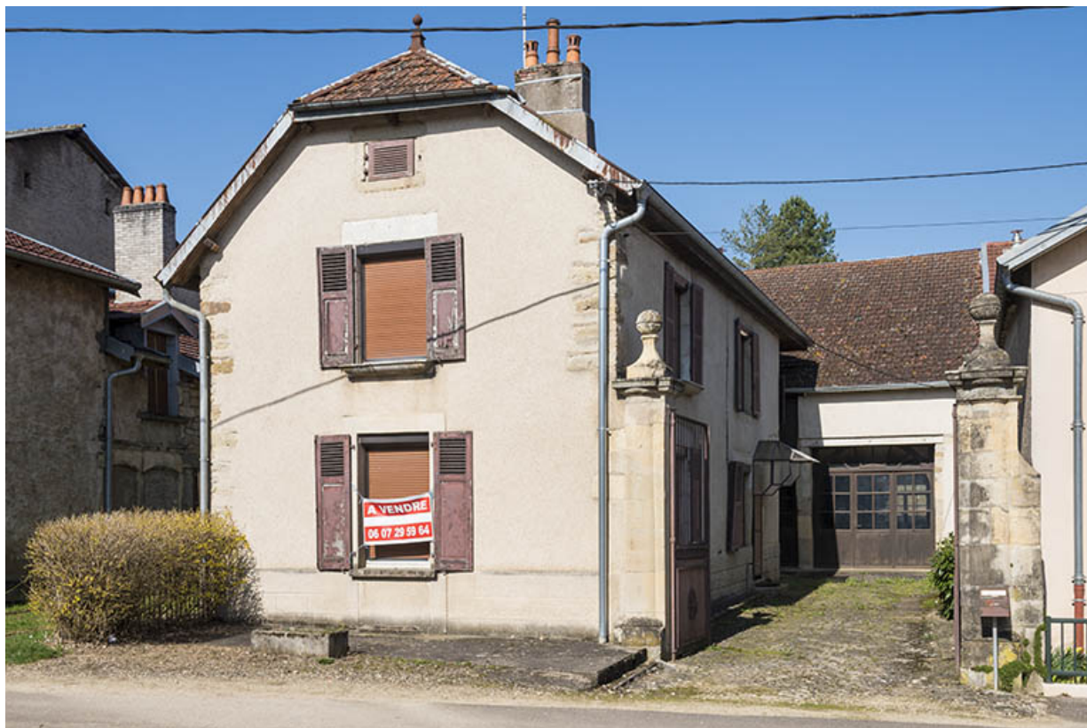
Détail d'une entrée de ferme avec des piliers sculptés.