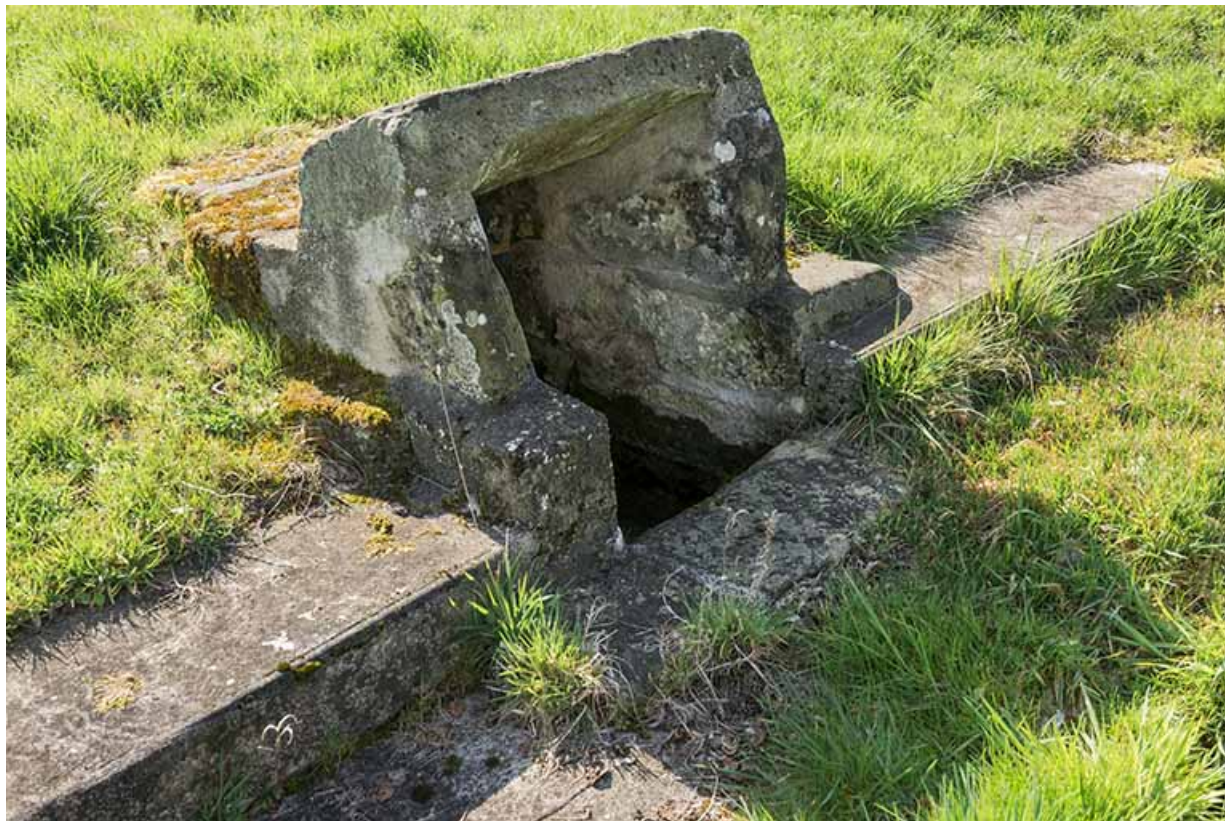
Fontaine d'alimentation du bassin.