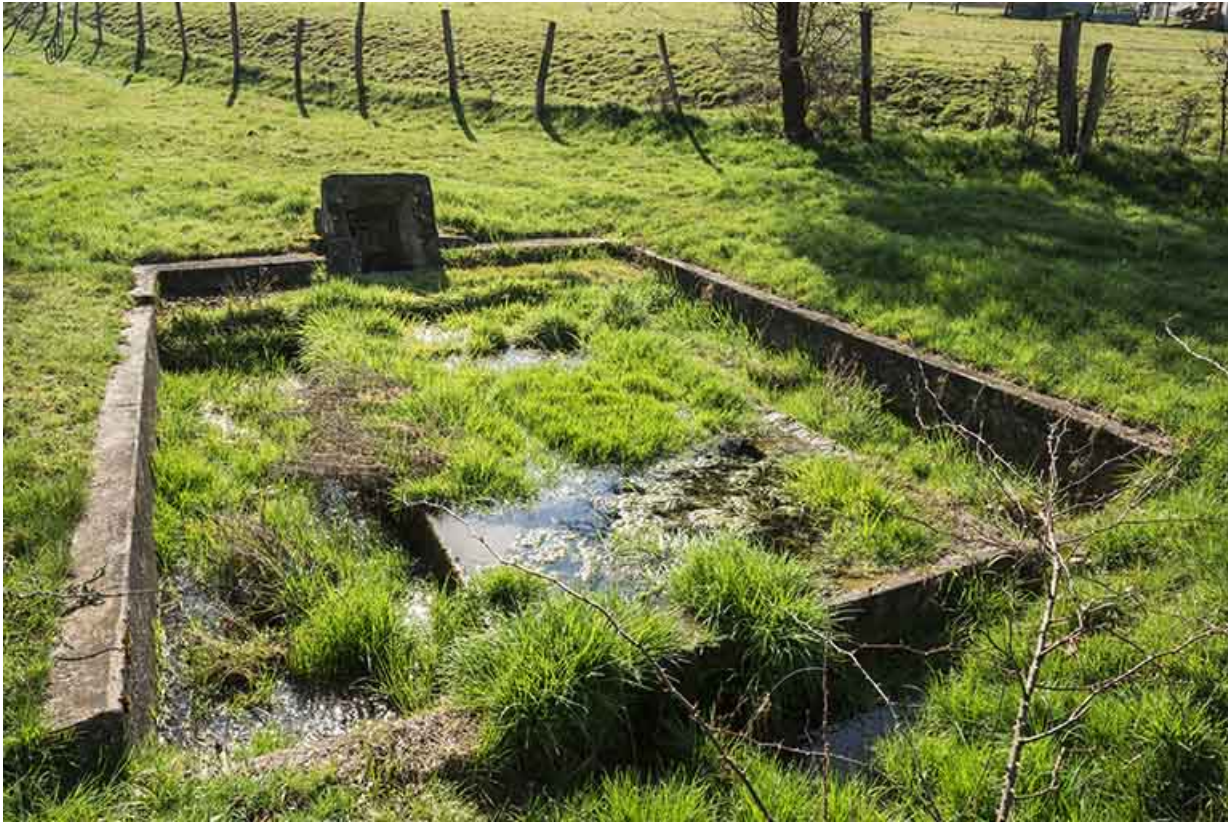
Lavoir, quartier des Graviers.