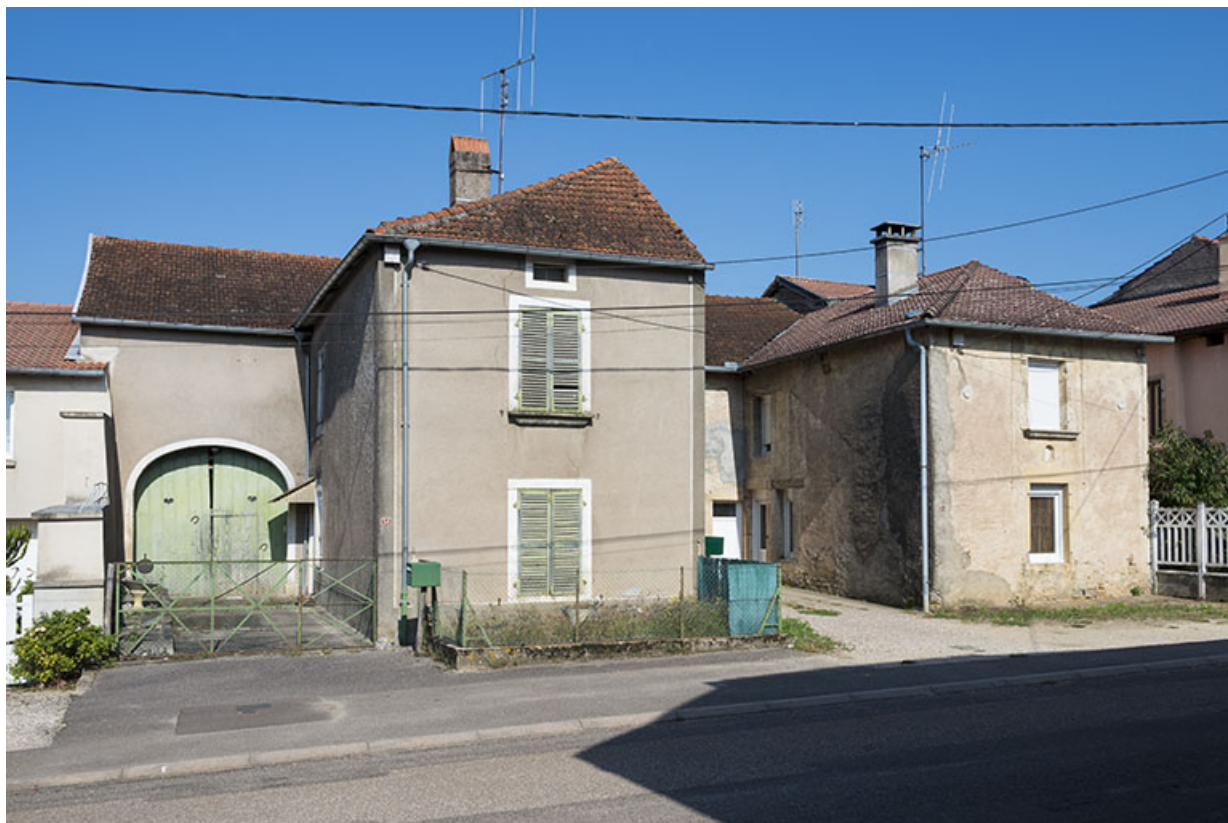
Détail d'une des fermes.