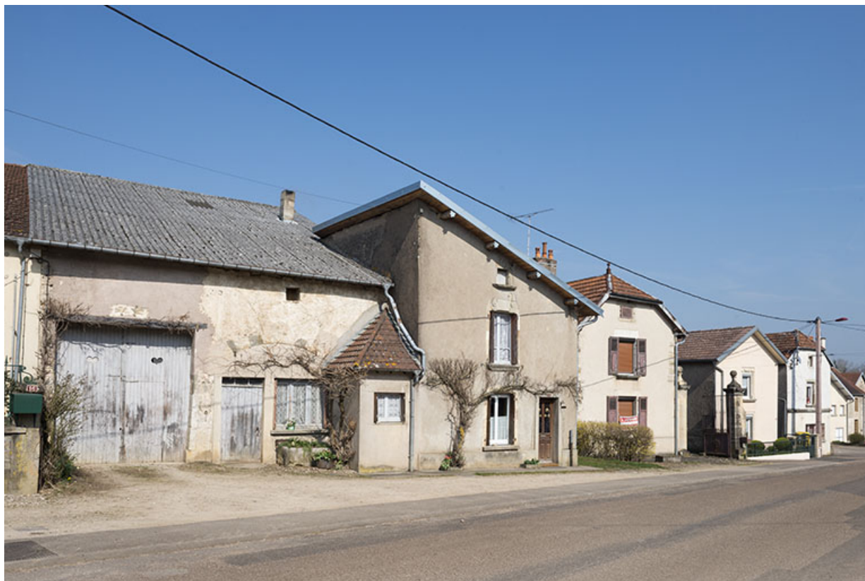
Vue générale, Grande rue.