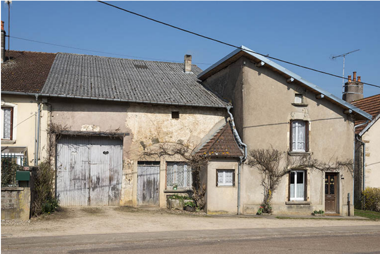
Vue générale de la maison.