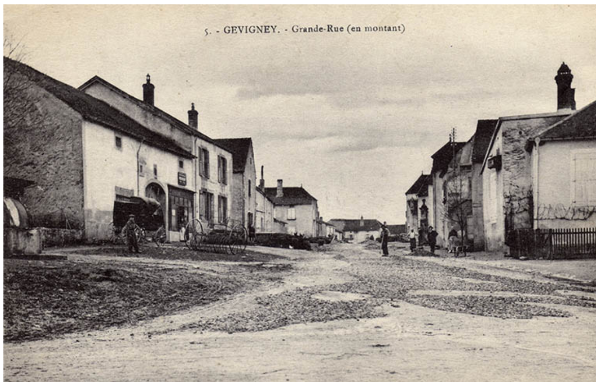
La Grande rue, carte postale (1909). 70, Gevigney-et-Mercey