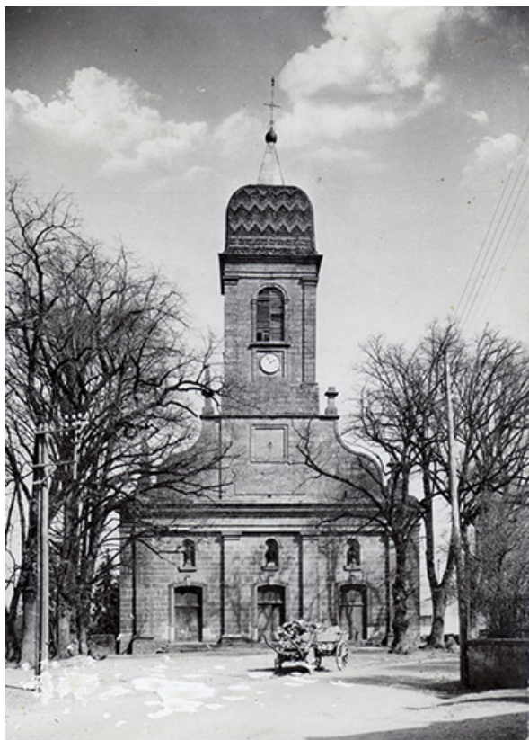
L'église, façade principale, carte postale. 70, Gevigney-et-Mercey