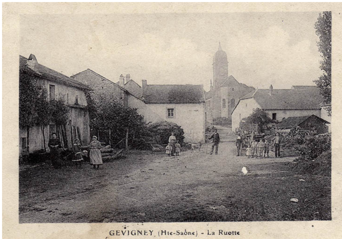
La Ruotte, carte postale.