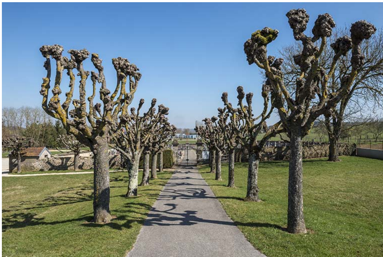
L'allée conduisant au cimetière.