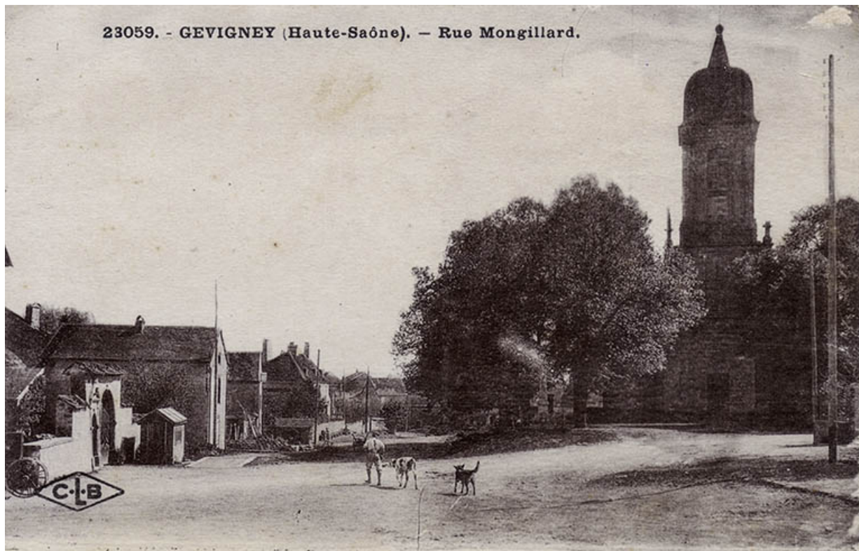
La rue Mongillard avec l'église, carte postale. 70, Gevigney-et-Mercey