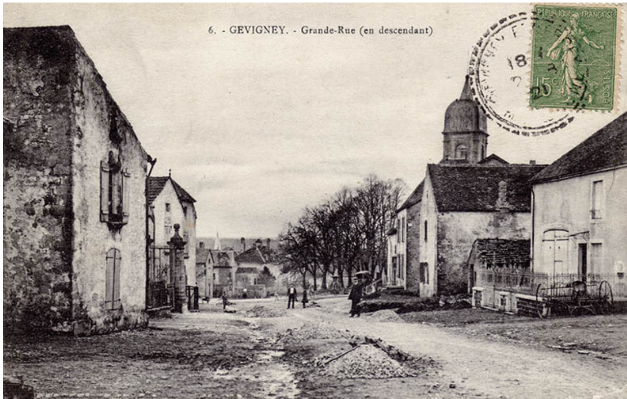
La Grande rue, en descendant, carte postale (1921).