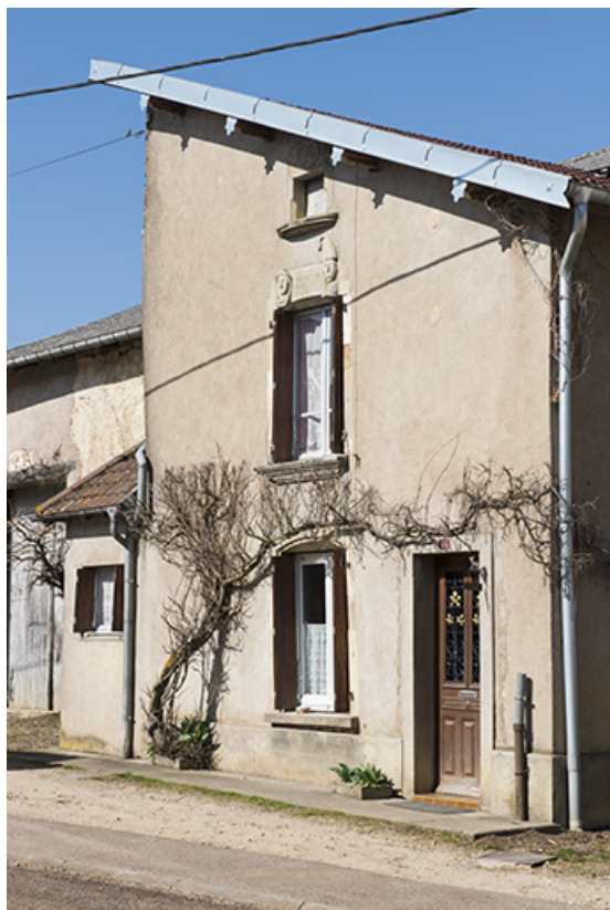
Maison disposant de linteaux décorés.