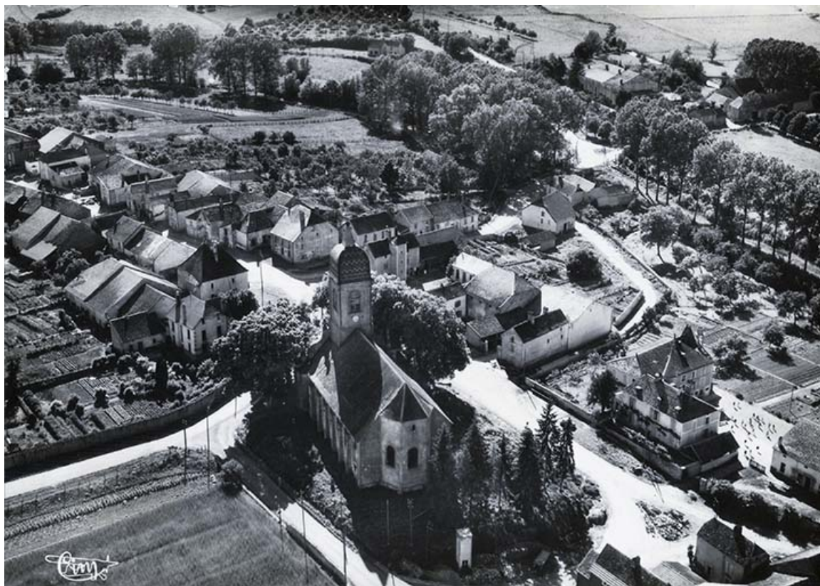
Vue aérienne de Gevigney, carte postale. 70, Gevigney-et-Mercey