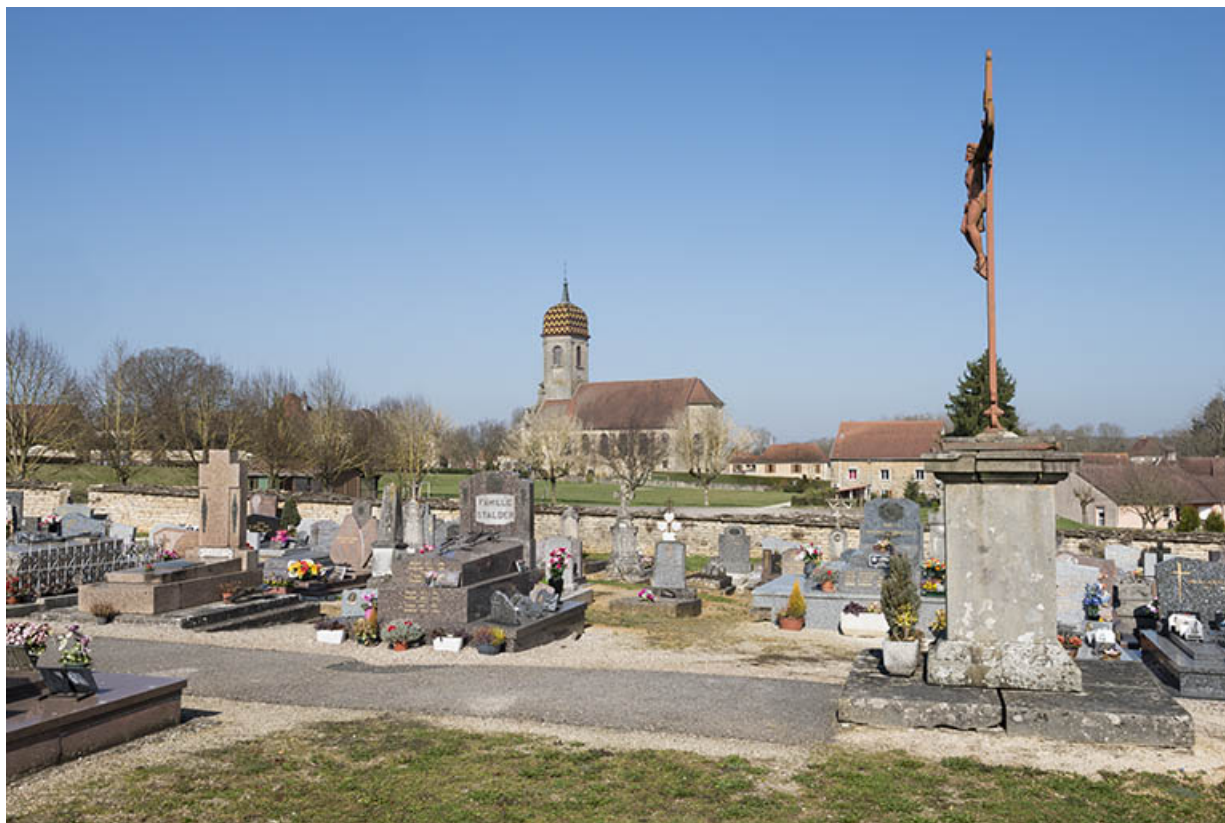
Le cimetière avec l'église en arrière plan.