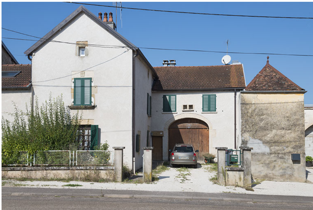
ferme, Grande rue.