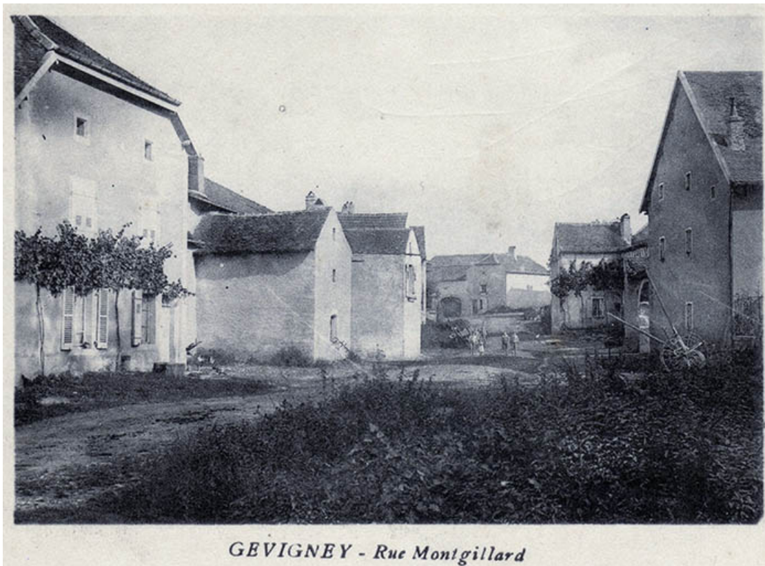
Alignement de fermes dans la rue Mongillard, carte postale (1891).