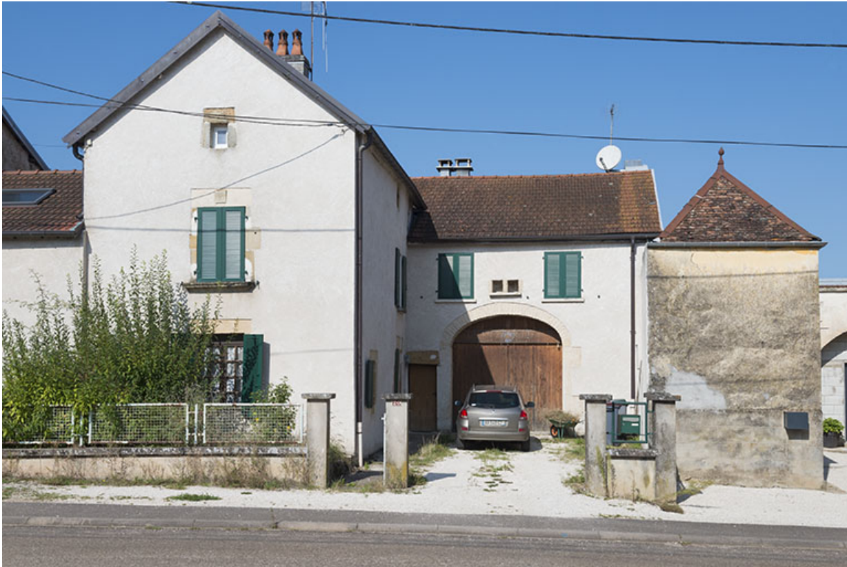
ferme, Grande rue.