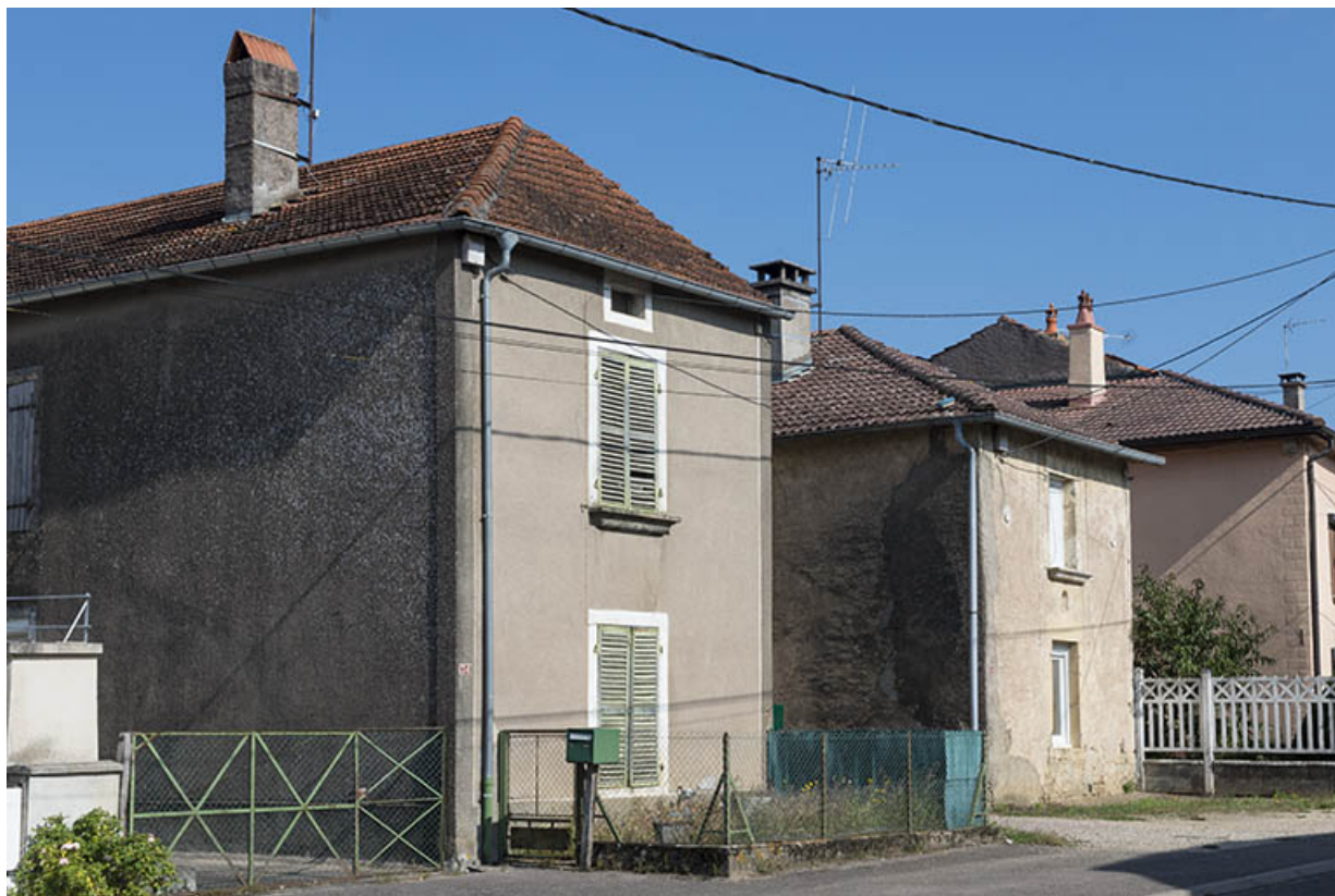
Alignement de fermes avec le logis en retour d'équerre.