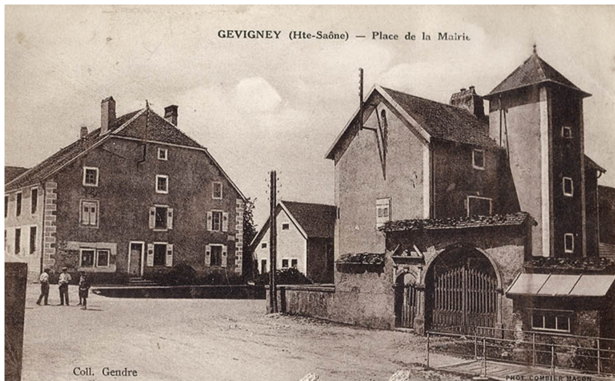
La place de la mairie, carte postale.