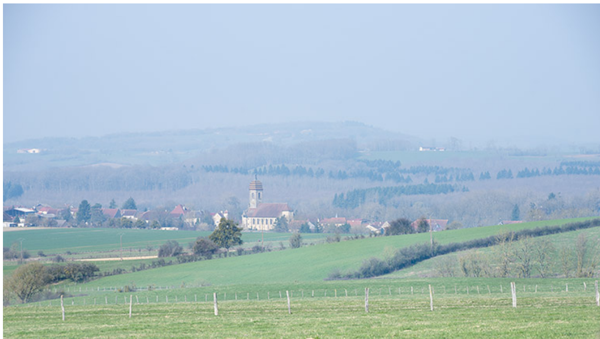
Le village de Gevigney, paysage.