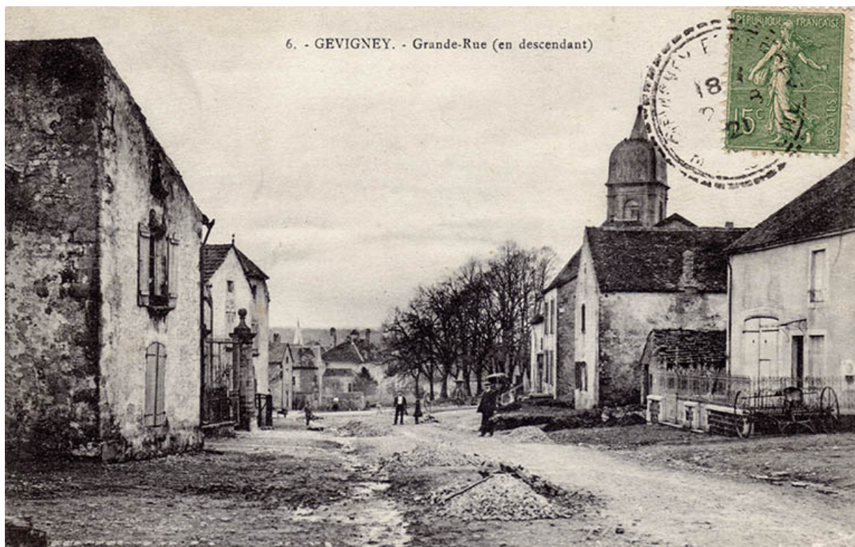
La Grande rue, en descendant, carte postale (1921). 70, Gevigney-et-Mercey