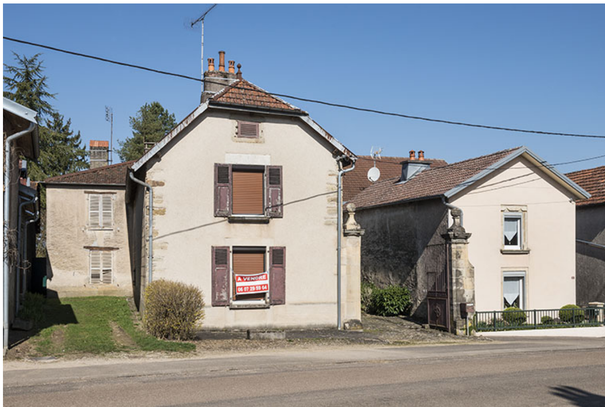
Vue sur l'usoir de la ferme.