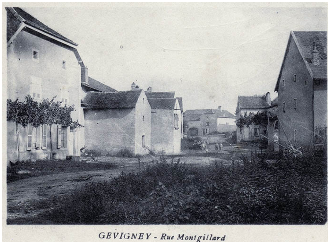
Alignement de fermes dans la rue Mongillard, carte postale (1891). 70, Gevigney-et-Mercey