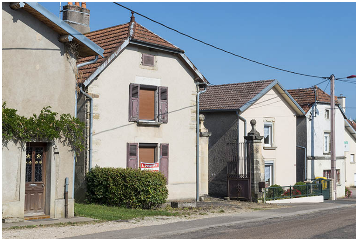
fermes avec "pignon sur rue".