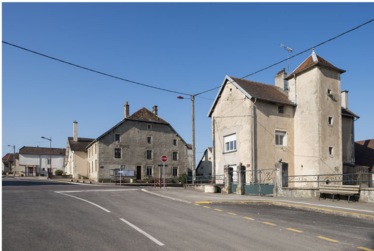
L'école et la mairie.