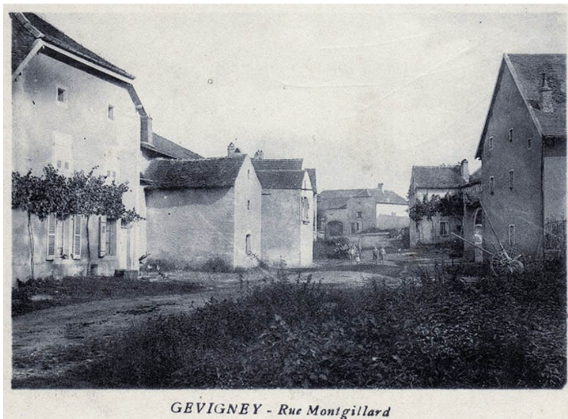
GEVIGNEY - Rue Mongillard

Alignement de fermes dans la rue Mongillard, carte postale (1891). 70, Gevigney-et-Mercey