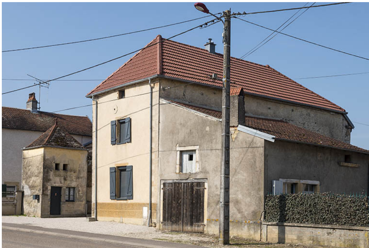
Ferme avec pigeonnier.