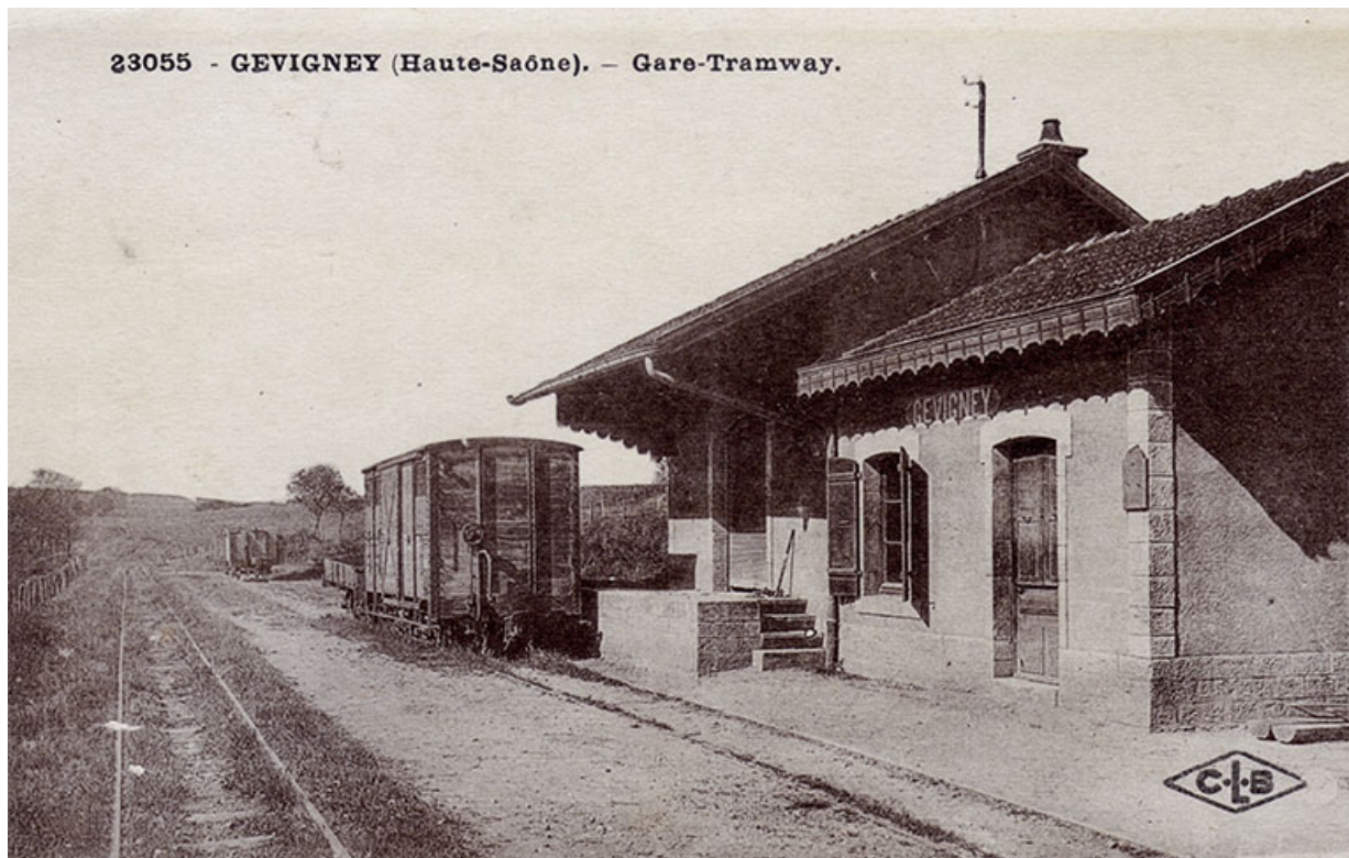
La gare-tramway de Gevigney, carte postale. 70, Gevigney-et-Mercey