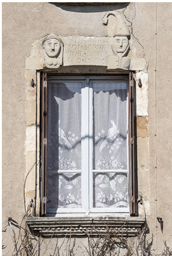
Fenêtre avec linteau décoré.