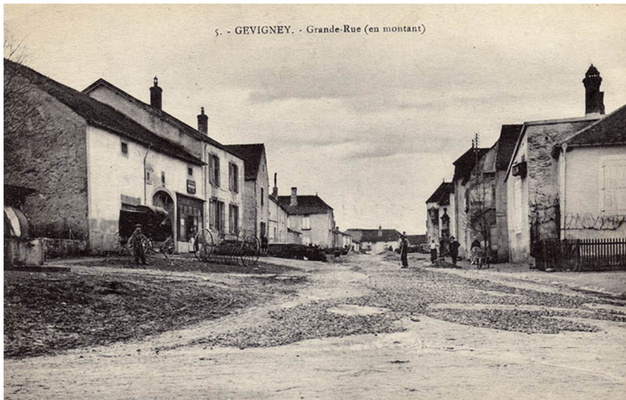
La Grande rue, carte postale (1909). 70, Gevigney-et-Mercey