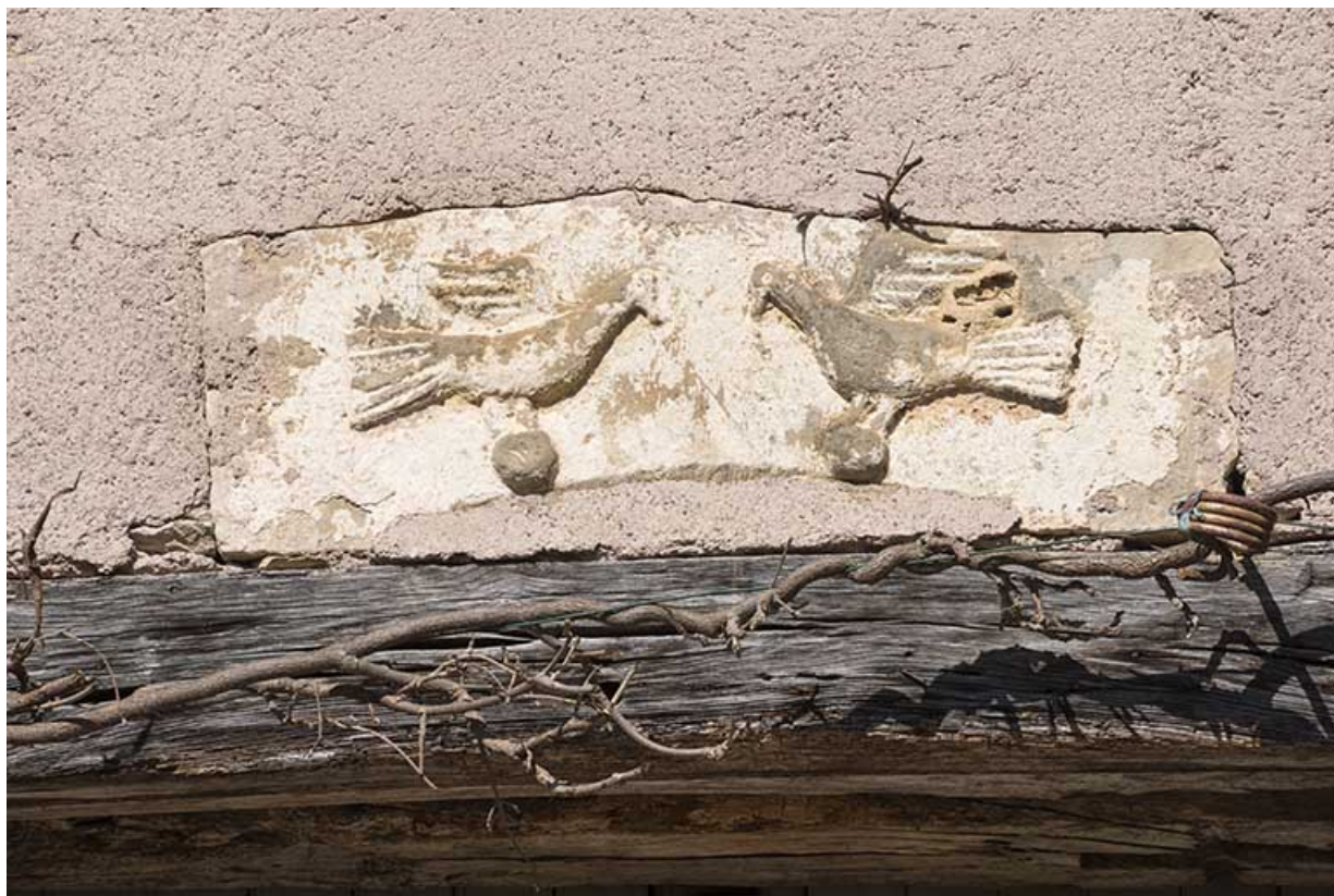
Détail d'un des linteaux.