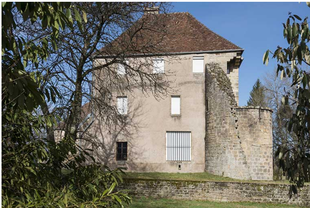
Le château de gevigney.