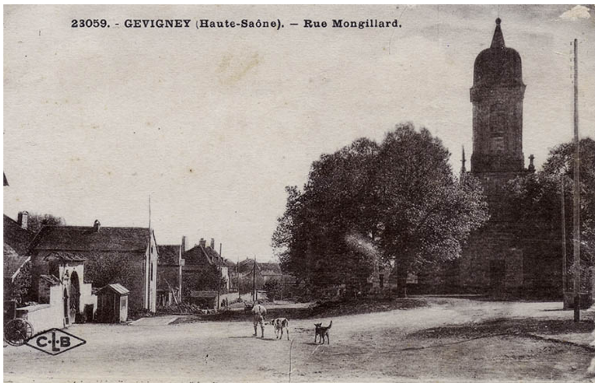
La rue Mongillard avec l'église, carte postale. 70, Gevigney-et-Mercey