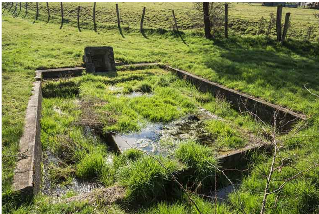
Lavoir, quartier des Gravieres.