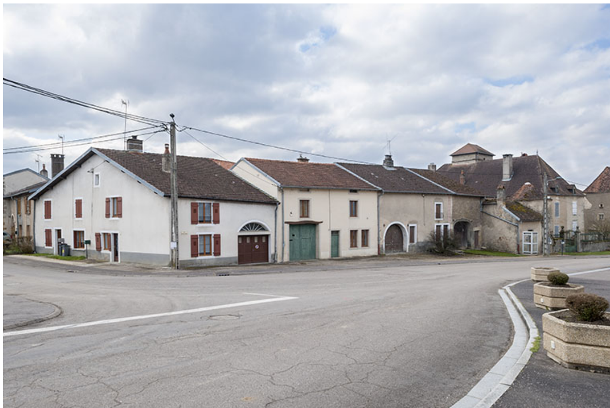
Alignement de fermes, rue Antoine Lumière. 70, Ormoy