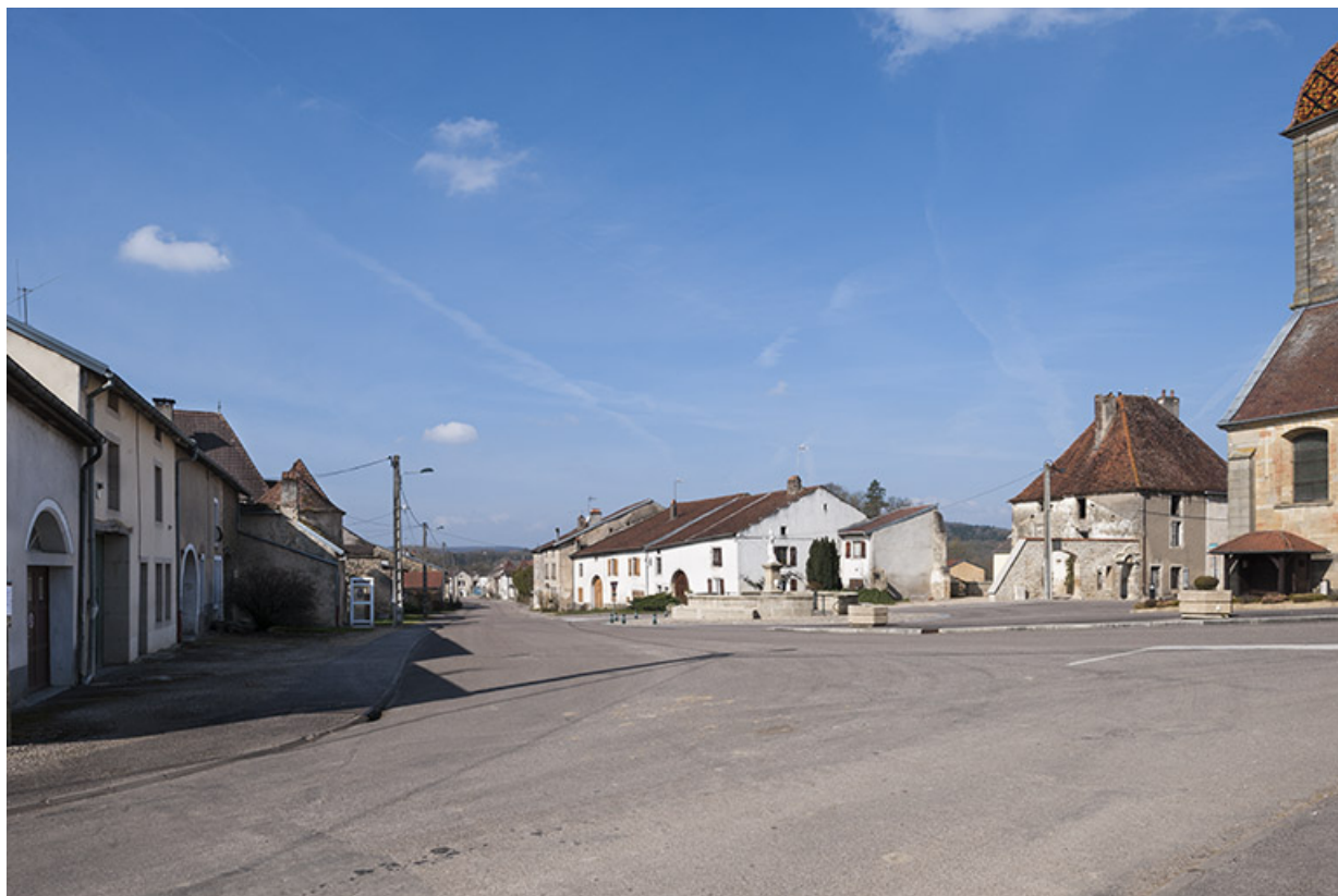
La place, rue Antoine Lumière. 70, Ormoy