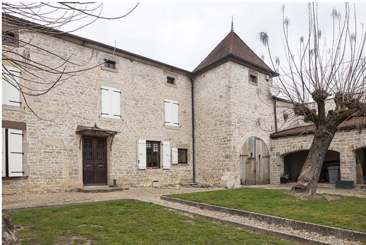
Maison, rue Antoine Lumière. 70, Ormoy