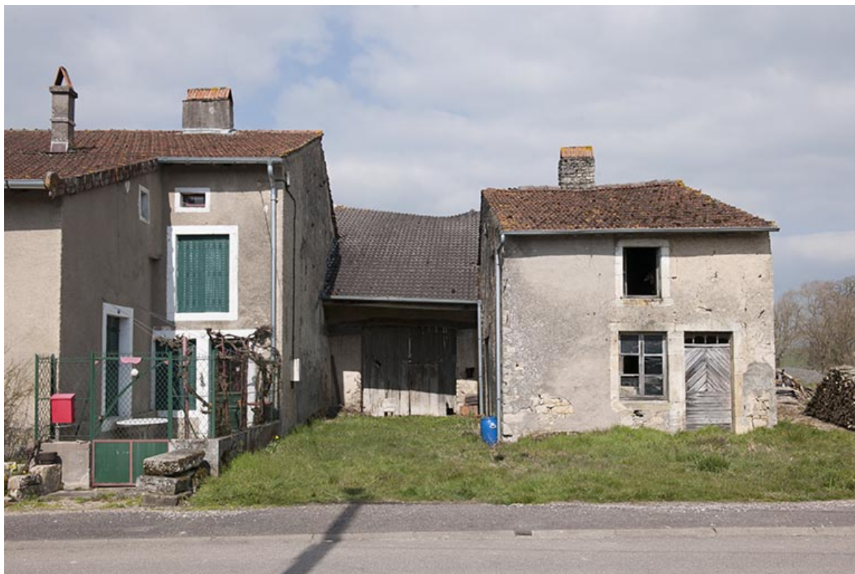
Ferme rue antoine Lumière. 70, Ormoy