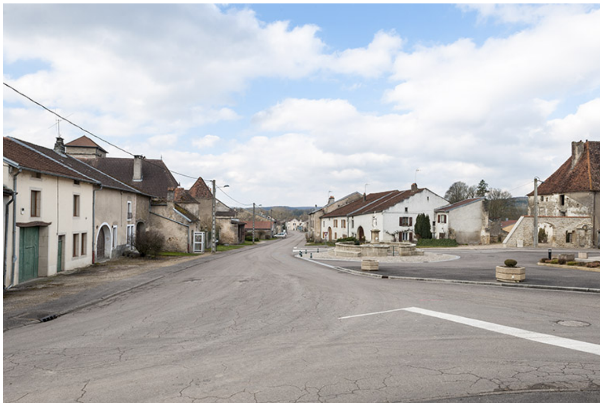
La rue principale.