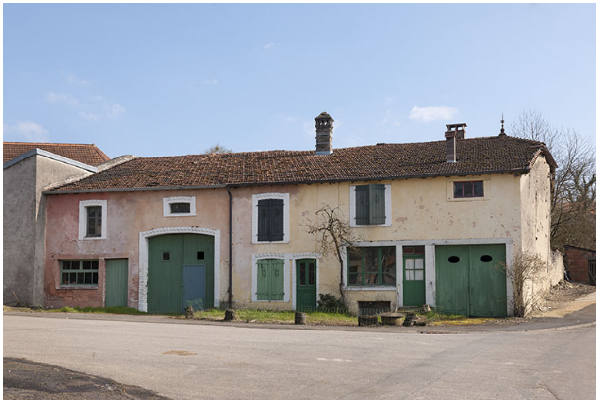
Maisons, rue de la Vigne. 70, Ormoy