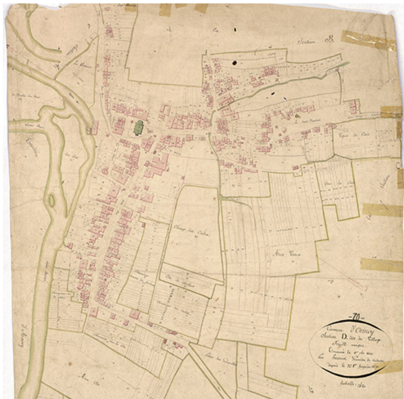
Plan du village extrait du plan cadastral,1821. 70, Ormoy