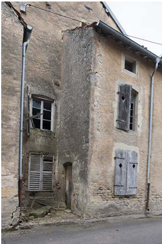
Détail du mur pignon.