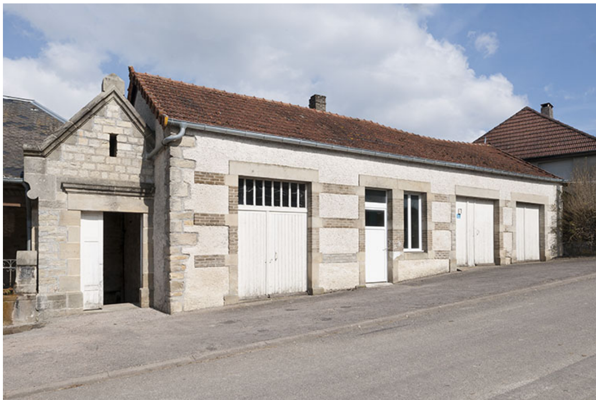
L'ancien four communal. 70, Ormoy