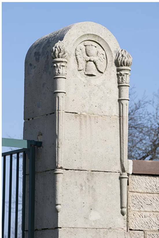
Détail d'un des piliers du portail.