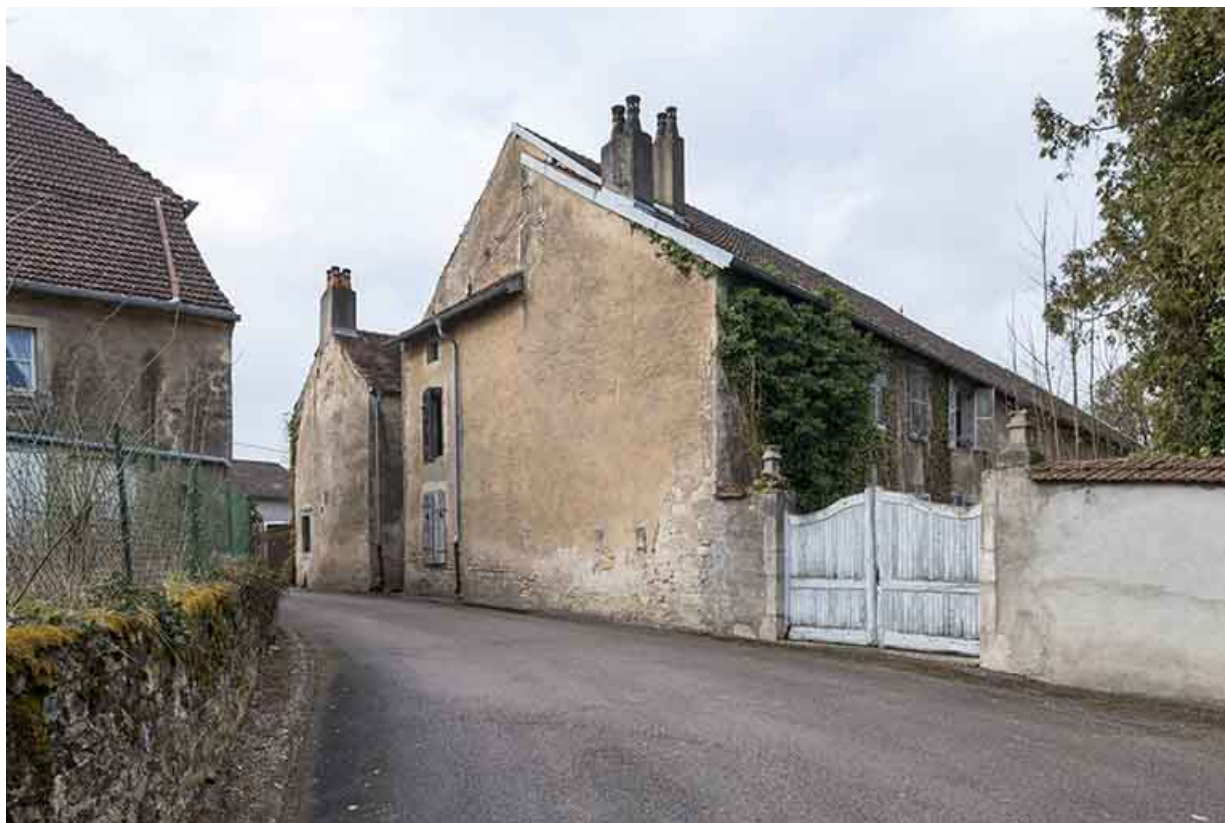
Façade postérieure de la ferme au numéro 26 de la rue Antoine Lumière. 70, Ormoy