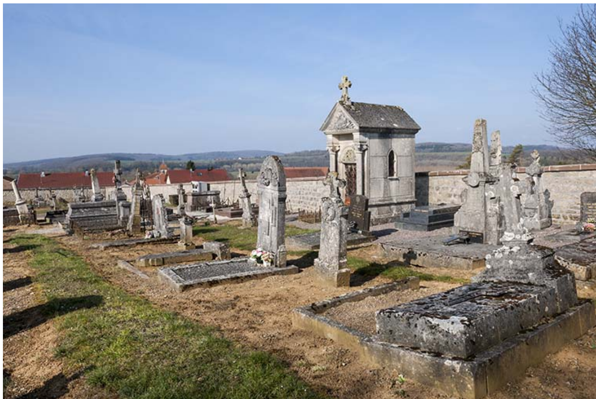
Le cimetière. 70, Ormoy