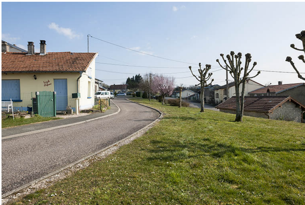
Vue sur le quartier du Crais Martinot. 70, Ormoy