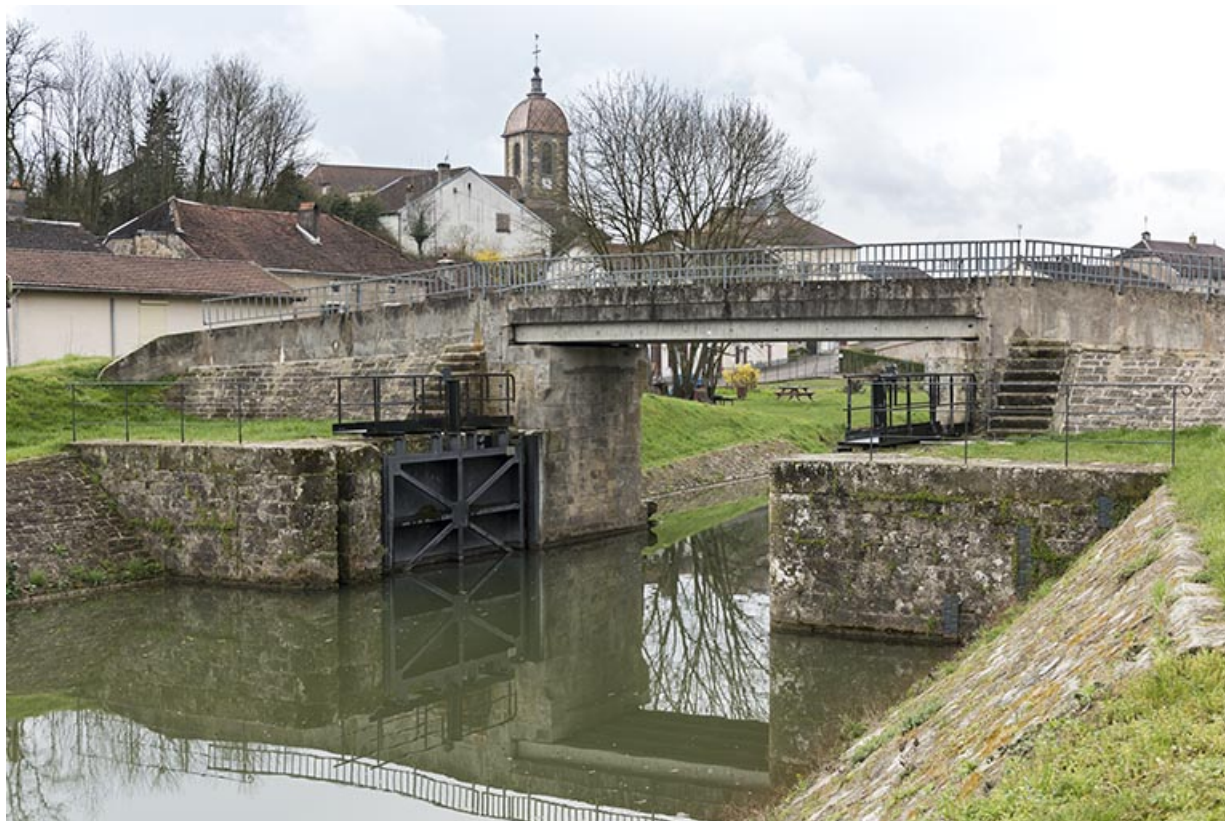
Porte de garde, Ormoy.