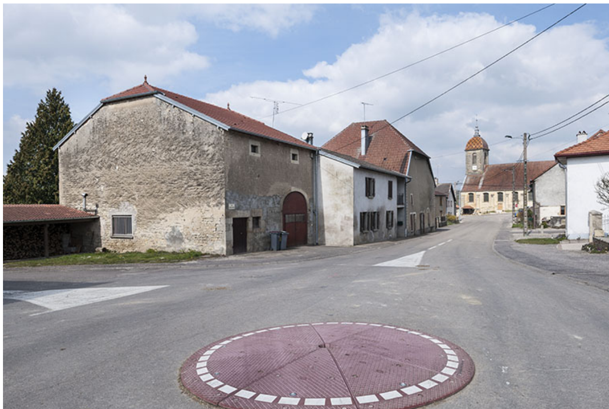
L'église depuis la fin de la rue du Crais Martinot. 70, Ormoy