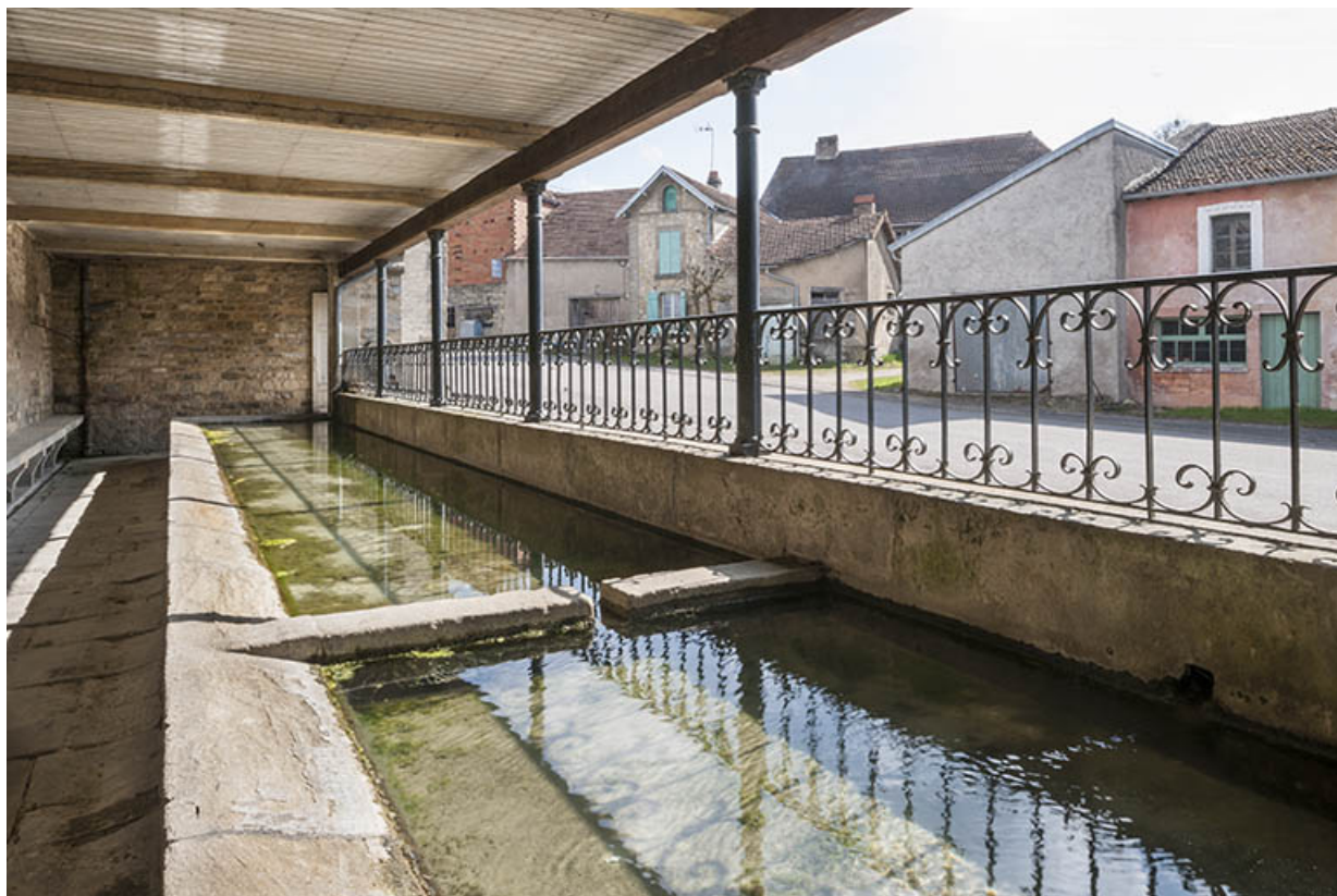
Lavoir, rue de la Vigne. 70, Ormoy