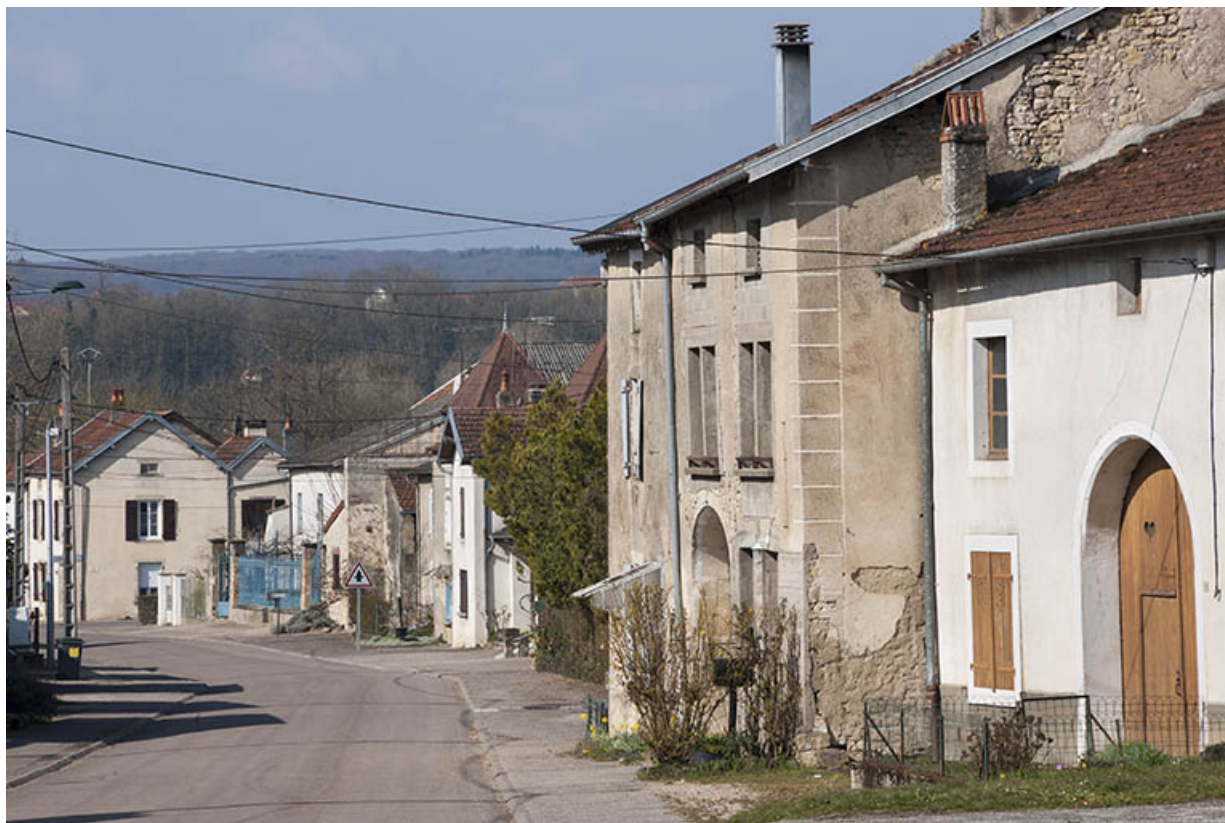
Rue Antoine Lumière. 70, Ormoy