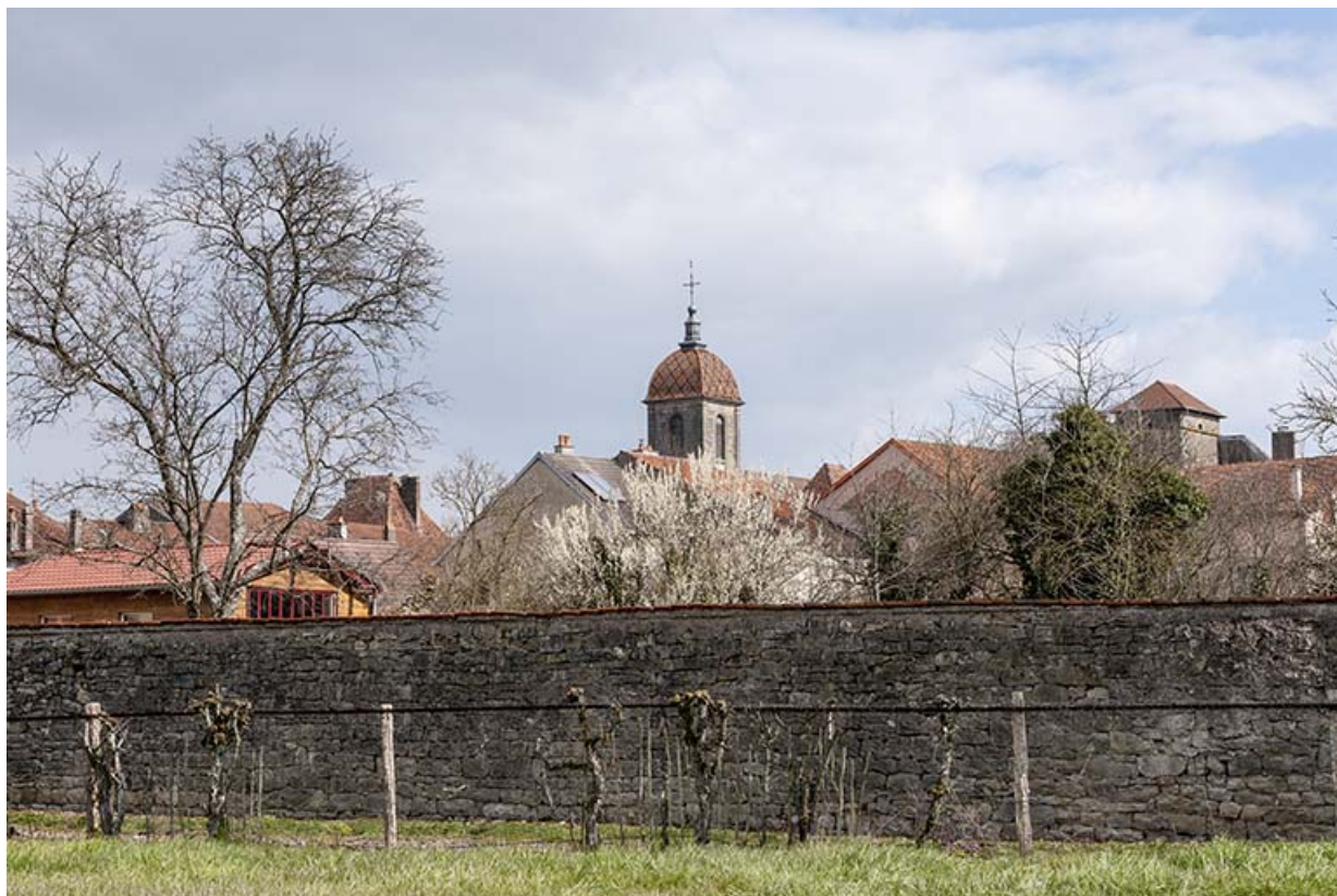
Le clocher de l'église depuis la rue aux Veaux. 70, Ormoy