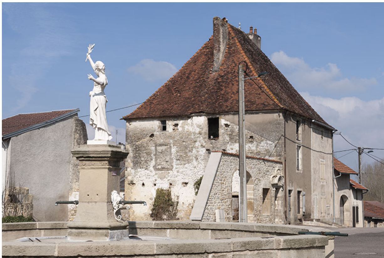
La fontaine et l'ancien presbytère.