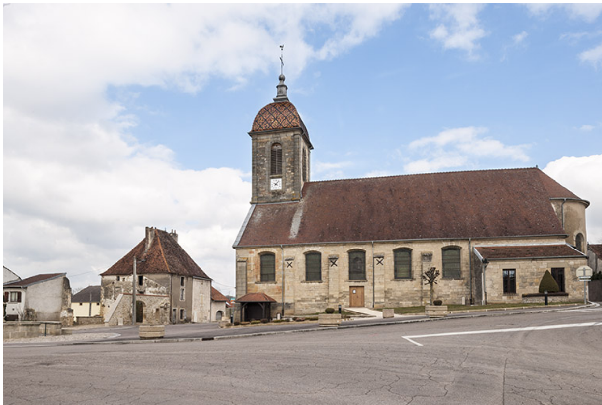
L'église et l'ancien presbytère.