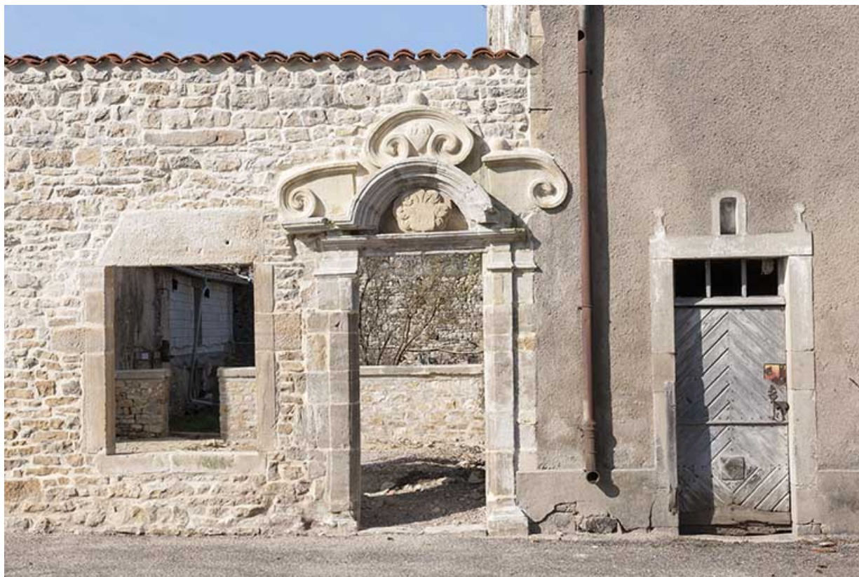
Porte reconstruite avec pierres de remploi. 70, Ormoy