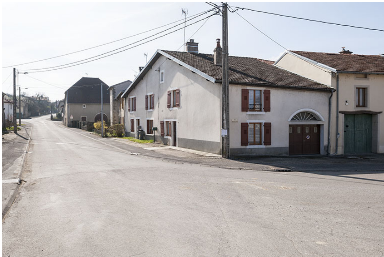
Maison, rue Antoine Lumière. 70, Ormoy