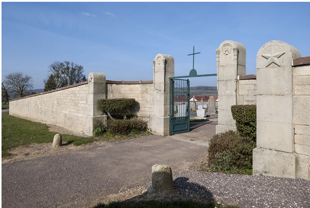
Portail d'entrée du cimetière.