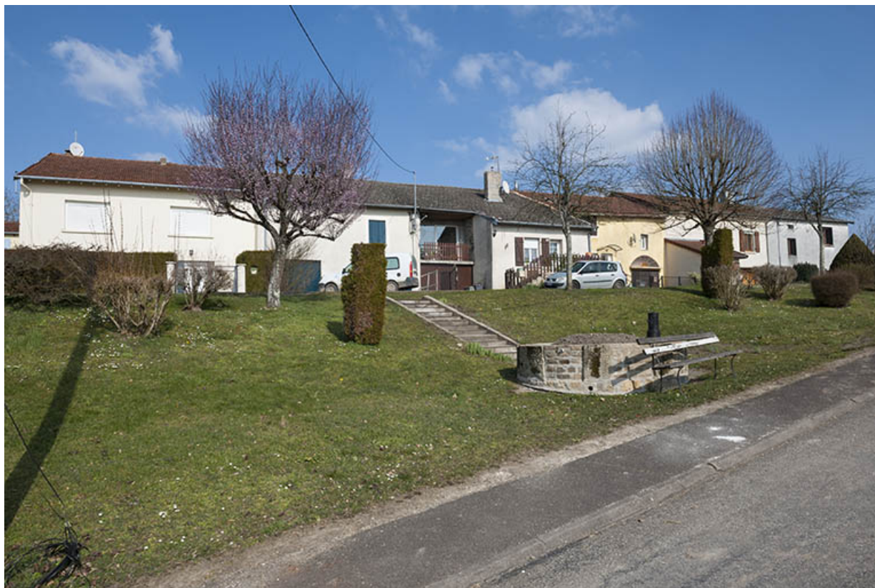
Alignement de maisons au Crais Martinot. 70, Ormoy