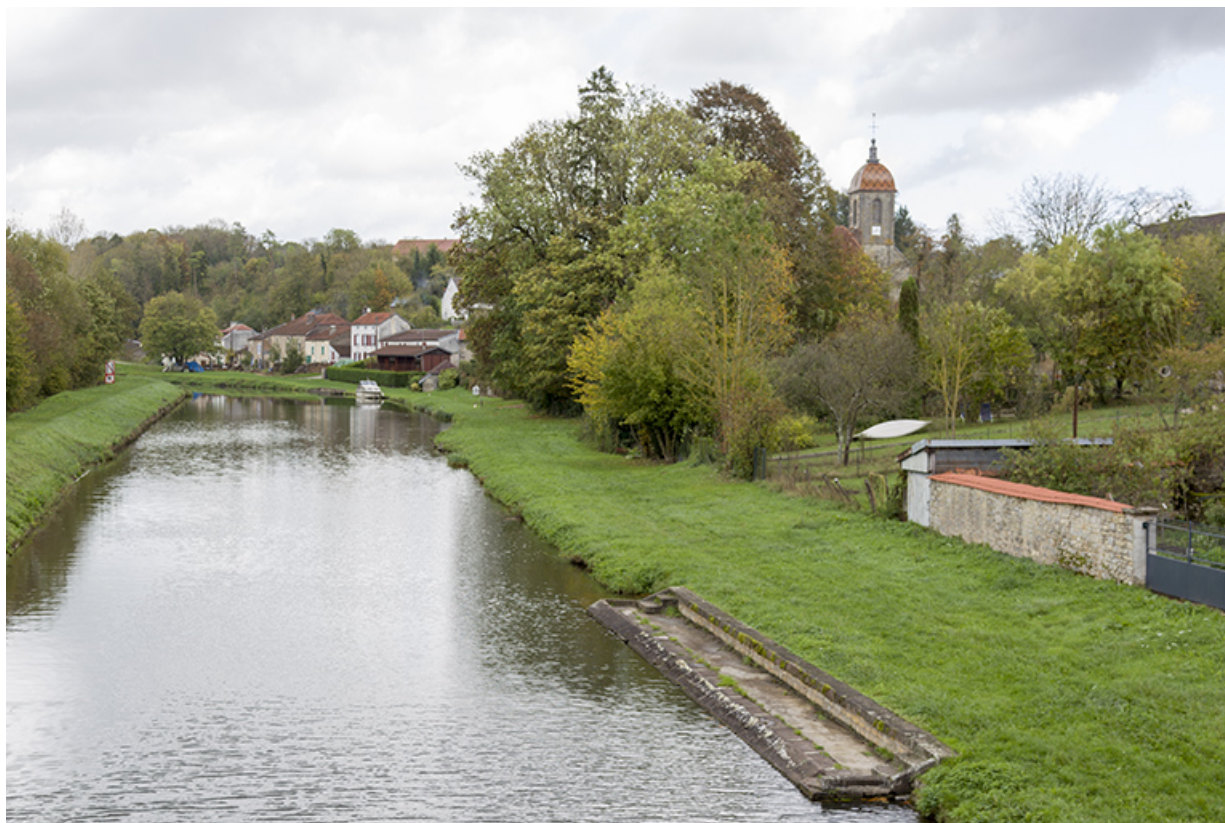
Le clocher de l'église depuis le pont. 70, Ormoy