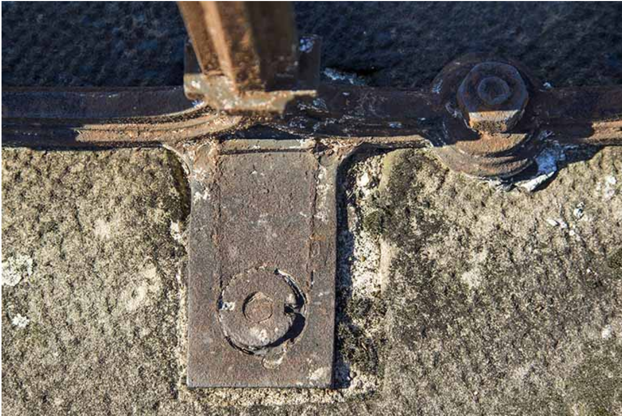
Détail de l'assemblage du garde-corps sur le tablier du viaduc. 70, Passavant-la-Rochère