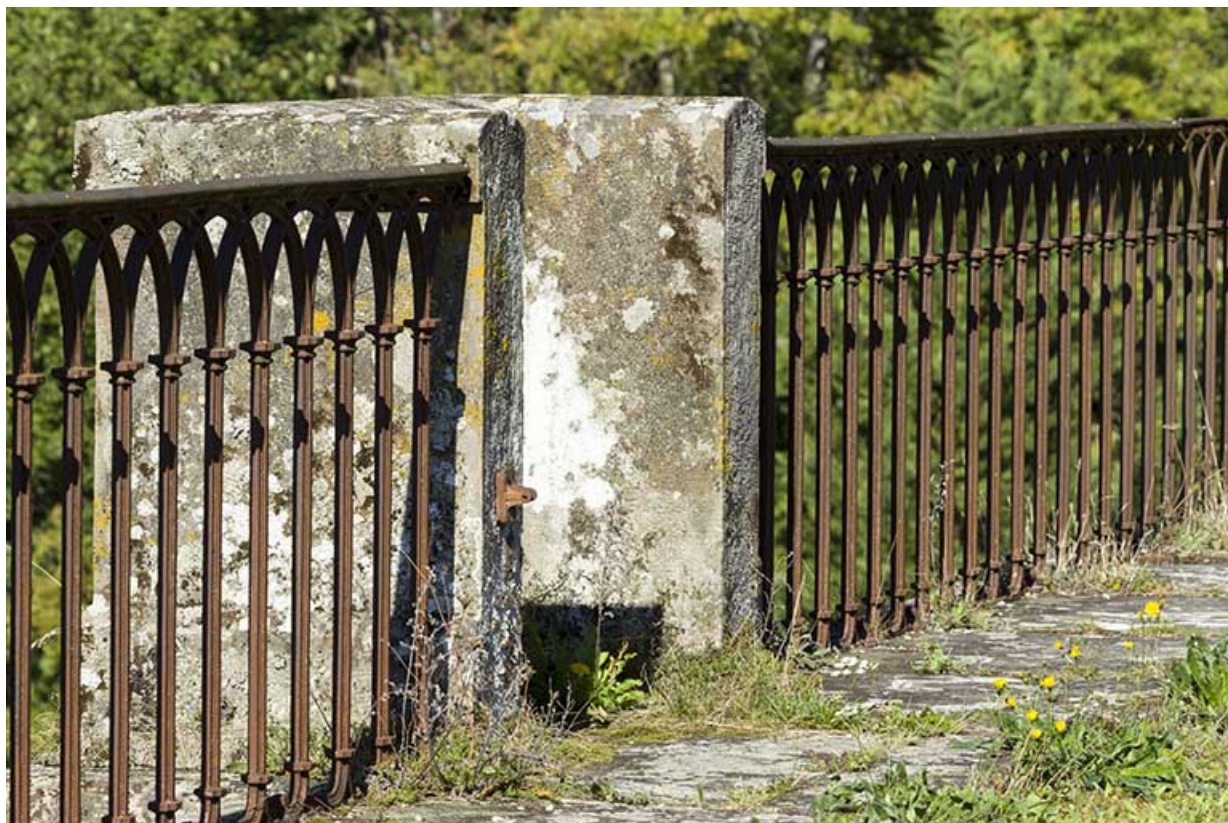
Le garde-corps maçonné d'une culée.