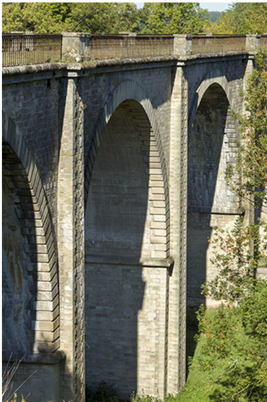
Vue sur les arches.