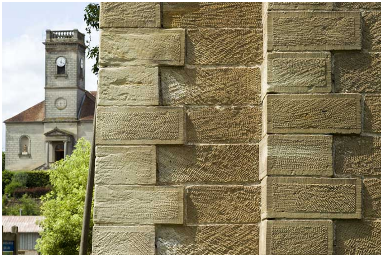
Détail de la maçonnerie des piles du viaduc. 70, Passavant-la-Rochère