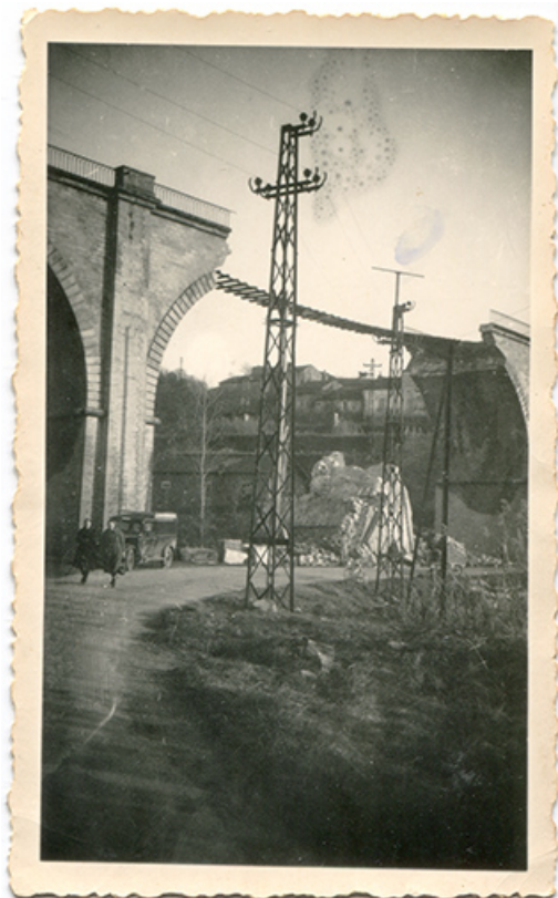
Reconstruction du viaduc après la Seconde Guerre mondiale. 70, Passavant-la-Rochère