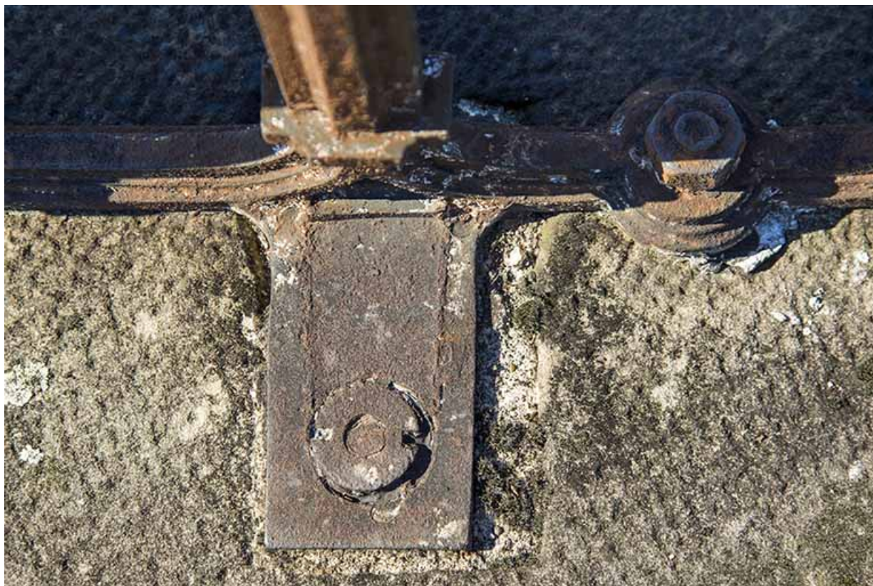
Détail de l'assemblage du garde-corps sur le tablier du viaduc. 70, Passavant-la-Rochère