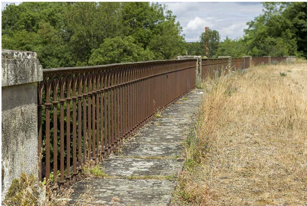
Les garde-corps en fonte.