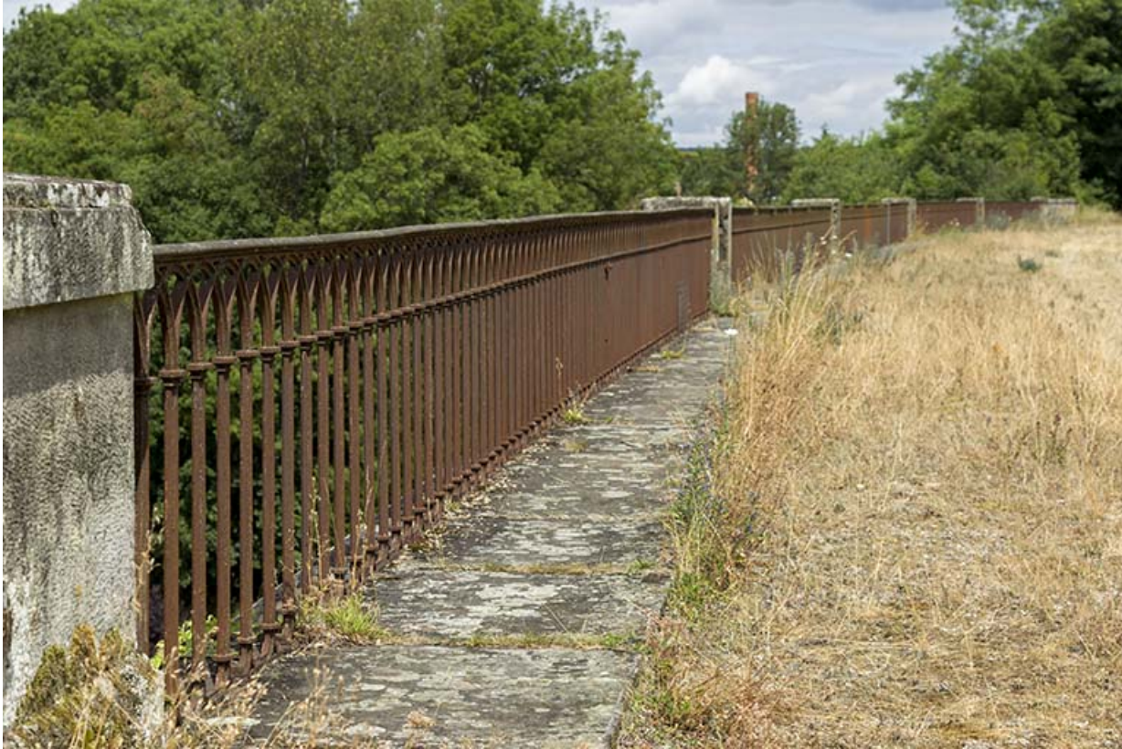
Les garde-corps en fonte.