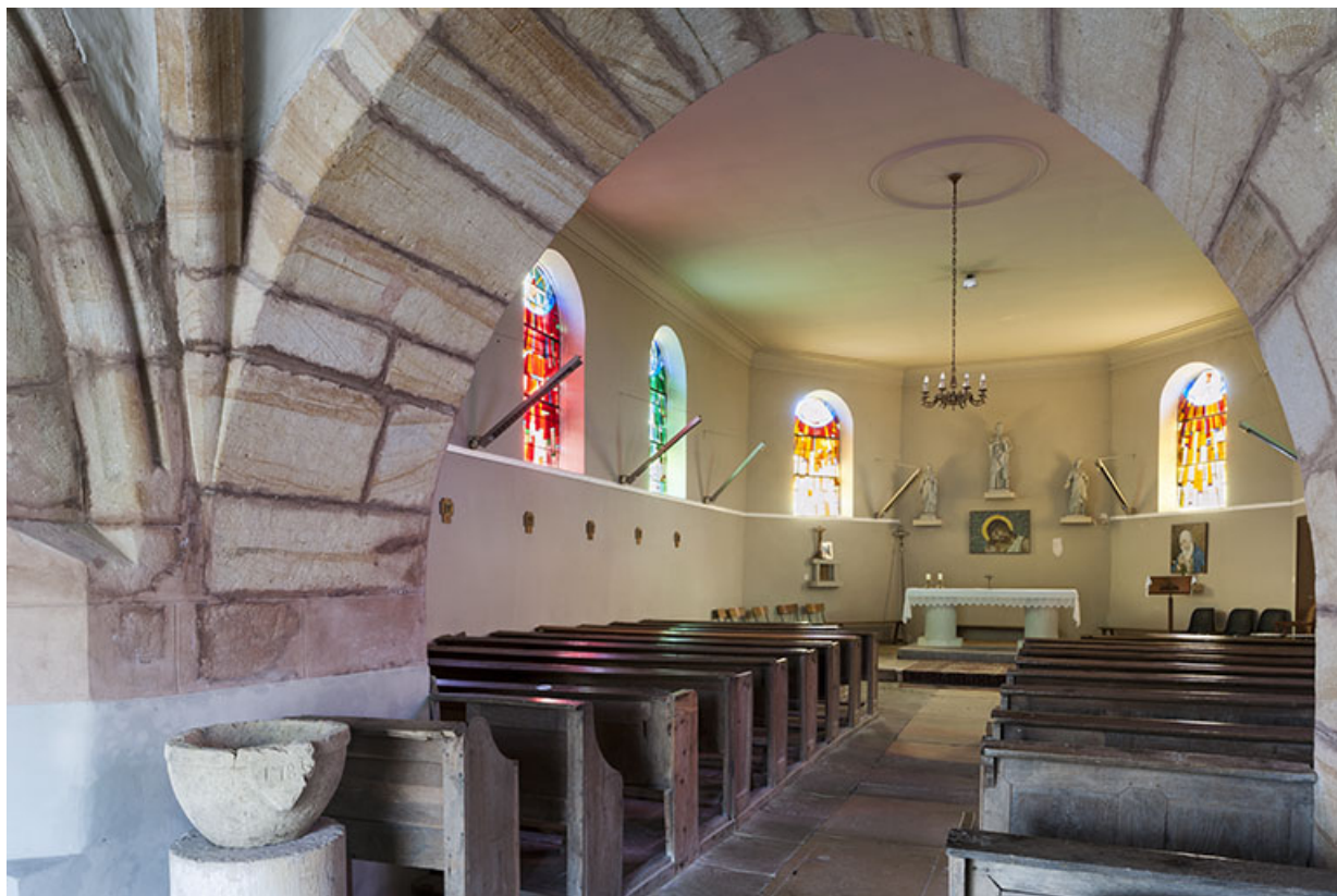
Détail du porche avec la nef en arrière plan.

70, Montureux-lès-Baulay rue de l' Église