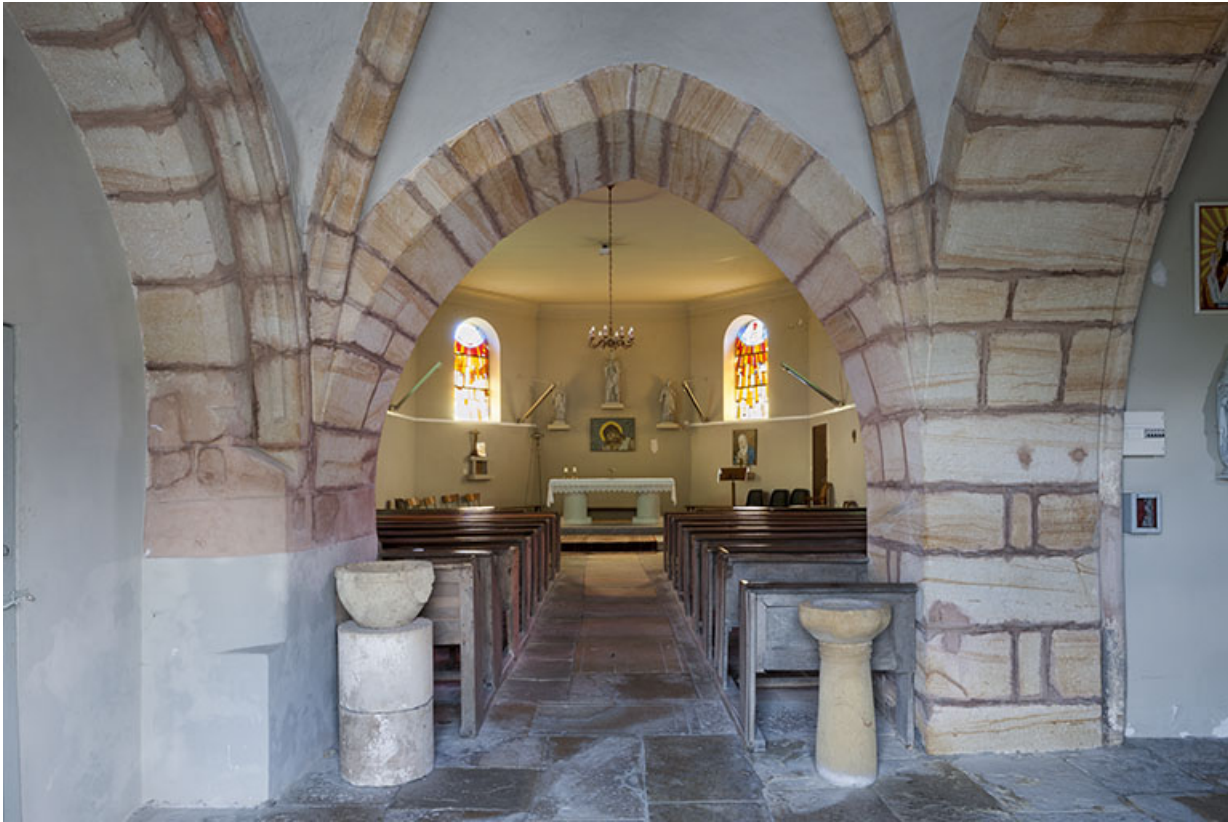
La nef depuis le porche.

70, Montureux-lès-Baulay rue de l' Église