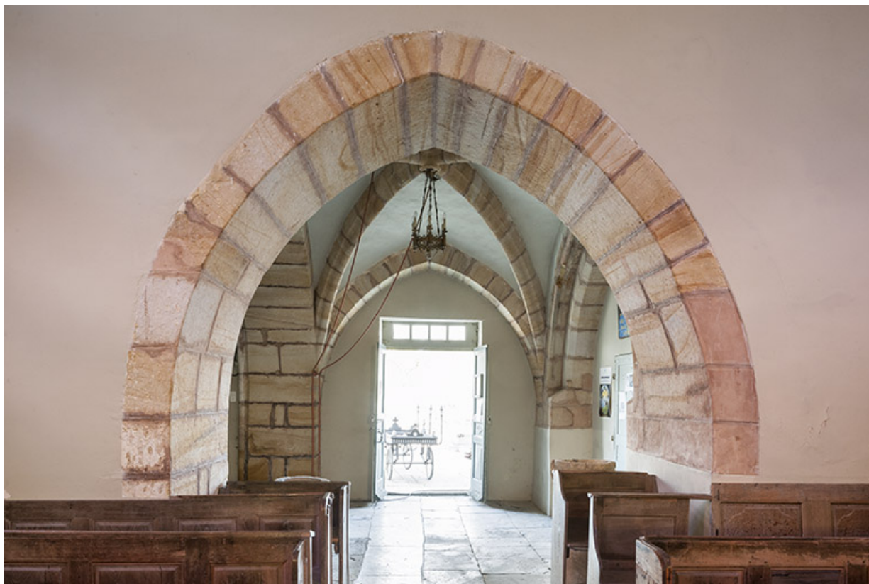
Le porche depuis le milieu de la nef.

70, Montureux-lès-Baulay rue de l' Église