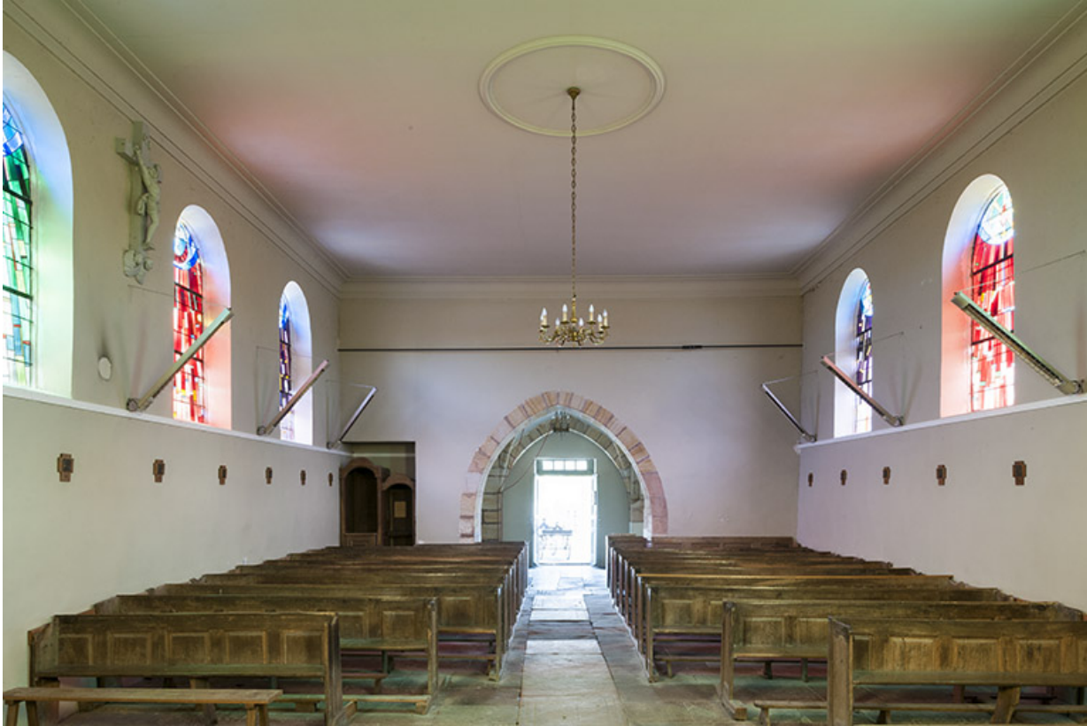
La nef depuis le chœur.

70, Montureux-lès-Baulay rue de l' Église