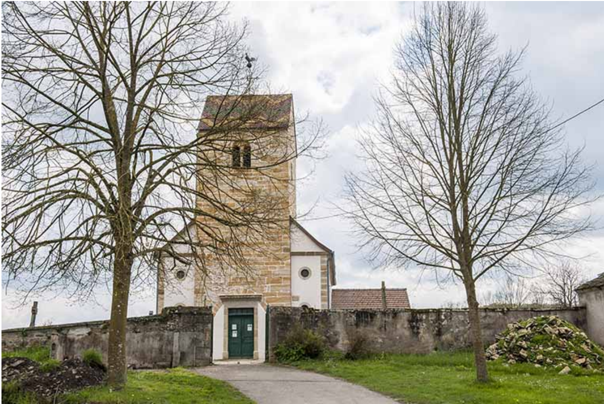
Vue depuis la route de l'Eglise.

70, Montureux-lès-Baulay rue de l' Église