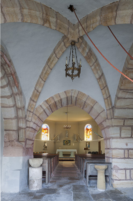
La croisée d'ogives du porche.

70, Montureux-lès-Baulay rue de l' Église