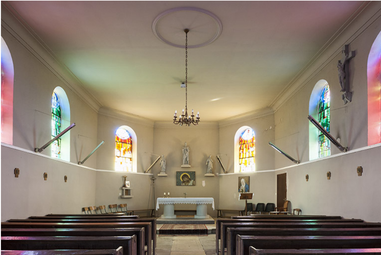
Les baies de la nef avec vue sur le chœur.

70, Montureux-lès-Baulay rue de l' Église