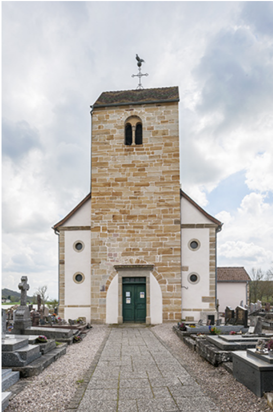
Vue de la façade principale.

70, Montureux-lès-Baulay rue de l' Église