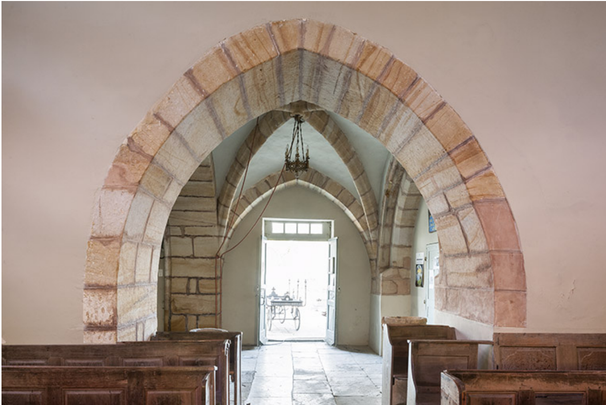
Le porche depuis le milieu de la nef.

70, Montureux-lès-Baulay rue de l' Église