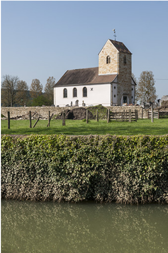
Vue générale depuis le ruisseau la Sacquelle.

70, Montureux-lès-Baulay rue de l' Église