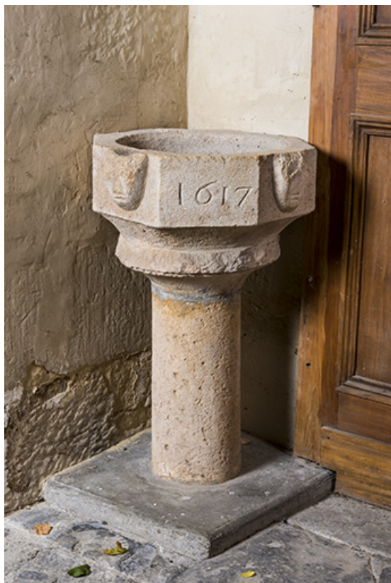
Les anciens fonts baptismaux , vestiges de l'ancienne église. 70, Gevigney-et-Mercey rue Montgillard