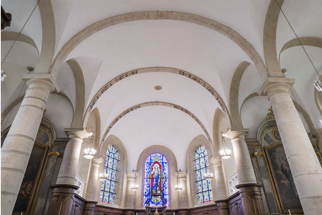
La voûte en berceau.