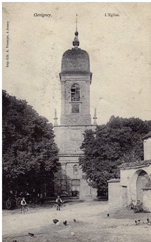
L'église de Gevigney, carte postale. 70, Gevigney-et-Mercey rue Montgillard