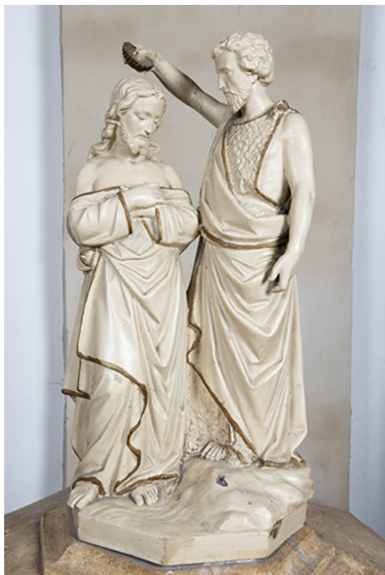
Le groupe sculpté sur le couvercle des fonts baptismaux : le baptême du Christ. 70, Gevigney-et-Mercey rue Montgillard