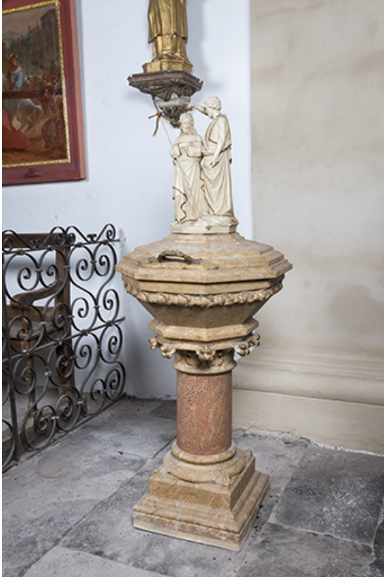
Vue générale des fonts baptismaux.