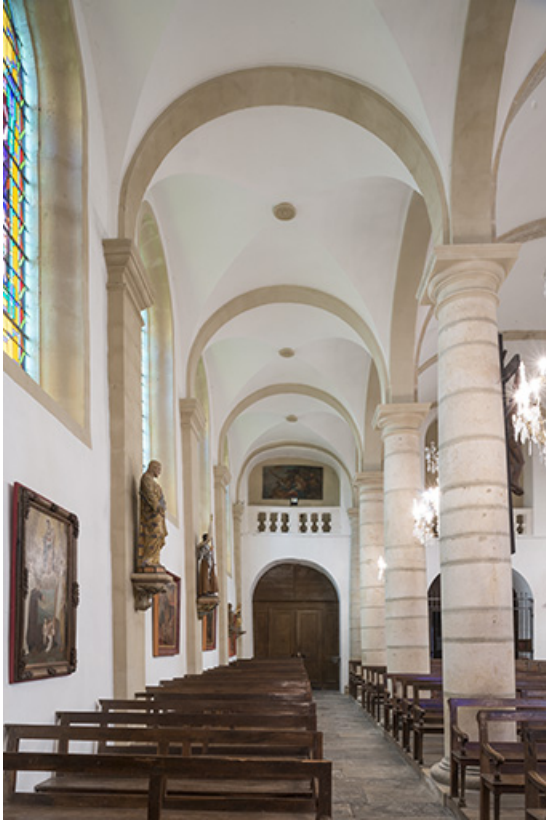
Le collatéral Sud.