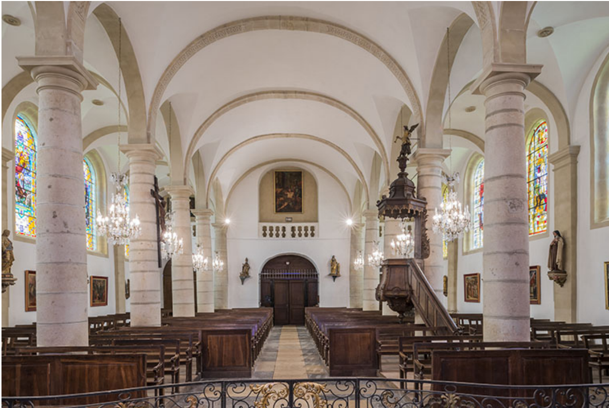
La nef depuis le chœur.