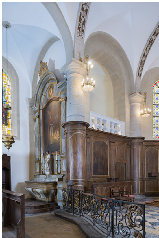
Détail du chœur avec la chapelle nord.