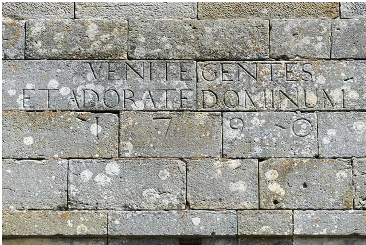
Inscription en latin figurant sur la façade antérieure de l'édifice.