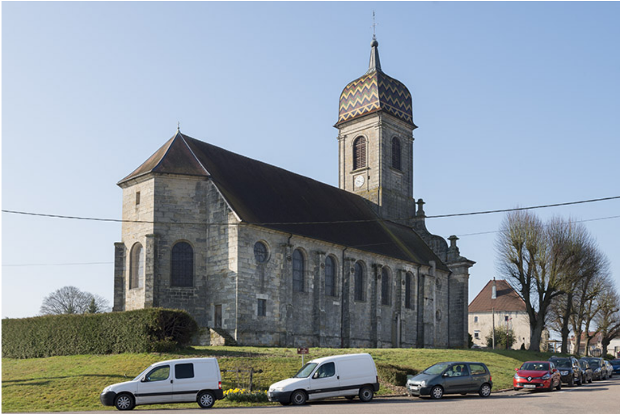
Vue générale depuis la rue Mongillard.