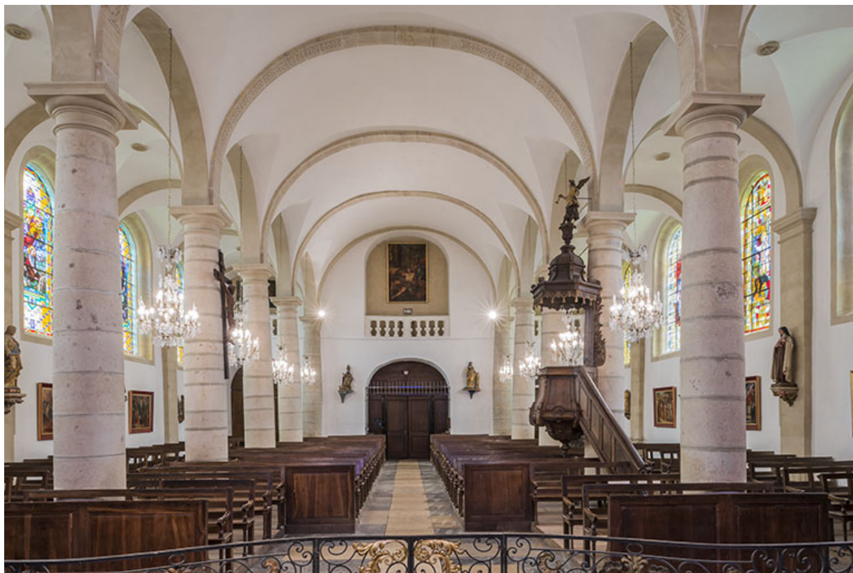
La nef depuis le chœur.