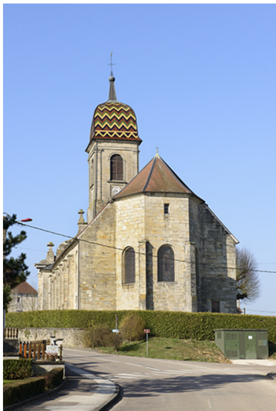
L'église, vue depuis l'Est.