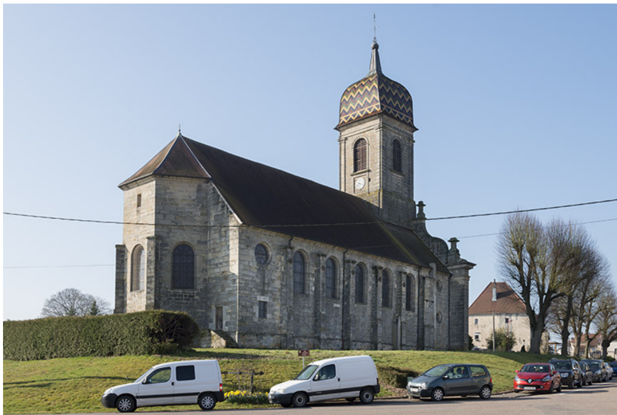
Vue générale depuis la rue Mongillard.