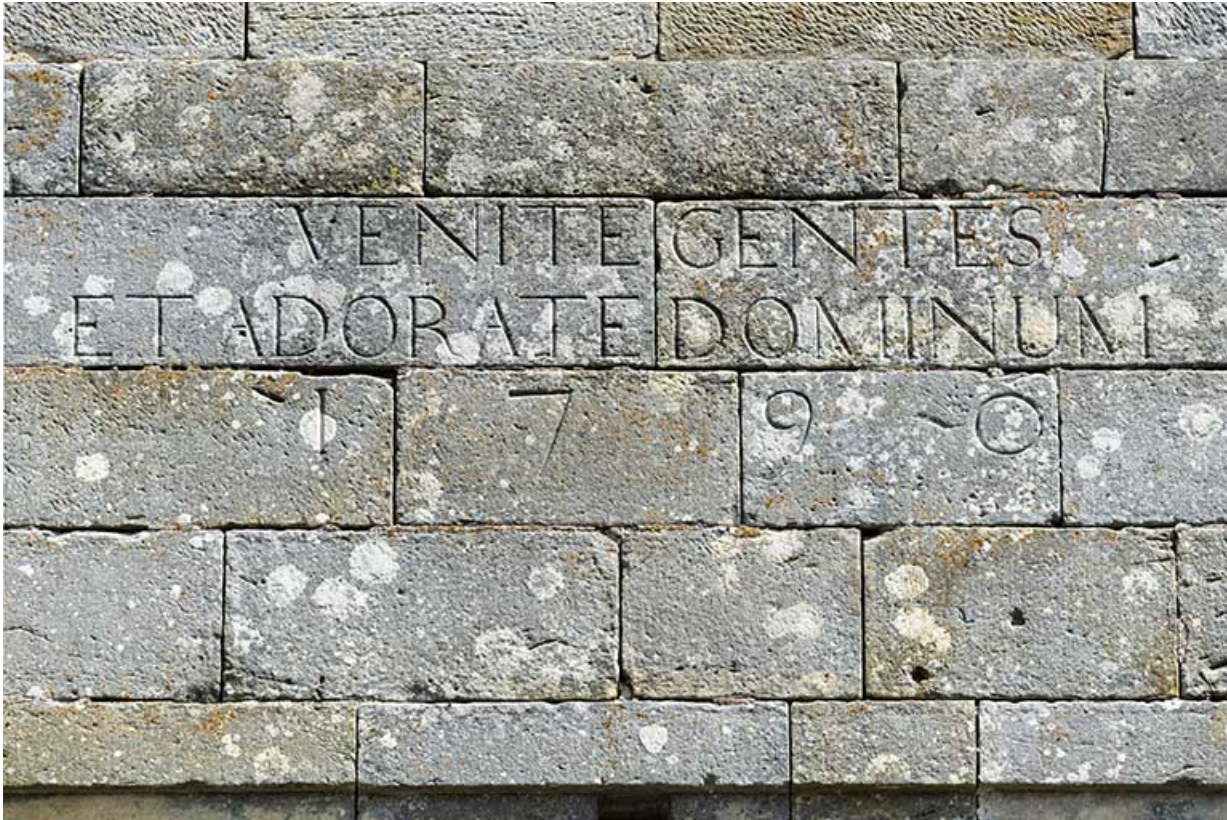
Inscription en latin figurant sur la façade antérieure de l'édifice.