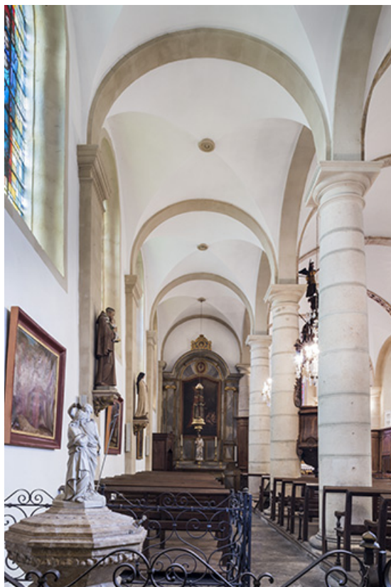
Le collatéral Nord de l'église.