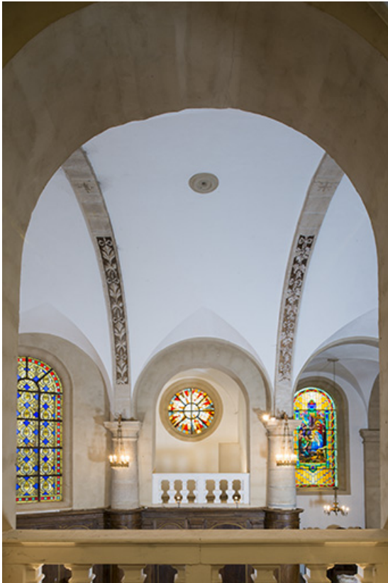
Détail de la voûte.