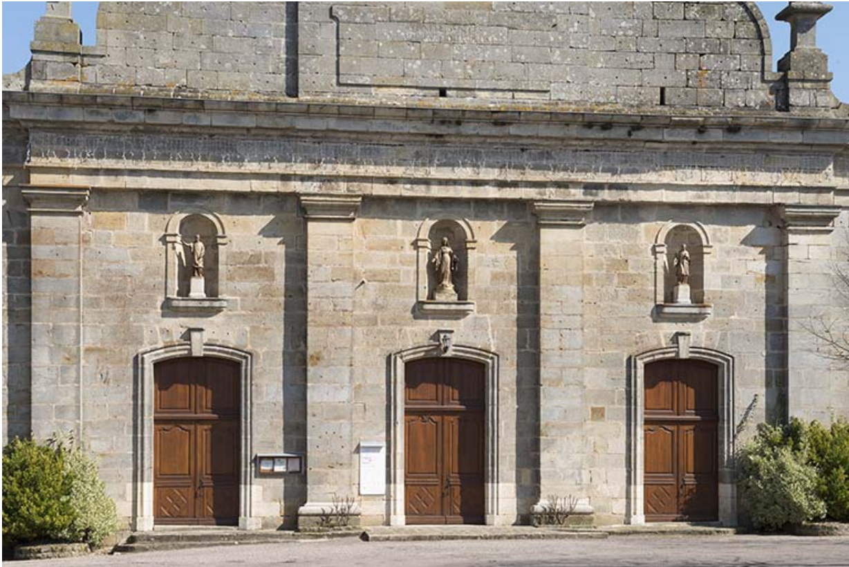
Les trois portails de la façade.