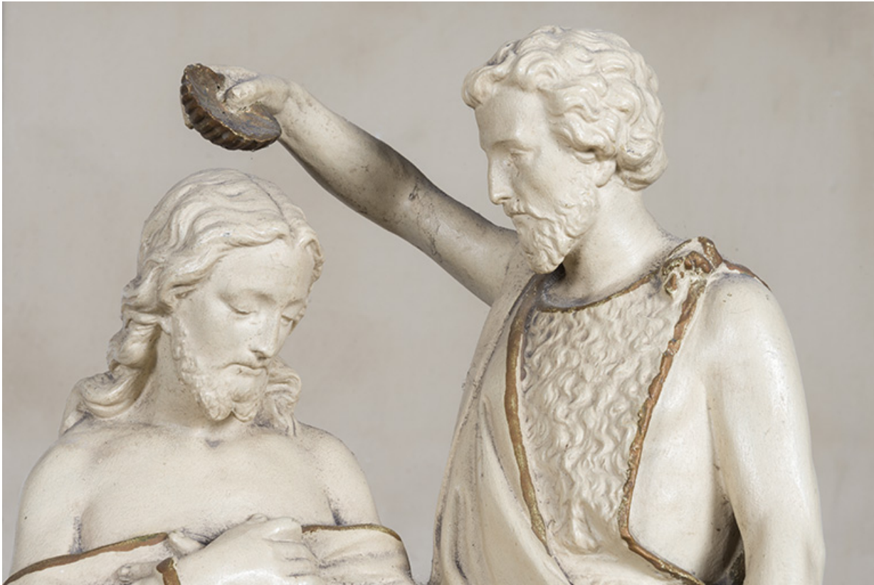
Détail du groupe sculpté.