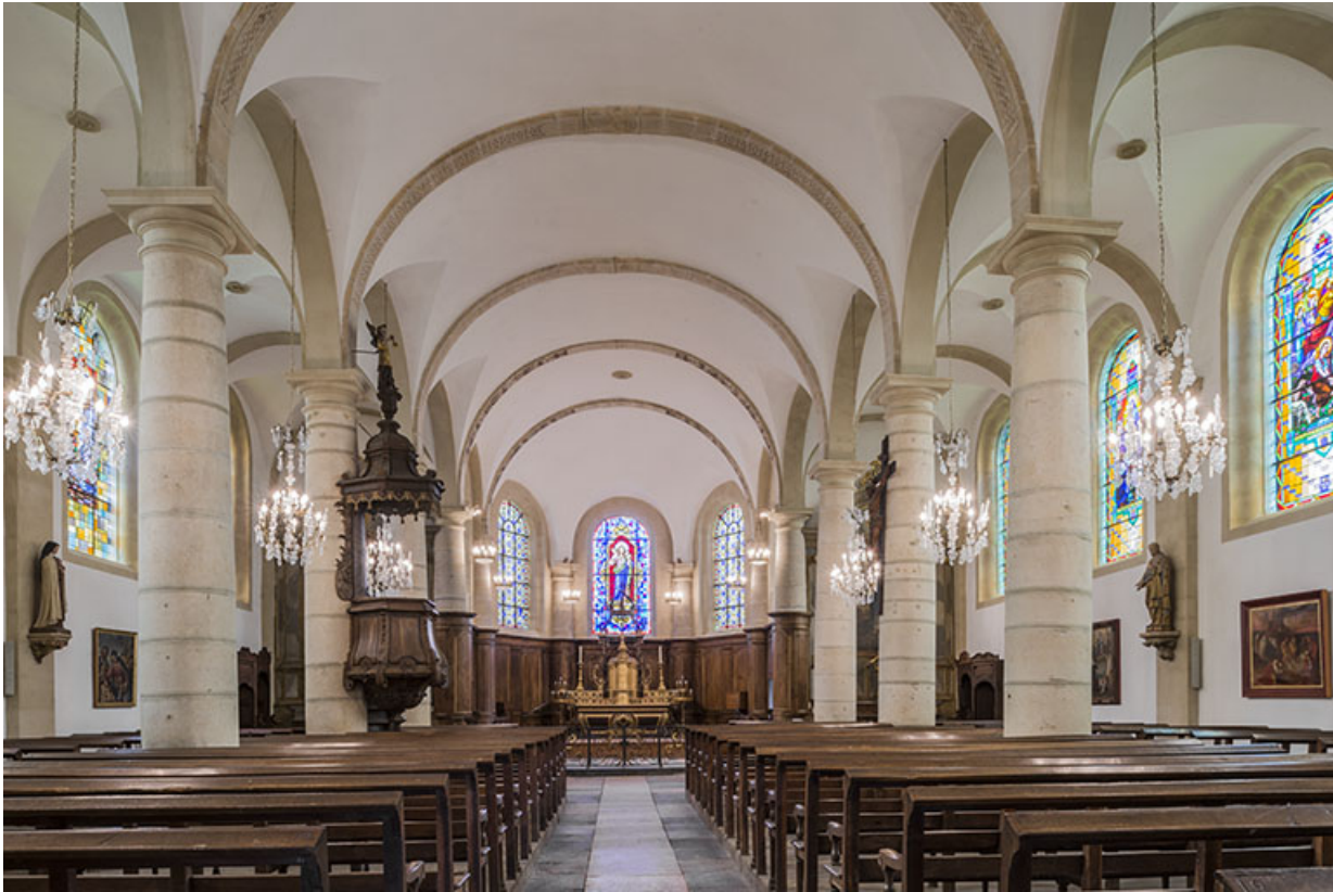
Vue de la nef.