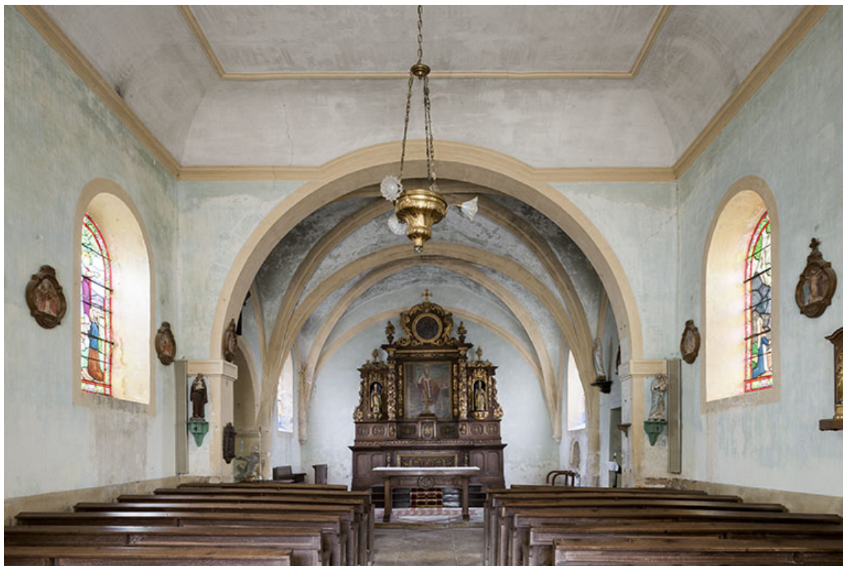
Vue générale depuis le porche.