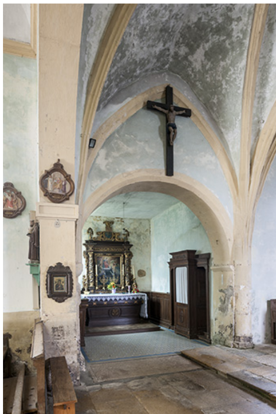
Vue sur la chapelle.