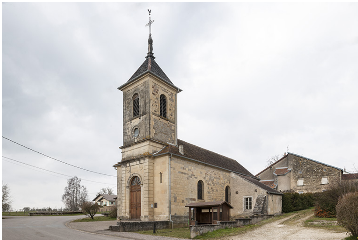
L'église, vue de trois-quart. 70, Fouchécourt