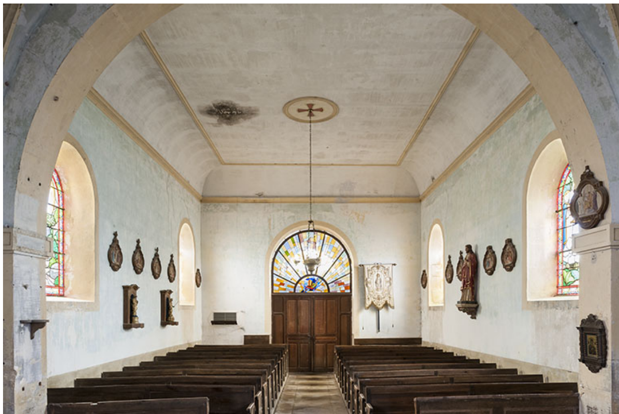
Vue générale depuis le chœur.