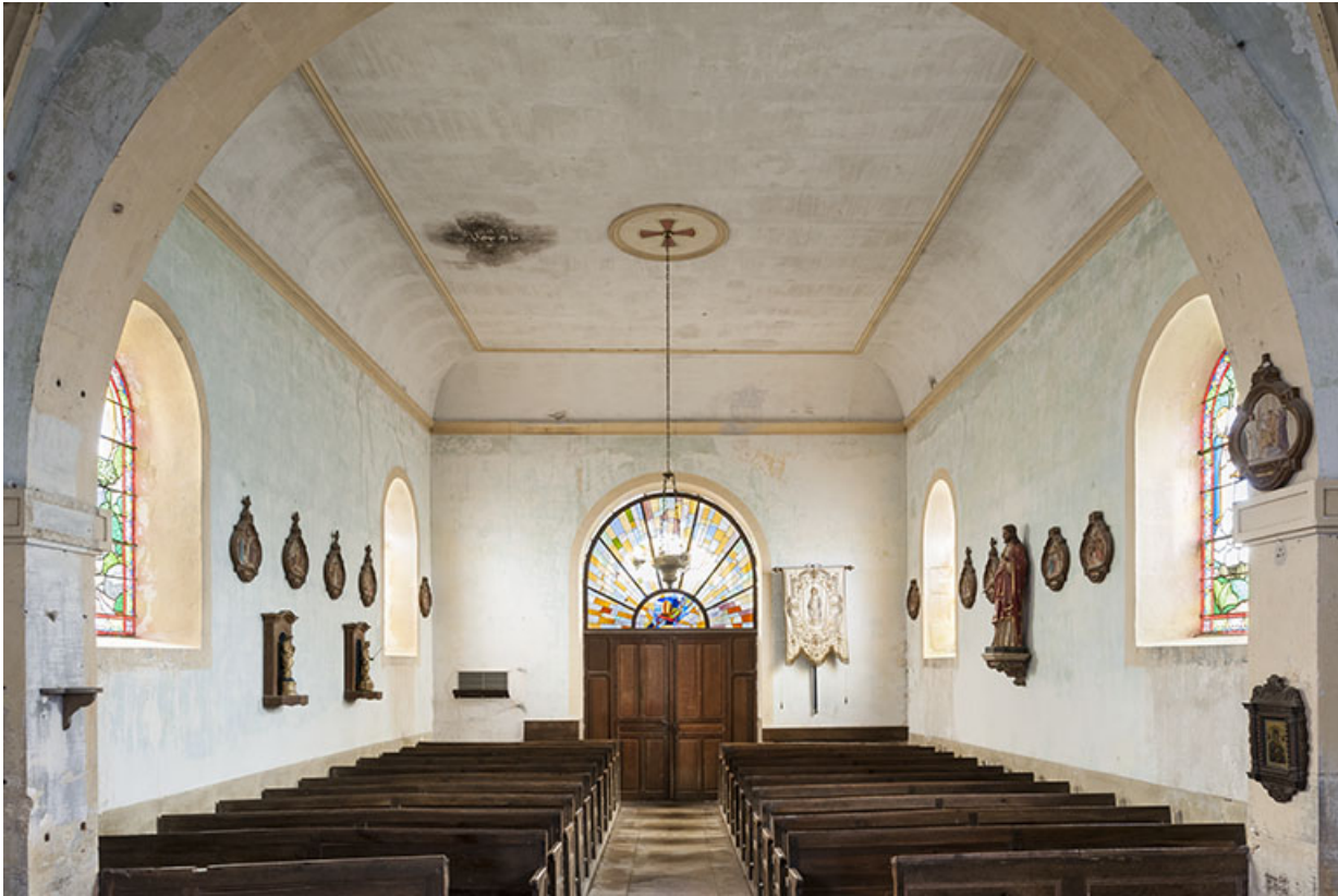
Vue générale depuis le chœur.