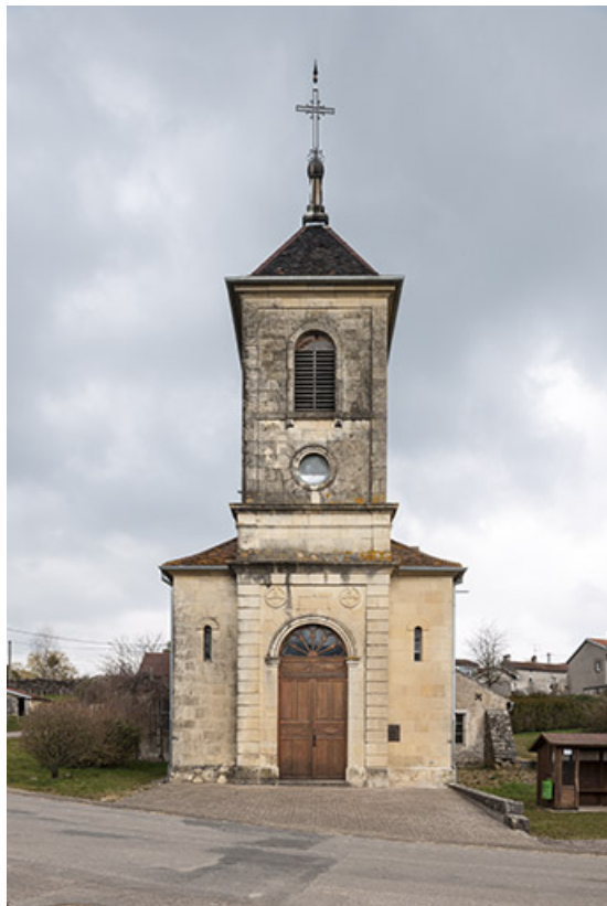
Vue sur la façade principale.