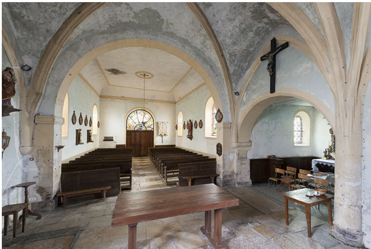
Le chœur et l'ancienne chapelle seigneuriale.