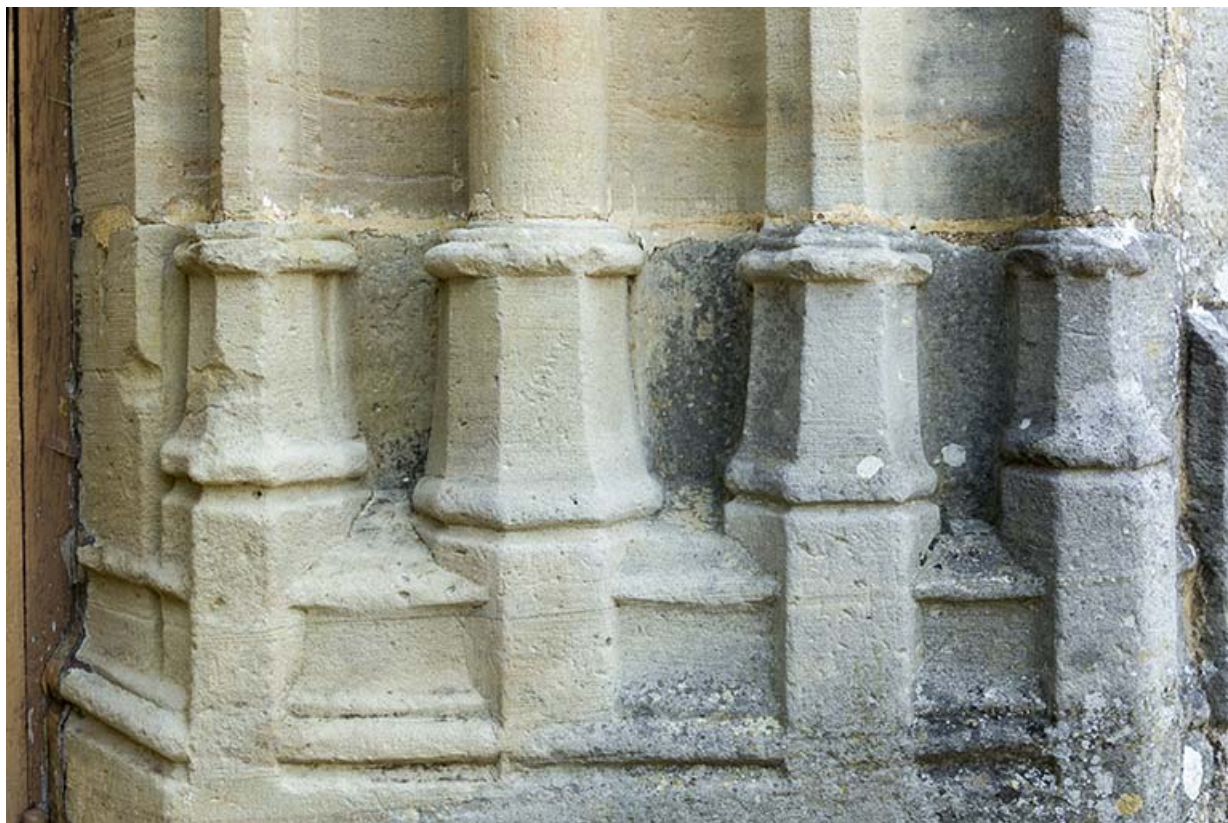
Détail de la base du piedroit droit.