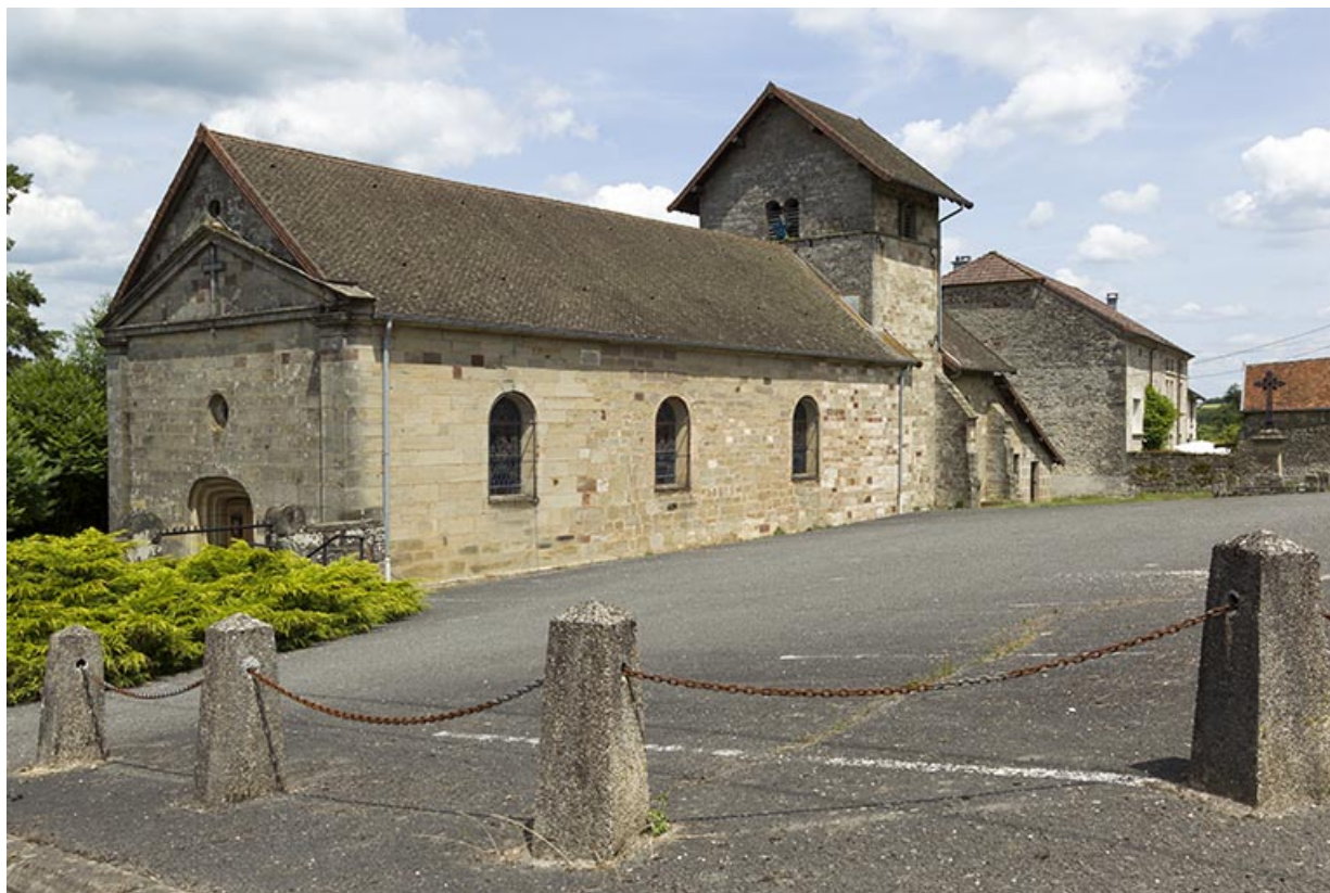
Vue de trois quart depuis le sud-ouest.