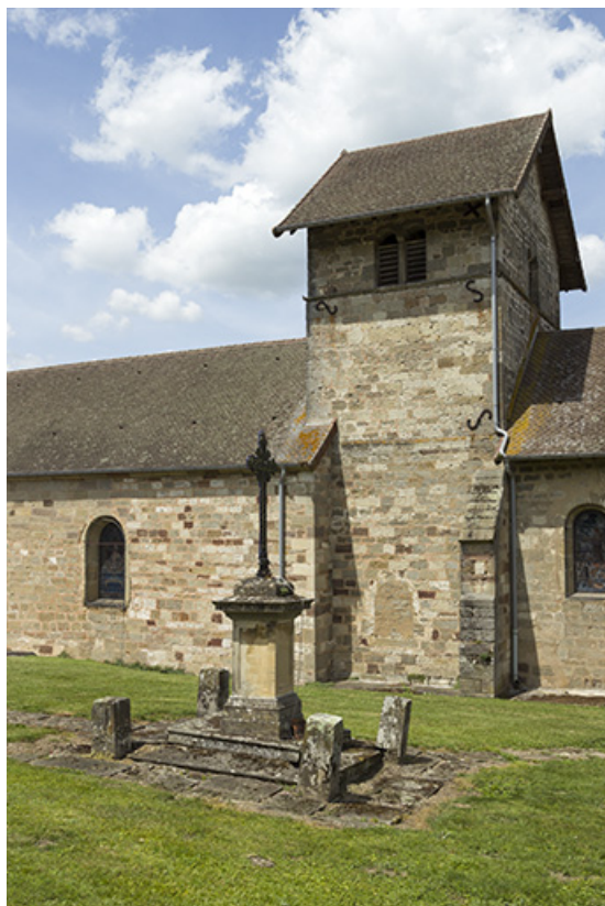
Vue de trois quart depuis le sud-est.