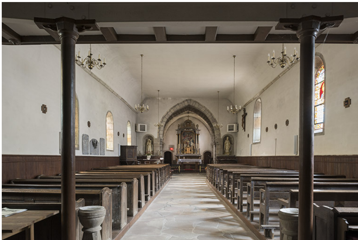
Vue intérieure depuis l'entrée.