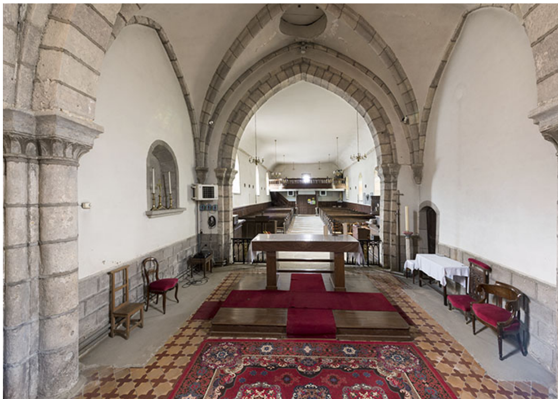
Vue intérieure depuis le chevet.