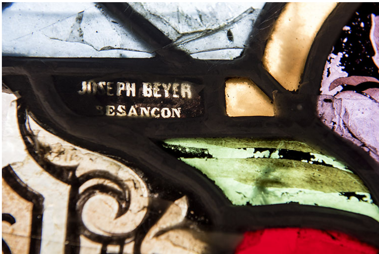
Détail de la verrière : signature.