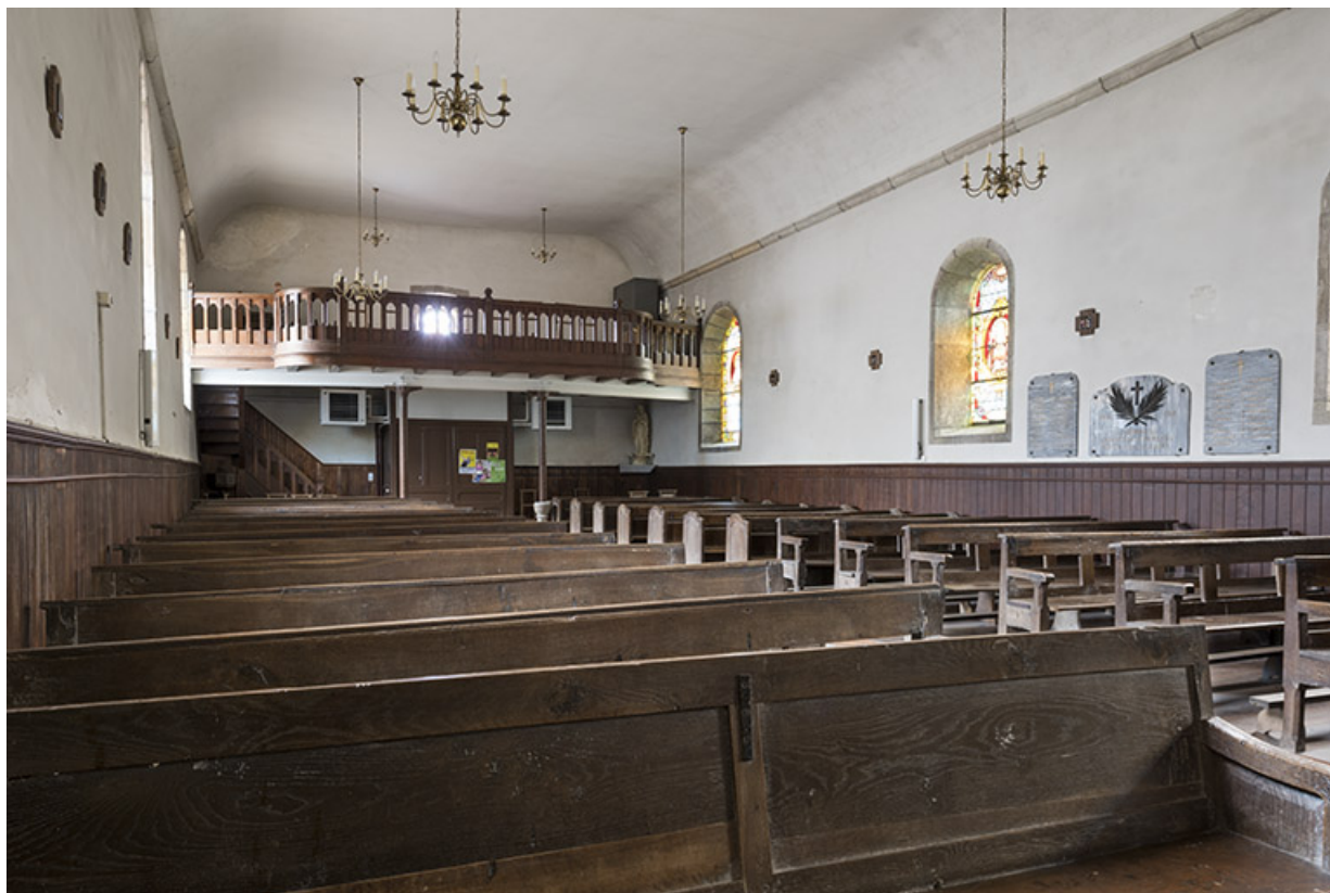
Vue de trois-quart depuis l'angle est.