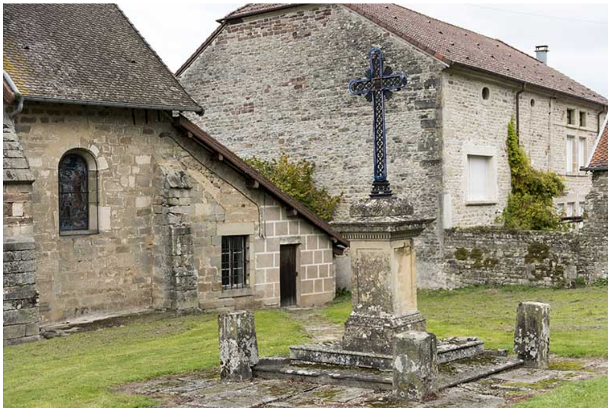
Vue de trois-quart sud de la croix située au sud-est, le long du flanc antérieur de l'édifice. 70, Demangevelle place de l'église