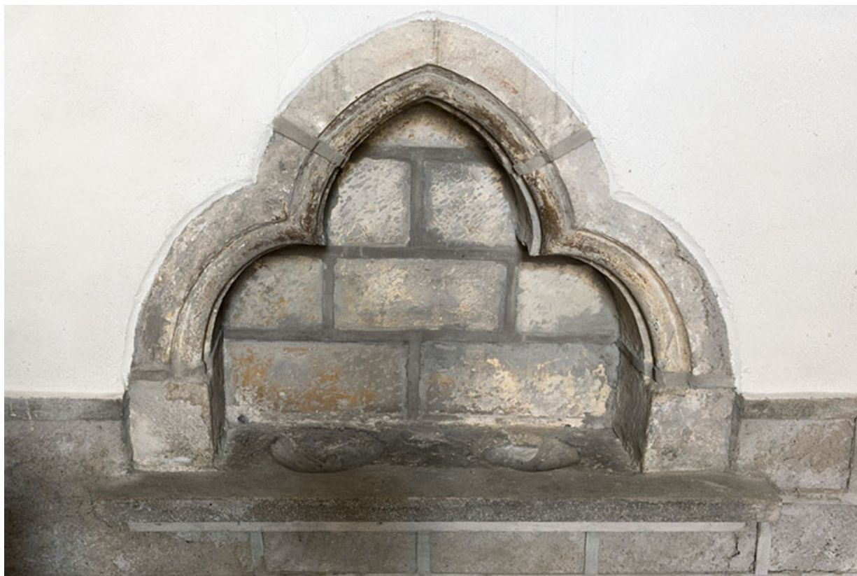
Détail : niche trilobée à droite du chœur.