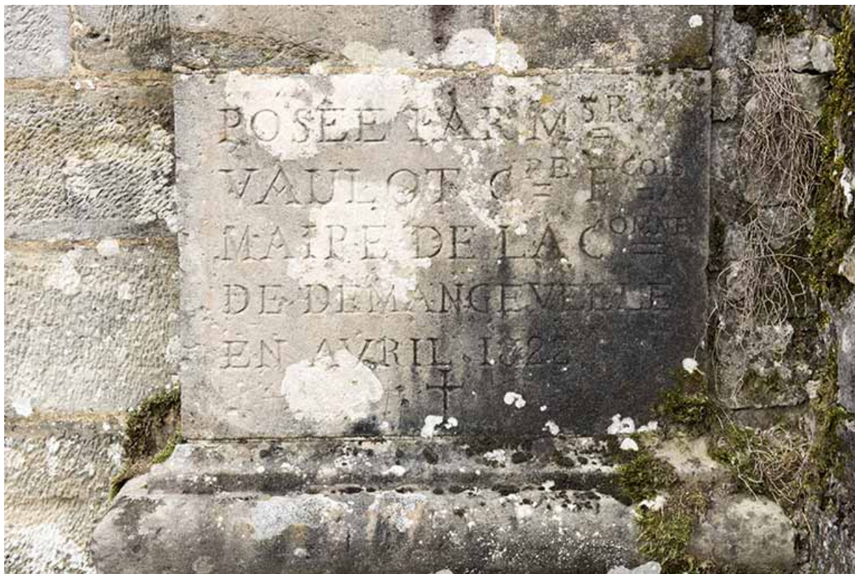
Détail de l'inscription à la base du pilastre droit du portail.