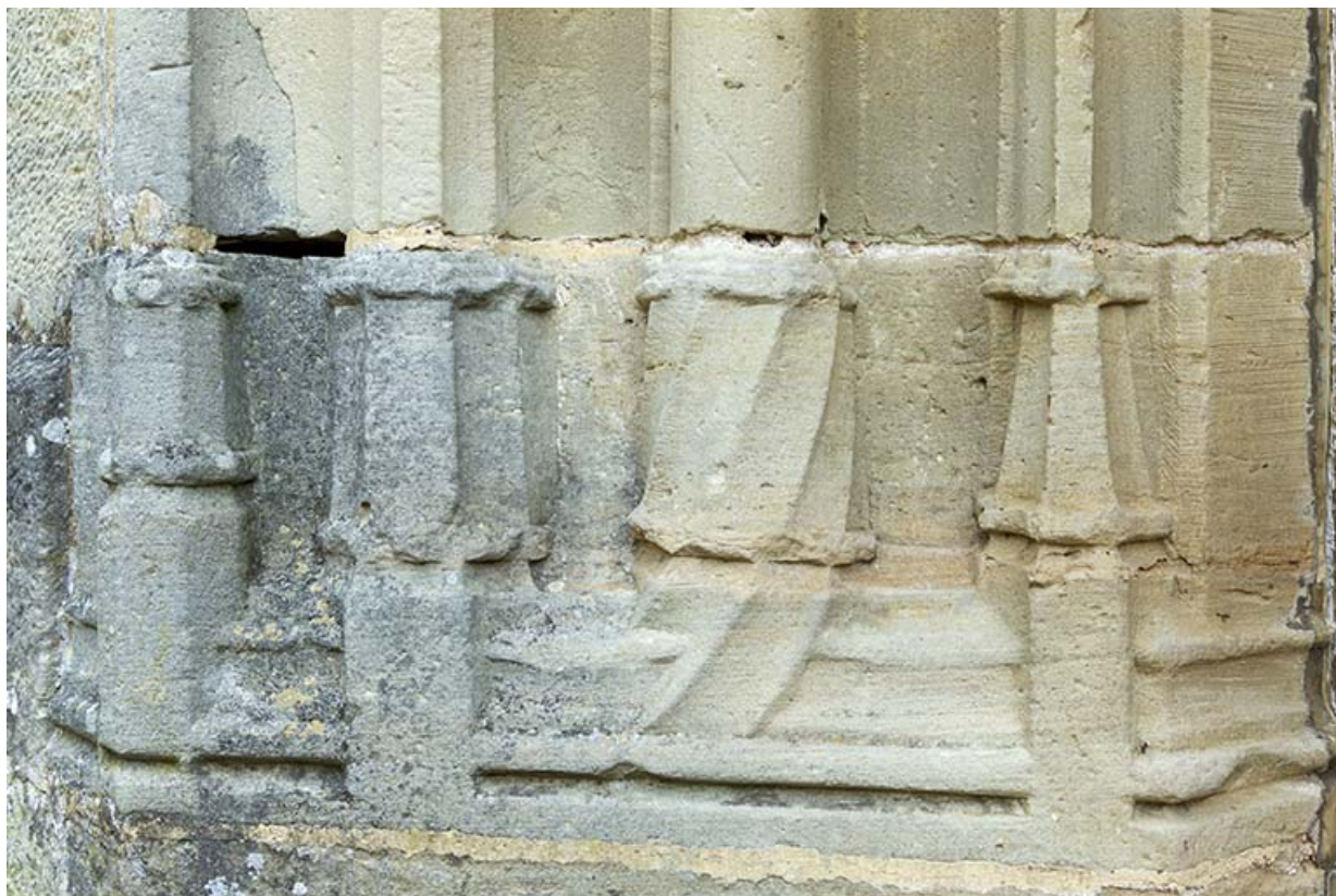
Détail de la base du piédroit gauche.