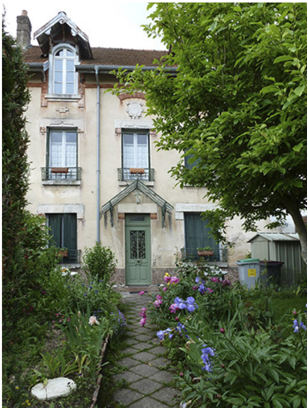
Façade antérieure, depuis le jardin d'agrément.