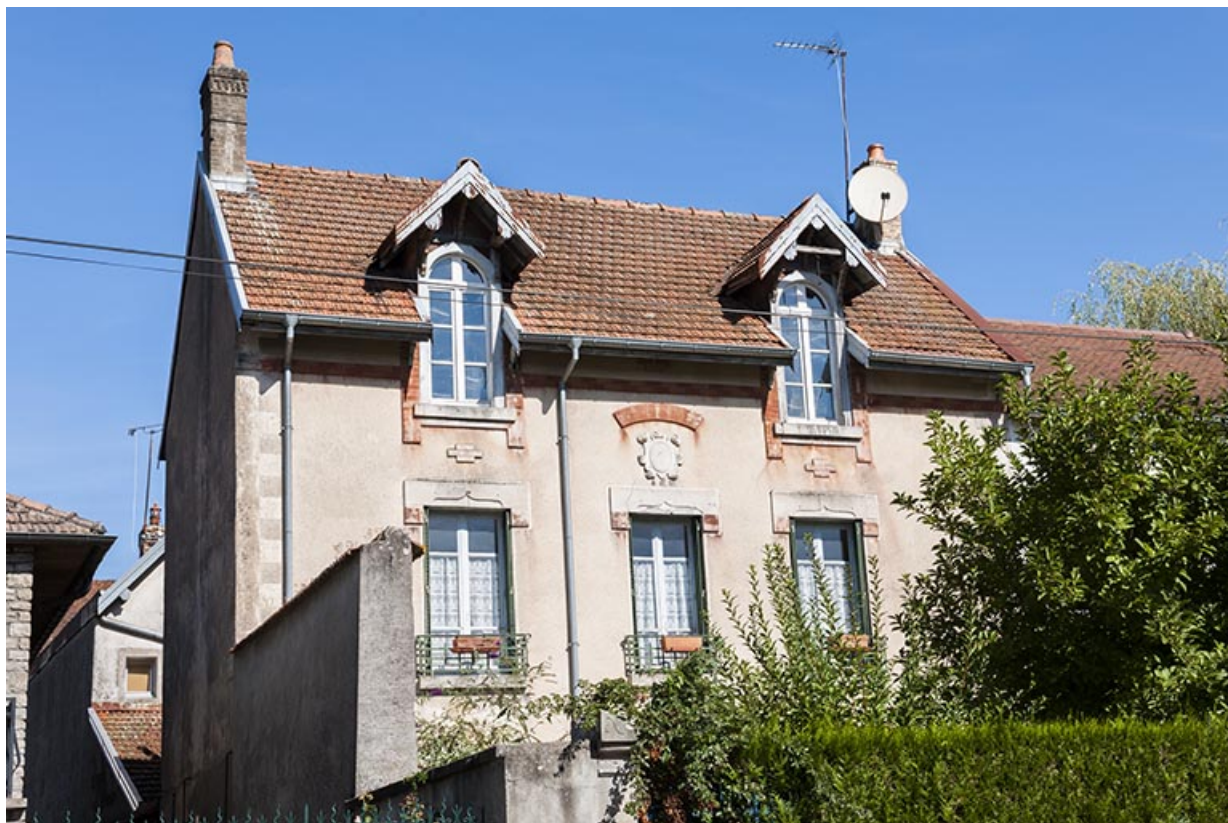
Façade antérieure de trois quart gauche.