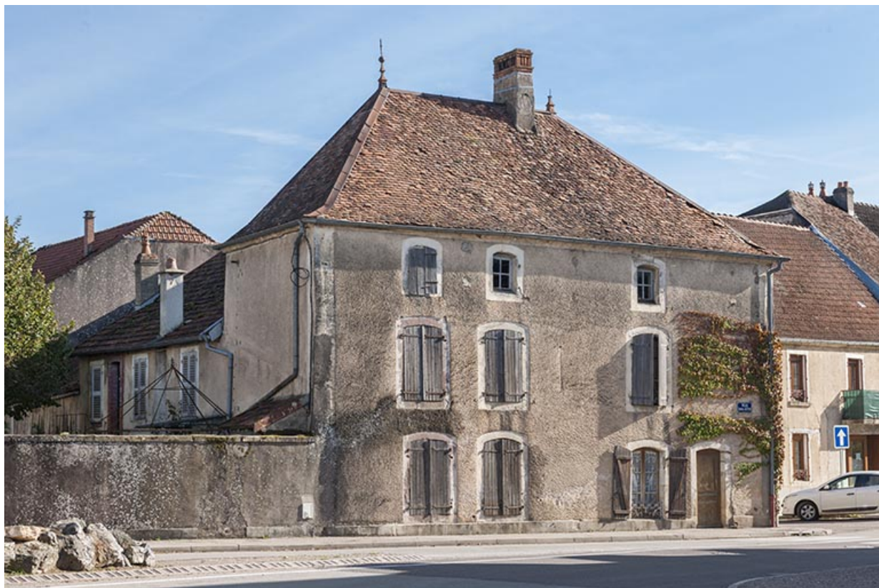
Vue générale depuis la place du Général de Gaulle.