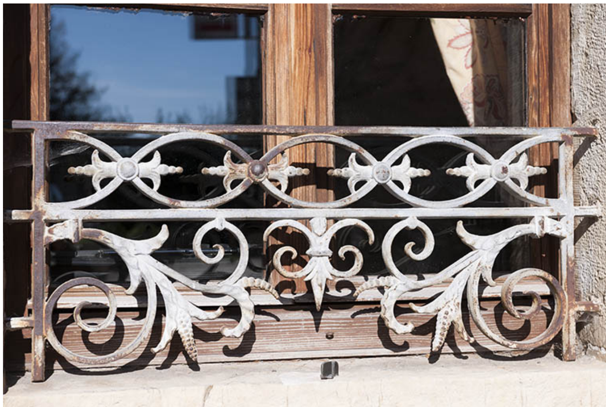
Façade sur la rue des Glacis, détail : le garde-corps en fonte d'une fenêtre du rez-de-chaussée. 70, Faverney, 3 rue des Glacis