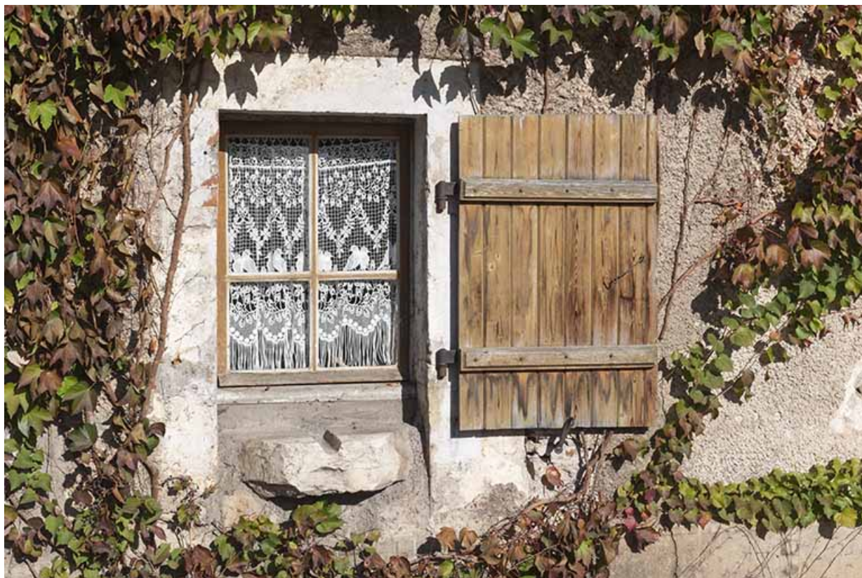
Maison, ancienne auberge et relais de poste, 3 rue des Glacis, détail : la fenêtre de la cuisine avec la sortie d'évier (ou goulotte). 70, Faverney, 3 rue des Glacis