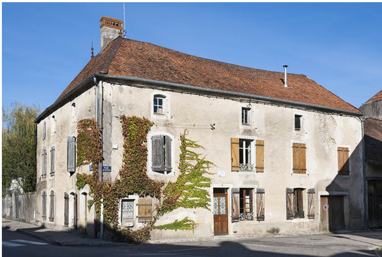
Façade donnant sur la rue des Glacis.