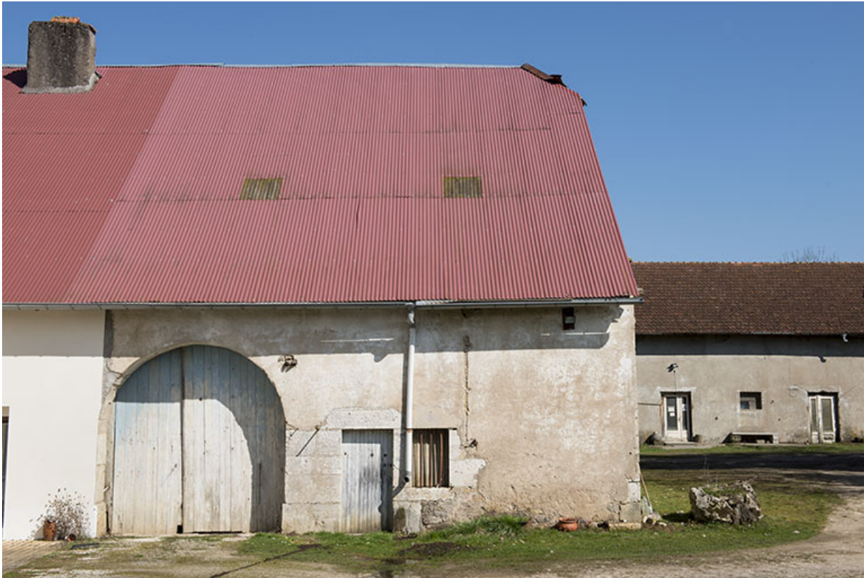
Site de l'ancien moulin Neuf.