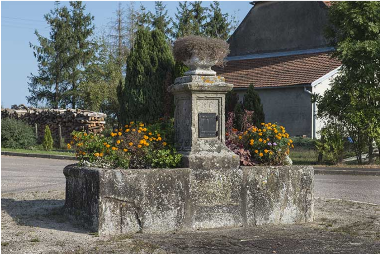
Fontaine de Mercey.