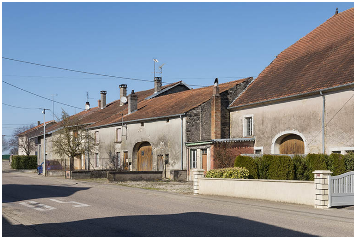
alignement de fermes à Mercey.