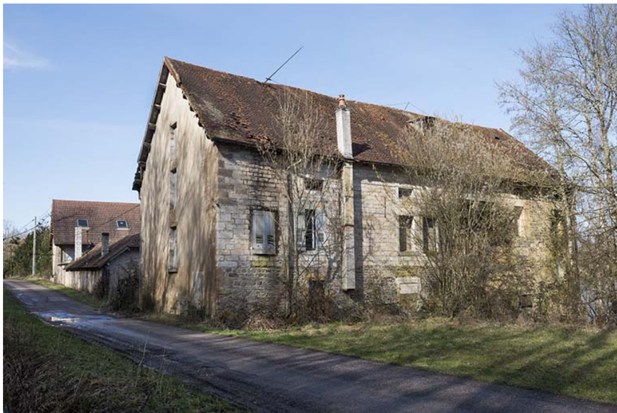
Vue générale du site du Moulin-Atre.