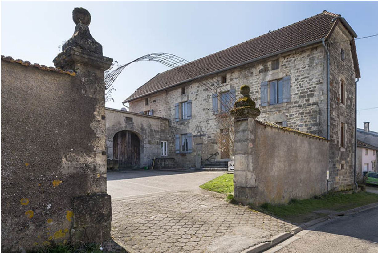
Maison située Grande rue.