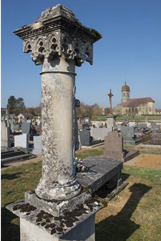
L'église vue depuis le cimetière.