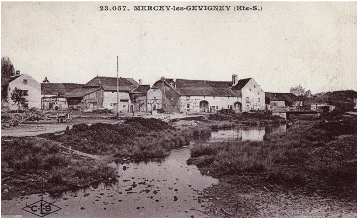
Mercey, carte postale. 70, Gevigney-et-Mercey