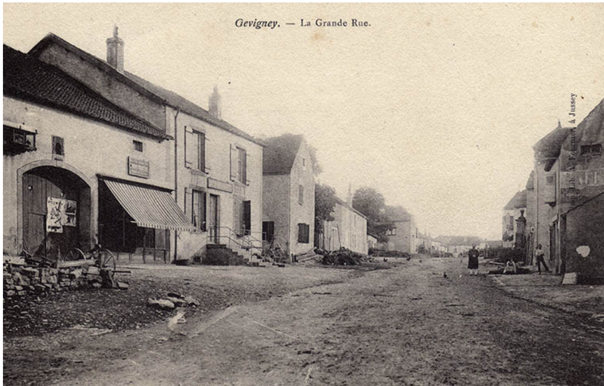
La grande rue, carte postale.