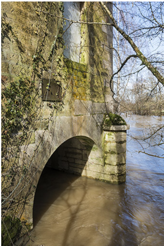
Canal de fuite du moulin.