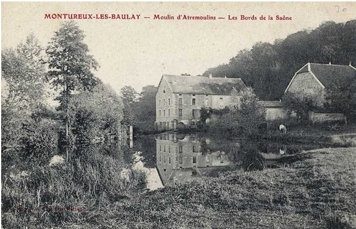
L'atre Moulin, carte postale.