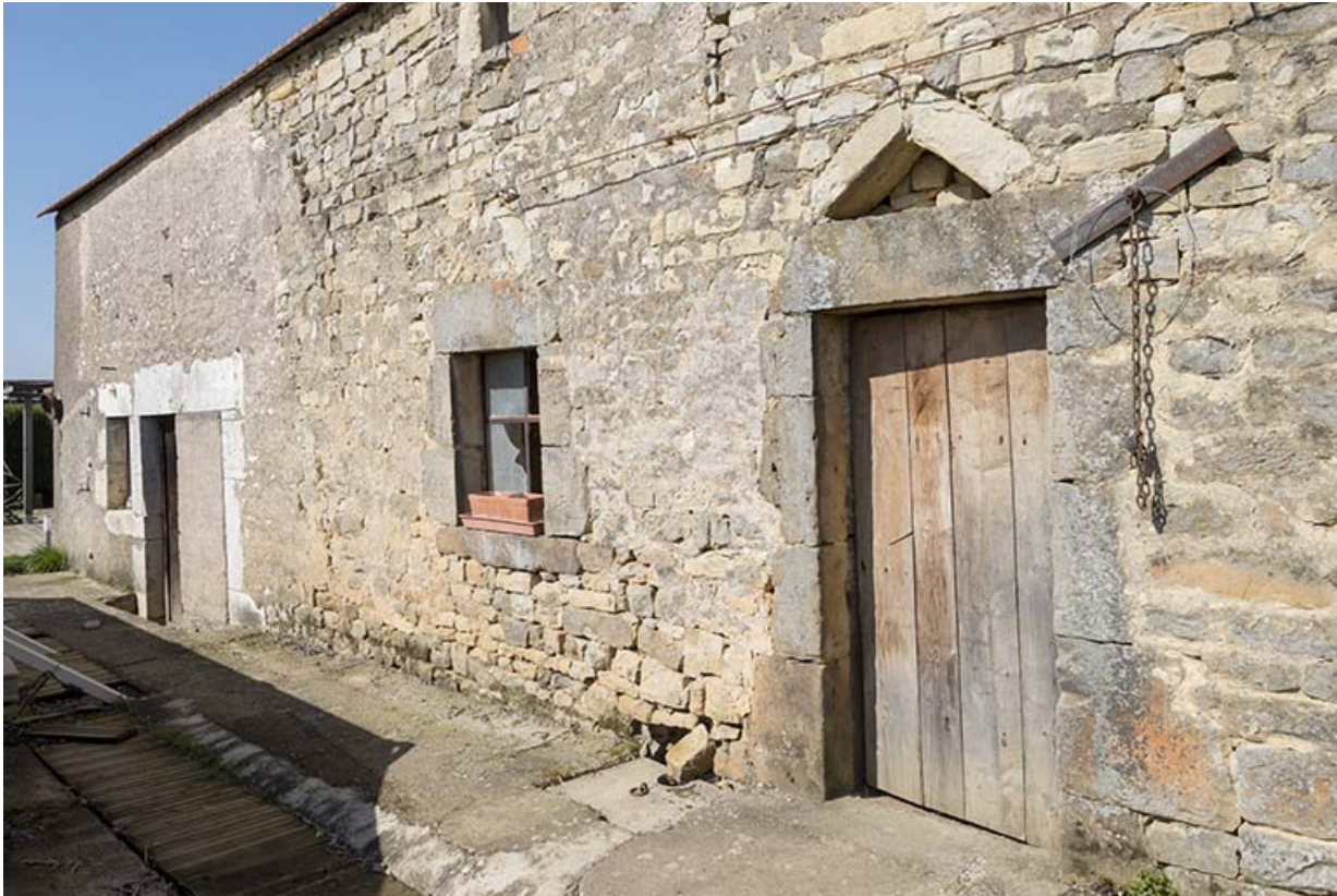
Façade postérieure de la maison.