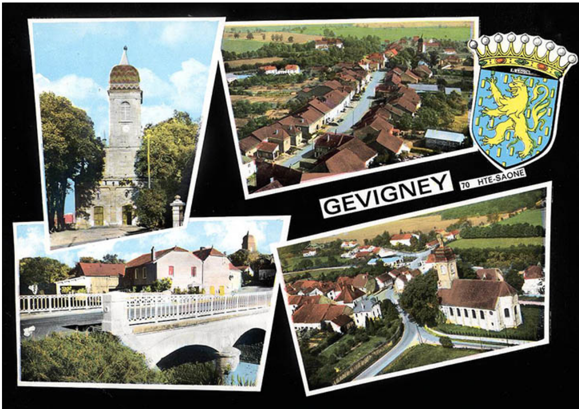
Souvenir de Gevigney-et-Mercey, carte postale. 70, Gevigney-et-Mercey