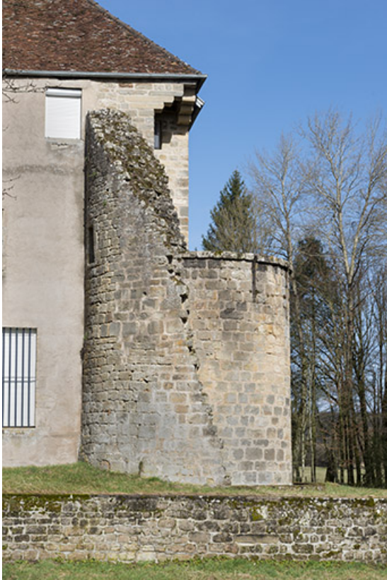
La tour du château.