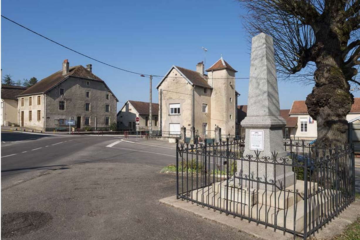
place à Gevigney avec le monument aux morts, la mairie et l'école. 70, Gevigney-et-Mercey