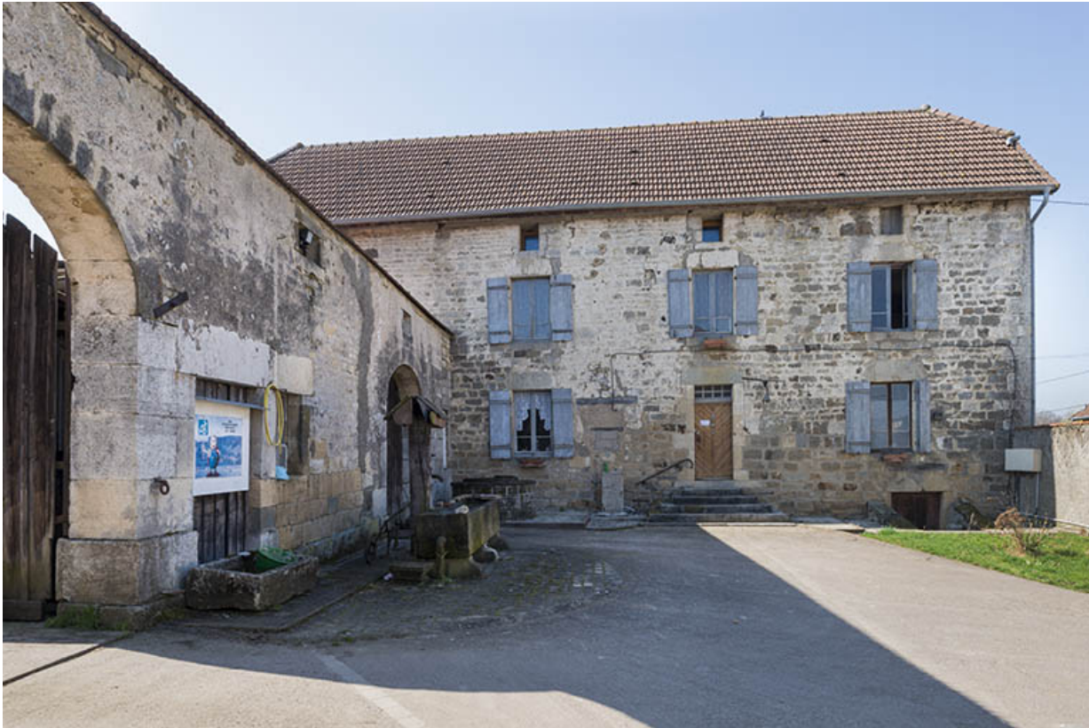
Cour de la maison.