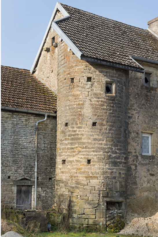
Tour d'une ancienne ferme, Mercey.