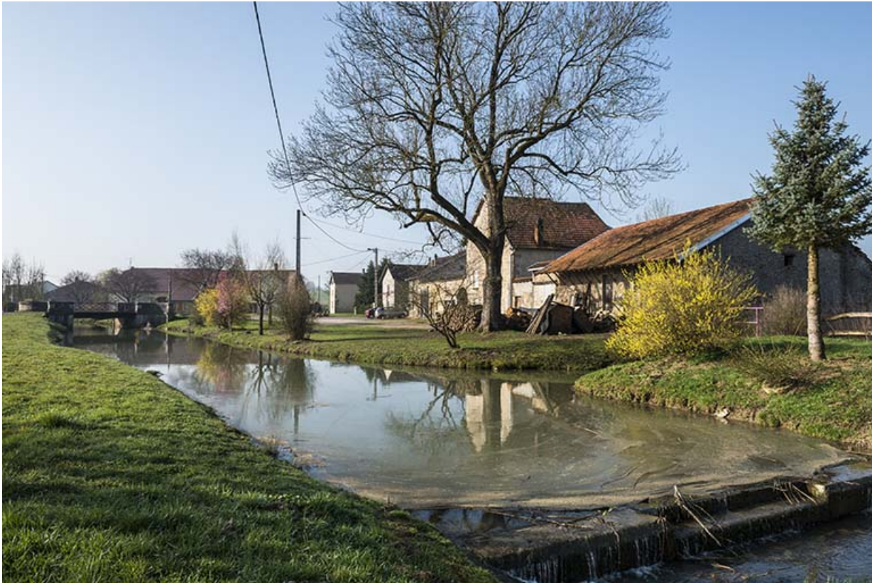
Mercey et le ruisseau de Boncourt.