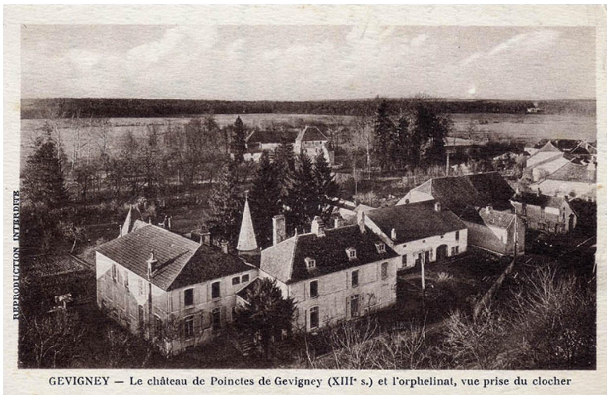
Le château de Gevigney, carte postale. 70, Gevigney-et-Mercey

Gevigney - Le château de Poinctes de Gevigney (XIII e siècle) et l'orphelinat, vue prise depuis le clocher, carte postale, sd.