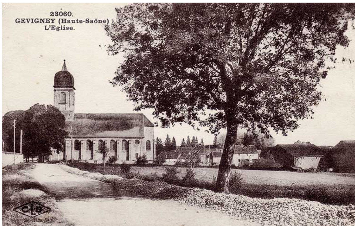
Vue sur l'église et le village de Gevigney depuis la route allant vers Mercey, carte postale. 70, Gevigney-et-Mercey