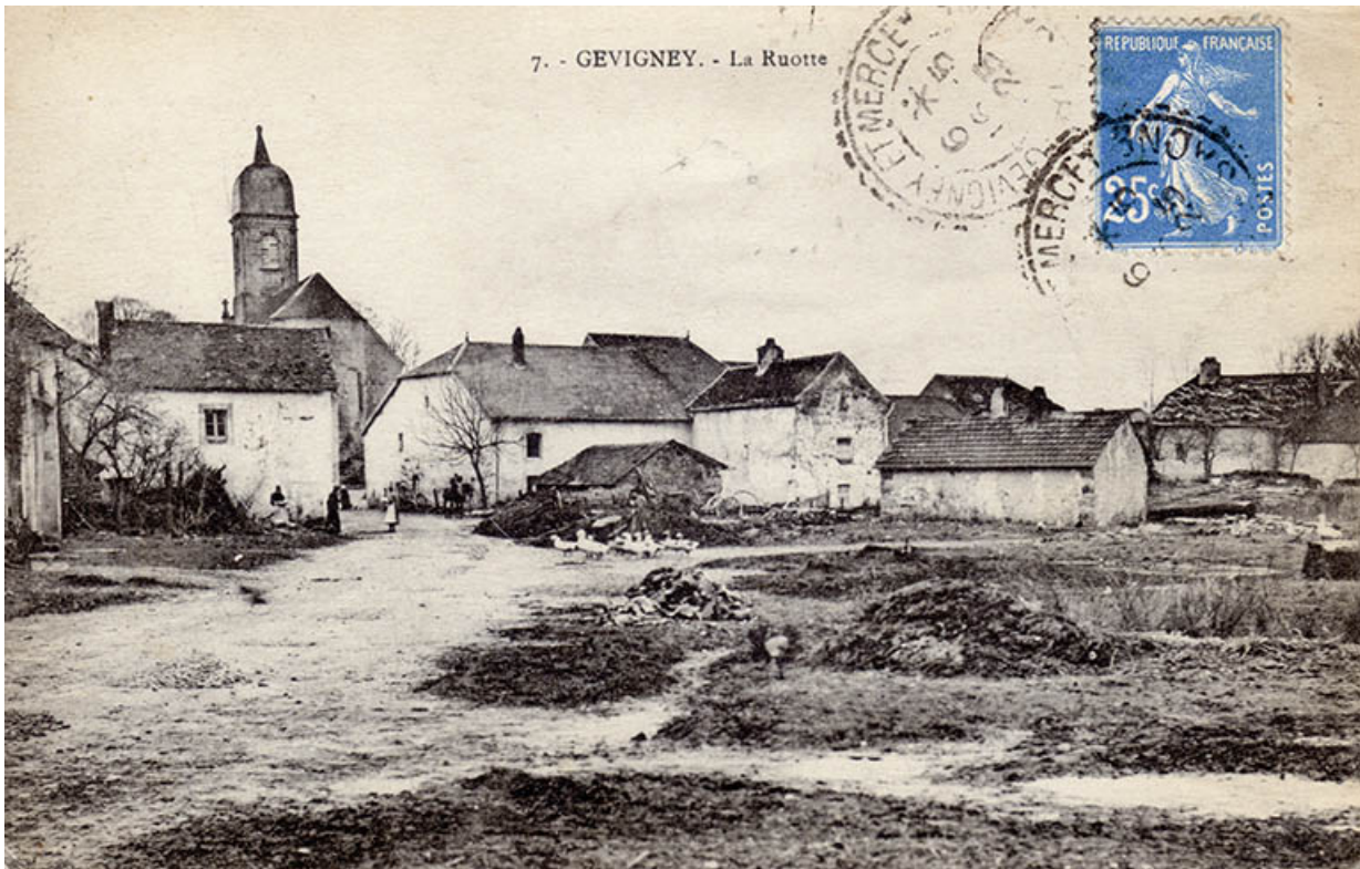
La Ruotte, carte postale (1925).