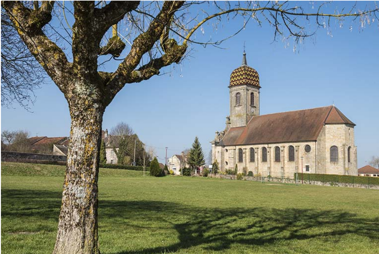
Eglise paroissiale de Gevigney-et-Mercey.