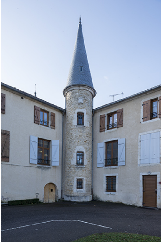
La tour dans la cour de l'ancien orphelinat.