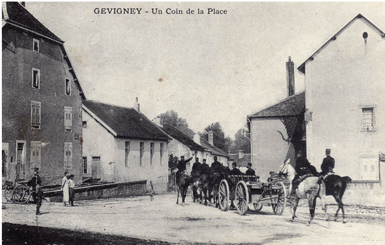
La place de Gevigney, carte postale (1917). 70, Gevigney-et-Mercey