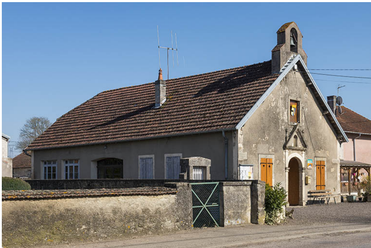
Vue latérale de l'édifice.