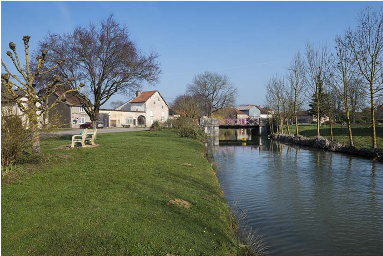
Le ruisseau avec le pont en arrière plan.