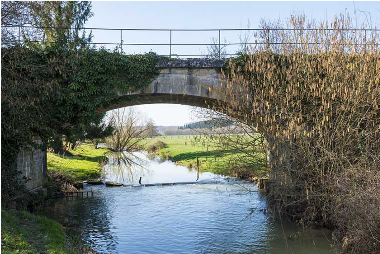
Pont enjambeant l'Ougeotte.