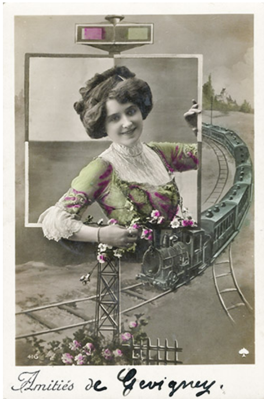
La ligne de tramway, carte postale.