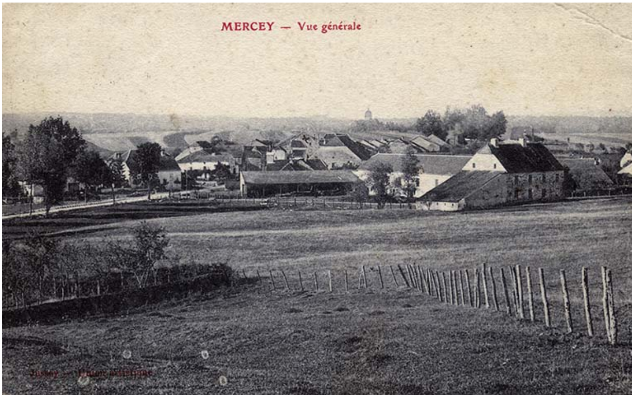
Vue générale de Mercey, carte postale. 70, Gevigney-et-Mercey