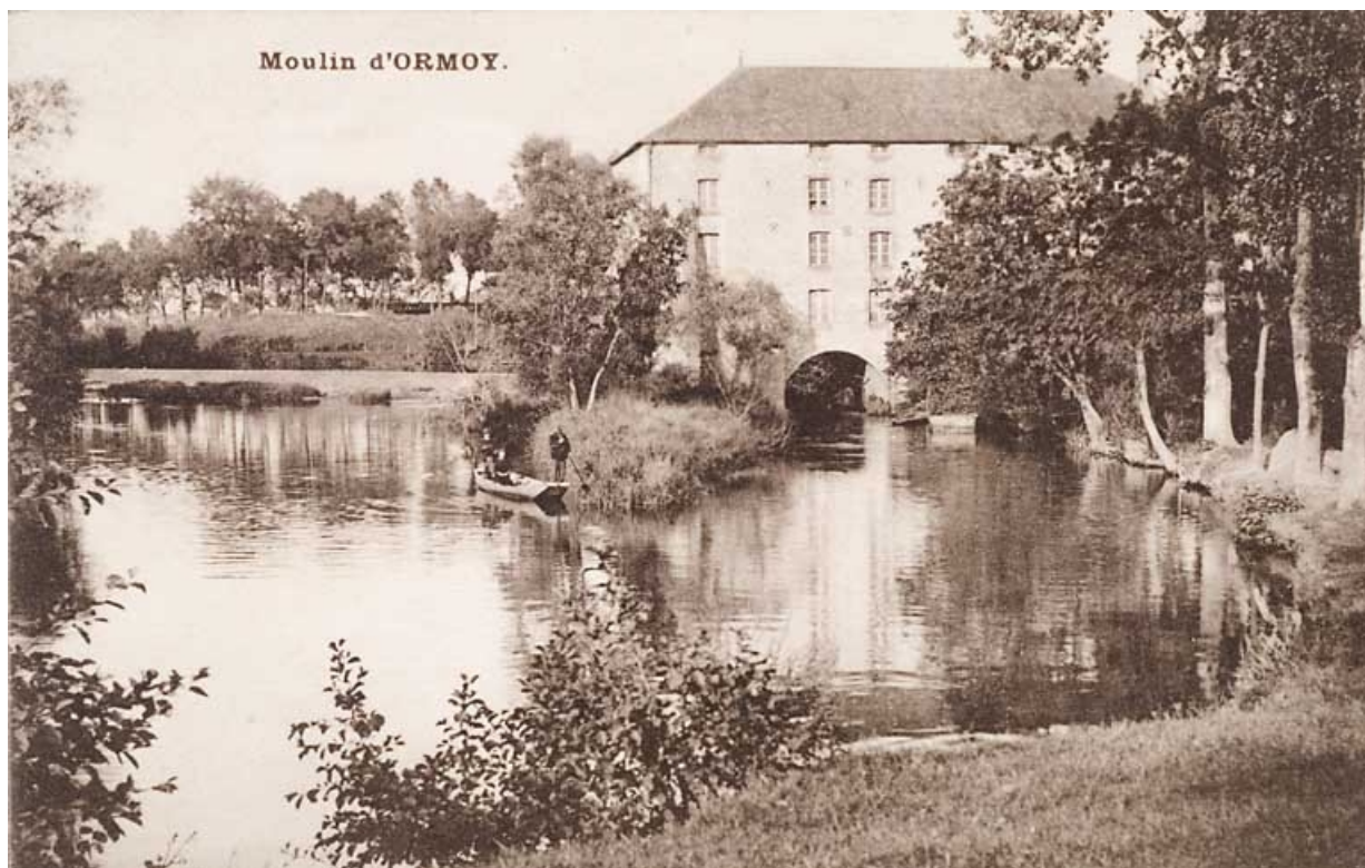
Moulin d'Ormoy. 70, Ormoy