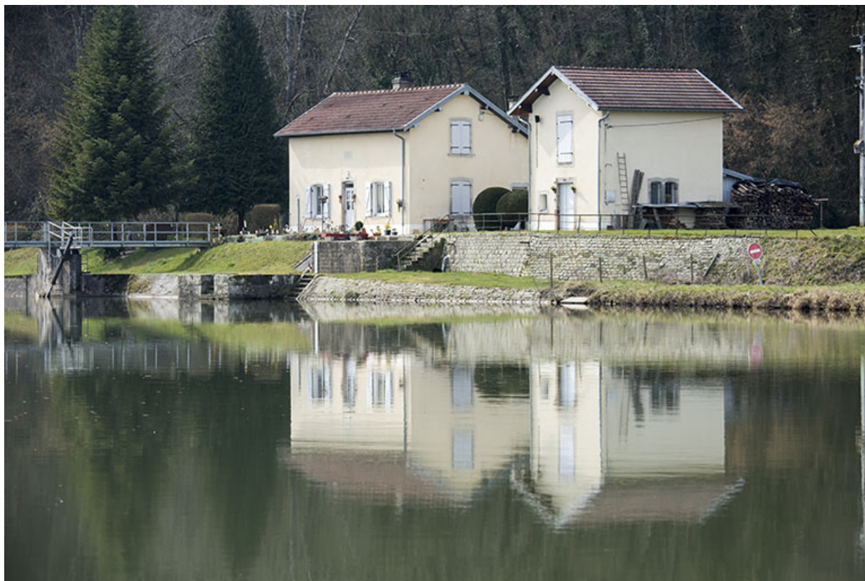
Site du barrage en amont du bief, commune de Ranzevelle. 70, Ormoy