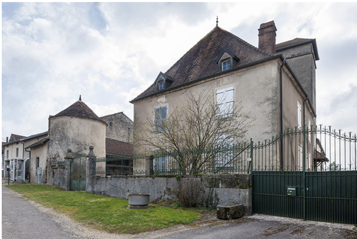
Demeure, rue Antoine Lumière. 70, Ormoy