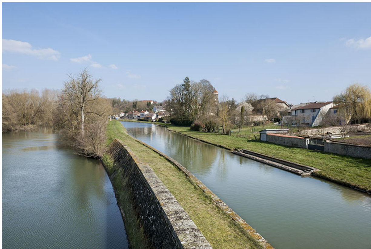
La Saône et le bief construit dans les années 1880. 70, Ormoy