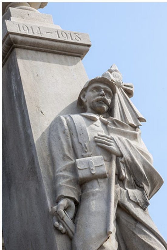
Détail du "poilu".