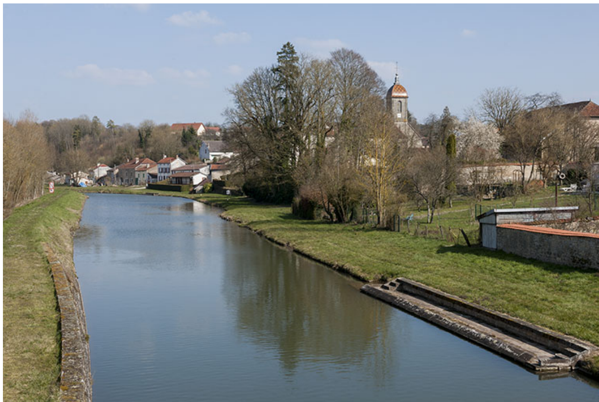
Le bief construit à Ormoy, afin de relier Corre à Port-sur-Saône. 70, Ormoy