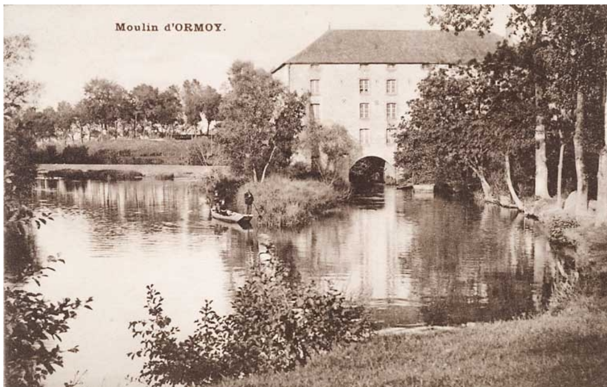
Moulin d'Ormoy. 70, Ormoy