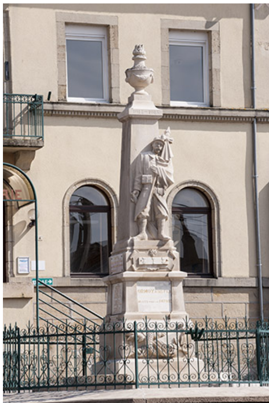
Le monument aux morts.