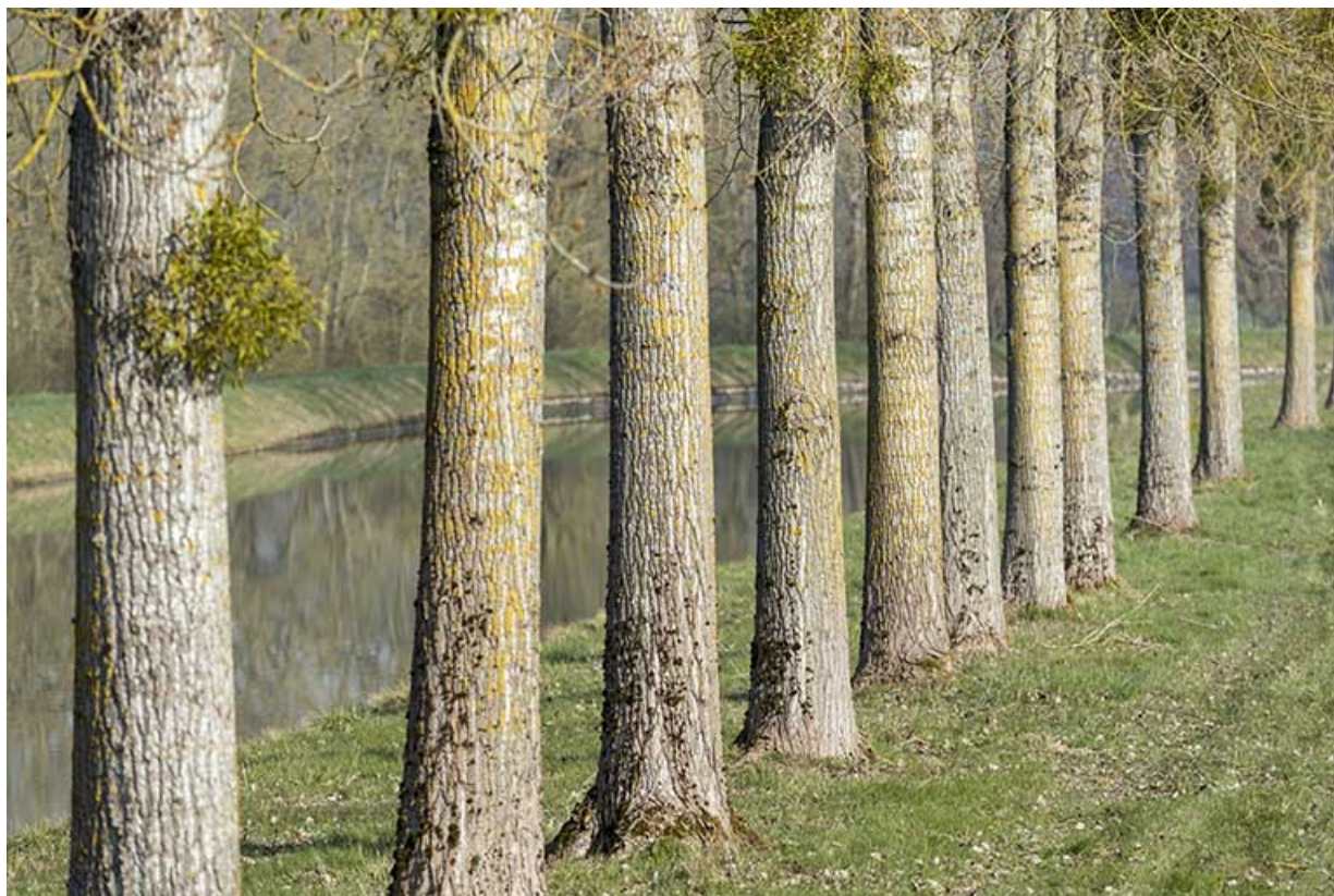
Alignement d'arbres le long du bief de dérivation.