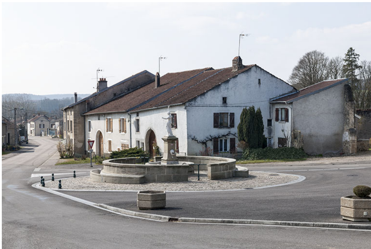
La fontaine du centre, et la rue Antoine Lumière en arrière-plan. 70, Ormoy