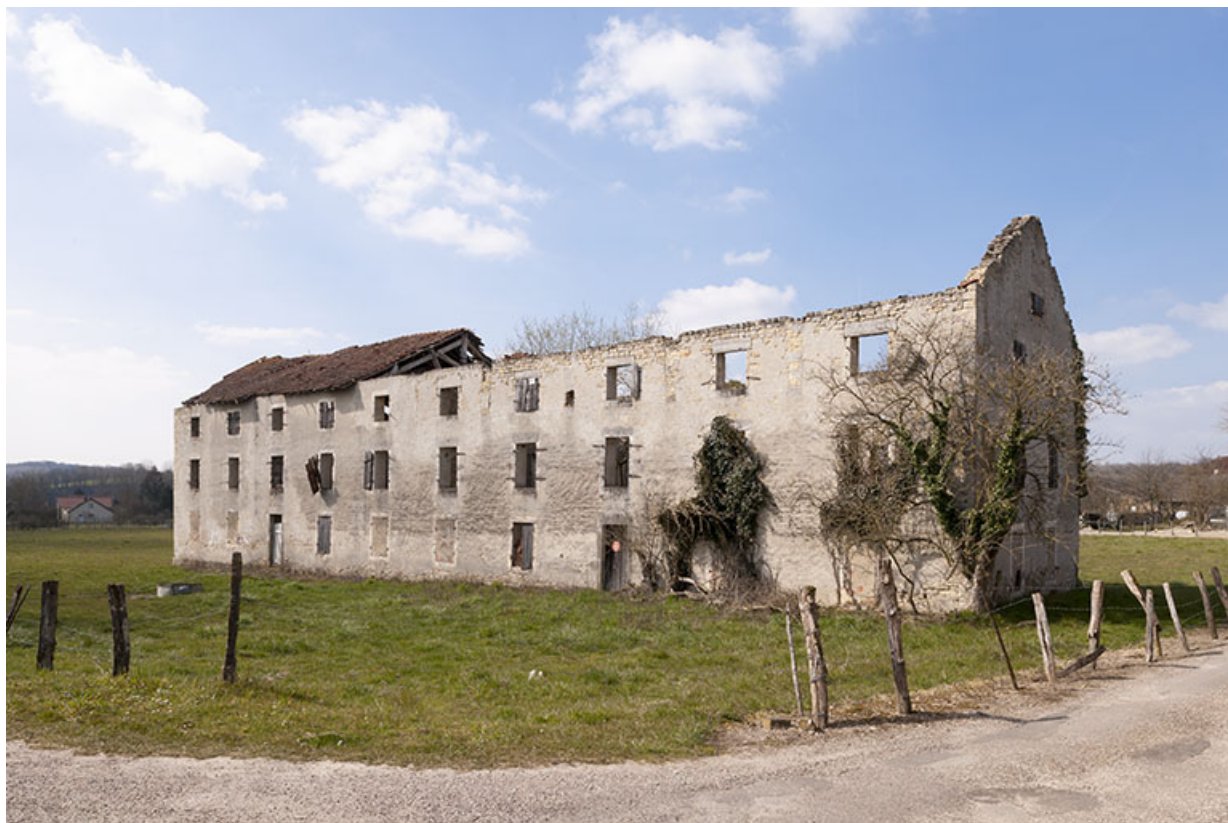
Ancienne manufacture de tabac.