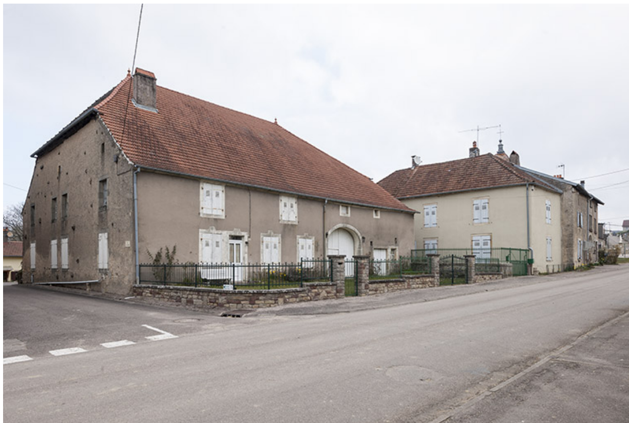
Ferme, rue Antoine Lumière. 70, Ormoy