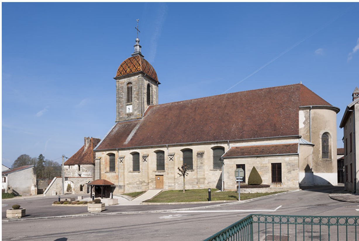
L'église d'Ormoy. 70, Ormoy