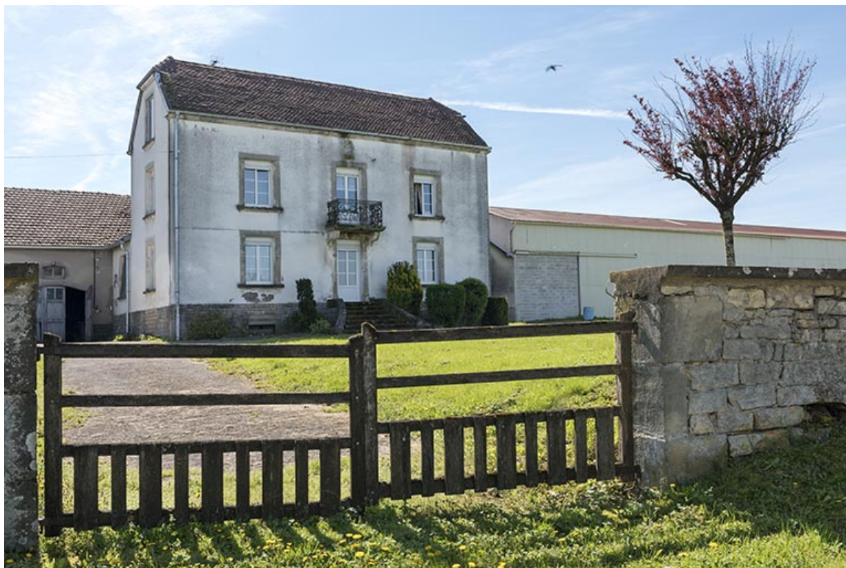
Maison d'habitation d'une ferme.