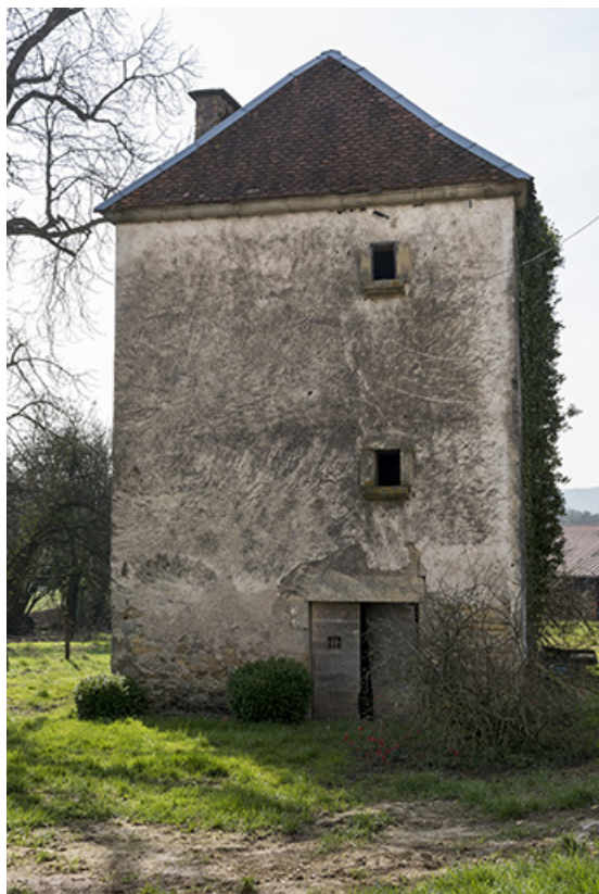
Le pigeonnier de Richecourt.