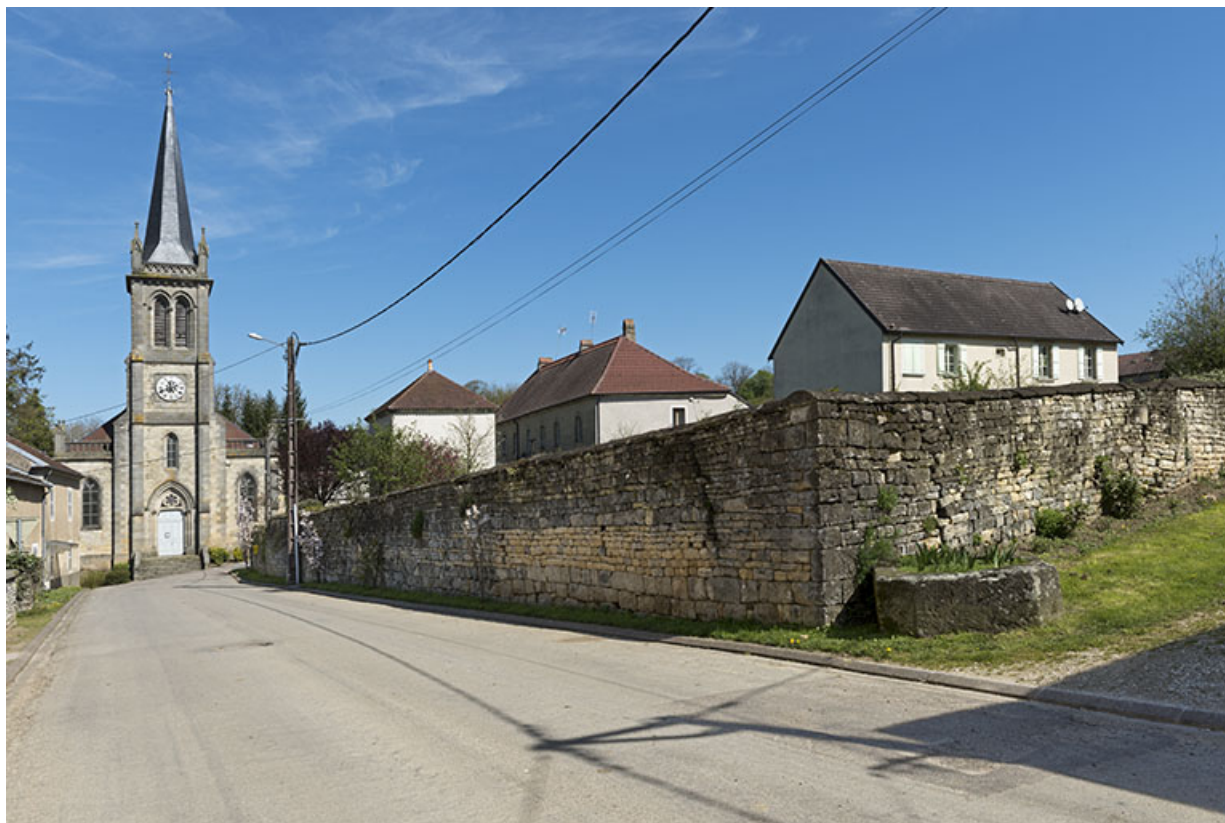
Rue de l'église, Aisey. 70, Aisey-et-Richecourt