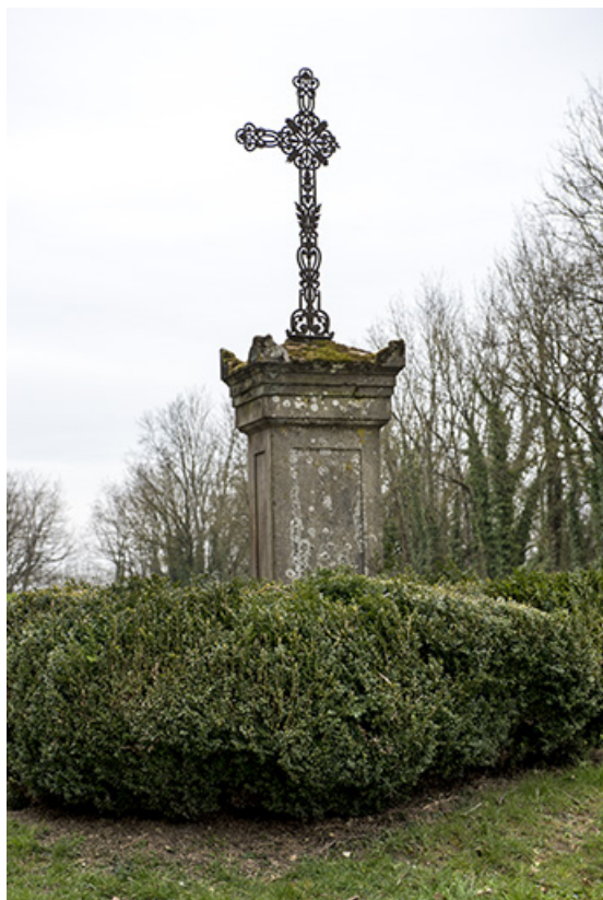
Croix, rue du Petit Mont à Aisey.