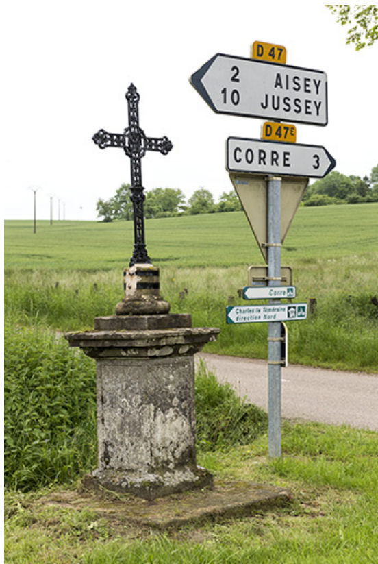
Croix de chemin à Richecourt.