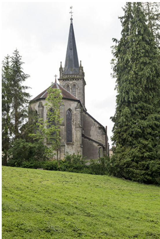
L'église depuis le parc du château.