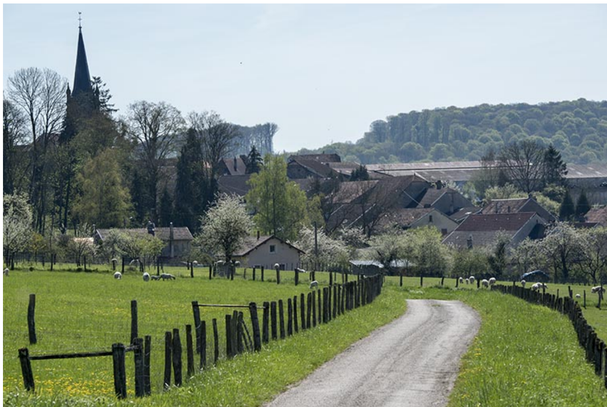
Village d'Aisey, Aisey-et-Richecourt.