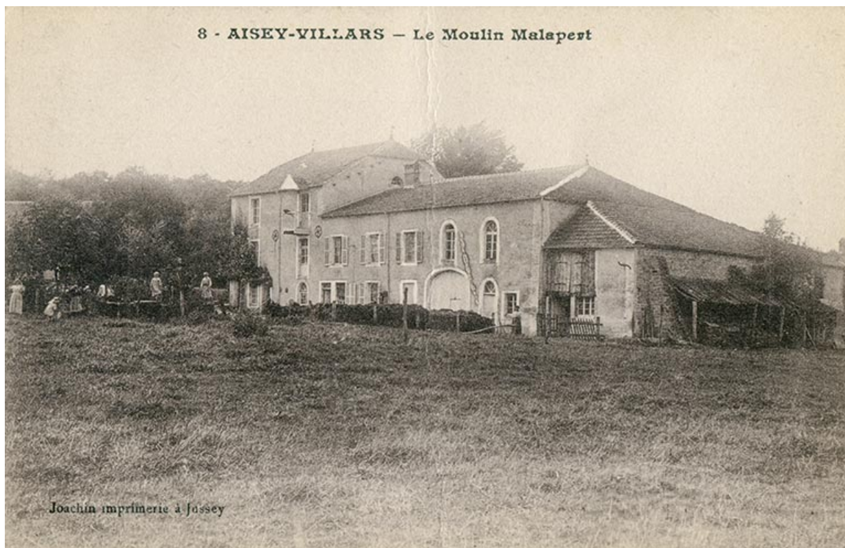
Ancien moulin de Malapert à Aisey, carte postale. 70, Aisey-et-Richecourt