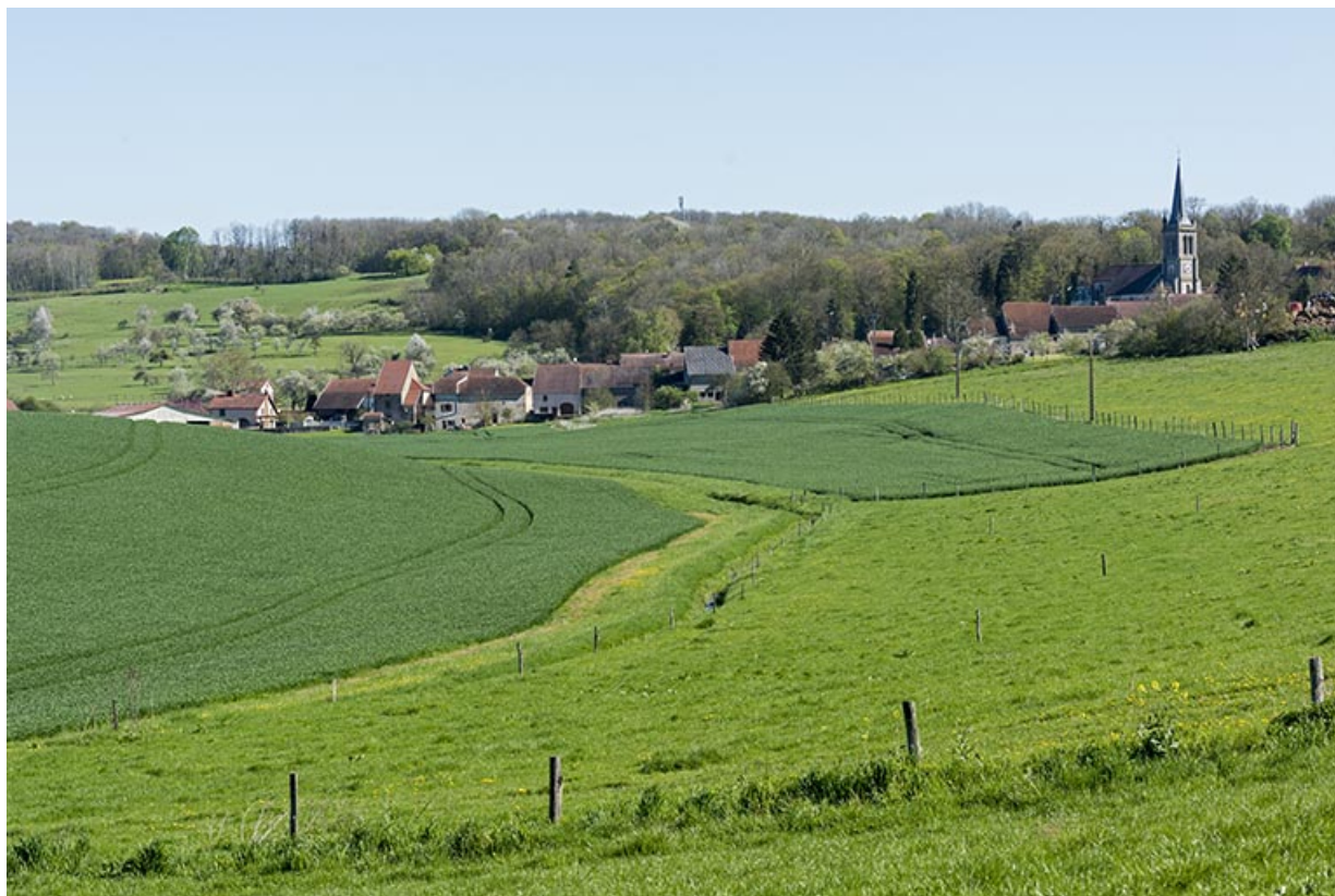
Paysage autour d'Aisey. 70, Aisey-et-Richecourt