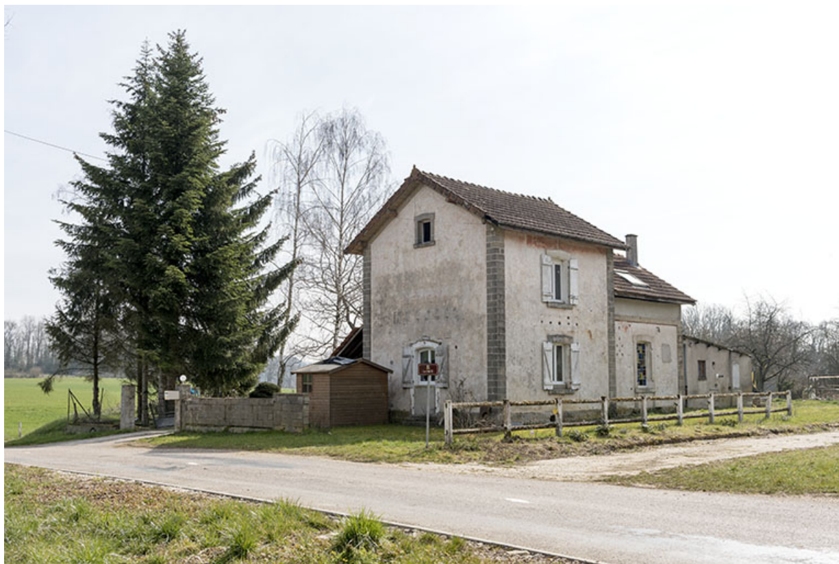
Maison garde-barrière entre Aisey et Bétaucourt.