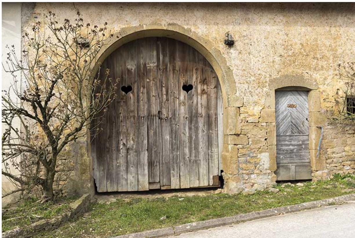
Entrée d'une grange à Aisey.