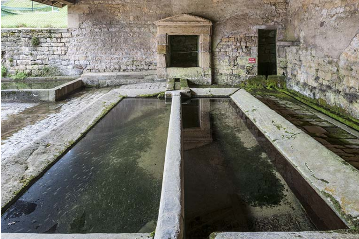
Les bassins du lavoir, rue de la Fontaine. 70, Fouchécourt