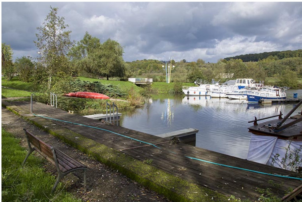
Le port de plaisance sur la Saône.