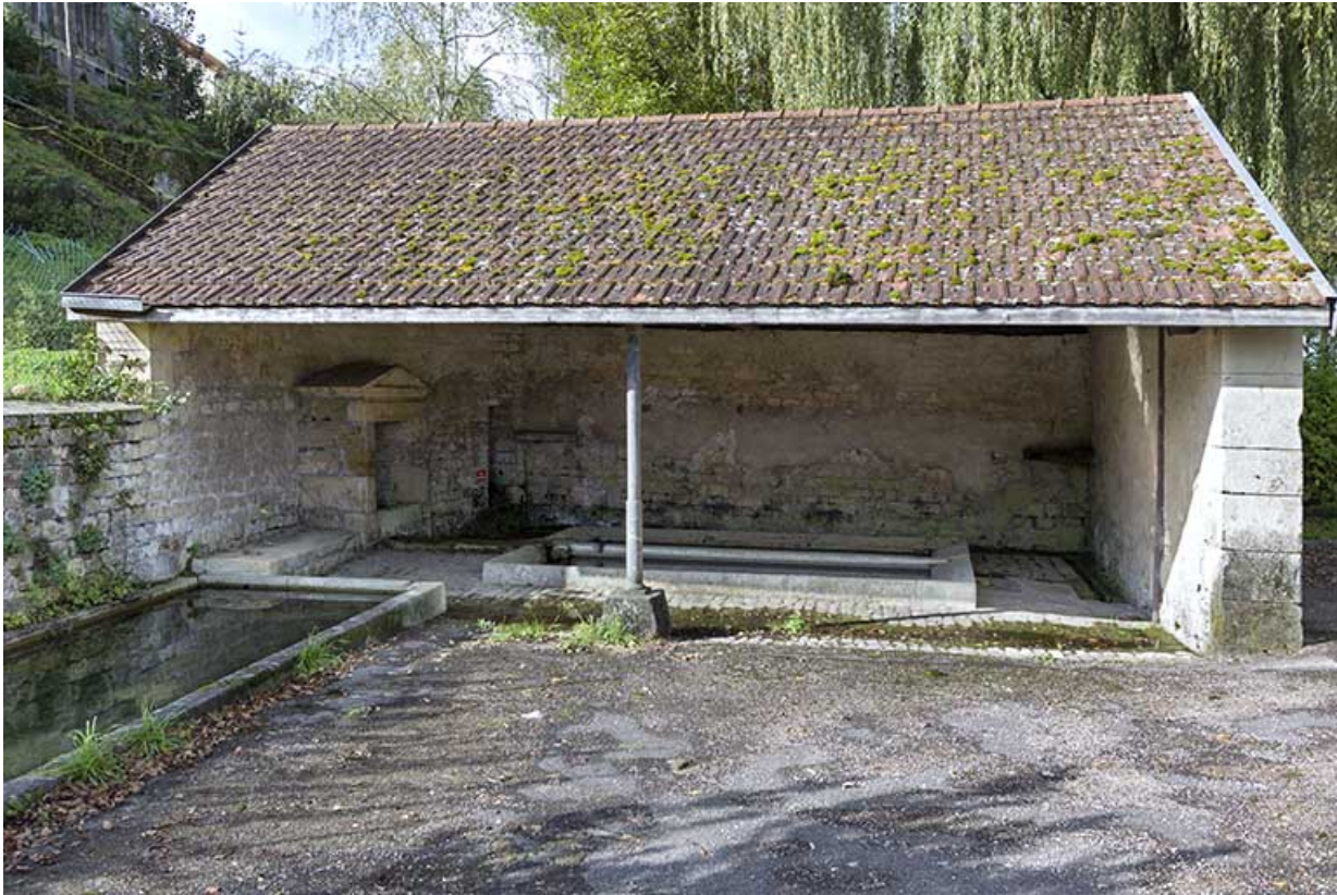
Vue générale de la fontaine-lavoir. 70, Fouchécourt