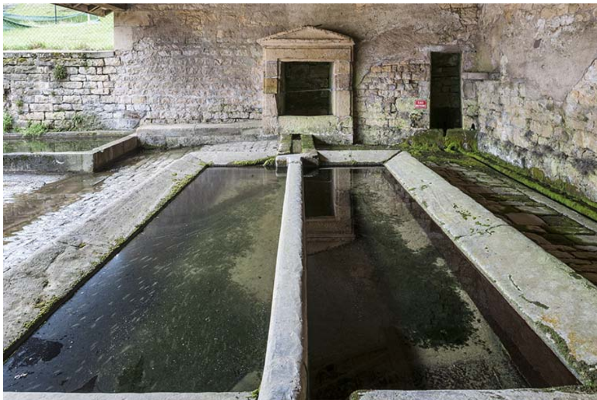
Les bassins du lavoire, rue de la Fontaine. 70, Fouchécourt