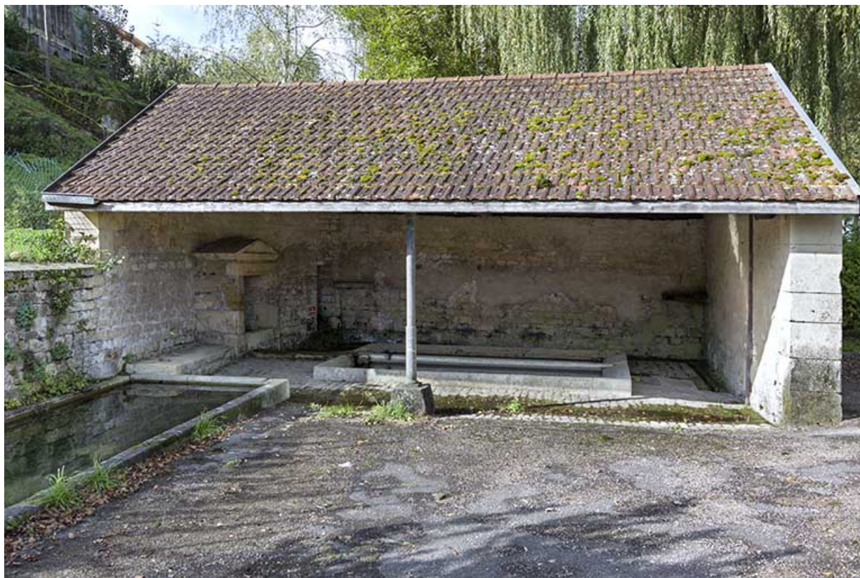
Vue générale de la fontaine-lavoir.