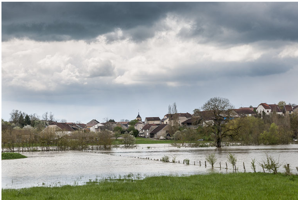
La Saône en crue. 70, Fouchécourt