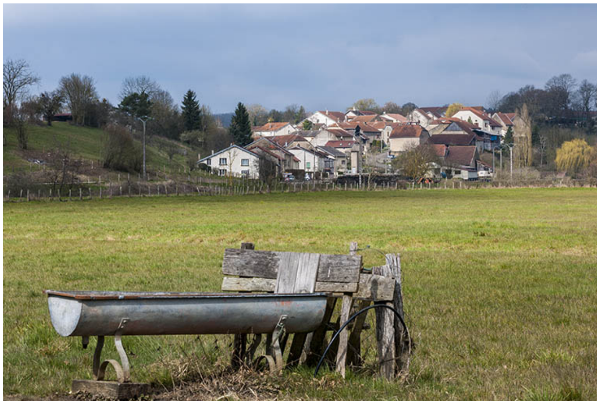
Vue sur le village.