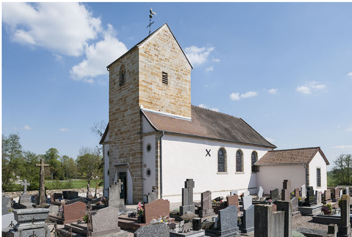
L'église Saint-Pierre. 70, Montureux-lès-Baulay