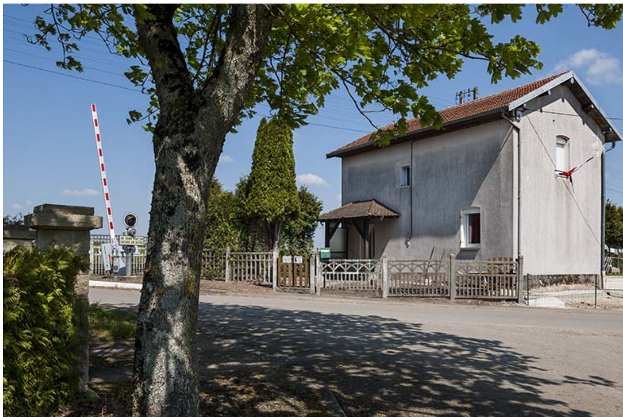
Maison garde-barrière, Grande rue.