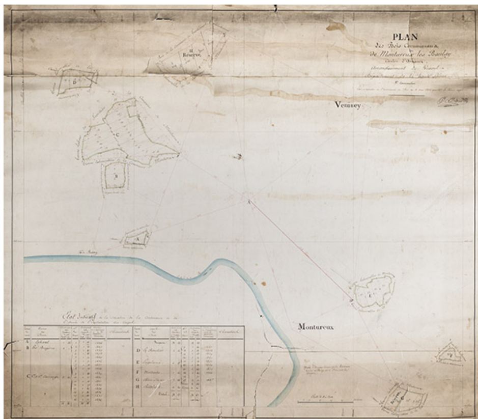
Plan des bois communaux (1822). 70, Montureux-lès-Baulay