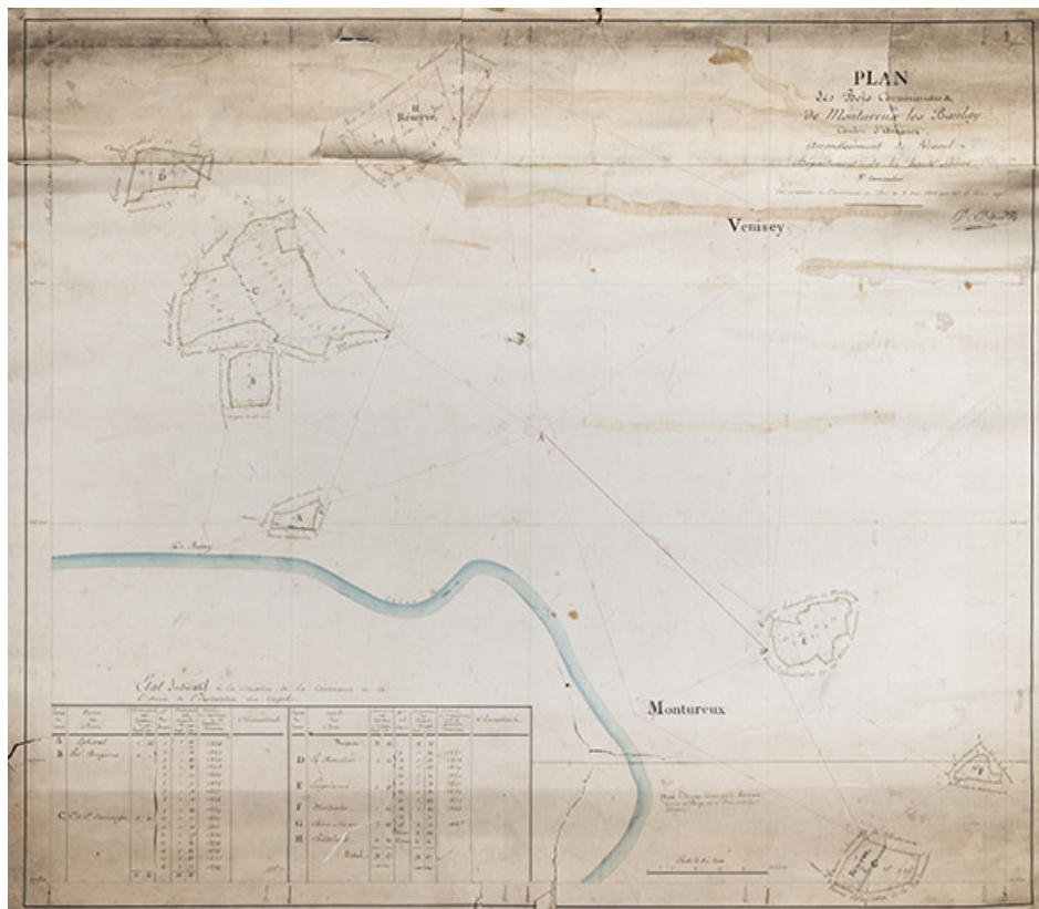
Plan des bois communaux (1822). 70, Montureux-lès-Baulay