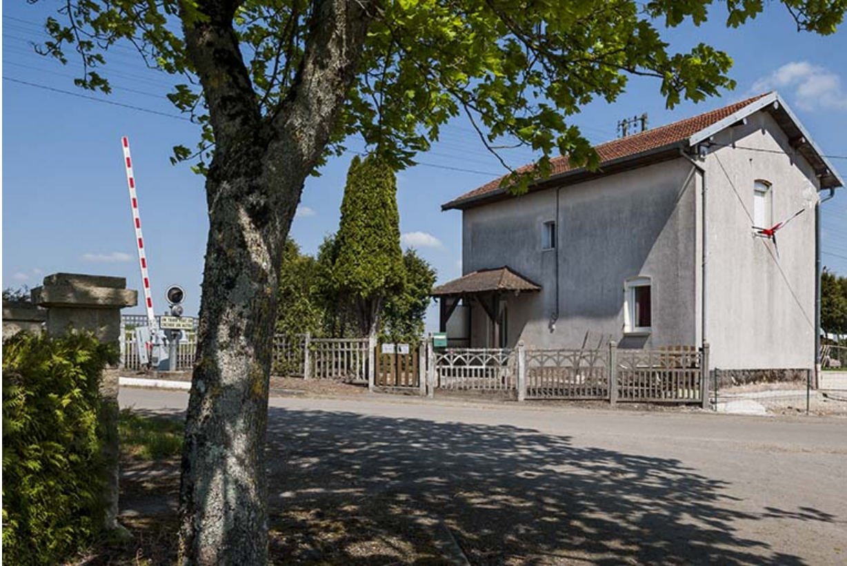
Maison garde-barrière, Grande rue.