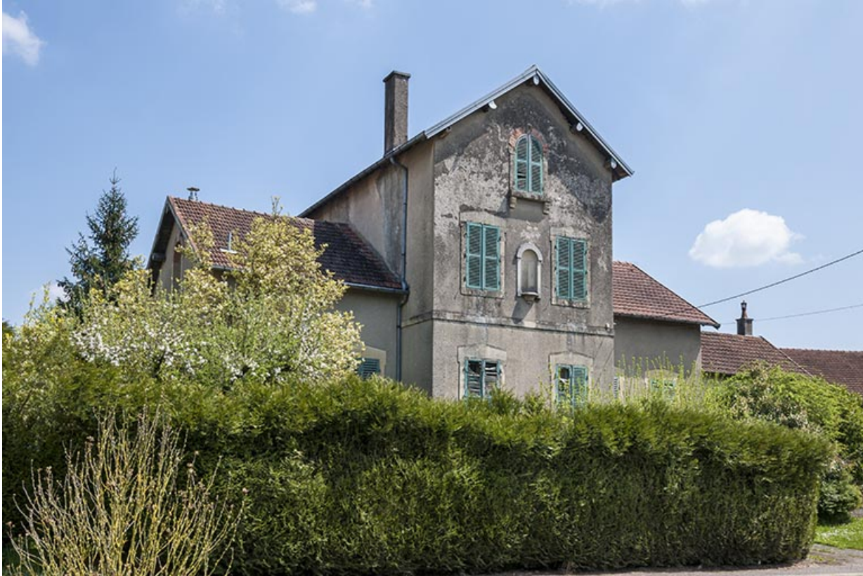
Ancienne maison des soeurs.