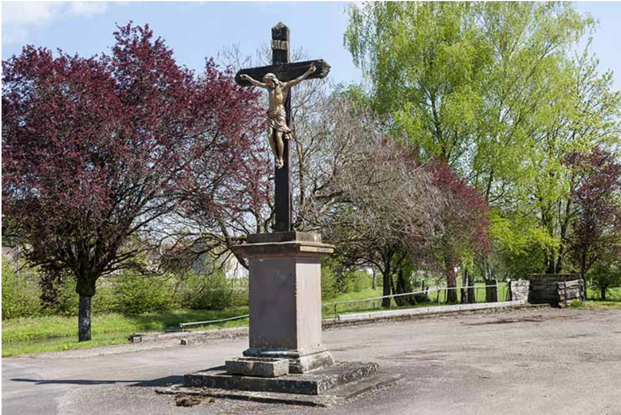
Calvaire, route de l'Eglise.