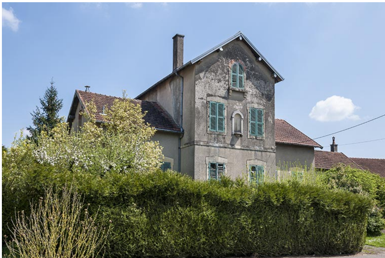
Ancienne maison des soeurs. 70, Montureux-lès-Baulay