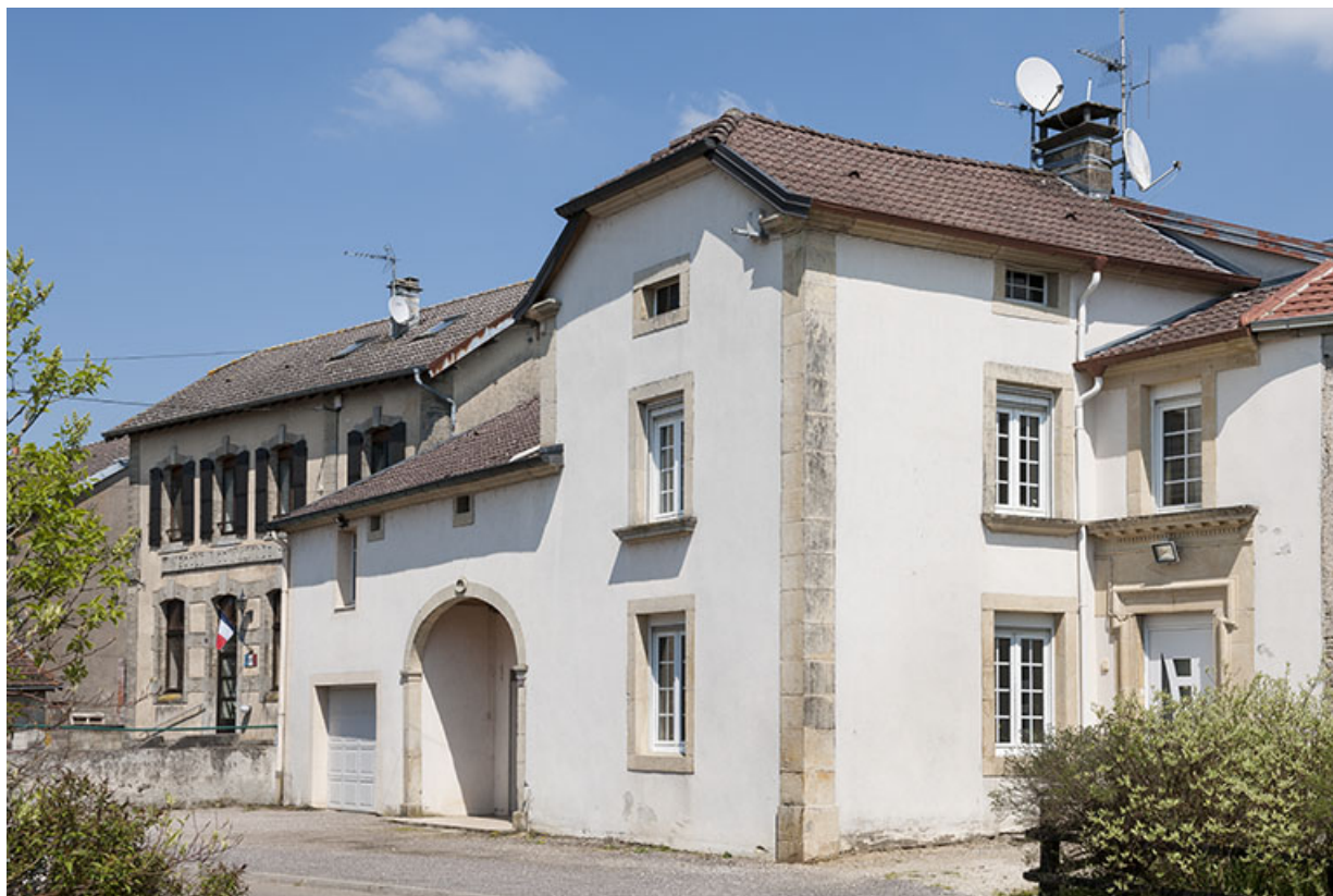
Ferme, Grande rue. 70, Montureux-lès-Baulay