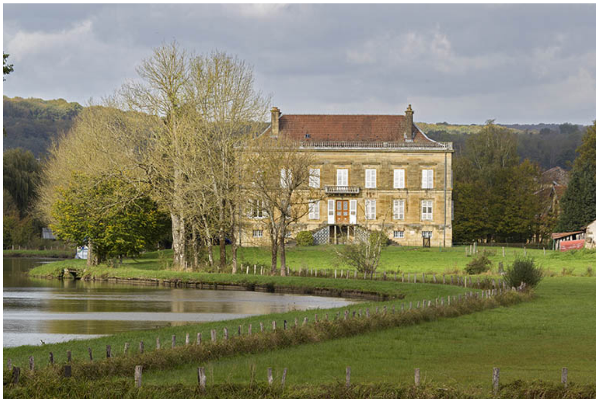
Château et la Saône, Montureux-lès-Baulay.