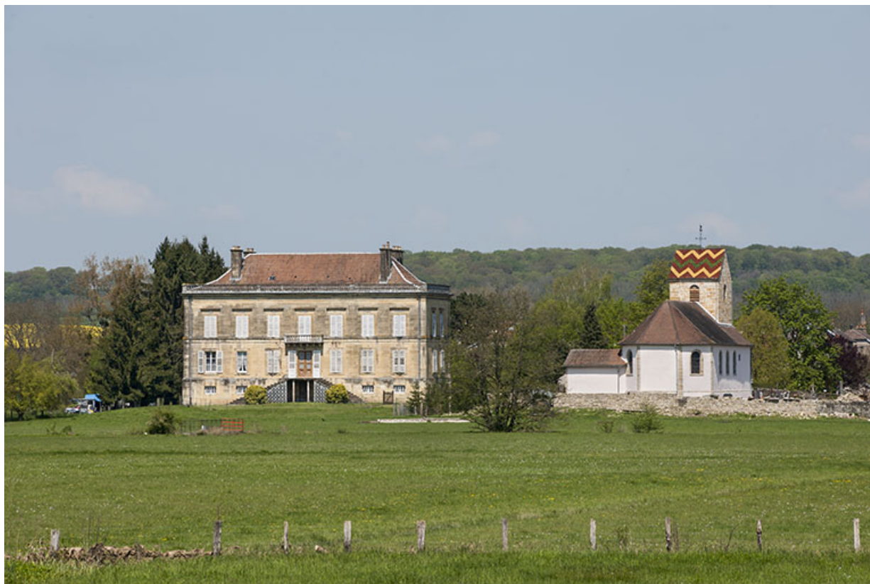
Le château et l'église Saint-Pierre.