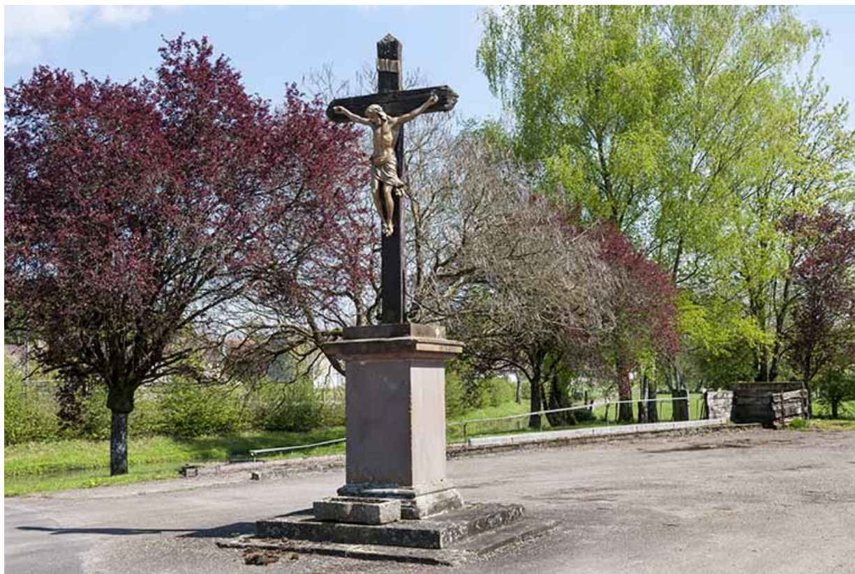
Calvaire, route de l'Eglise. 70, Montureux-lès-Baulay