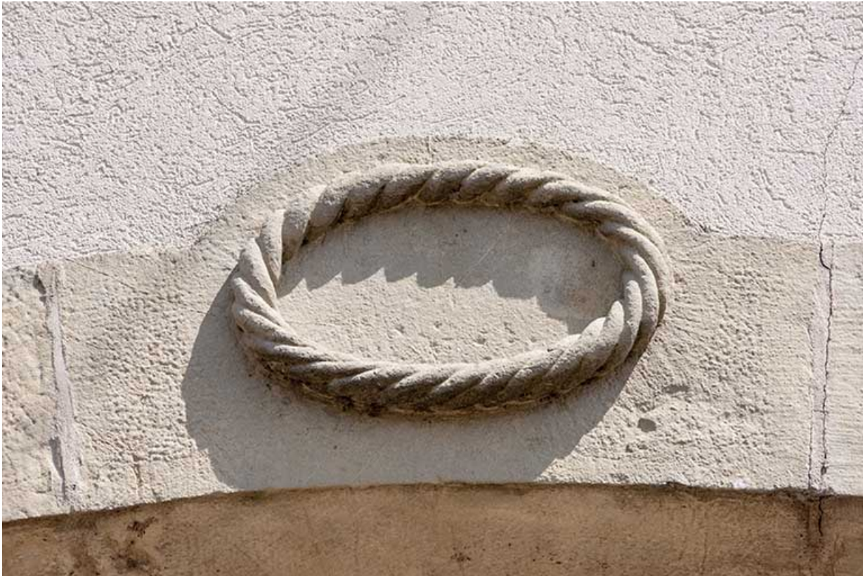
Détail d'un décor, entrée de grange.