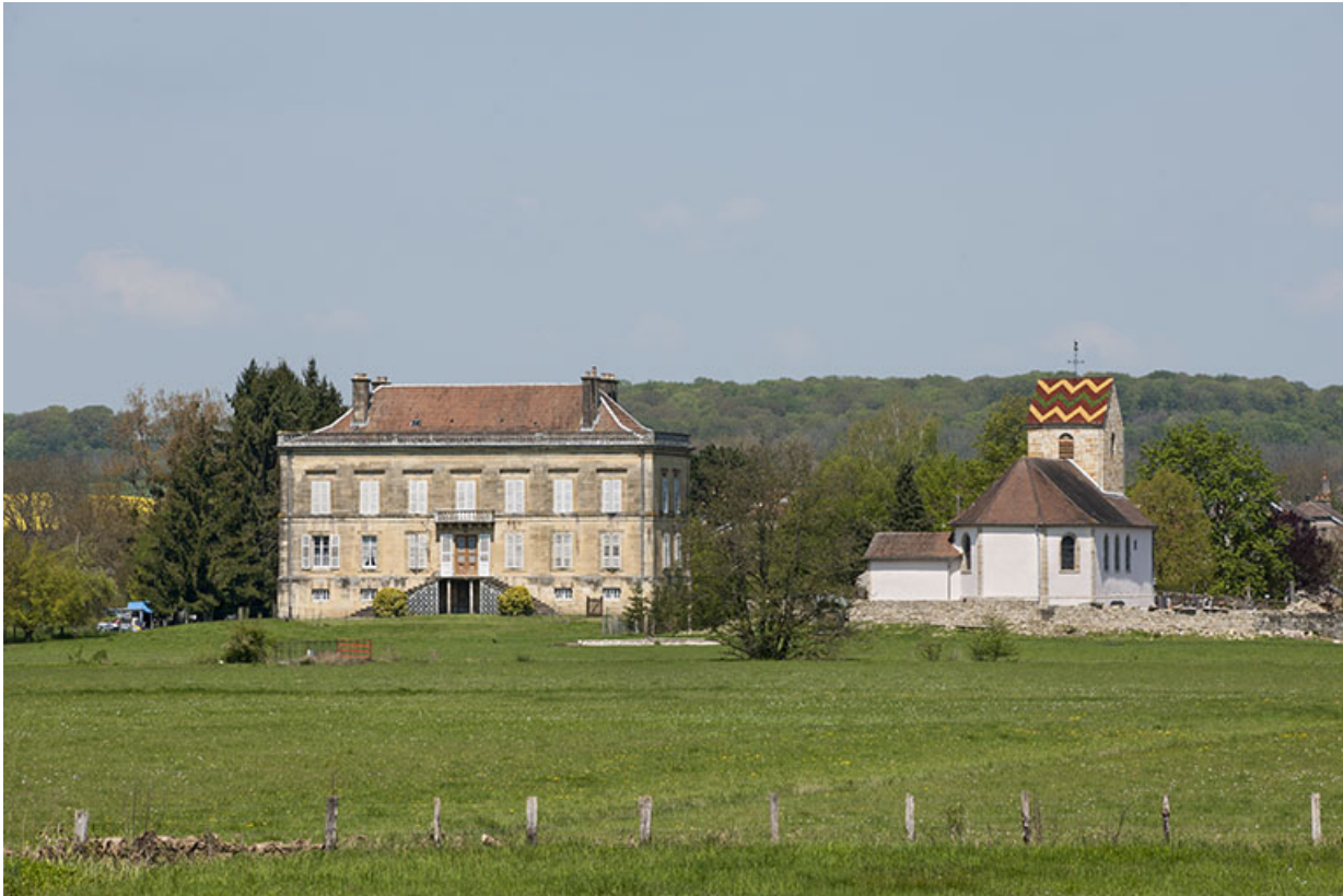
Le château et l'église Saint-Pierre.