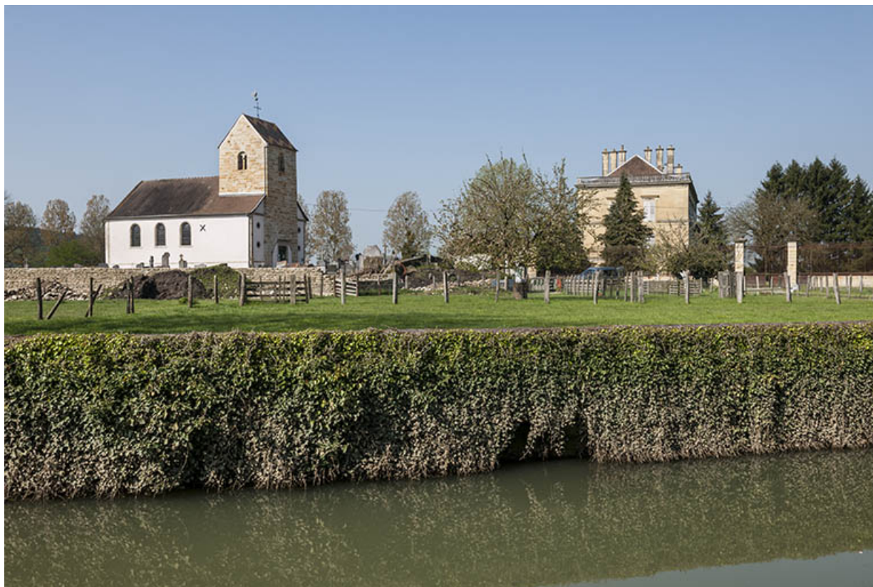
Le château et l'église depuis le ruisseau de la Sacquelle.