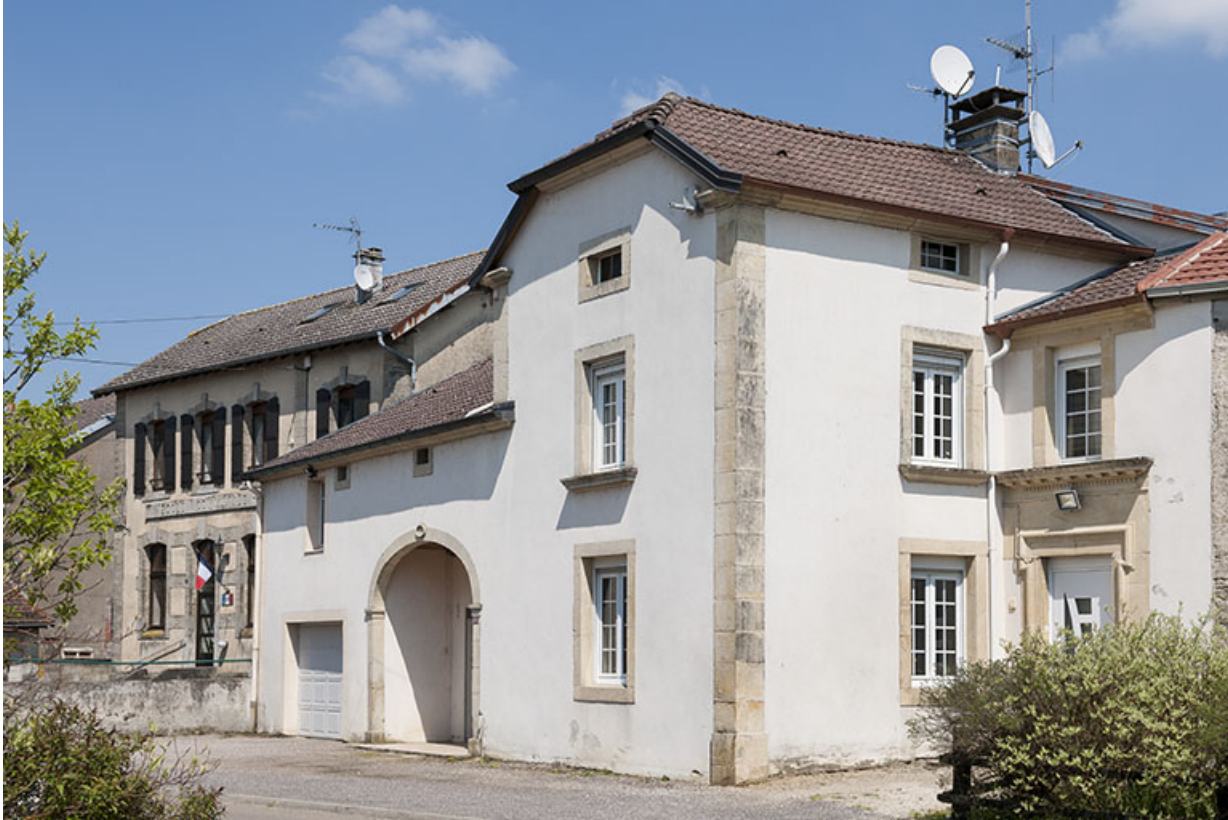
Ferme, Grande rue.