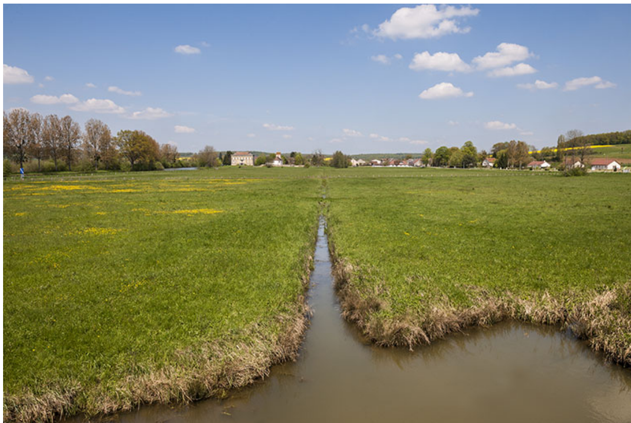
Vue sur les pâturages avec le château en arrière plan.