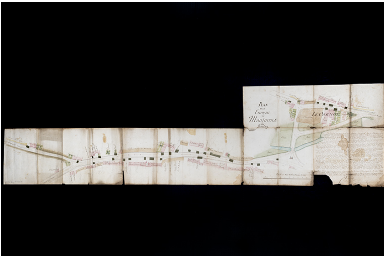
Plan général de la commune (1814).