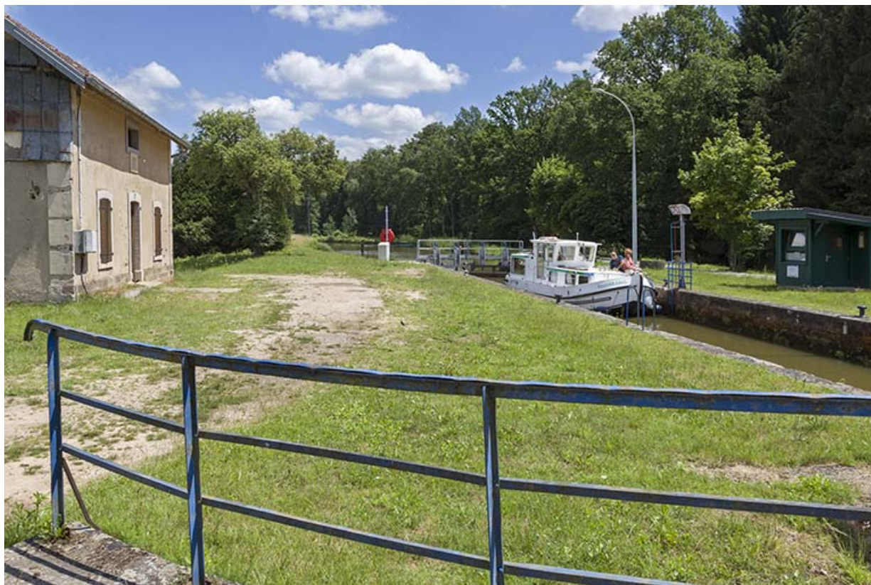
L'écluse depuis le pont.