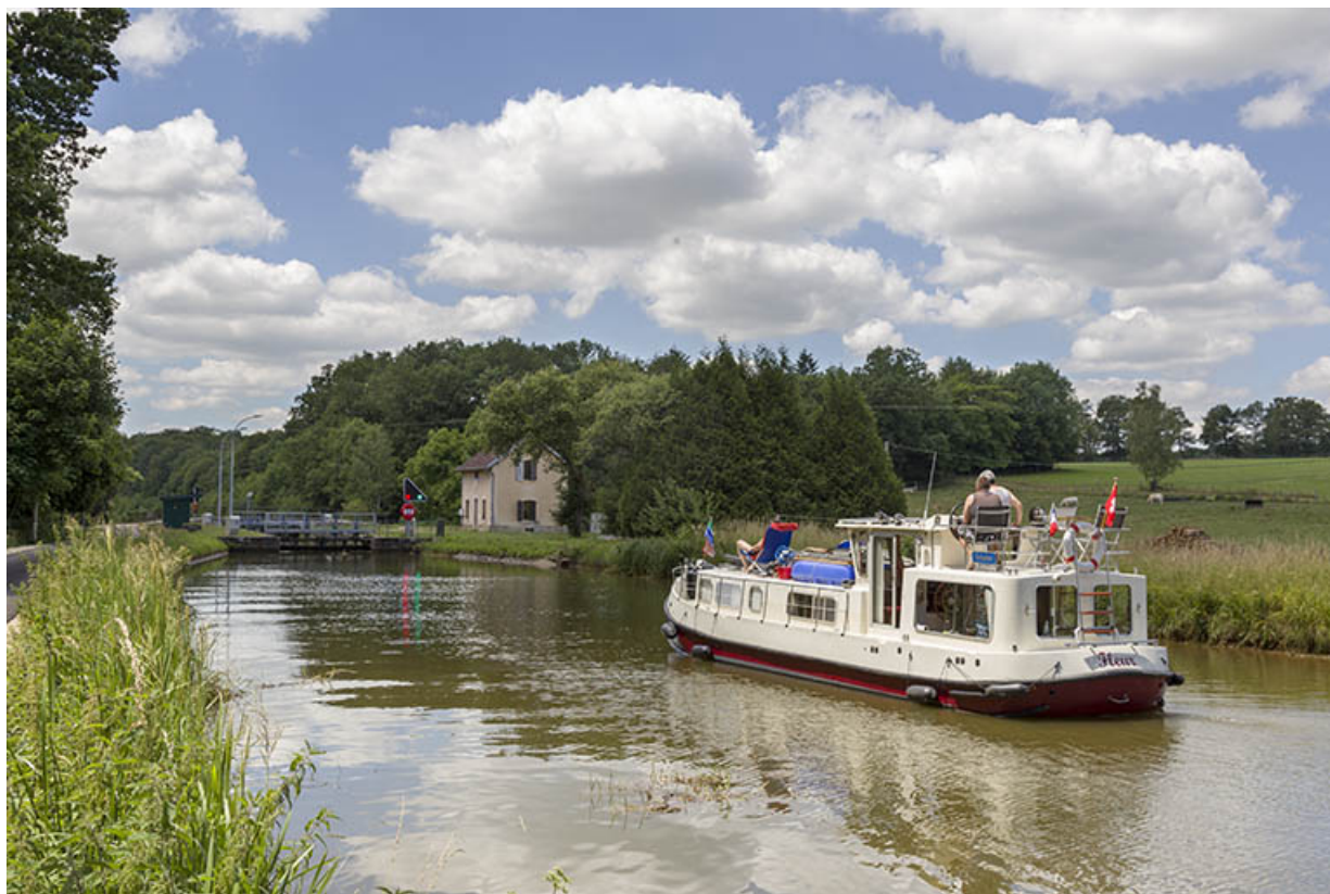
Vue d'ensemble depuis l'amont.