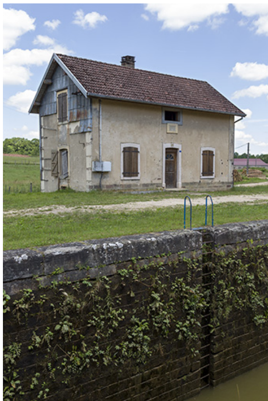
La maison d'éclusier, depuis l'écluse.