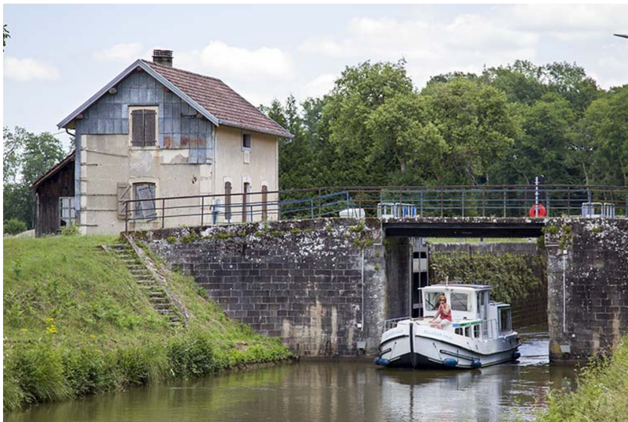
L'écluse, depuis l'aval.