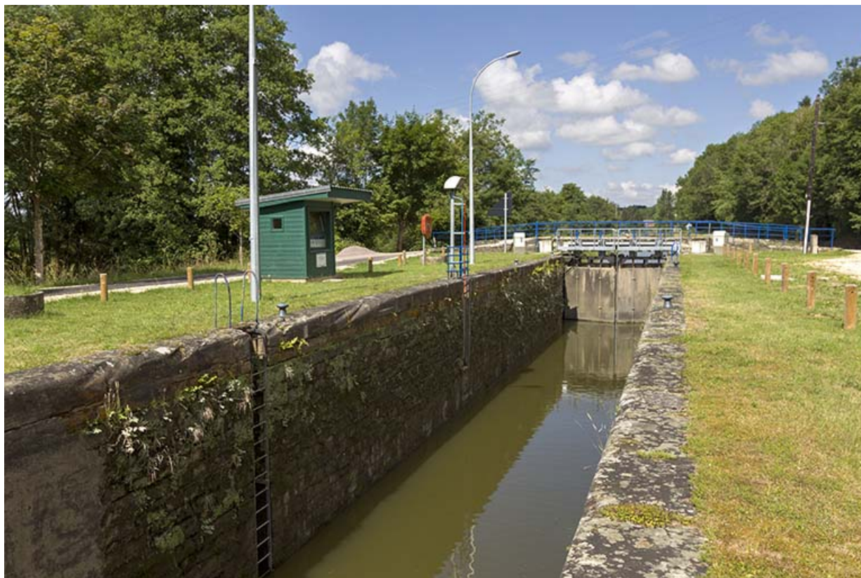
L'écluse et son poste de commande.