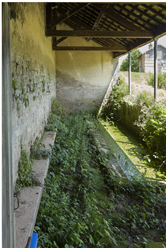
Intérieur du lavoir.