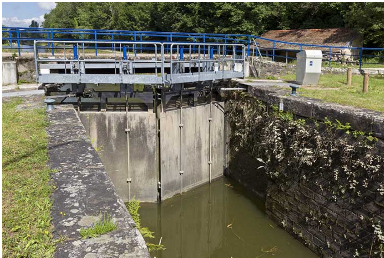
Les portes de l'écluse, busquées vers l'amont. 70, Selles