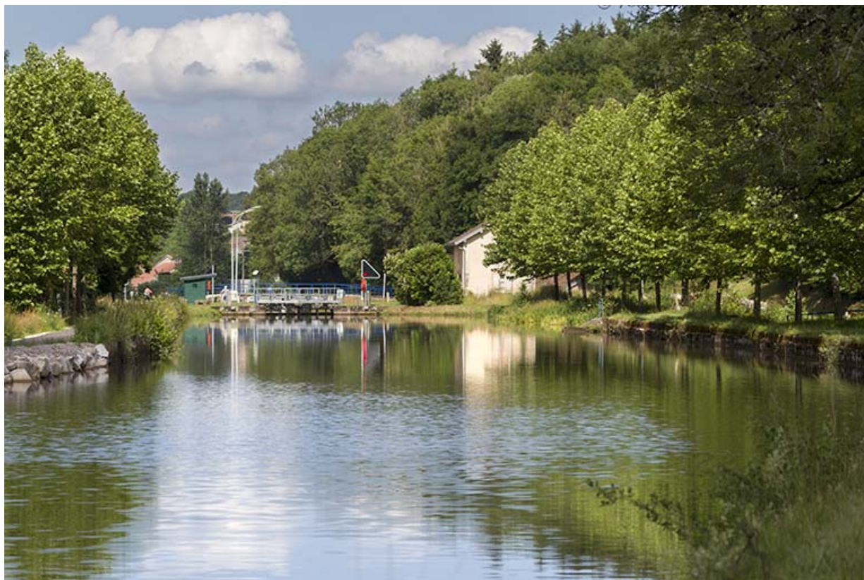
Vue d'ensemble depuis l'amont.