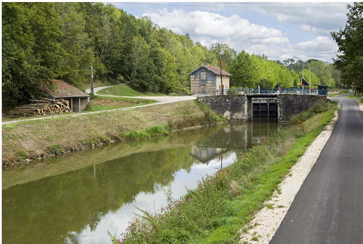
Vue d'ensemble depuis l'aval.