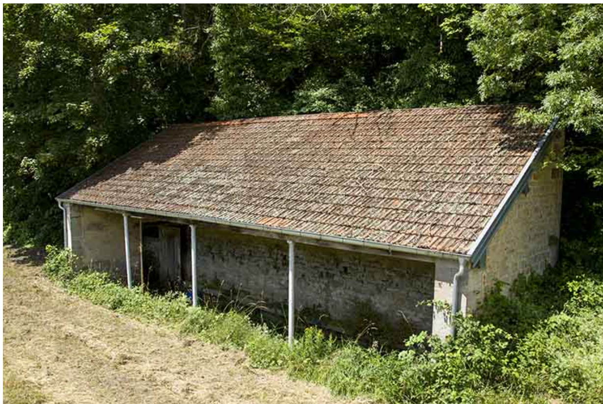
Lavoir proche du site d'écluse.