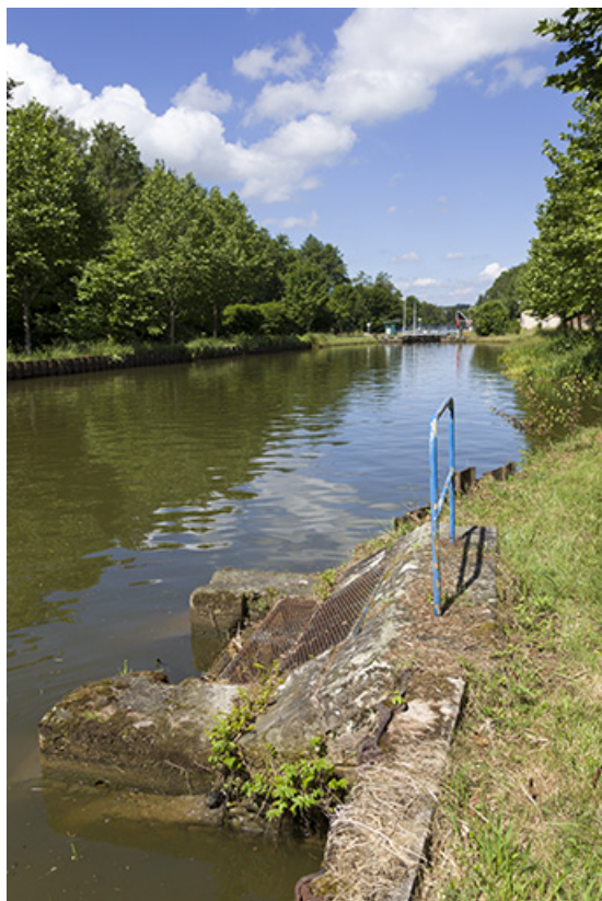
Déversoir. 70, Selles