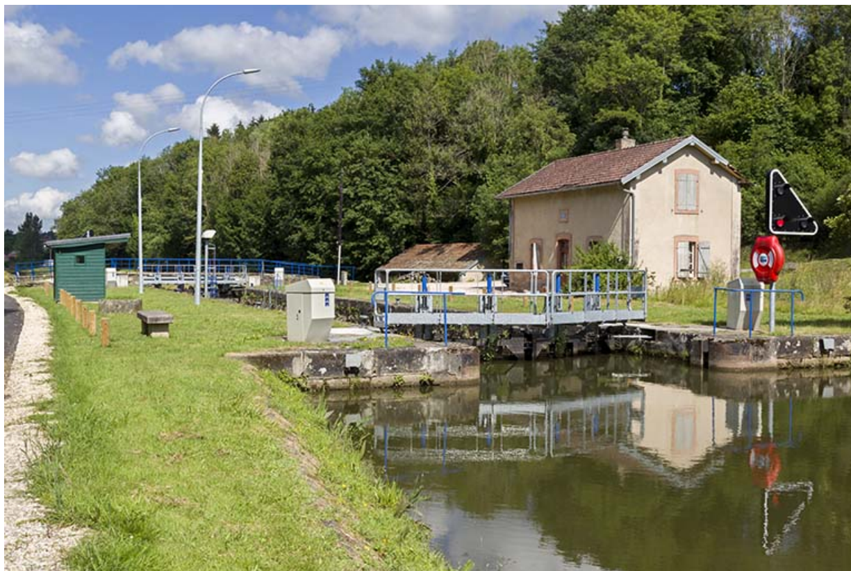
Le site d'écluse, depuis l'amont.