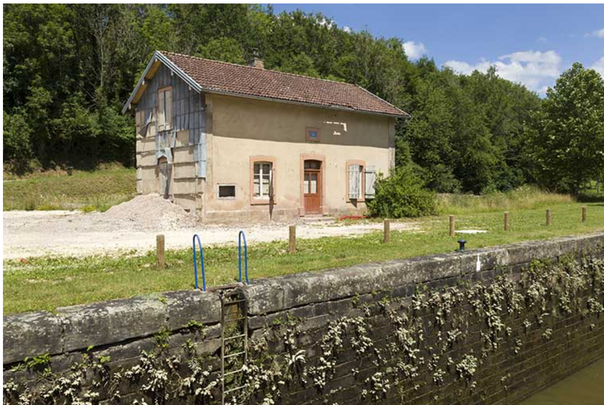
La maison d'éclusier, depuis l'écluse.