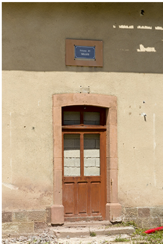
Plaque d'identification de l'écluse et la porte d'entrée de la maison. 70, Selles