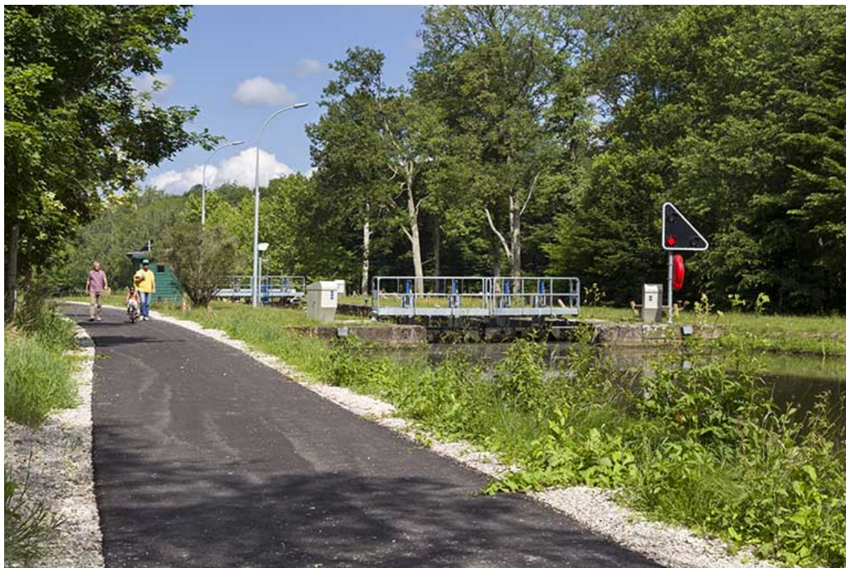
Vue d'ensemble depuis l'ancien chemin de halage. 70, Selles