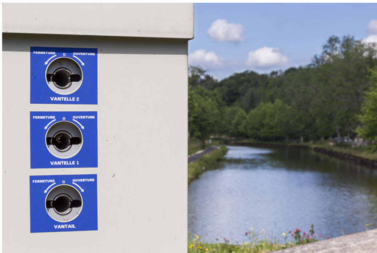
Commandes pour l'ouverture et la fermeture du vantail et des vantelles.