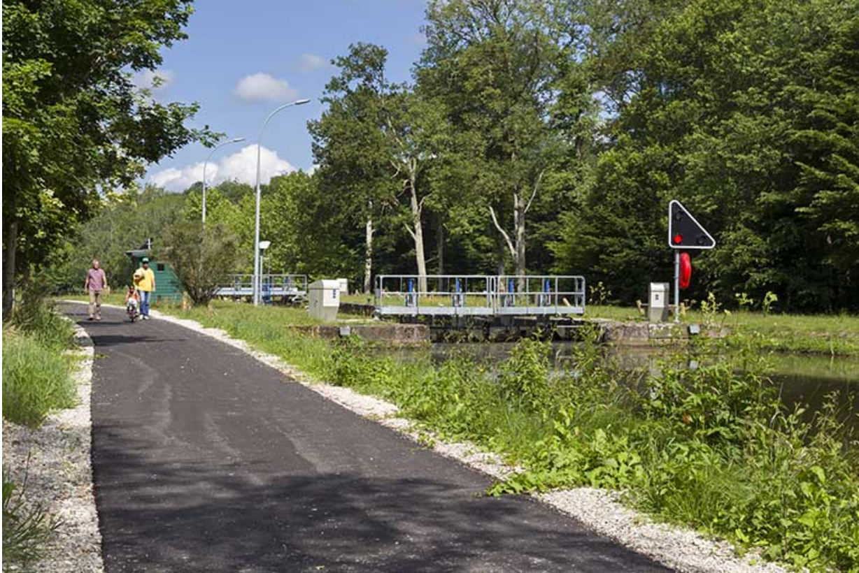
Vue d'ensemble depuis l'ancien chemin de halage.