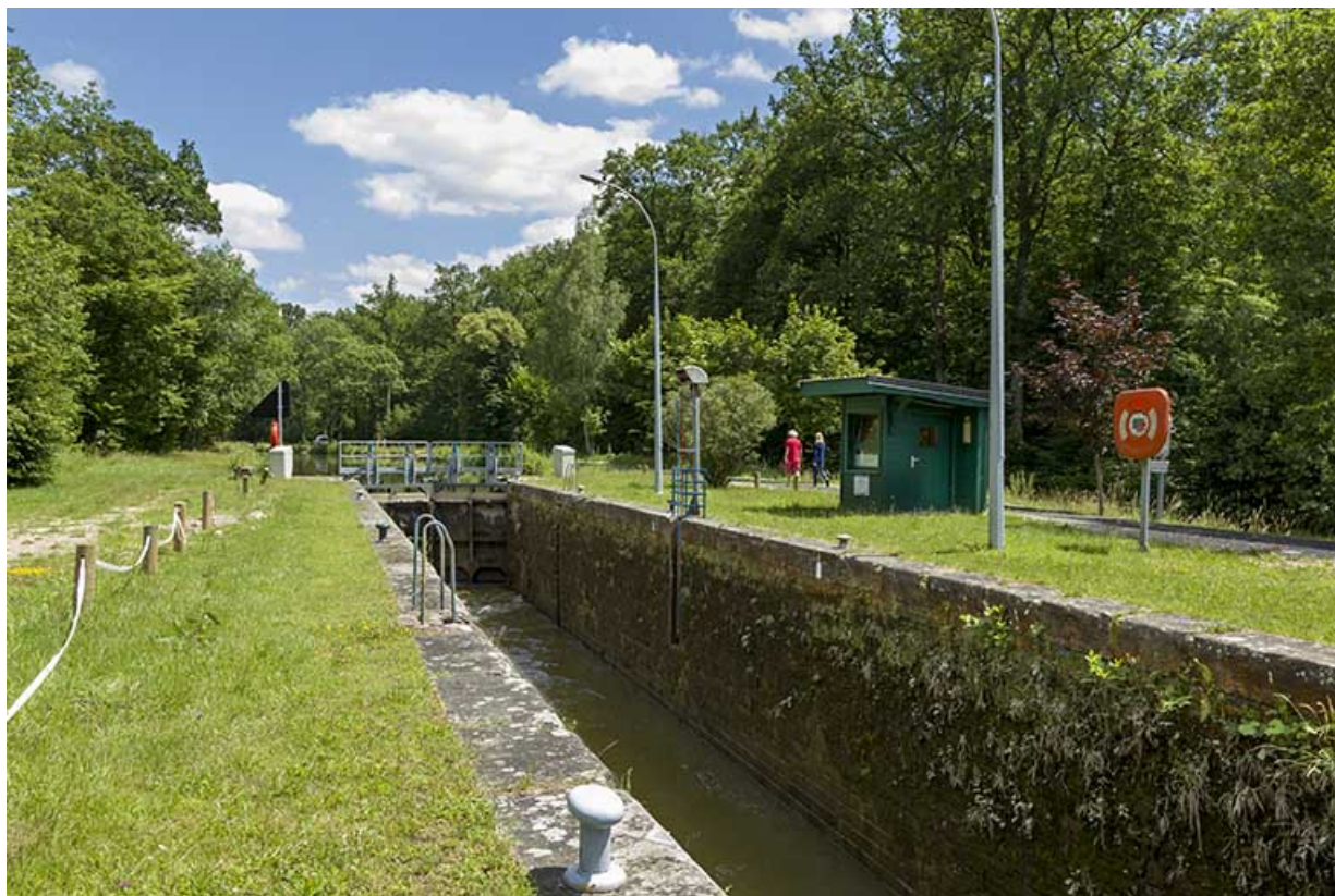
L'écluse et son sas.