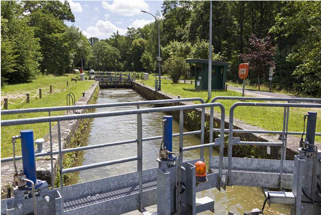
Ecluse n°40, Selles (70).