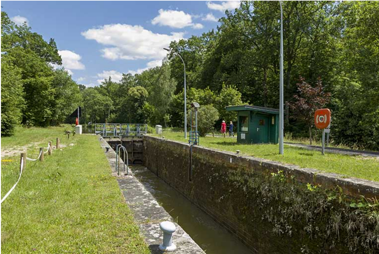
L'écluse et son sas.