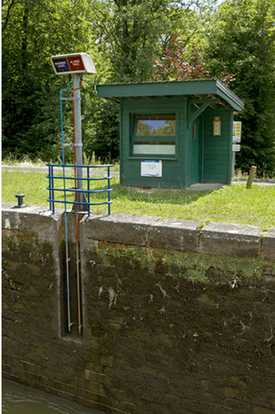
Le poste de commande.