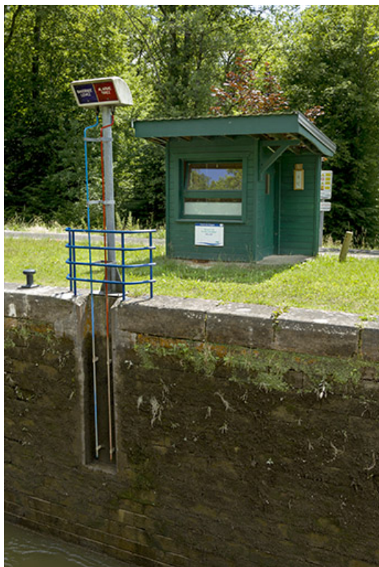
Le poste de commande.