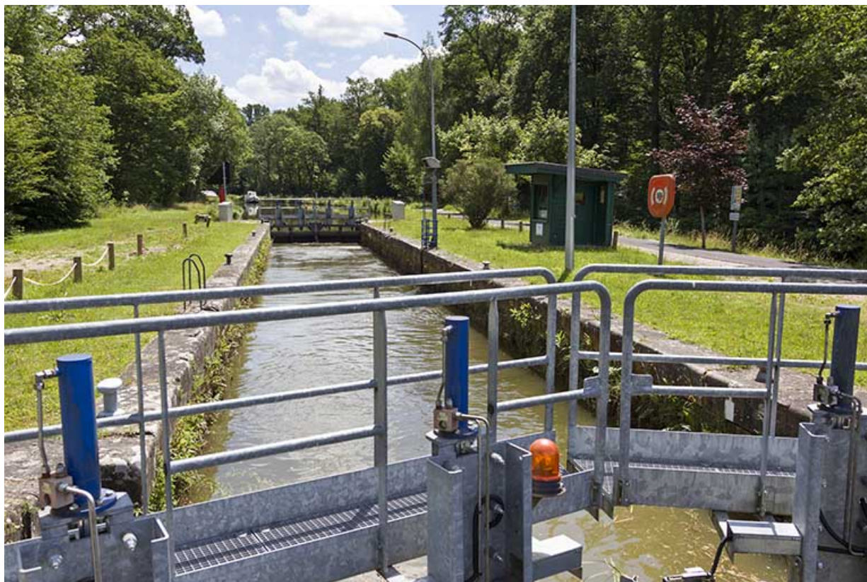
Ecluse n°40, Selles (70). 70, Selles