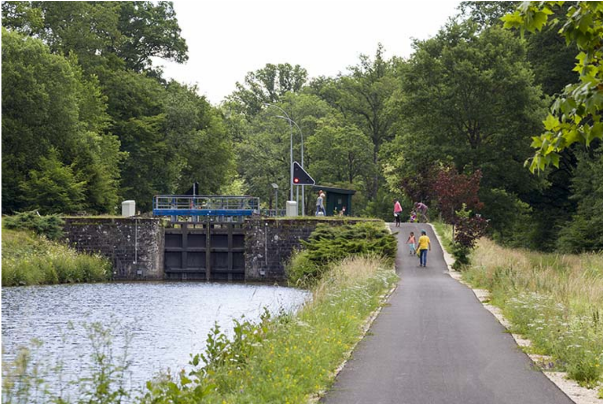
Vue d'ensemble depuis l'aval.