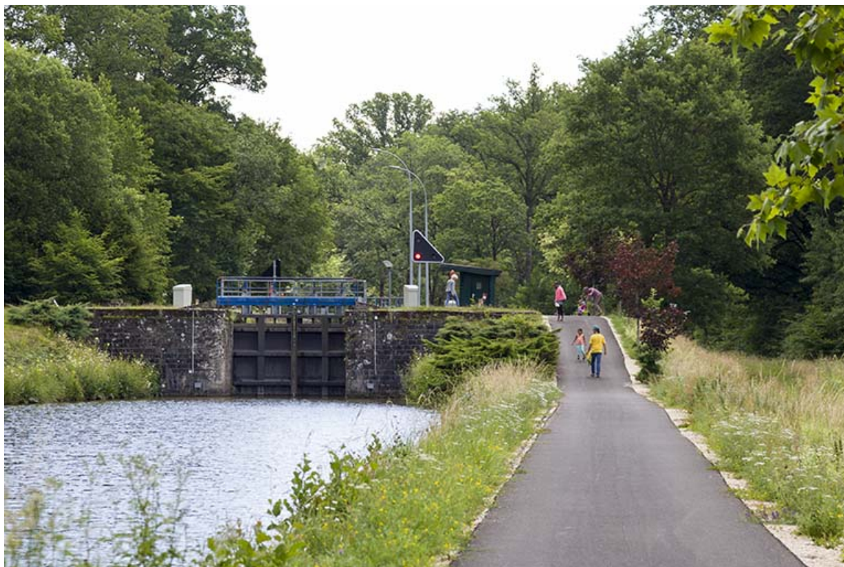
Vue d'ensemble depuis l'aval.