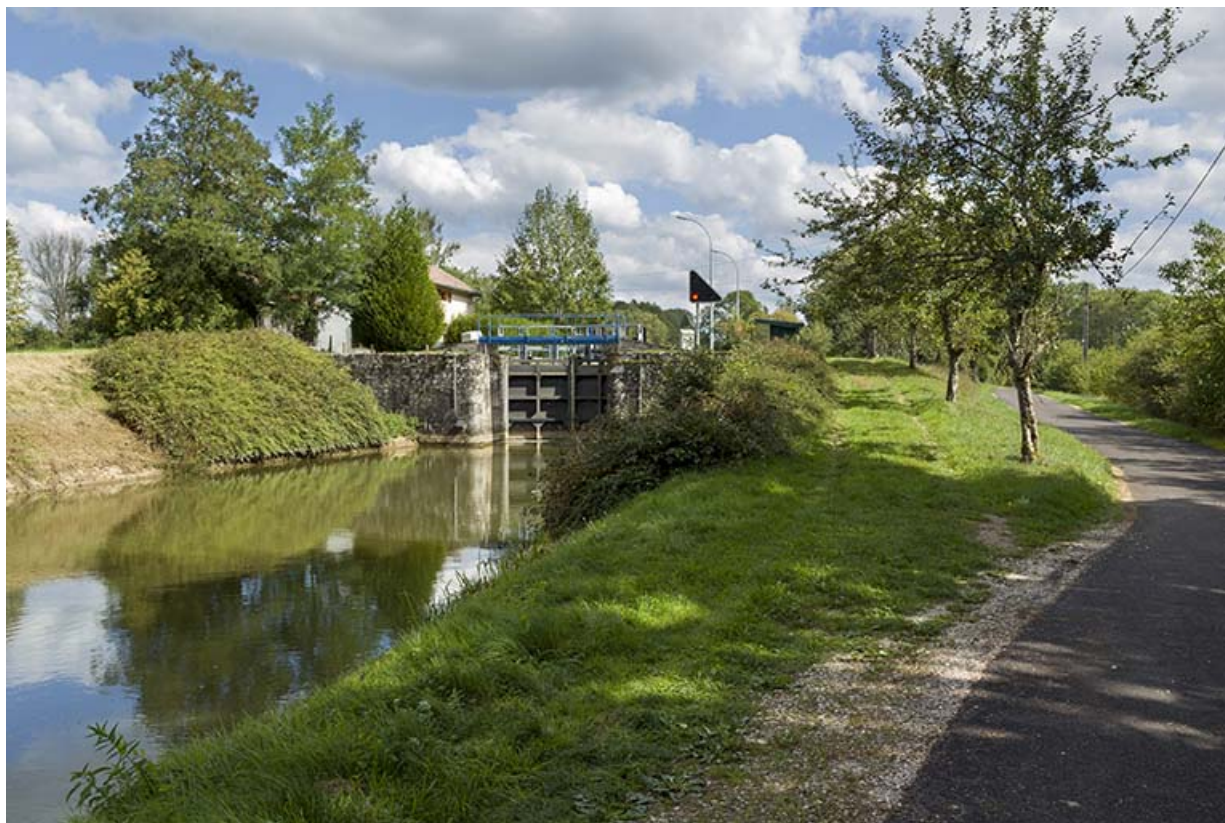
Vue d'ensemble depuis l'aval avec l'ancien chemin de halage transformé en voie cyclable.

70, Pont-du-Bois route départementale 150