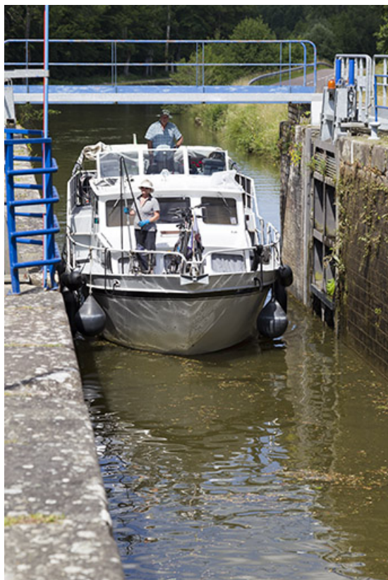
Bateau passant l'écluse par l'aval.

70, Pont-du-Bois route départementale 150