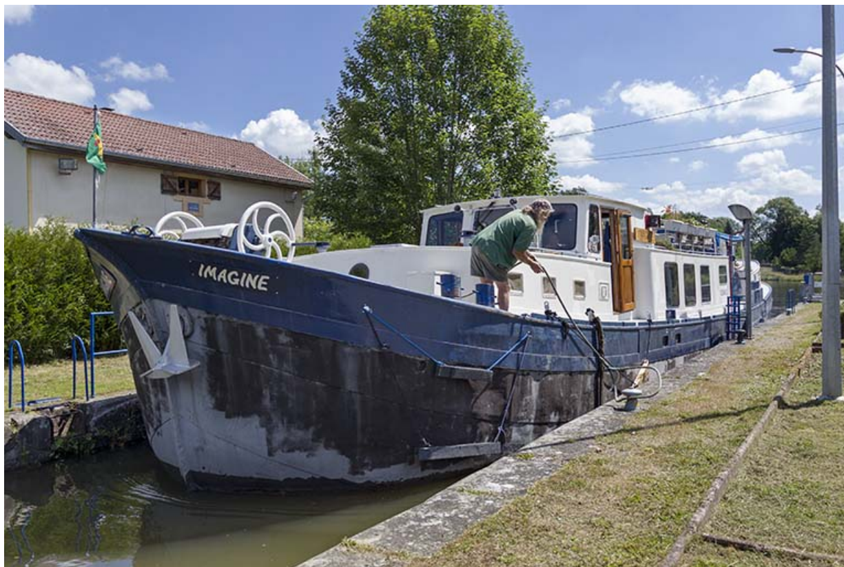
Bateau en train de s'amarrer sur une bitte de l'écluse.

70, Pont-du-Bois route départementale 150