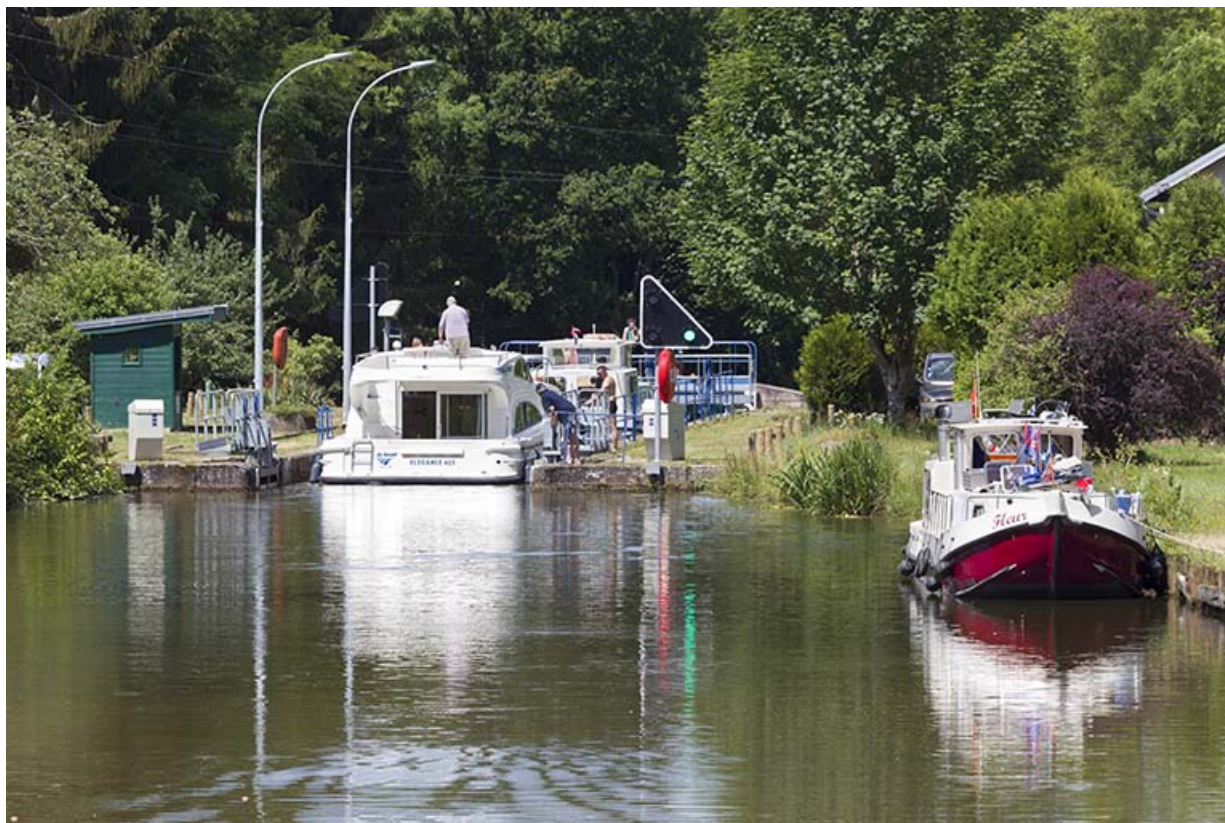
Vue d'ensemble du site d'écluse depuis l'amont avec la gare d'eau au premier plan.

70, Pont-du-Bois route départementale 150